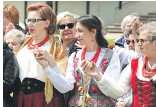
Amazonki są zawsze razem.