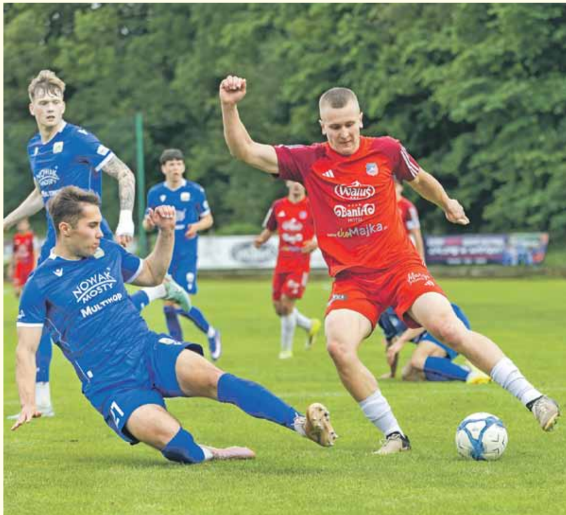
Watra uległa na swoim boisku Glinikowi Gorlice.