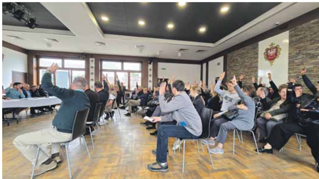
Na zebraniu w Czarnym Dunajcu 70 uprawnionych głosowało przeciwko utworzeniu spółki, za było tylko dwóch.

- Musimy dbać o pewne sprawy i nie możemy ich zaniedbać. Chodzi o to, aby po 200 latach istnienia wspólnoty nikt nie zarzucił nam, że czegoś nie dopilnowaliśmy. Wiele wspólnot ma już założone księgi wieczyste. Nowelizacja przepisów z 2016 roku została przygotowana właśnie po to, aby umożliwić wspólnotom wpis do ksiąg wieczystych. W tej sprawie musimy przeprowadzić dalsze konsultacje.