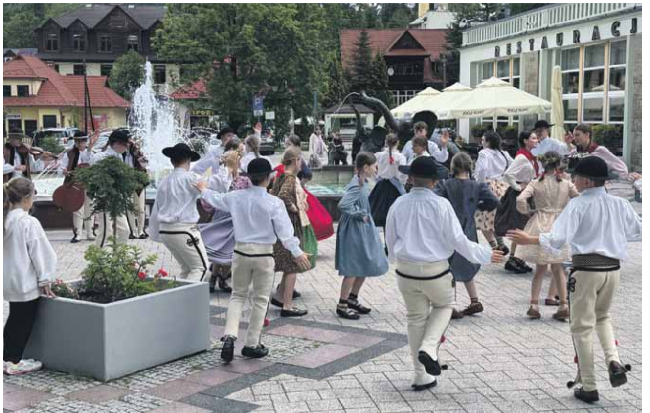
Barwny, festiwalowy korowód.

Niedzielną odsłoną Festiwalu miała podobny przebieg. O godz. 13.30 zespoły przeszły do amfiteatru w uroczystym korowodzie. Na scenie wystąpili: Mali Białanie z Białki Tatrzańskiej („Śmigurzt”), Pnioki z Sadku-Kostrzy („Przed pró-