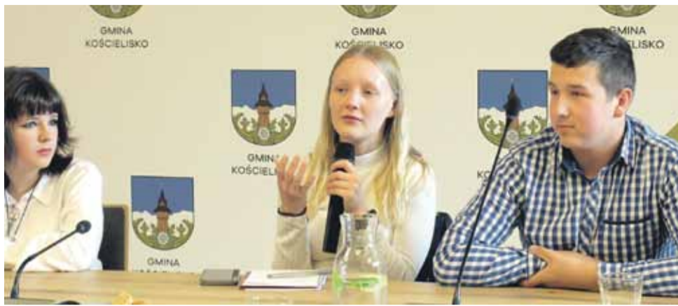
Młodzież w Kościelisku chce aktywnie walczyć z hejtem i przemocą rówieśniczą

Podczas spotkania przedstawiono także propozycje działań wypracowanych przez Młodzieżową Radę Gminy Kościelisko. Obejmują one kampanie infor-