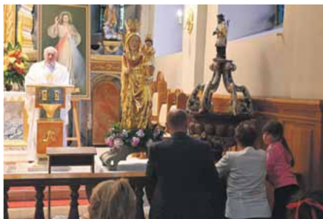
Do kościoła św. Katarzyny przywieziono kopię figurę Matki Boskiej Ludźmierskiej.