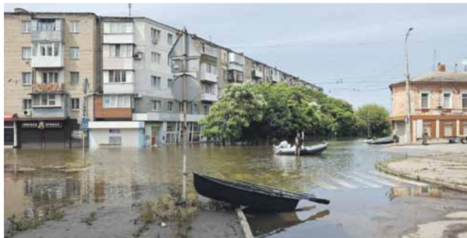
Cherson, czerwiec 2023, po wybuchu tamy Kachowskiej Elektrowni Wodnej.

Większość cywilnych stacji paliw na lewym brzegu Dniepru jest zamknięta lub działa w ograniczonym zakresie. Paliwo wydawane jest głównie na podstawie kart paliwowych, specjalnych kontraktów lub kuponów. Pierwszeństwo mają rosyjskie jednostki wojskowe, służby bezpieczeństwa i administracja okupacyjna.