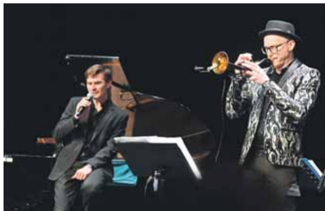
Artyści zabrali publiczność w cudowną podróż muzyczną.

W sobotę 13 czerwca w stolicy Podhala w Miejskim Centrum Kultury odbywała się 4 edycja Young Jazz Festival – Od Nowego Orleanu do Nowego Targu. Po przesłuchaniach konkursowych i koncercie laureatów przyszedł czas na specjalny występ z absolutną czołówką polskiego jazzu!