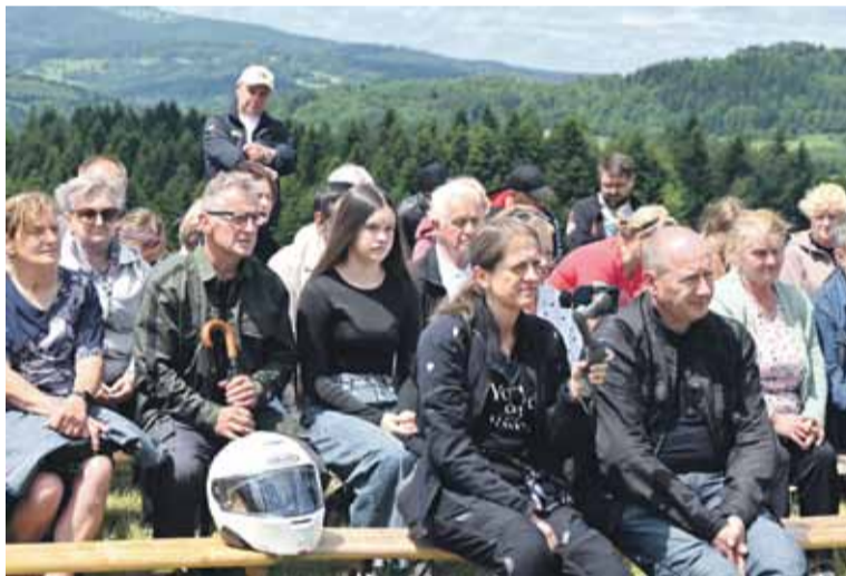
W spotkaniu brali udział, m.in. motocykliści.