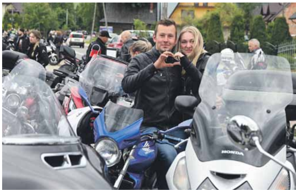
Zakochana para nie tylko w sobie, ale i w motocyklach.