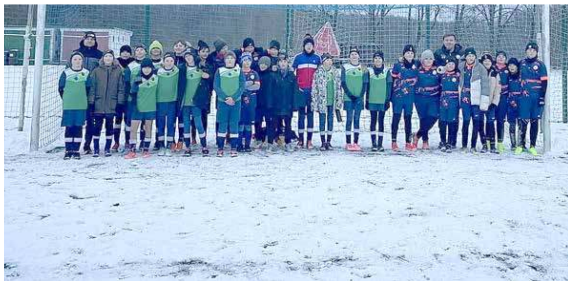
Drużyna AMP miała okazję zagrać pierwszy mecz w 2025 roku