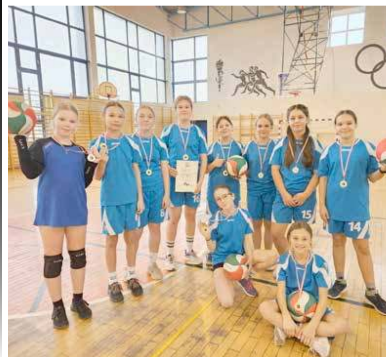
Drużyna już medalami i dyplomem