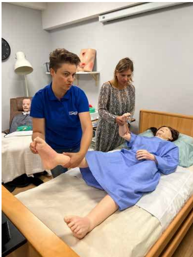
Program dopasowany jest do potrzeb uczestników szkoleń