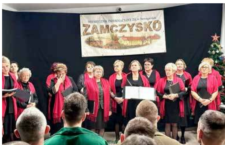
Koncert odbył się 3 stycznia br.

Zarząd Koła Miejsko - Gminnego nr 36 w Nowogardzie zaprasza członków Koła