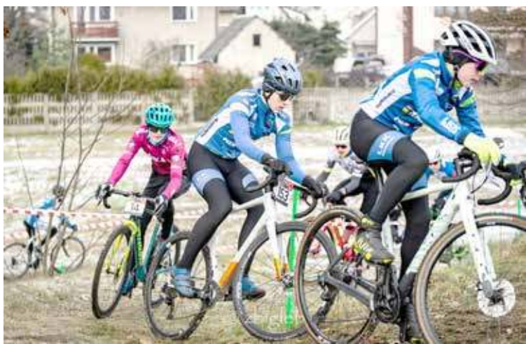
Reprezentanci LKKS Chrabąszcze chwilę po starcie zawodów.