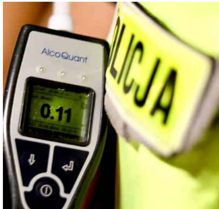
Nie raz potrzebny był alkomat

- Podczas realizacji zadań policjanci zatrzymali prawo jazdy 10 kierowcom, oraz ujawnili 5 kierujących nie posiadających