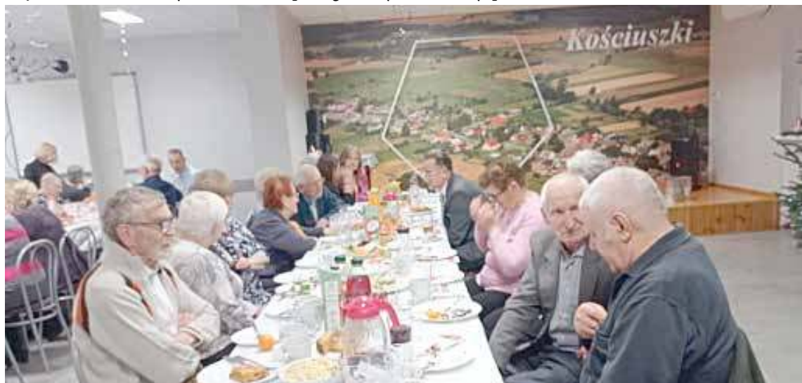
Do takiego spotkania wigilijnego doszło w Kościuszkach