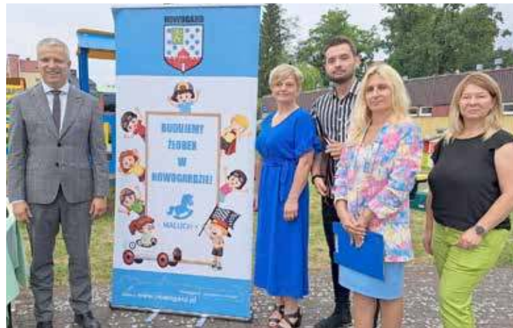
7 lipca 2023 - spotkanie prezentujące koncepcję powstania nowego żłobka

środki pozyskane z programu Maluch+ wyniosły 5 614 912,29 zł, przy wkładzie własnym 470 399,76 zł. Całe zadanie kosztować ma łącznie 6 085 312,05 zł.