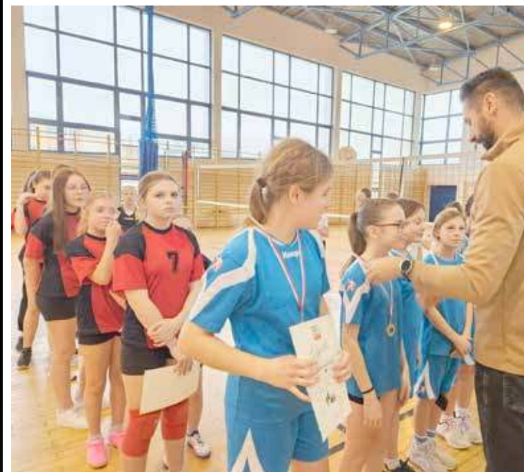
Dekoracja drużyn uczestniczących w zawodach