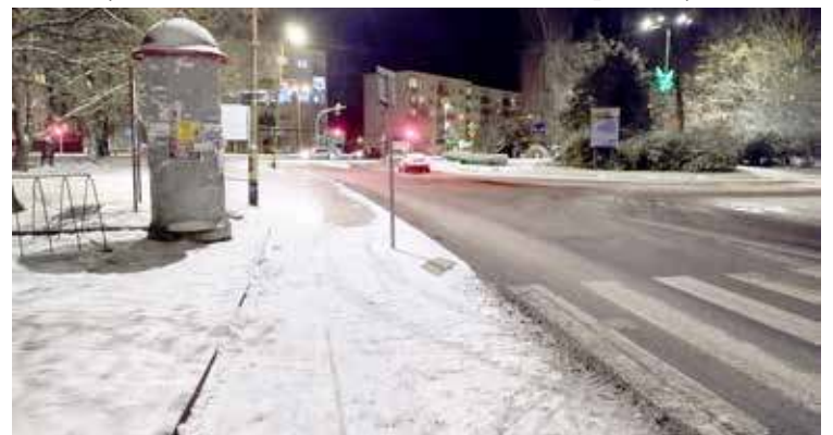
Na zdjęciu ulica Kościuszki

co nie raz, o czym informują Czytelnicy DN, było powodem upadku na zmarzniętą nawierzchnię chodnika. Zima zeszła dopiero w poniedziałek, 6 stycznia, gdy to zauważalne były dodatnie temperatury. psa