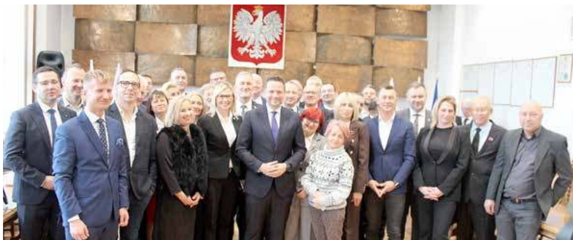
W spotkaniu zorganizowanym 8 stycznia z prezydentem Warszawy Rafałem Trzaskowskim w UM Nowogard wzięło udział ok. 40 osób, w tym burmistrzów i wójtów z czterech powiatów. Wśród tematów samorządowych znalazły się budownictwo mieszkaniowe, wyłączenie transportowe, możliwość pozyskiwania środków w ramach KPO, czy nawet te związane z funduszem sołectkim jak i przebudową infrastruktury sportowej.