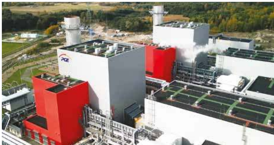
Elektrownia gazowa PGE Gryfino Dolna Odra

Nowe bloki gazowe cechują się znacznie wyższą sprawnością energetyczną w porównaniu do elektrowni węglowych. Bloki gazowe mają znacznie krótszy czas uruchamiania na tle elektrowni węglowych. Szybko reagują na zmiany w zapotrzebo-