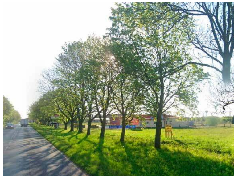
Sklep powstanie ma przy wjeździe do miasta przy ul. 3 Maja, tuż obok Armatury

Chcesz dać ogłoszenie - reklamę w gazecie