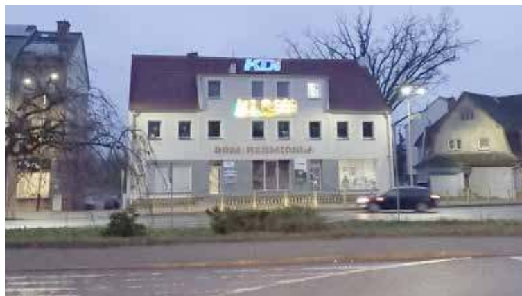
Za realizację zadania odpowiadać będą pracownicy nowogardzkiej firmy KDI

Dalsze ruchy w tej sprawie wykonano w mijającym tygodniu. Jak podano w czwartek, tego samego dnia podpisano umowę z firmą KDI Sp. z o.o. na wykonanie żłobka na kwotę 4 736 335,17 zł. Już po sporządzeniu aneksu