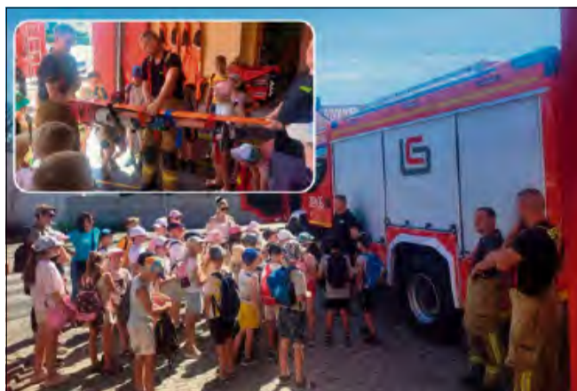
Dzieci z ogromnym zainteresowaniem słuchały i zadawały pytania strażakom.

Dzieci miały możliwość samodzielnego użycia prądownicy, co pozwoliło im na praktyczne sprawdzenie siły