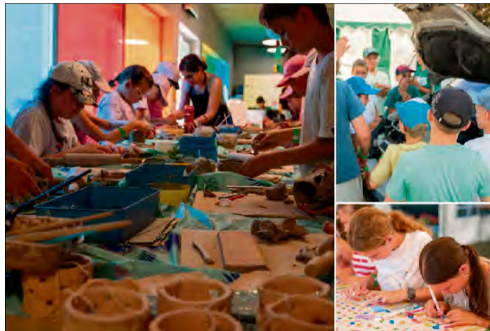
W Raszowej ruszyła kolejna edycja Letniego Laboratorium Talentów.

29 czerwca na Placu Wiejskim w Raszowej wystartowała czwarta edycja Letniego Laboratorium Talentów. Wydarzenie gromadzi absolwentów klas 1-6 szkoły podstawowej, którzy do 3 lipca będą uczestniczyć w warsztatach rozwijających ich umiejętności i pasje. Organizatorem projektu jest Stowarzyszenie Pro Liberis Silesiae.