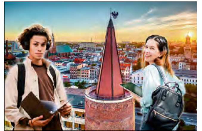
W zestawieniu miast akademickich ze względu na warunki studiowania i koszty życia stolica Opole zajęło 1. miejsce.

Przykładowo osobie, która zgromadziła na koncie w ZUS 450 tys. zł, po waloryzacji jej konto wzrosło o ponad 44,1 tys. zł, czyli do ponad 494,1