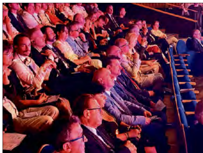
Publiczność nagrodziła artystów gromkimi brawami, doceniając zarówno poziom artystyczny, jak i wyjątkowy charakter wydarzenia.