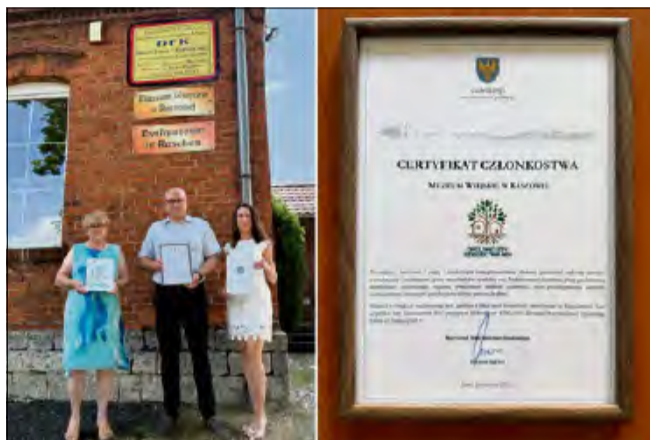
Muzeum Wiejskie w Raszowej zostało przyjęte do Sieci „Opolskie Izby Dziedzictwa Wsi”, otrzymując Certyfikat Członkostwa.

Sieć powołana przez Samorząd Województwa Opolskiego, skupia izby pamięci, izby regionalne oraz muzea społeczne. Jej celem jest inte-