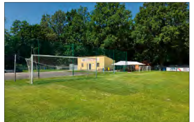
Murawy na stadionach w Ozimku, Krasiejowie, Szczedrzyku i Grodźcu przeszły kompleksową renowację.

Zakres prac był szeroki i obejmował najważniejsze zabiegi pielęgnacyjne stosowane na profesjonalnych obiektach sportowych. Wykonano wertykulację, która pozwala usunąć warstwę filcu i pobudzić trawę do wzrostu, a także aerację bolcową poprawiającą napowietrzenie gleby. Murawy zostały również wypiąskowa-