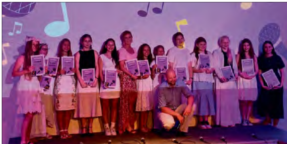
Młode talenty wypełniły scenę ozimskiego domu kultury.

S ala widowiskowa Domu Kultury w Ozimku wypełniła się muzyką, emocjami i gromkimi brawami. Koncert „Power of Sound” był uroczystym zwieńczeniem sezonu artystycznego sekcji wokalne i jednocześnie jednym z najważniejszych wydarzeń muzycznych kończących rok zajęć.