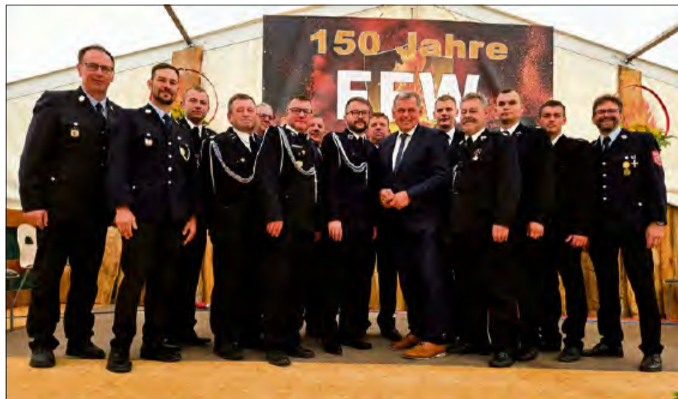
Z okazji 150-lecia straży pożarnej w Müdesheim delegacja gminy Łubniano odwiedziła partnerską gminę Arnstein w Niemczech.

D elegacja gminy Łubniano uczestniczyła w obchodach 150-lecia straży pożarnej w Müdesheim, które są częścią miasta partnerskiego Stadt Arnstein. Wizyta obejmowała elementy oficjalne, kulturalne oraz rozmowy o przyszłej współpracy szkół.