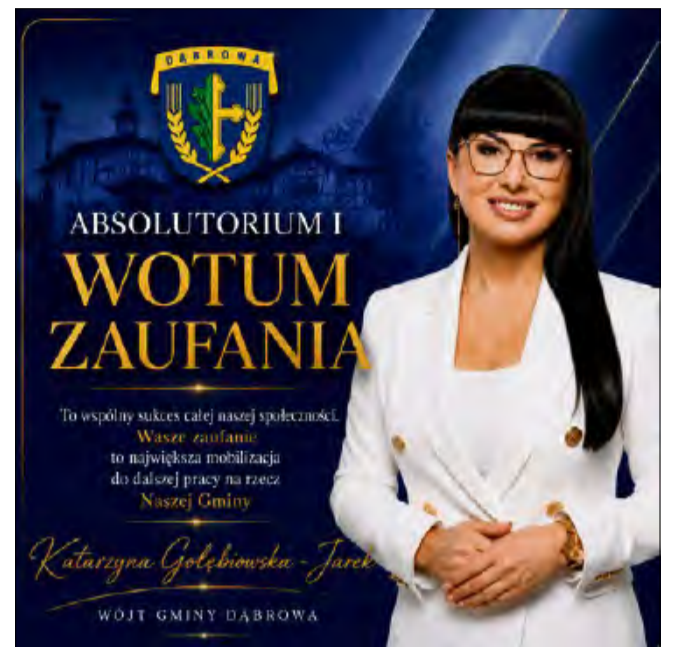
Na inwestycje przeznaczono około 20,2 mln zł.

Jednym z najważniejszych wydarzeń roku było oddanie do użytkowania nowego Publicznego Przedszkola w Dąbrowie „Zielona Kraina”. Wartość inwestycji wyniosła ponad 8,5 mln zł. Równie istotnym przedsięwzięciem była kompleksowa przebudowa i adaptacja za- bytkowego dworku w Chróscinie na Centrum Aktywności Lokalnej. Całkowity