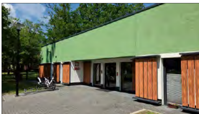
Przebudowa i doposażenie placu zabaw zamknie się w kwocie 204 tys. zł.

Równolegle realizowane są działania, które obejmują także wnętrze żłobka. Samorząd pozyskał dofinansowanie na