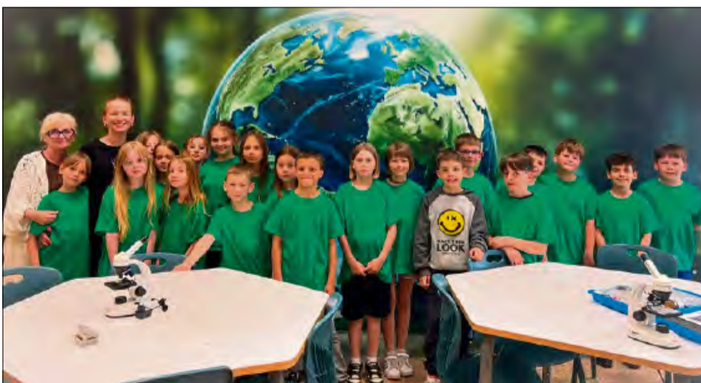
Ekoklasa w Bładczu – nowa pracownia ekologiczna otwarta symbolicznie została 3 czerwca.

Publicznej Szkole Podstawowej im. ks. Jana Bosko w Luboszytach, oddział w Bładczu, uroczyste otwarto nowoczesną pracownię ekologiczną.