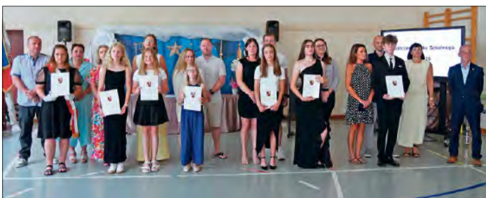
Przyznano łącznie 112 stypendiów za wyniki w nauce oraz osiągnięcia sportowe.

Szczególnie wyjątkowy dzień przeżywali uczniowie klas ósmych. Dla nich zakończenie roku szkolnego oznaczało jednocześnie pożegnanie z murami szkół podstawowych i zamknięcie ważnego etapu edukacji. Podczas uroczystości nie zabrakło wrzusań, podziękowań dla