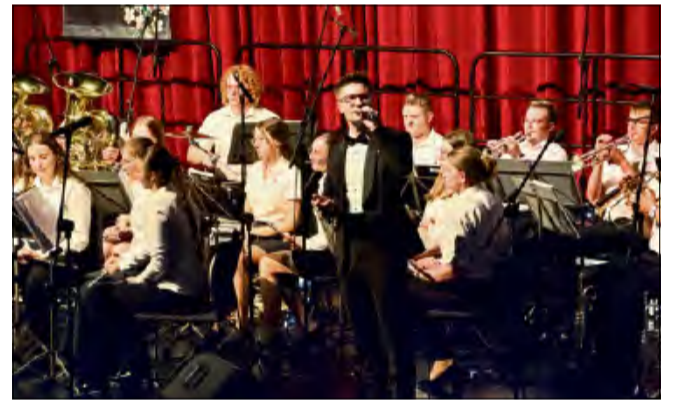
Muzyka stała się językiem porozumienia – koncert połączył tradycję, kulturę i artystów z całym regionu.

Tworzy przestrzeń do spotkania ludzi tam, gdzie czasem brakuje słów. Traktat z 1991 roku był obietnicą pojednania, wzajemnego szacunku i wspólnej europejskiej przyszłości. To właśnie mniejszość niemiecka w Polsce jest jednym z najważniejszych budowniczych tych mostów – podkreśliła.