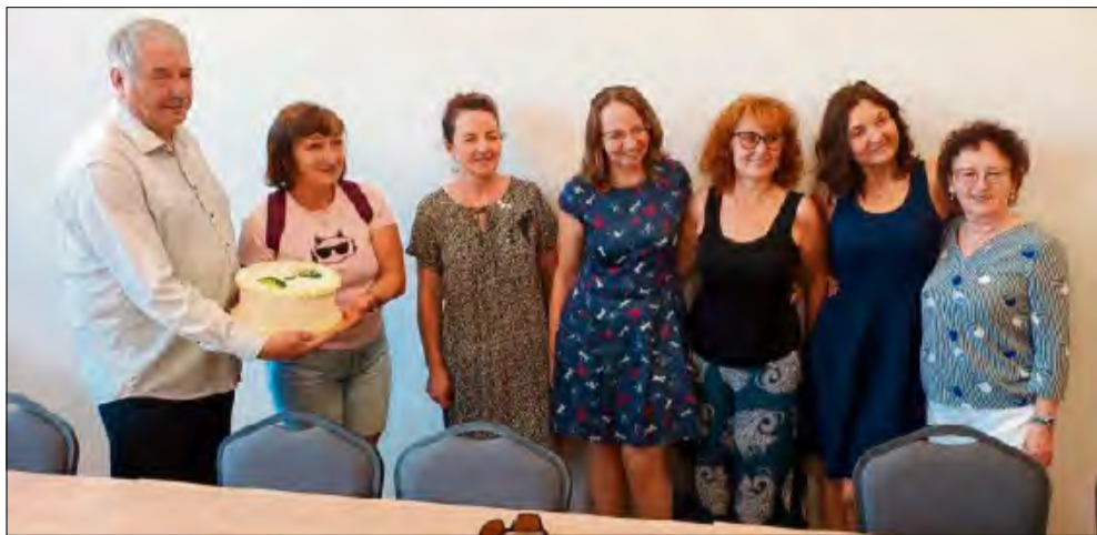
Miłym akcentem spotkania był okolicznościowy tort przygotowany przez partnerów z Czech, który symbolicznie zwińczył tę wyjątkową uroczystość.

W r a m a c h wieloletniej współpracy partnerskiej odbyło się kolejne spotkanie przedstawicieli gminy Chrzastowice i czeskiej gminy Zátor. Tym razem uczestnicy mieli okazję poznać historię oraz najciekawsze atrakcje Opola i okolic, a wspólne zwiedzanie stało się okazją do umacniania międzynarodowych więzi.