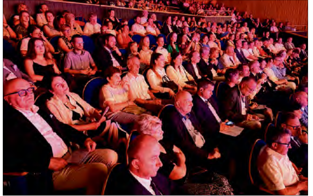
Jubileuszowy koncert zgromadził liczną publiczność, która szczelnie wypełniła salę Teatru im. Jana Kochanowskiego w Opolu.

Polski i Niemiec, samorządowcy oraz reprezentanci organizacji mniejszości niemieckiej. Najważniejszymi bohaterami wieczoru byli jednak artyści – ponad 120 muzyków, wokalistów i chórzystów, którzy wspólnie stworzyli widowisko będące symbolem współpracy ponad granicami.