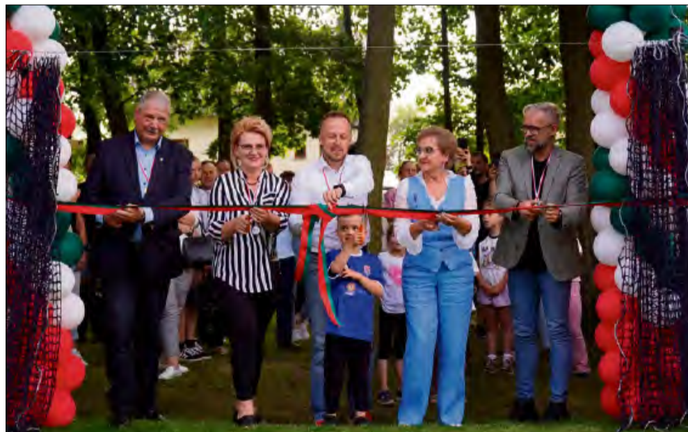
W uroczystym otwarciu, które miało miejsce w połowie czerwca, uczestniczyli rodzice, pracownicy przedszkola, wychowankowie oraz zaproszeni goście.

Przy Publicznym Przedszkolu „Akademia Sowy Mądrej Głowy” w Chrzastowicach powstało wyjątkowe miejsce - mini-Orlik. To boisko, które stało się rzeczywistością dzięki ogromnemu zaangażowaniu kadry przedszkola, dzieci, rodziców, organu prowadzącego oraz sponsorów.