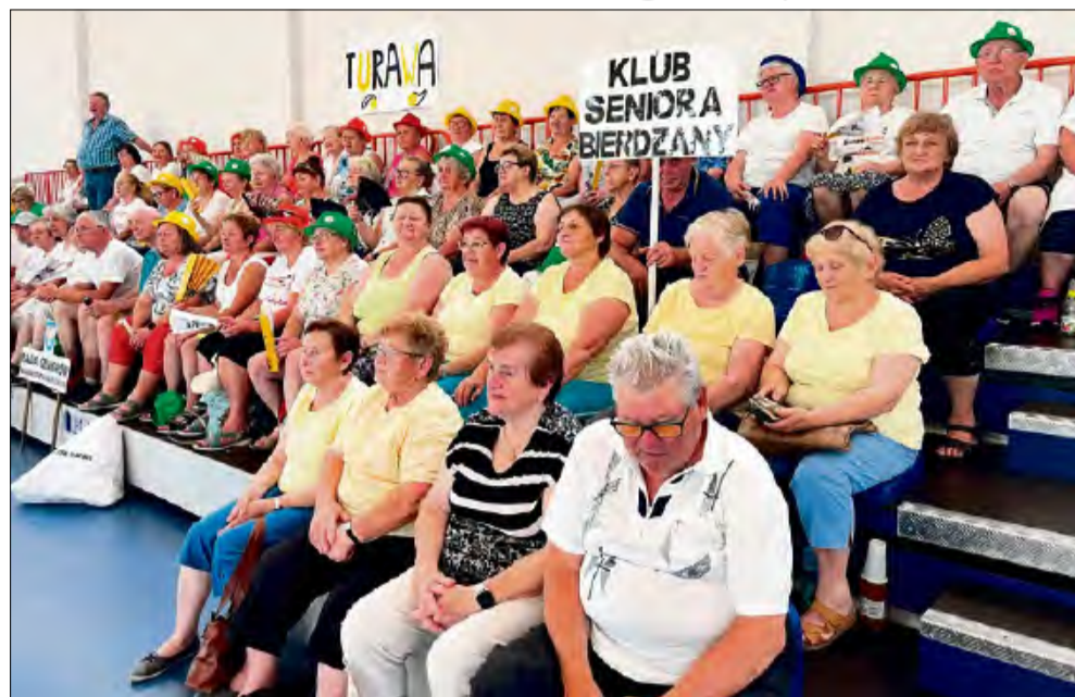
Chętnych do kibicowania nie brakowało.

W e wtorek 30 czerwca w Hali Sportowej w Turawie odbyły się zawody dla seniorów. W wydarzeniu udział wzięli zawodnicy z Turawy, Kotorza Wielkiego, Bierdzan, Węgiei i Osowca, a także goście z sąsiednich gmin.