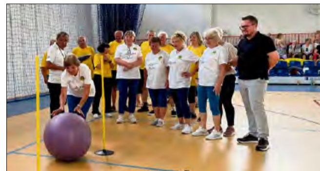
Na uczestników czekały różnorodne konkurencje sportowe oraz gry i zabawy integracyjne.

Wydarzenie zostało zorganizowane w ramach projektu