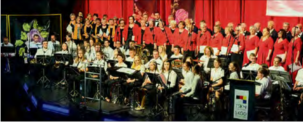
Ponad 120 muzyków, chórzystów i solistów wspólnie wystąpiło podczas jubileuszowego koncertu z okazji 35. rocznicy Traktatu Polsko-Niemieckiego.

P onad 120 artystów na jednej scenie, owacje na stojąco i mocne słowa o przyszłości polsko-niemieckich relacji. Jubileuszowy koncert z okazji 35. rocznicy Traktatu o dobrym sąsiedztwie pokazał, że dialog między narodami można budować nie tylko polityką, ale także kulturą.