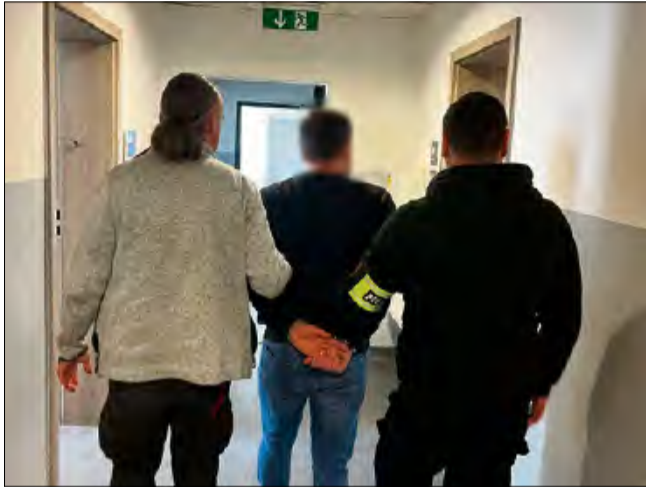
Zatrzymany znęcał się nad dziećmi i psem, grozi mu nawet 7,5 roku więzienia.

33-latek został zatrzymany po interwencji policjantów Komisariatu I Policji w Opolu. 15 czerwca na podstawie zgromadzonego materiału dowodowego przedstawiono mu