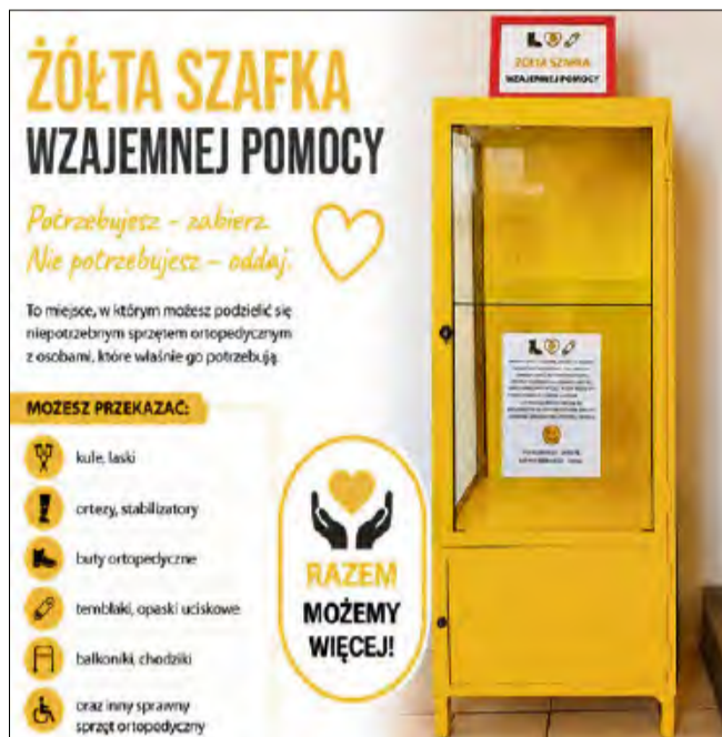
Żółta Szafka Wzajemnej Pomocy w SZOZ Niemodlin czeka na sprzęt ortopedyczny, który może pomóc kolejnym pacjentom.

Do kolejnej interwencji doszło o godzinie 18.50. Tym razem funkcjonariusze zatrzymali 29-letniego mieszkańca powiatu wieluńskiego, który również kierował łodzią. Badanie alkometrem w jego przypadku wykazało blisko promil