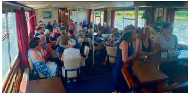
Rejs statkiem „Opolanin” po Odrze dostarczył niezapomnianych widoków i wrażeń.

pomiędzy mieszkańcami obu samorządów. Wspólne zwiedzanie i rozmowy pokazały, że język nie stanowi bariery, gdy łączy chęć poznawania i wzajemnego zrozumienia.