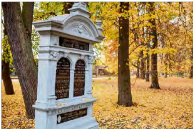
Renowacja zabytkowego cmentarza przy ul. Wrocławskiej trwa od roku.

Renowacja zabytkowego cmentarza przy ul. Wrocławskiej trwa od roku. Na co dzień nekropolią opiekuje się Zakład Komunalny, natomiast za realizację prac odpowiada Urząd Miasta