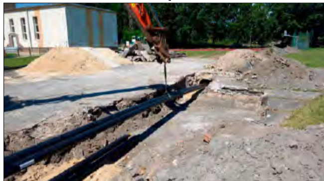
Nowa inwestycja w Ozimku ma poprawić sprawność miejskiej sieci ciepłowniczej.

Jak podkreśla inwestor, realizacja zadania pozwoli ograniczyć