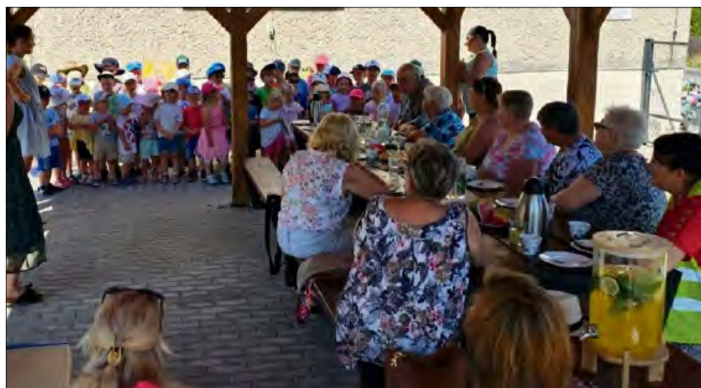
Seniorzy odwiedzili przedszkolaków w Kosorowicach.

K lub Senior+ z Tarnowa Opolskiego gościł w Przedszkolu Publicznym w Kosorowicach. Inicjatywa dyrekcji placówki zaowocowała integracją między najstarszymi a najmłodszymi mieszkańcami gminy.