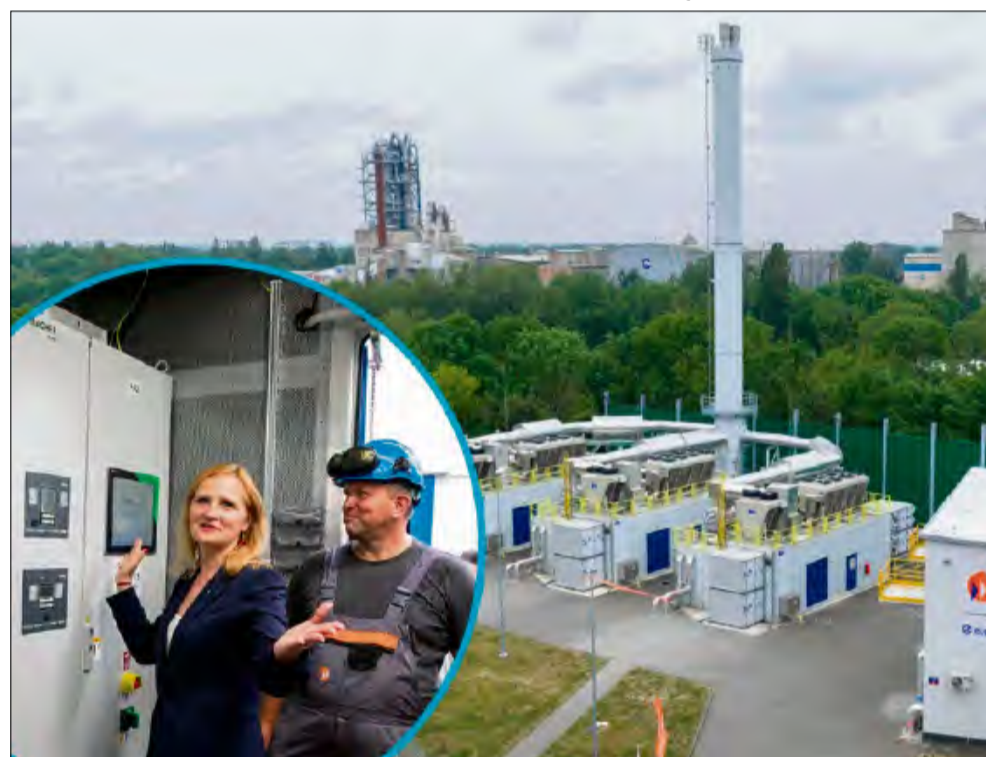
Emisja CO2 będzie znacznie mniejsza.

G rupa ECO zastępuje węgiel gazem w nowym układzie kogeneracyjnym i uruchamia drugi układ kogeneracyjny w Opolu. Emisja CO2 będzie mniejsza, a inwestycja warta jest blisko 70 mln złotych.