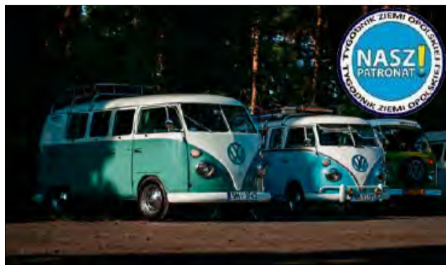
146 załóg spotkało się na III Zlocie Garbusa i Busa w Luboszycach.

Przez cały weekend panowały bardzo wysokie tem-