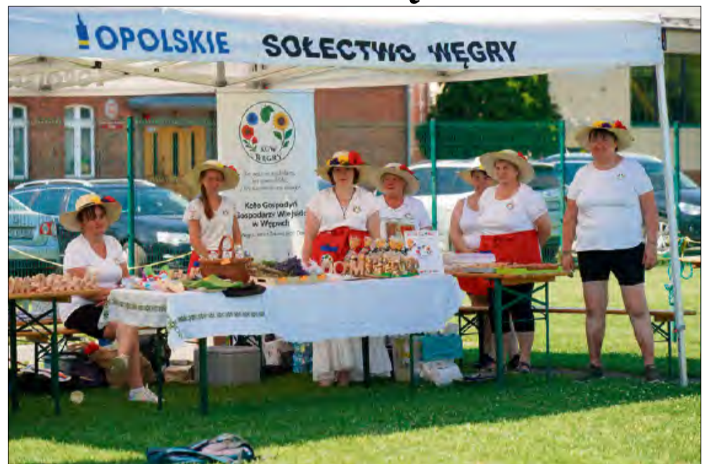
Powiat opolski podczas zawodów reprezentowało Koło Gospodyń Wiejskich w Węgrach.

Śmiech, doping i mnóstwo pozytywnych energii – tak wyglądała I Wojewódzka Olimpiada Kół Gospodyń Wiejskich, która w sobotę odbyła się w Zawadzie koło Opola. Dziesięć kół z całego województwa udowodniło, że rywalizacja może iść w parze z doskonałą zabawą.