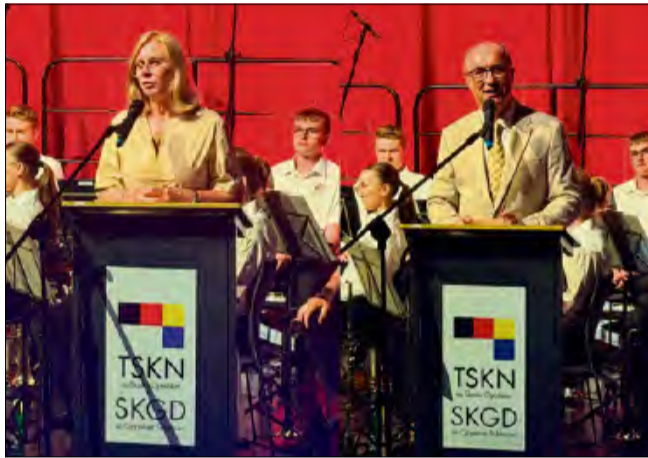
W jubileuszowym koncercie uczestniczyli m.in. Marszałek Sejmu Włodzimierz Czarzasty oraz wiceprzewodnicząca Bundestagu Andrea Lindholz, podkreślając znaczenie polsko-niemieckiego dialogu i współpracy.

żnej współpracy między Polską a Niemcami. W wydarzeniu uczestniczyli przedstawiciele władz