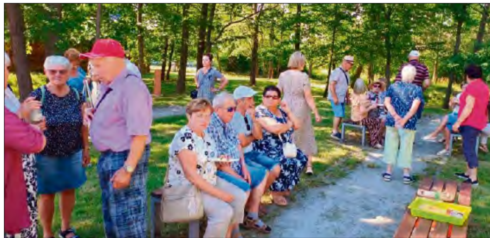
Spotkanie sprzyjało integracji międzynarodowej oraz wymianie doświadczeń pomiędzy mieszkańcami obu samorządów.

Szczególnym momentem było przypomnienie, że pod koniec ubiegłego roku minęło 10 lat od podpisania poro-