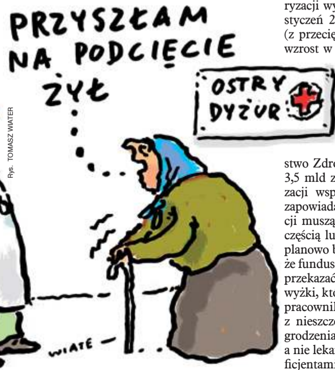
Rys. TOMASZ WALTER