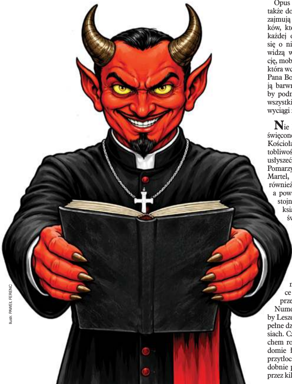
ILLUSTRACJA: PAVEL FERENC

ŁUKASZ PIOTROWICZ lupiotrowicz@gmail.com