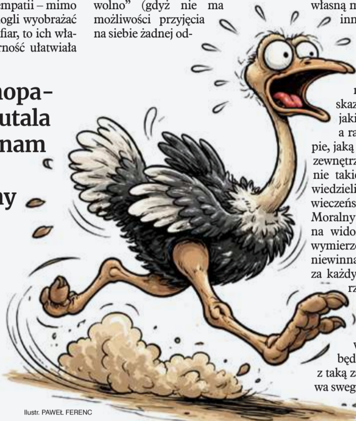
Ilustr. PAWEŁ FERENC

Niestety, wobec bandyckiego okrucieństwa stajemy bezzadani. Możemy łapać, skazywać, karać, lecz wszystko to jakimś sposobem ześlizguje się, a raczej spływa po twardej skorupie, jaką winowajca odgradzony jest od zewnętrznego świata. A jednak gdyby nie takie typy jak Sebastian Sz., nie wiedzielibyśmy, czym różni się człowieczeństwo od ludzkiej bydlękości. Moralny wstrząs, który przeżywamy na widok bezmyślnego okrucieństwa wymierzonego w istotę absolutnie niewinną i niezdolną do samoobrony, za każdym razem pokazuje nam dwie rzeczy: kruchość naszego życia moralnego i wszystkich jego ideałów oraz potężną przewagę, jaką istota wyposażona w sumienie ma nad kimś, kto będąc człowiekiem, używa pałki z taką zawziętością, jak ptaszysko używa swego dzioba.