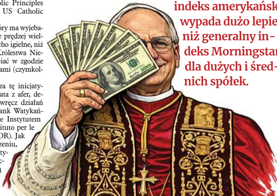
Ilustr. PAWEŁ FERENC

Trzepanie kapuchy po katolicku to zresztą niezły biznes – kościelny indeks amerykański wypada dużo lepiej niż generalny indeks Morningstar dla dużych i średnich spółek.