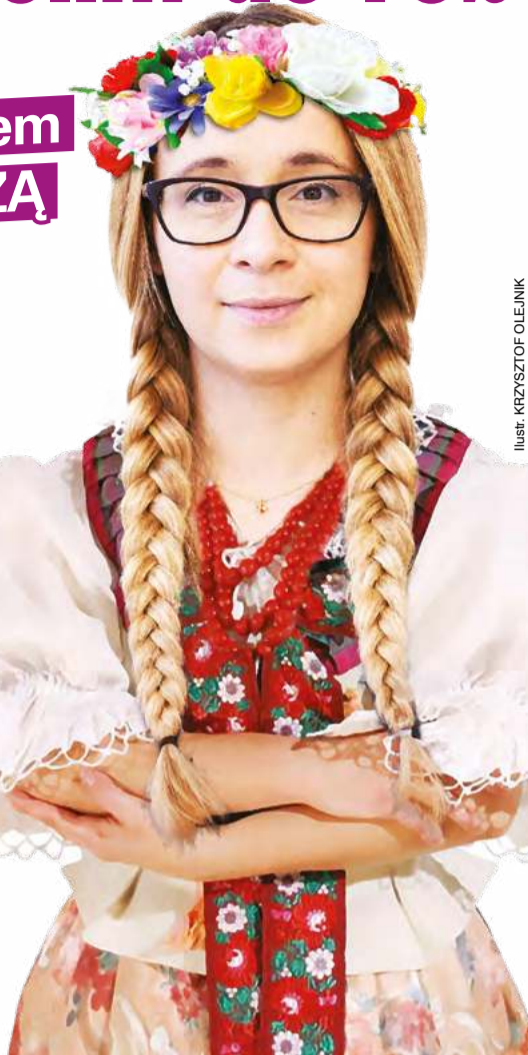
ILUSTRACJA: KRZYSZTOF OLEJNIK

– Czy dlatego Razem powinno iść do wyborów osobno?