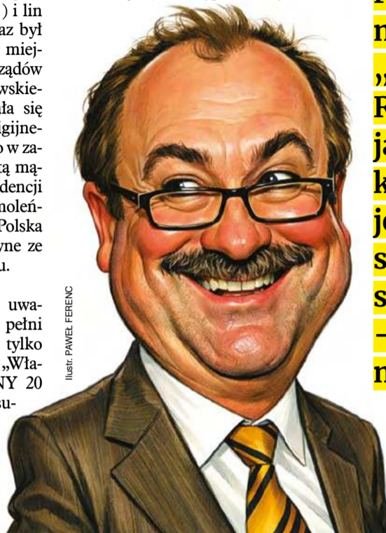
ILUSTRACJA: PANEŁ FERENC

„prowizja z transakcji koncentracji rynku medialnego”, mówił mu o tym „jego przyjaciel Leo Rivin”, ale decydujący głos należy do kogoś, kto opisany jest jako „Chazasti”. „Może zaprosić go na wyspę?” – pyta Epstein. „On ma wąsy”. „Zapomnij” – reaguje błyskawicznie Epstein.