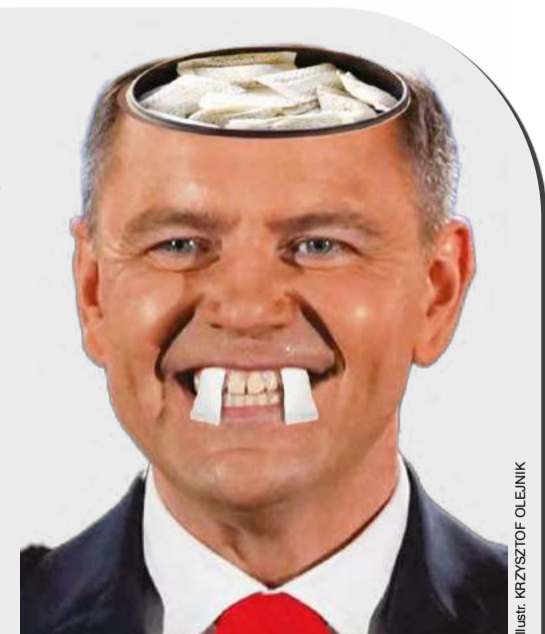
ILUSTRACJA: KRZYSZTOF OLEJNIK

Usta do dziennikarza, żeby już przestał się odszczekiwać: „Mówię do pana, panie redak-