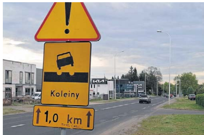
Kontrakt trafił w ręce Przedsiębiorstwa Robót Drogowych Lubartów. Opiewa ma 456,9 tys. zł

ZDiTM zapowiada, że to nie koniec - w tym roku - prac na Al. Warszawskiej. Modernizacja jezdni ma objąć odcinek do ul. Głównej, o co zabiegają od lat mieszkańcy.