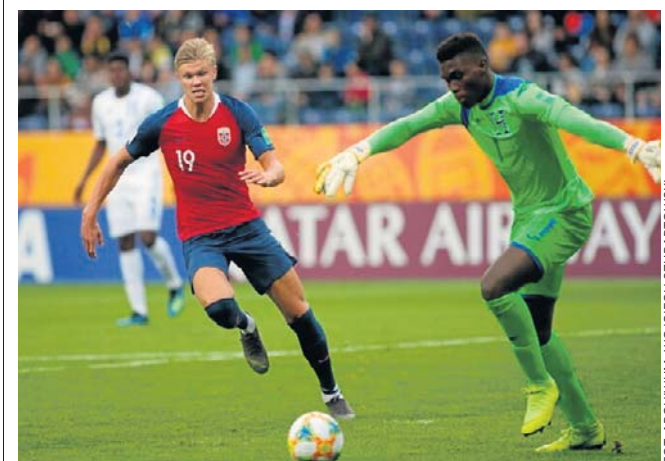
FOT. ARCHIWUM: WOJCIECH SZUBARTOWSKI

W karierze klubowej zdobył w zasadzie wszystko, ale z reprezentacją debiutuje na mundialu. O północy Norwegia grała z Irakiem. ©/P