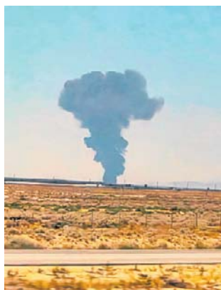
Na nagraniach widać dym nad miejscem katastrofy

Informacje te potwierdził oficjalny profil bazy Edwards w mediach społecznościowych. „Na miejscu niezwłocznie pojawiły się zespoły ratownicze” - podkreślono, dodając, że dalsze informacje zostaną