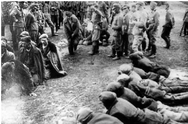
Pacyfikacja wsi Osuchy dokonana przez Niemców 24-25 lipca 1944 r.