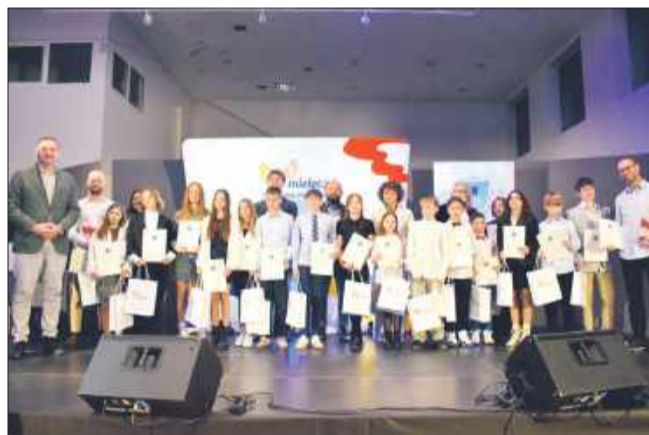
Drużyna UKS Siódemka.