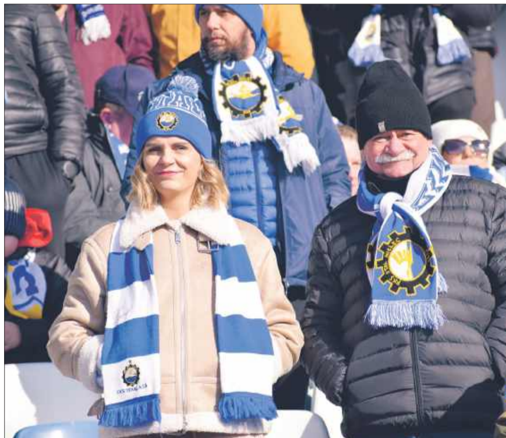
Na stadionie było ponad 4 tysiące kibiców.