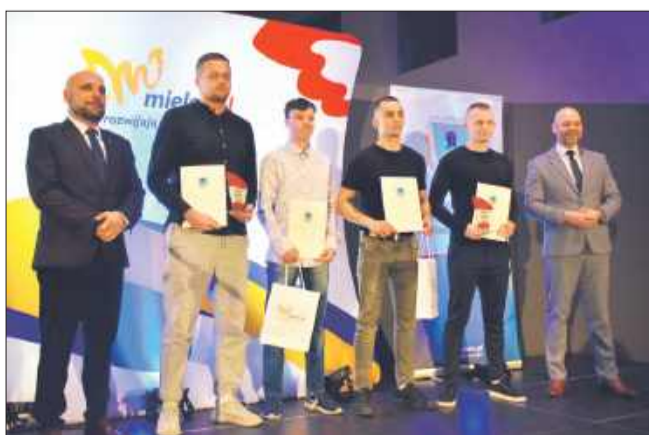
Reprezentacja Mieleckiej Szkoły Boks.