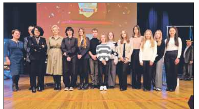
Gratulujemy mieleckim szkołom!