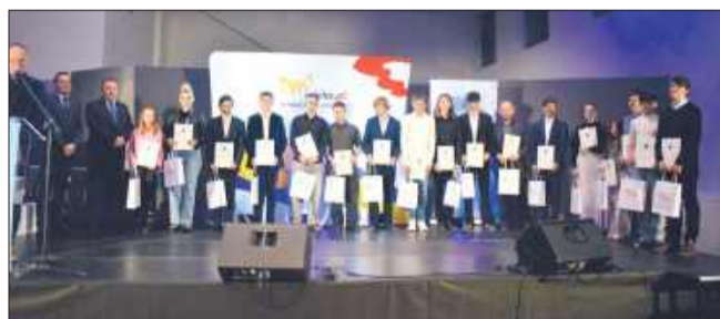
Drużyna SAUT Leonardo