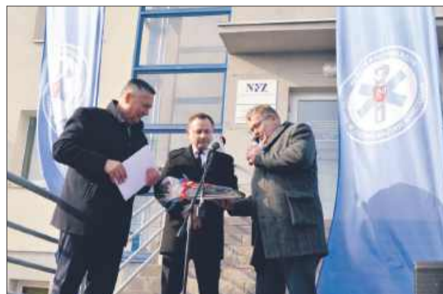
Przekazanie prezentu od starosty powiatu mieleckiego dla podstacji.