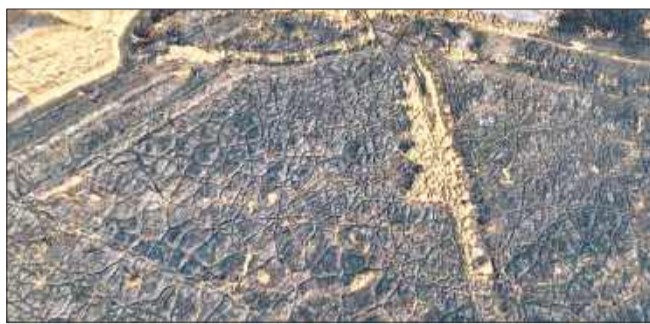
Kadr z filmu udostępnionego przez Nadleśnictwo Mielec, pokazujący skalę zniszczeń.

Teren, na którym doszło do pożaru, był trudny do gaszenia -