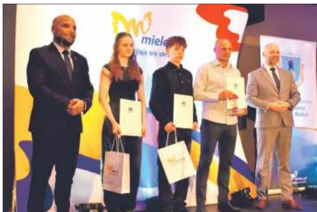
Reprezentacja IRYDA Mielec.