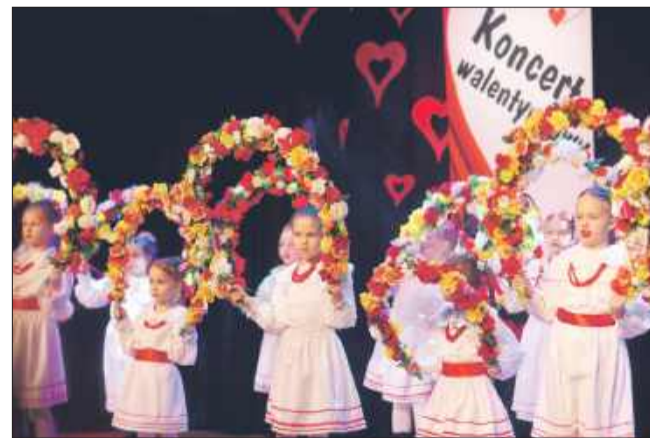
Kolorowy występ grupy dziecięcej.

Miłość do tradycji, muzyki i pomagania. Tak można podsumować wyjątkowy Koncert Walentynkowy, który odbył się 15 lutego 2025 roku w sali widowiskowej Ośrodka Kultury w Chorzelowie.