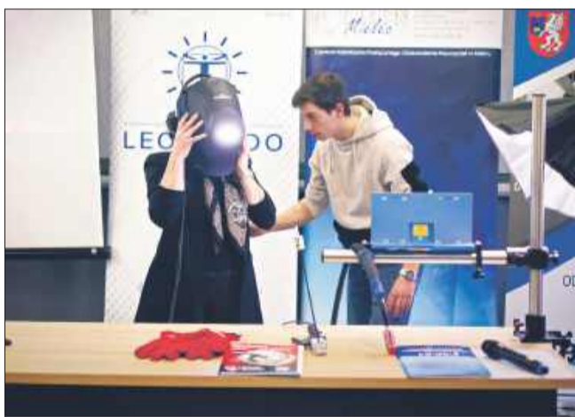
Prezentacja możliwości pracowni spawalniczej podczas konferencji.