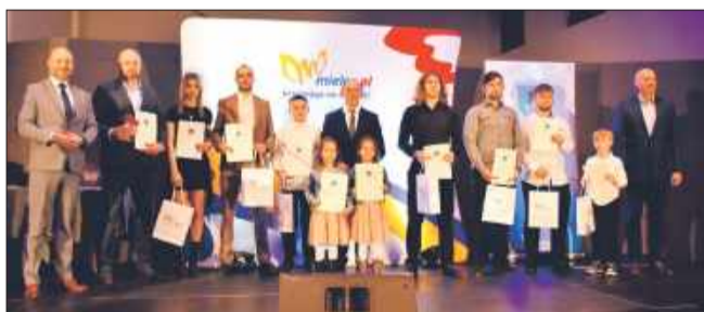
Reprezentacja IRON Dragon MMA.