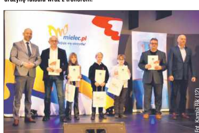
Karatecy TG Sokół.