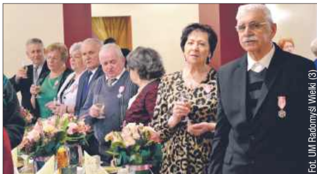
Nie zabrakło gromkiego „Sto lat” i toastów.