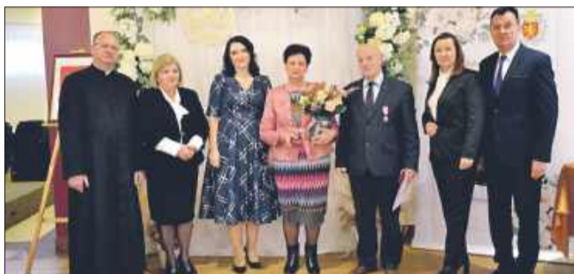
Złote gody – symbol trwałości i piękna wspólnego życia.