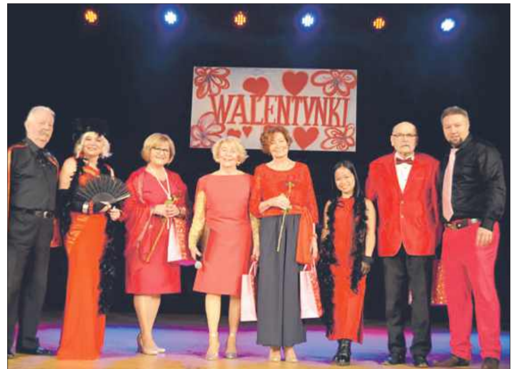
Ten walentynkowy koncert na długo pozostanie w pamięci.