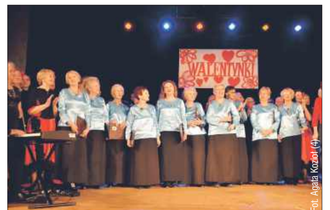
Miłosne melodie i taneczne kroki naszych wspaniałych seniorów.