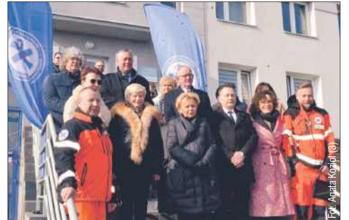
Zespół ratowników i zaproszeni goście.