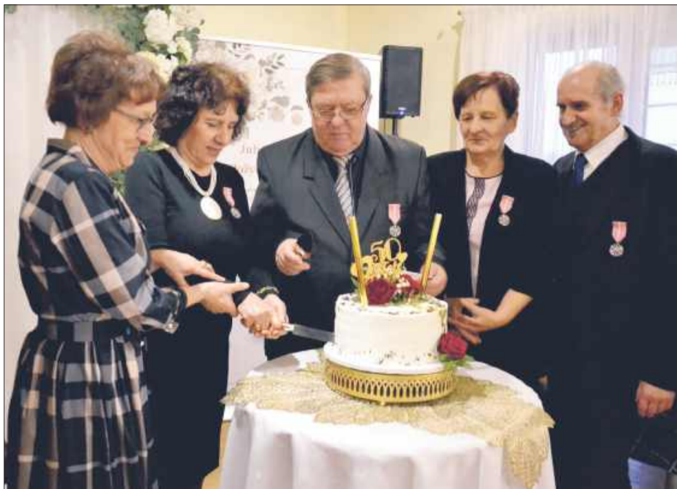
Wspólne krojenie tortu przywoływało wspomnienia sprzed lat.