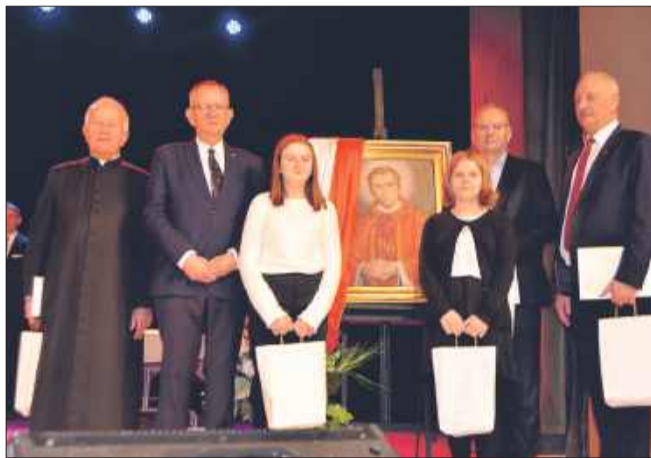
Nadal pamiętamy o ks. Jerzym