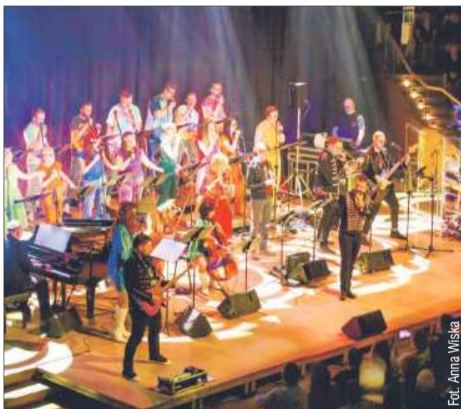
Koncert „THE BEATLES Symfonicznie” w Gdańsku.

Zespół The Beatles to ikona muzyki, której utwory na stałe wpisały się w światową