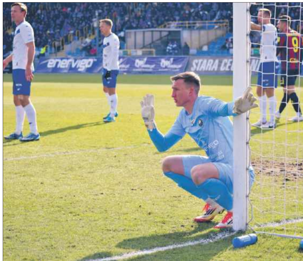
Kolejny domowy mecz już 1 marca.