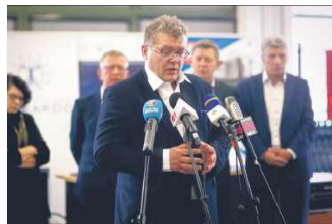
Konferencja prasowa - przemówienie starosty powiatu mieleckiego Kazimierza Gacka.

mieli okazję zobaczyć pokaz sprzętów w nowoczesnej pracowni spawalniczej BCU. Demonstracja obejmowała prezentację nowoczesnych urządzeń spawalniczych, co pozwoliło na zaprezentowanie zaawansowanych technologii i metod pracy, jakie będą dostępne dla przyszłych uczniów i specjalistów.