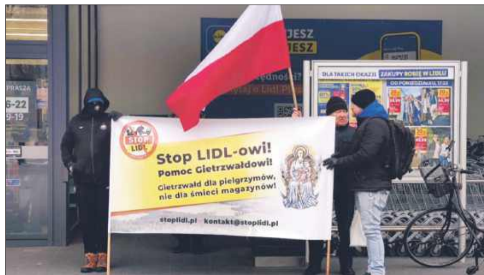
Protestujący zebrali się przed mieleckim Lidlem.