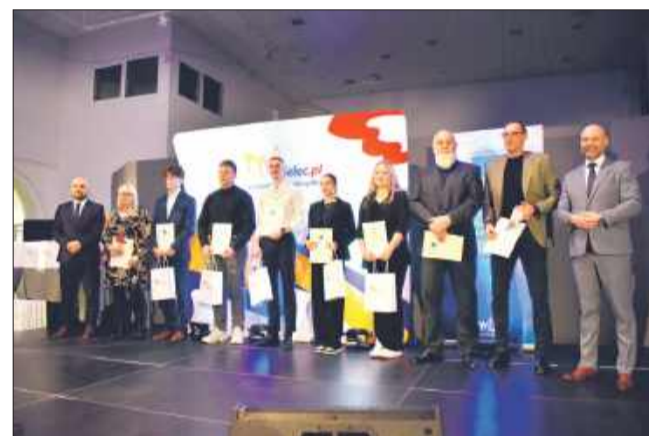
Nagrodzeni z klubu LKS Stal Mielec wraz z trenerami.