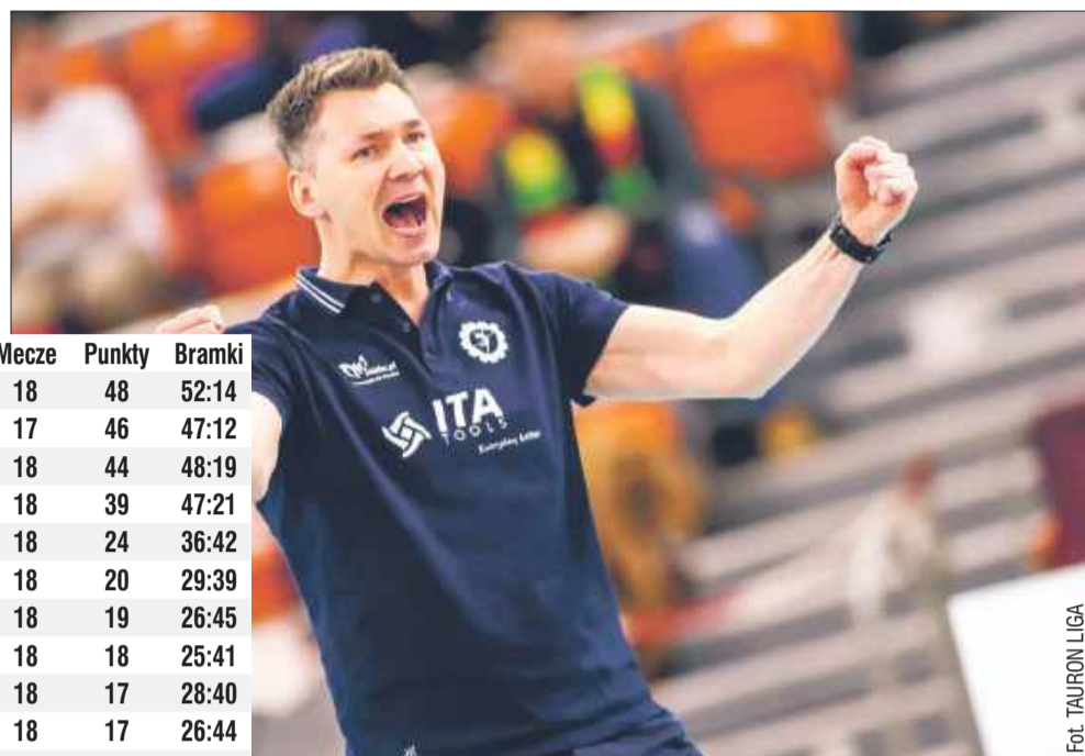
Już 1 marca o 20:30 rewanż w Mielcu.

Druga partia miała podobny przebieg – podopieczne trenera