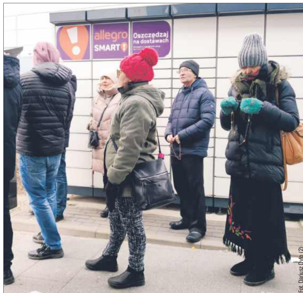
Zebrani modlili się na różańcu i rozdawali ulotki.