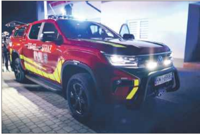
Prezentacja nowego pojazdu pod remizą OSP Kielków.