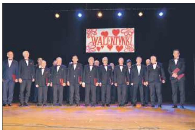
Walentynkowe melodie dla dojrzałych serc.