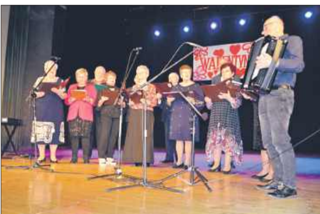
Wspólne chwile przy muzyce.