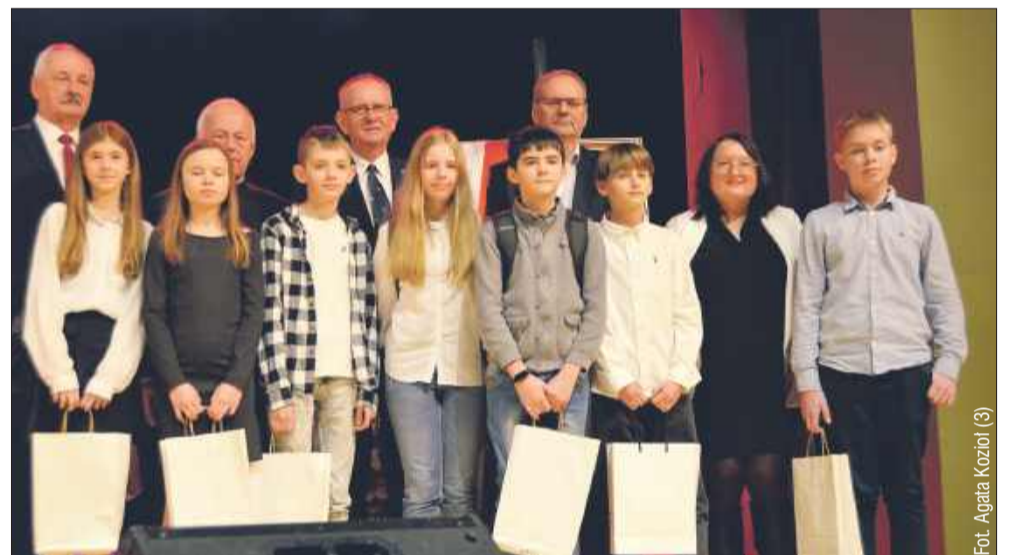
Konkurs przyciągnął spore zainteresowanie.