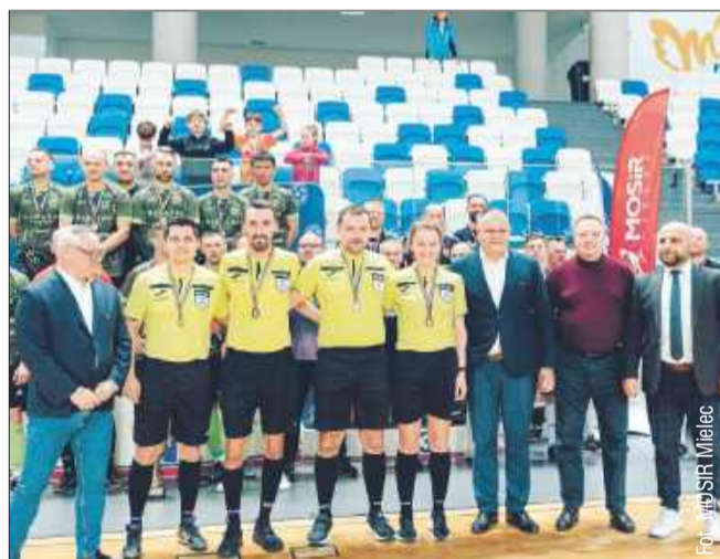
To było prawdziwe święto futsalu.