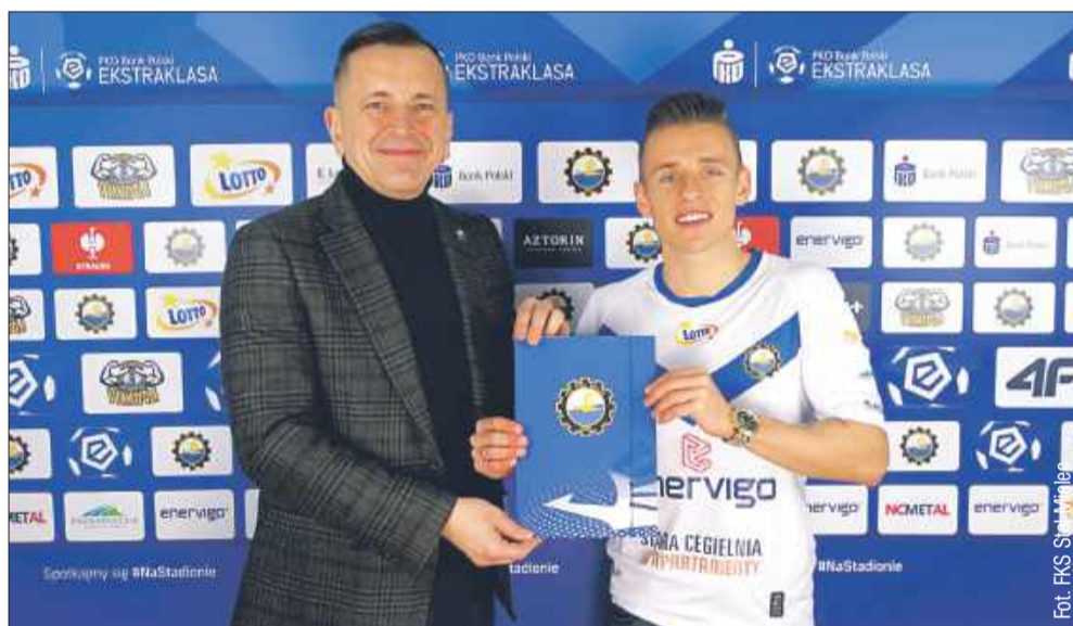
Nowy zawodnik w FKS Stali Mielec