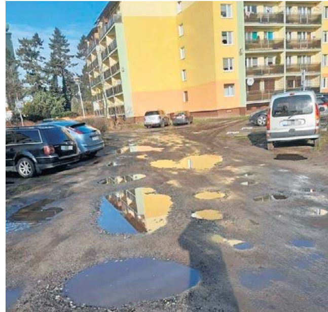
Ulica Podhalańska ma zostać utwardzona do połowy 2027 roku. Mieszkańcy na inwestycję czekają od 2008 roku

Można zatem powiedzieć, że mieszkańcy Podhalańskiej wreszcie się doczekali. O drodze gruntowej między blokami już w kwietniu 2017 roku pisała „Gazeta Pomorska”. Mieszkańcy cytowani w artykule „Sto metrów zgryzoty. Na remont czekają już 9 lat!” skarżyli się