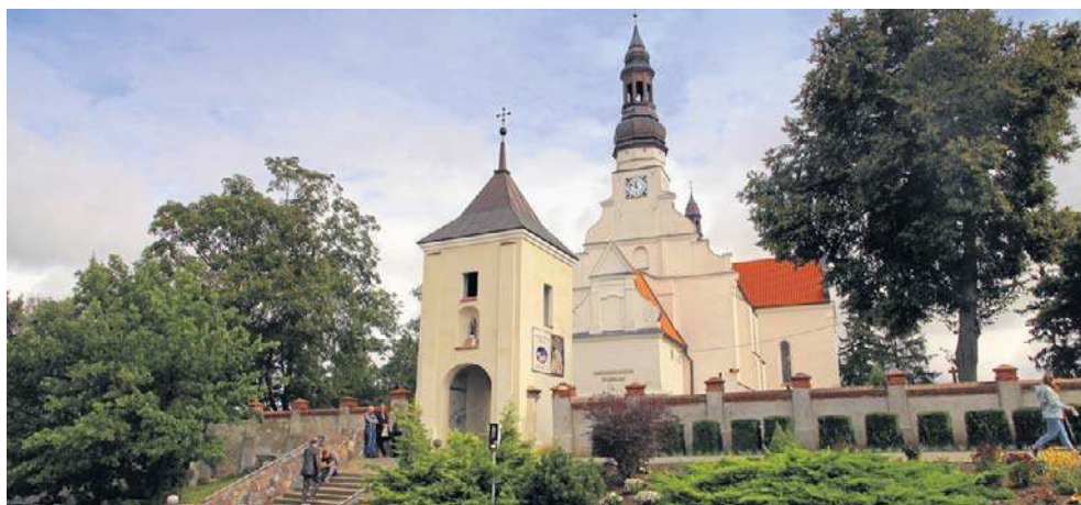
W Sanktuarium Matki Boskiej Byszewskiej Królowej Krajny w Byszewie prowadzone będą w tym roku zabiegi restauratorskie przy ołtarzu Matki Boskiej Różańcowej. To kontynuacja prac rozpoczętych dwa lata temu

W 2026 r. w budżecie pow. bydgoskiego, w dziale kultura i ochrona dziedzictwa narodowego, na pomoc w ratowaniu zabytkowych budowli zarezer-