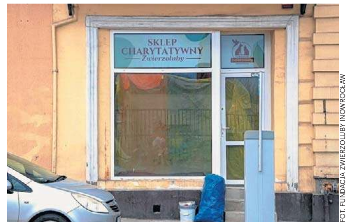
W sklepie czekać będzie szeroki wybór artykułów. Dochód z ich sprzedaży trafi na pomoc dla zwierząt

Już teraz sklep przyjmuje rzeczy, które są niepotrzebne mieszkańcom, a mogą wspomóc fundację. Pomysłodawcy