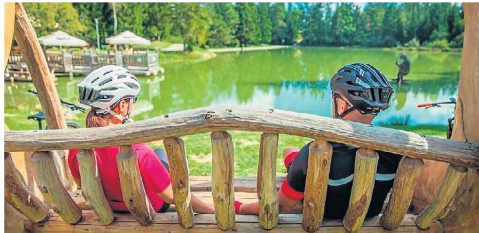
Działalność związana z kulturą, rozrywką i rekreacją - to jedno z sektorów gospodarki, gdzie umowy o dzieło są zawierane najczęściej

Województwo kujawsko-pomorskie, z liczbą niemal 24,5 tys., zajęło 8. miejsce w kraju.