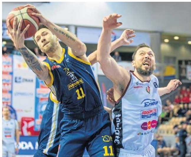
Spotkanie Astoria - Miners niespodziewanie było bardzo zacięte, ale to bydgoski zespół ostatecznie triumfował

Mecz WKK Wrocław - KSK Qemetica Noteć Inowrocław zakończył się po zamknięciu wydania. Szczegóły na naszej stronie internetowej. ©©