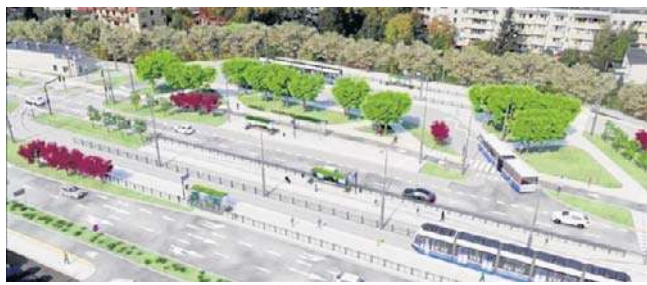
Budowa realizowana będzie w latach 2026-2028

Rozstrzygnięto przetarg na budowę torowiska tramwajowego wzdłuż ulicy Solśkiego od ronda Kujawskiego do pętli Bielickiej. Inwestycji za ponad 100 mln zł ma zakończyć się w 2028 roku.