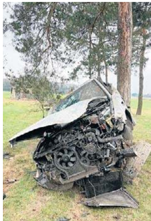
Groźne zdarzenie w miejscowości Narty

Policjanci dbali o bezpieczeństwo nie tylko podczas wzmocnionych wyjazdów i powrotów świątecznych, ale również w trakcie lokalnych wydarzeń, takich jak motoświęconka czy piłkarski mecz piątek ligi. Dzięki zaangażowaniu i obecności służb, uczestnicy mogli bezpiecznie korzystać z przygotowanych atrakcji. ©