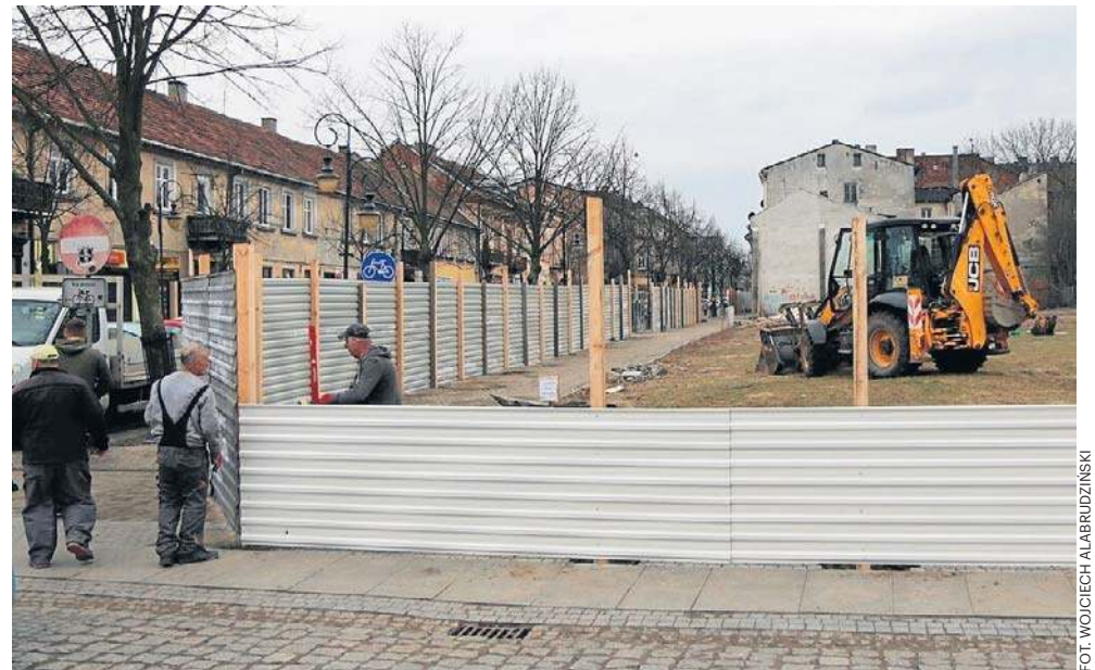
Inwestycja w zdecydowanej większości finansowana jest ze środków zewnętrznych

Dodajmy, że w listopadzie 2025 - po otwarciu ofert, za najkorzystniejszą uznano najtańszą ze złożonych ofert złożoną przez