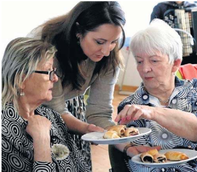
Ciastka Chrystianki zyskały uznanie pań z Klubu Krystyn