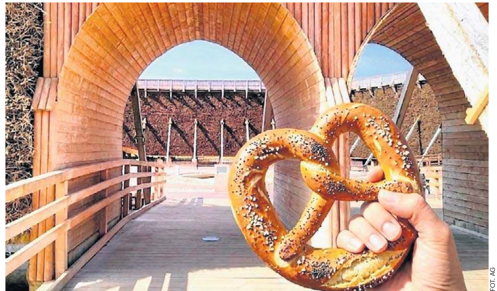
Czy precel posypany grubą solą i kminkiem może być wizytówką solankowych tężni?