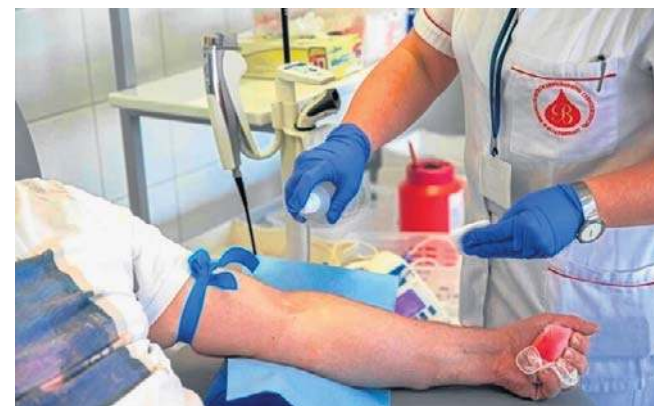
FOT. WOJCIECH WOTKIEWICZ / POLSKA PRESS

Krew mogą oddać osoby zdrowe w wieku 18-65 lat, ważące co najmniej 50 kg i mające dokument tożsamości z numerem PESEL. Rocznie mężczyzna może oddać krew sześć razy, a kobiety - cztery. Dawcy - w ramach posiłku regeneracyjnego - przysługują dziewięć tabliczek czekolady. Jest to rekompensata za wydatek energetyczny potrzebny do regeneracji organizmu po oddaniu 450 ml krwi pełnej. ©©