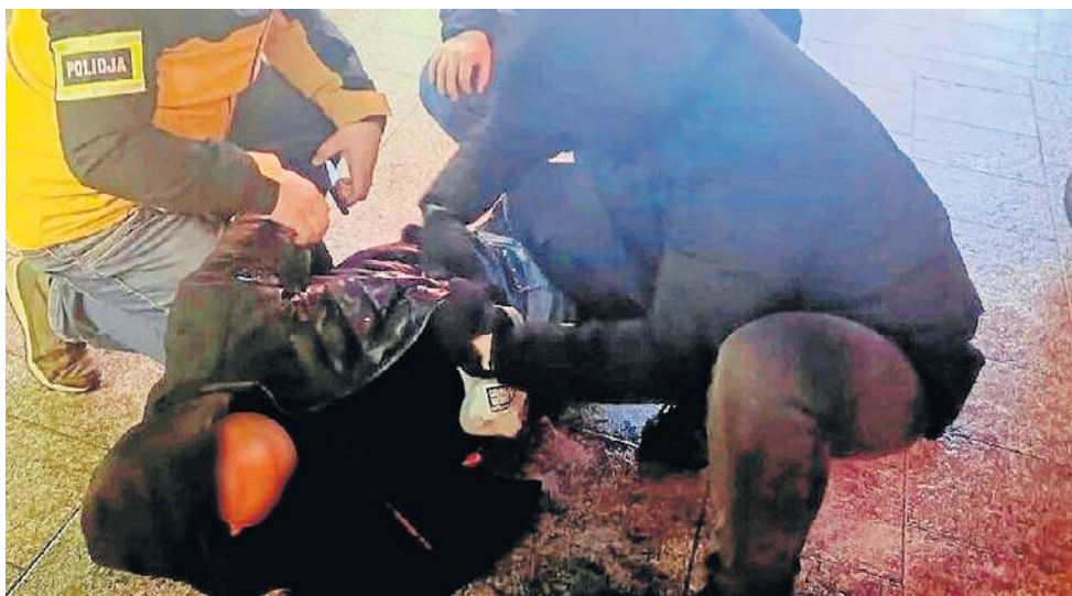
To była zorganizowana grupa przestępcza wyłudniająca pieniądze. Seniorka z Torunia przekazała 40 tys. złotych, inna 20 tys. zł i kartę bankomatową

Policjanci Wydziału Kryminalnego KWP w Bydgoszczy