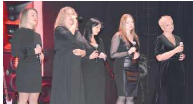
W realizację tego wyjątkowego koncertu zaangażowała się społeczność Międzyrzecza Podlaskiego: rodzice, pedagodzy, dzieci i młodzież

Środowe wydarzenie nie było wyłącznie muzyczną uczcą. Organizatorzy postawili na trudny, ale niezwykle potrzebny format, w którym