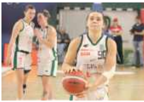
Lotto AZS UMCS Lublin jest bliski wywalczenia medalu mistrzostw Polski w obecnym sezonie

Koszykarki Lotto AZS UMCS Lublin awansowały do półfinałów Orlen Basket Ligi Kobiet. W pierwszej rundzie fazy play-off akademicki wyeliminowały Wisłę Kraków.