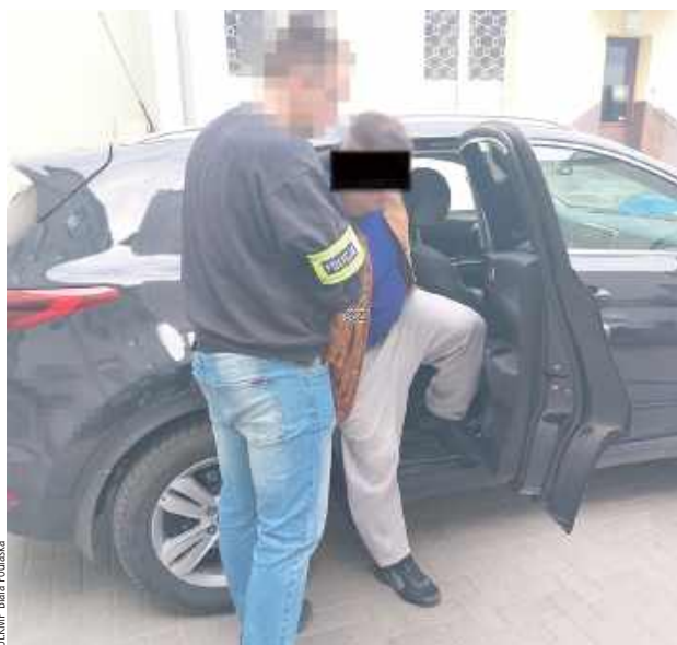
Mężczyzna ukrywał się poza granicami naszego kraju, gdy powrócił do miejsca zamieszkania nie spodziewał się wizyty policjantów

- Mężczyzna ukrywał się przed wymiarem sprawiedliwości od września ubiegłego roku. Z ustaleń policjantów wynikało, że przebywał poza granicami naszego kraju. Gdy postanowił wrócić, do jego drzwi zapukali funkcjonariusze. Choć wszystko wskazywało, że jest on w mieszka-