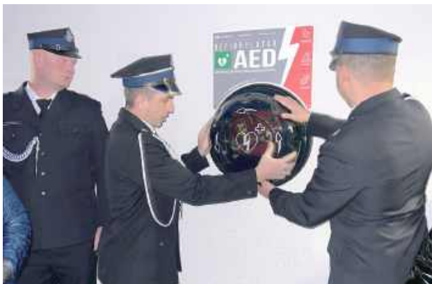
Defibrylator AED zawieszony na budynku remizy OSP w Żabcach

Za strażakami ochotnikami z OSP Żabce najważniejsze spotkanie w roku. Walne Zebranie Sprawozdawczo-Wyborcze przyniosło wybór nowych władz jednostki na najbliższe pięć lat, powołanie Dziecięcej Drużyny Pożarniczej oraz oficjalne przekazanie zewnętrznego defibrylatora AED.