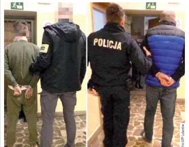
Sąd zastosował wobec obu podejrzanych środek zapobiegawczy w postaci trzymiesięcznego tymczasowego aresztowania

Sejf z pieniędzmi oraz sprzęt elektroniczny padł łupem włamywaczy w powiecie parczewskim. Złodzieje nie cieszyli się długo wolnością.