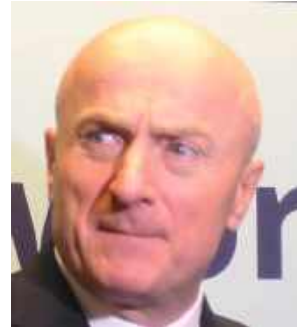
Jarosław Stawiarski marszałek województwa lubelskiego

- Staram się po prostu wykonywać jak najlepiej swoje obowiązki. Mam satysfakcję, że Biała pierwsza wychyciła błędy w systemie. Minister udawał, że nic się nie stało. A kursanci nie byli świadomi, że zostali kozłami ofiarnymi błędów ministra i jego urzędników. Ten problem dotyczy kandydatów na wszystkie kategorie prawa jazdy. Trwa analizowanie, w ilu przypadkach wylosowane błędne pytania miały wpływ na wyniki egzaminu. Trafiliśmy w Białej Podlaskiej na osobę, która uzyskała wynik negatywny, a zostało jej wylosowane pytanie z błędem. W tym przypadku także będziemy wnioskować o unieważnienie egzaminu i jeśli do tego dojdzie, osoba dostanie zwrot pieniędzy. Działamy najszybciej w Polsce.