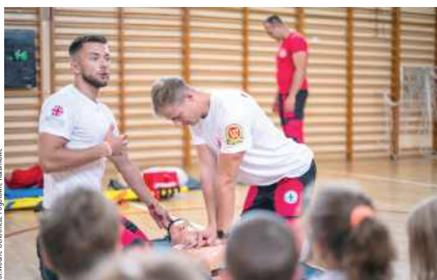
Międzyrzeczka Drużyna WOPR znalazła się w wąskim, prestiżowym gronie najlepszych jednostek w kraju (obok m.in. Stołecznego WOPR, WOPR Opole czy WOPR Lublin)

Międzyrzeczka Drużyna WOPR znalazła się w elitarnym TOP 8 najlepszych jednostek w całej Polsce! Zostali laureatami ogólnopolskiej kampanii „Krucze Życie 2026”, a ich tytaniczna praca społeczna została doceniona w ogólnopolskim konkursie zimowym z cennymi nagrodami sprzętowymi.