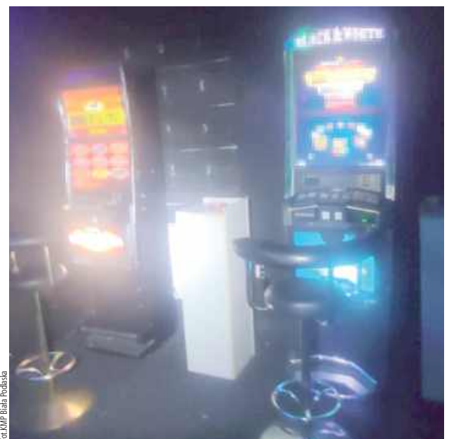
„Z posiadanych informacji wynikało, że prowadzone są tam gry hazardowe na klasycznych automatach do gier bez wymaganej koncesji lub zezwolenia”

Funkcjonariusze ustalają okoliczności sprawy. Zapowiadają