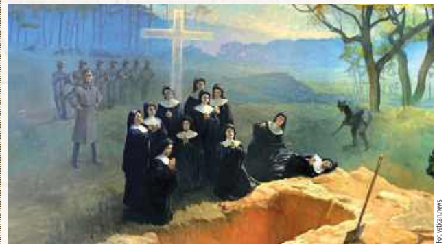
Męczeństwo Jedenastu Nazaretanek z Nowogródka na obrazie Adama Styki (1948)

Błogosławiona męczennica spod Kocka (cz. III) Wraz z siostrami dobrowolnie oddała życie za mieszkańców