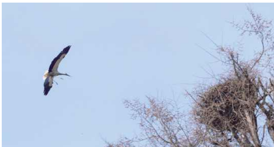
Bocian wraca do swojego gniazda w Lisowie

- Zrobiłem je w 2016 r. Założyłem rurę, potem obręcz. Resztę bociany zrobiły same. Od 2017 r. przylatują co roku. Zawsze mają młode. Nie było jeszcze takiego