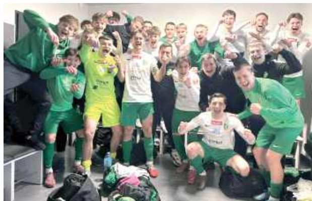
Radość graczy Podlasia po wygranej na boisku Wiślan Skawina