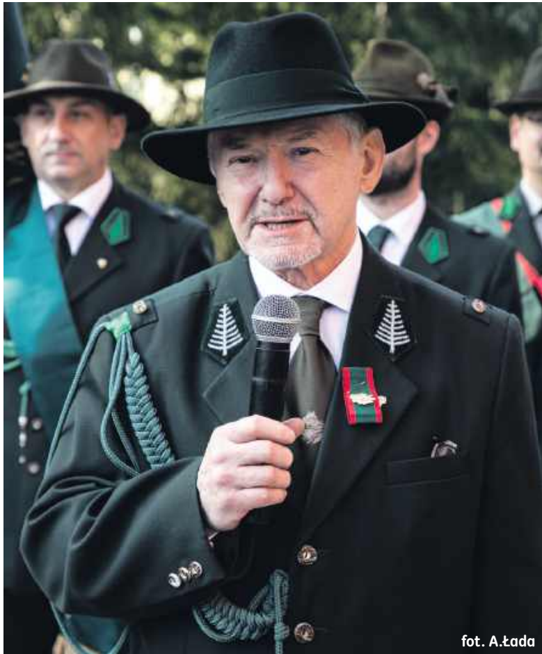
fol. A. Łada

Sztuczna Inteligencja podpowiada, że pasja motoryzacyjna to coś więcej niż tylko hobby czy umiejętność prowadzenia pojazdu; to głębokie, emocjonalne zaangażowanie w świat samochodów, motocykli oraz szeroko pojętej techniki napędowej. Dla miłośnika motoryzacji pojazd nie jest jedynie środkiem transportu, ale dziełem sztuki inżynierskiej, wyrazem stylu, a często celem samym w sobie.