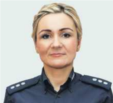
62-latek, myśląc, że chroni swoje oszczędności, przelał 78.000 złotych na

konto oszustów. Ostrowczanin uwiaryzył kłamstwu pracownika placówki bankowej.