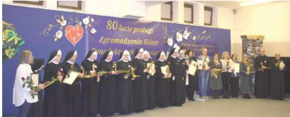
Uroczystość była również okazją do podziękowania Siostrze, księżom i osobom świeckim, dzięki którym Siostry mogą realizować swoje piękne dzieło w Puławach

Z biegiem czasu i w domu przy Czartoryskich zrobiło się ciasno. Siostry stanęły przed trudną decyzją - albo szukać dla siebie i swoich podopiecznych miejsca w innym mieście, albo budować nowy dom tu w Puławach. Dzięki uporowi, Bożej pomocy i ludziom dobrej woli - kapłanom i samorządowcom, którzy wiedzieli, ile dobra niesie działalność Benedyktynki - udało się ruszyć z budową na działce przy ul. Kowalskiego 3a, przekazanej na ten szczytny cel przez Skarb Państwa. Dzięki pozyskanym dotacjom znalazły się również środki na tę ważną inwestycję. Siostry wraz ze swoimi podopiecznymi wprowadziły się tam we wrześniu 2014 r. Od tamtej pory mają do dyspozycji spory obiekt, spełniający wszystkie standardy i dostosowany do potrzeb ich niepełnosprawnych wychowanków. Dzięki wielu akcjom charytatywnym i darczyńcom udało