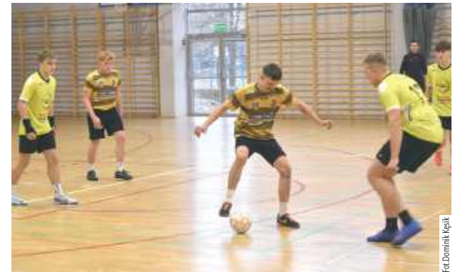
Podczas 3. Turnieju Memoriału 3 Orłów zmierzyło się dziesięć drużyn, które przez kilka godzin rozgrywały wiele meczów. Miejscem zmagania była hala Zespołu Szkół Technicznych w Puławach