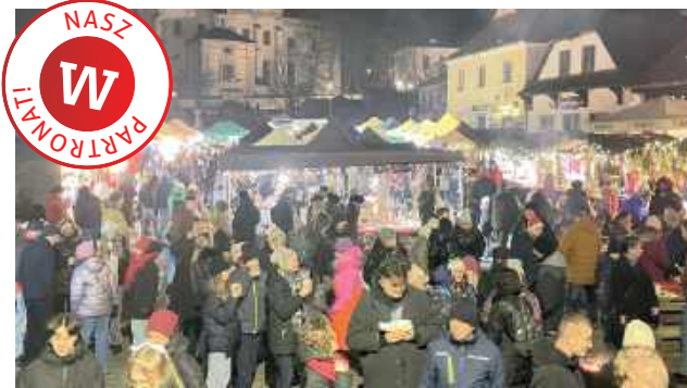
Już 6 i 7 grudnia Rynek w Kazimierzu Dolnym ponownie zamieni się w tętniące życiem, pachnące piernikami i rozbrzmiewające kolędami świąteczne miasteczko

Na Rynku pojawiają się kolorowe, pięknie przystrojone stoiska pełne rękodzieła, ozdób świątecznych i regionalnych przysmaków. W ofercie znajdziemy m.in.: pierniczki, ciasta, pieczo-