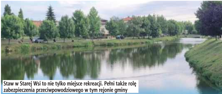
Staw w Starej Wsi to nie tylko miejsce rekreacji. Pełni także rolę zabezpieczenia przeciwpowodziowego w tym rejonie gminy

Zadanie jest realizowane w ramach projektu pn. „Działania zapobiegające powodziom i suszom na terenie MOF Miasta Puławy”, współfinansowanego z Programu Fundusze Europejskie dla Lubelskiego 2021–2027. Gmina Końskowola współpracuje w tej kwestii z Gminą Żyrzyn, która dzięki pozyskanym wspólnie środkom - 1,3 mln zł - zrewitalizuje jeden ze zbiorników w Kośminie. Całkowita wartość obu inwestycji to ponad 1,8 mln zł.