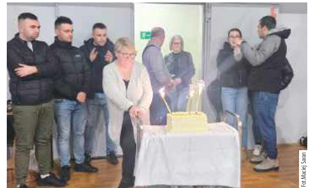
Na zakończenie zmagania na uczestników czekał tort