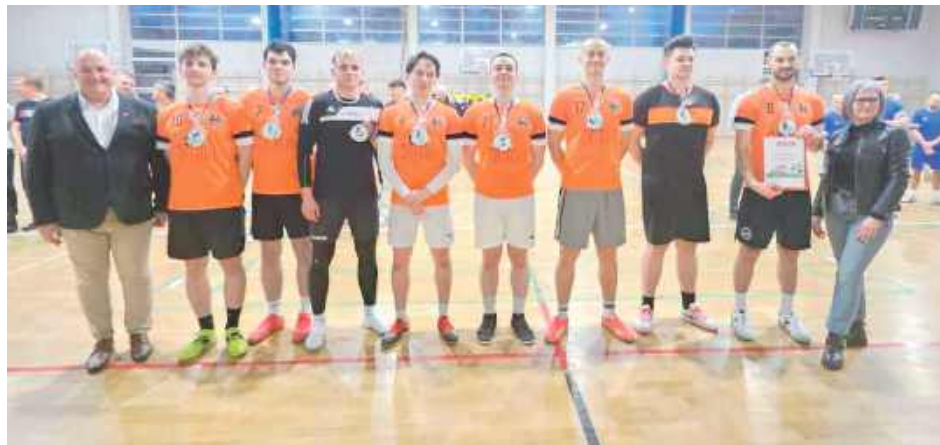
Uczestnicy otrzymali medale i dyplomy. Pierwsze miejsce trafiło do ekipy BRK, reprezentująca Bochoćnicę i Rzeczycę-Kolonię

Sportowa rywalizacja dostarczyła wielu emocji, a najlepszą drużyną turnieju okazała się ekipa BRK, reprezentująca Bochoćnicę i Rzeczycę-Kolonię.