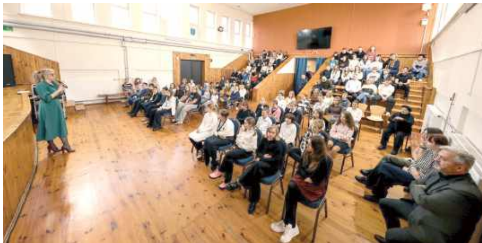
Wydarzenie było skierowane głównie do dzieci i młodzieży, ale nie tylko uczniowie przyszli posłuchać Chopina

Instrument przyjechał do Markuszowa w noc poprzedzającą koncert. Jego nastrojeniem