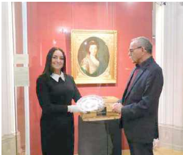
To już kolejny eksponat, przekazany puławskiemu muzeum przez Fundację Rodziną Blochów w Nowym Jorku. Niebawem będzie można go oglądać w puławskiej placówce