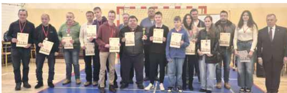
W turnieju wzięli udział zawodnicy w różnym wieku

Do rywalizacji przystąpiło wielu miłośników tej gry, którzy spotkali się w sali gimnastycznej ZSP, by sprawdzić swoje umiejętności. Rozgrywki podzielono na dwie kategorie wiekowe. Łącznie rozegrano siedem rund systemem