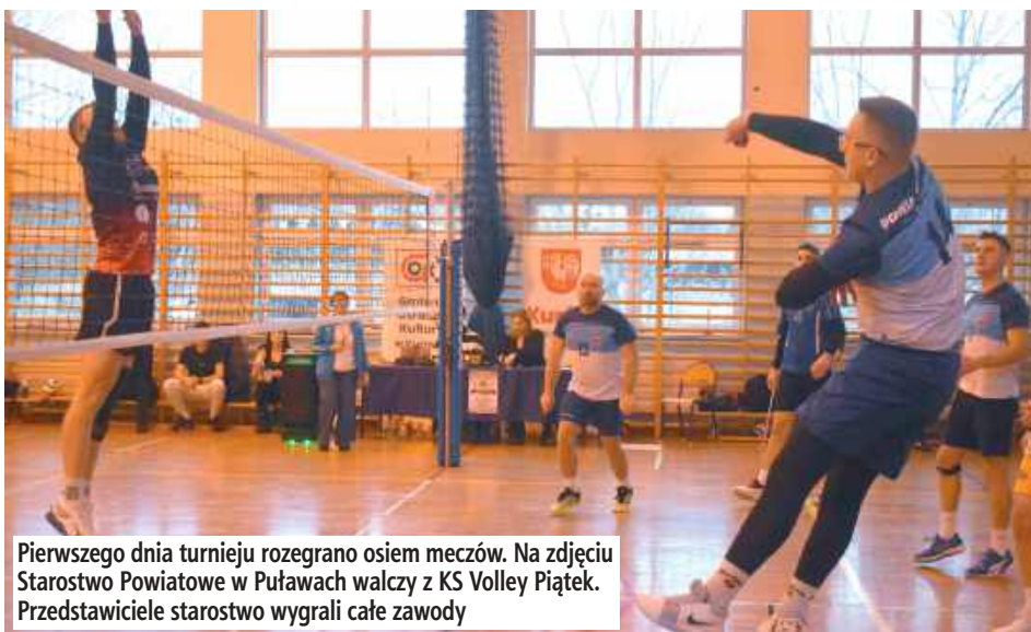
Pierwszego dnia turnieju rozegrano osiem meczów. Na zdjęciu Starostwo Powiatowe w Puławach walczy z KS Volley Piątek. Przedstawiciele starostwa wygrali całe zawody

W Zespole Szkolno-Przedszkolnym w ubiegły weekend odbył się I Kurowski Turniej Siatkówki Halowej, który zgromadził drużyny z regionu i dostarczył wielu sportowych emocji.