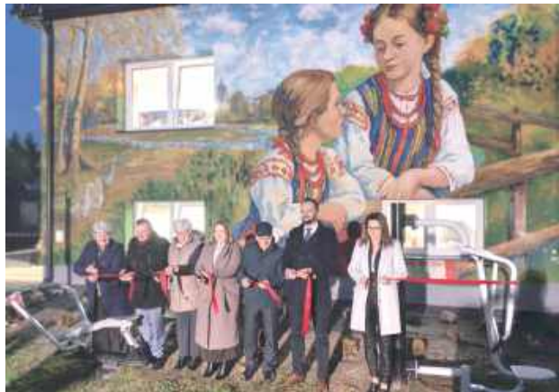
Prace nad świetlicą w Borowej trwały kilkanaście miesięcy. 21 listopada nastąpiło oficjalne otwarcie budynku, który zdobi piękny mural

Był Tomaszów, Piskorów i Zarzecze, a teraz przyszedł czas na Borową. 21 listopada dokonano uroczystego otwarcia budynku, z którego będzie korzystać lokalna społeczność. W tym miejscu ponownie będzie działać filia Gminnej Biblioteki Publicznej, a panie z tutejszego Koła Gospodyń Wiejskich będą miały swój kąt.