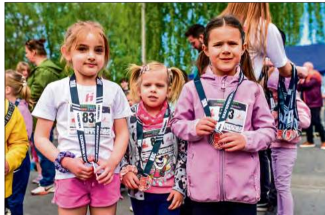
A po biegu najmłodszych uczestników rozpieła radość i duma.

nowy rekord, bo ten musiał paść już w dniu jej debiutu. Największe wrażenie zrobiła jednak frekwencja. Bieg główny ukończyło aż 863 zawodników, co jest najlepszym rezultatem w historii imprezy. Gdy dodamy do tego blisko 900 uczestników biegów dziecięcych i młodzieżowych, wyraźnie widać, jak duże jest zapotrzebowanie na tego typu wydarzenia w regionie.