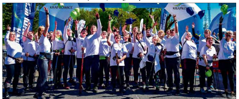
Czapki z głów! – w taki oto sposób swój start w biegu uczcili miłośnicy Nordic Walking.

- Świetna pogoda przyczyniła się do tego, że pobili-