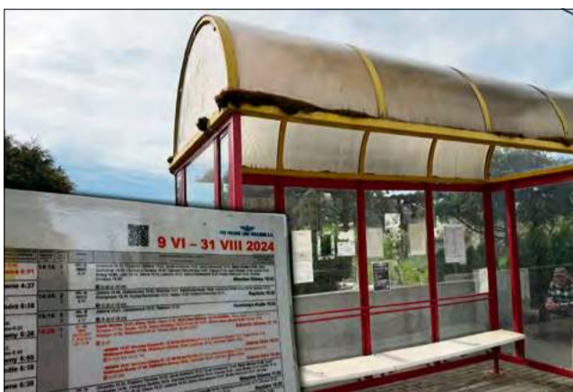
Na przystanku na osiedlu 1000-lecia w Krapkowicach wisi rozkład jazdy PKP. Sęk w tym, że jest on już dawno nieaktualny.