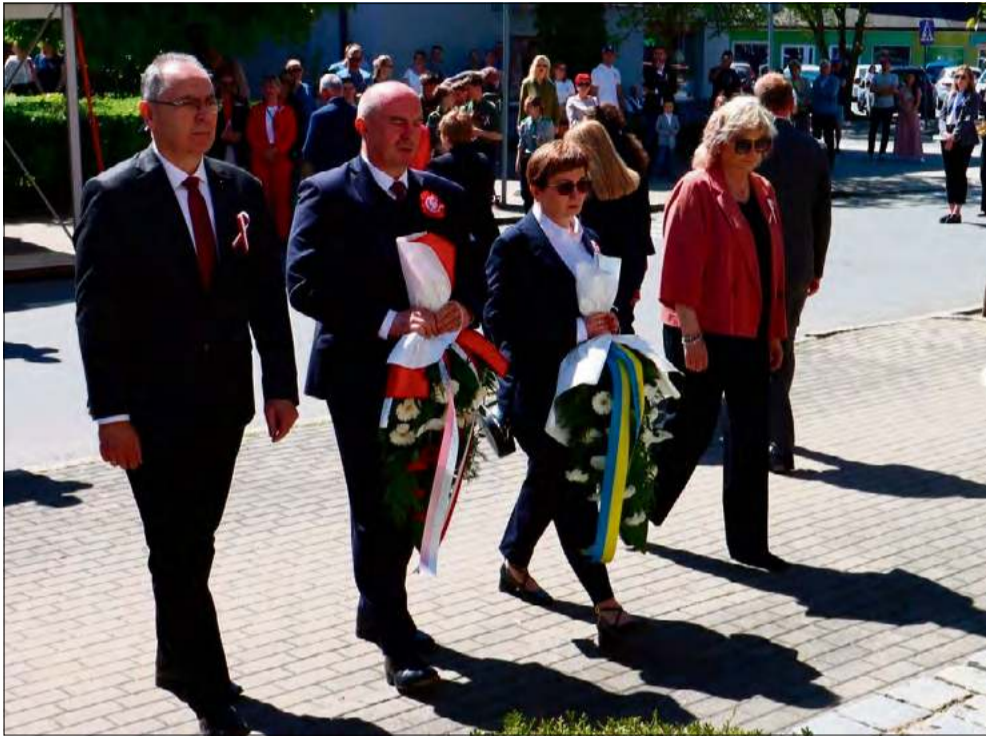
Przedstawiciele samorządu złożyli wiązanki kwiatów pod pomnikiem Ofiar Wojen i Przemocy.

Mieszkańcy Krapkowic uczcili 235. rocznicę uchwalenia Konstytucji 3 Maja, biorąc udział w obchodach przy Pomniku Ofiar Wojen i Przemocy.