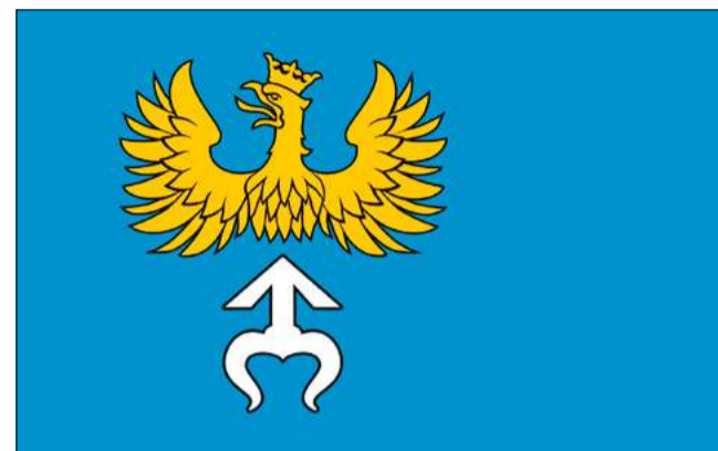
Flaga powiatu krapkowickiego - spójna z herbem, podkreśla tożsamość i tradycję powiatu.

Nowe symbole mają nie tylko charakter reprezentacyjny, ale również