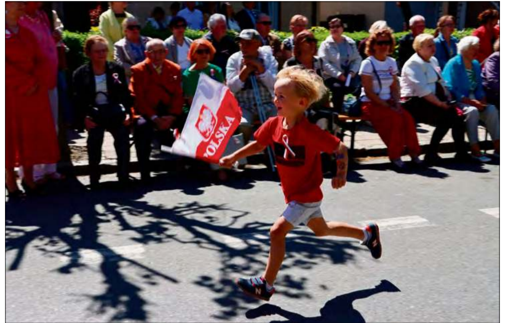
Kolejne pokolenia mieszkańców wspólnie świętowały rocznicę Konstytucji 3 Maja.

Obchody rozpoczęły się Mszą Świętą w intencji Ojczyzny w kościele pw. św. Mikołaja w Krapkowicach. Następnie uczestnicy przemaszserowali pod pomnik przy ul. Wolności, gdzie odbyła się oficjalna część wydarzenia.