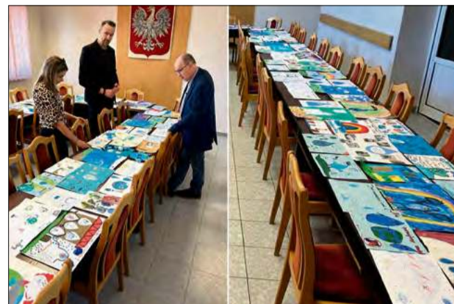
W Urzędzie Miejskim w Zdzeszowicach rozstrzygnięto konkurs plastyczny.

Każde dziecko, które oddało swoją pracę, otrzymało tytuł Ambasadora