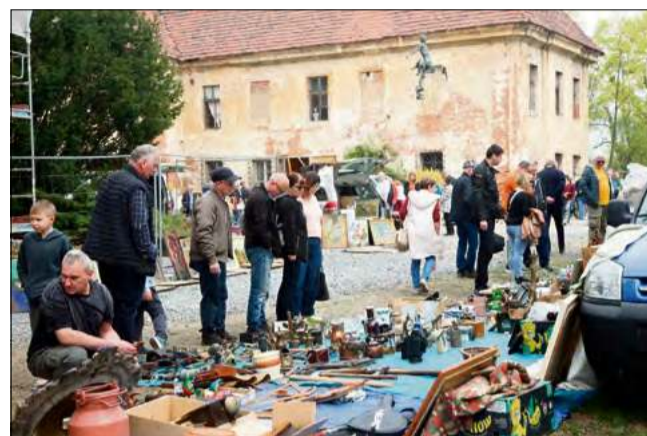
Stoiska z antykami i starociami ustawione na dziedzińcu Pałacu Rozkochów podczas giełdy staroci.

Organizatorzy podkreślają rosnące zainteresowanie