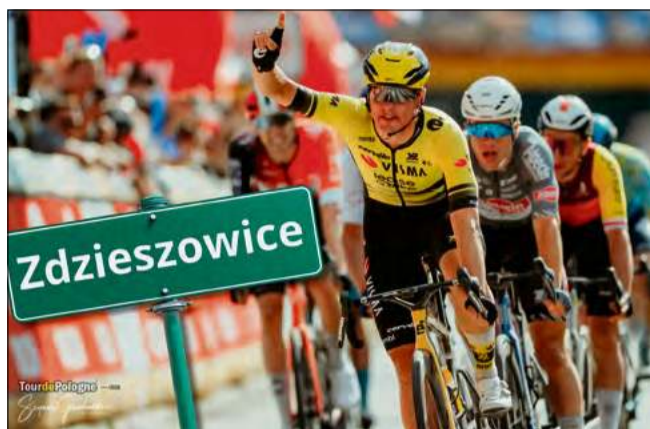
7 sierpnia peleton 83. Tour de Pologne przejedzie przez Zdzeszowice.

W peletonie znajdują się czołowi zawodnicy świata, reprezentujący kilkanaście ekip z dywizji World Tour. Dla lokalnych kibiców to okazja do zobaczenia z bliska profesjonalnego wyścigu kolarskiego na najwyższym poziomie. Mieszkańcy gmi-