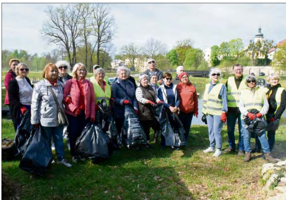
Seniorzy z Krapkowic zebrali śmieci z brzozańskiego brzoza w ramach akcji Czysta Rzeka.

Krapkowicki brzeg w okolicach ujścia Osobłogi do Odry i pobliskiego mostu w sobotę, 25 kwietnia, zamiast spacerowiczów zdominowała... akcja sprzątania. Do działania ruszyli seniorzy z krapkowickiego oddziału Polskiego Związku Emerytów, Rencistów i Inwalidów, klubu „Aktywni Seniorzy” z Otmętu, Uniwersytetu Trzeciego Wieku w Krapkowicach oraz grupy „Kreatywne Umysły”. Wszystko w ramach ogólnopolskiej inicjatywy akcji Czysta Rzeka.