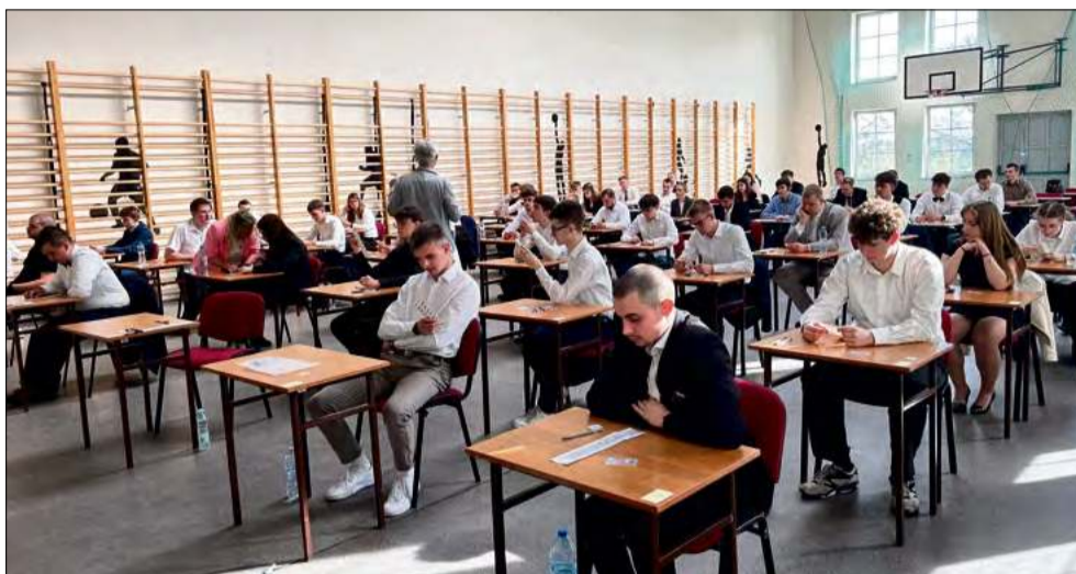
Uczniowie Zespołu Szkół Zawodowych w Krapkowicach tuż przed maturą.

Egzaminowi maturalnemu zazwyczaj towarzyszą stres i emocje, jednak niektórzy uczniowie podchodzą