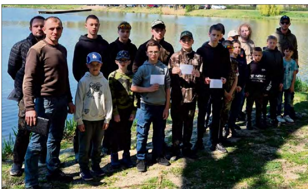
Juniorzy rywalizowali w Mosznej.

Rozpoczął się sezon w kole Polskiego Związku Wędkarskiego w Strzelecckach. Za nami pierwsze zawody, a to dopiero początek rywalizacji.