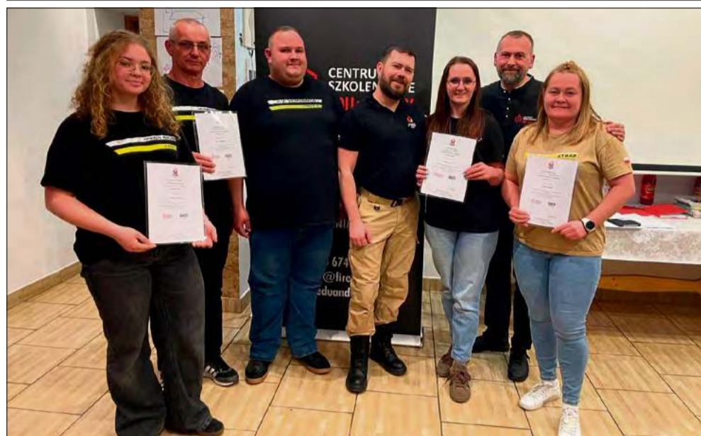
To było niezwykle wartościowe i inspirujące szkolenie dla ochotników OSP Steblów.

Troje opiekunów Ochotniczej Straży Pożarnej w Steblowie podniosło swoje kompetencje podczas kursu zorganizowanego przez specjalistów z Forum Instruktorów Ratownictwo i Edukacja Drużyn Pożarniczych. Zajęcia poświęcono przepisom dotyczącym pracy z nieletnimi oraz funkcji opiekuna jako lidera grupy.