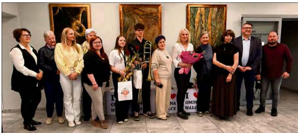
Wernisaż odbył się 24 kwietnia i miał także muzyczny akcent.

Nie była to tylko kolejna wystawa - to próba odpowiedzi na pytanie, jak dziś patrzymy na świat i samych siebie. W Centrum Kultury i Czytelnictwa w Walcach otwarto ekspozycję, która zostaje w głowie na dłużej.