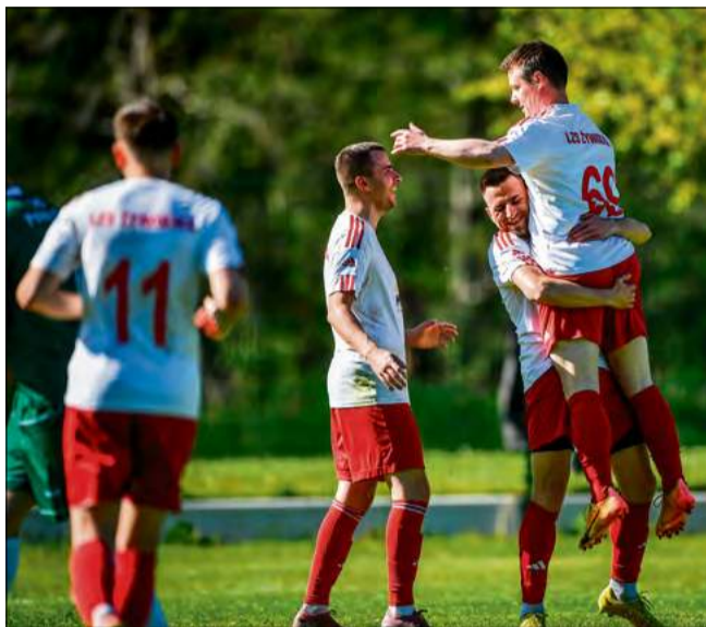
Po ostatnim gwizdku arbitra powody do radości mieli zawodnicy żywocickiego LZS-u.

Od mocnego uderzenia Żywociczanie rozpoczęli drugą połowę. Najpierw na 2-1 celnie przymierzył Jamkowy, a niespełna 120 sekund później idealnie w za-