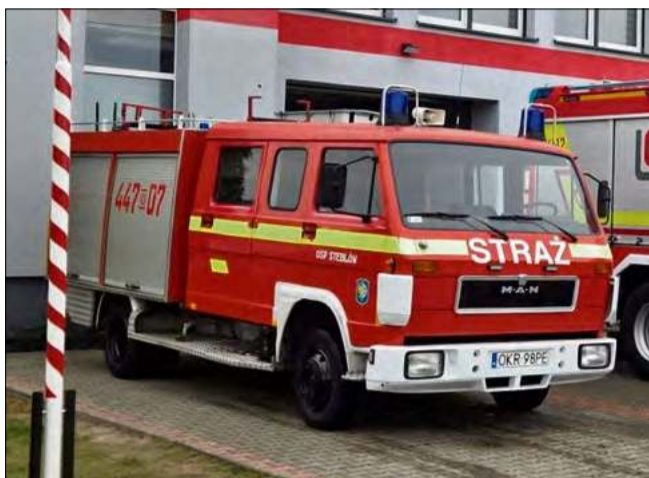
Wysłużony samochód pożarniczy MAN z jednostki OSP Steblów wkrótce trafi do partnerskiego miasta Rohatyn na Ukrainie.

Podczas kwietniowej sesji Rady Miejskiej w Krapkowicach zapadła decyzja o przekazaniu używanego wozu strażackiego z jednostki OSP Steblów na Ukrainę. Pojazd trafi do partnerskiego miasta Rohatyn jako forma pomocy rzeczowej.