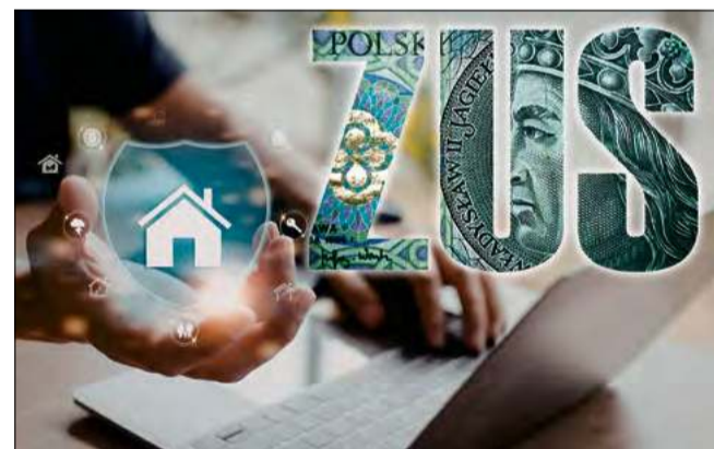
Elektronizacja jest ułatwieniem, a nie obowiązkiem.

Wniosek jest przeznaczony dla osób, które mają już przyznane prawo do emerytury lub renty z tytułu niezdolności do pracy i przy składaniu wniosku o świadczenie nie dysponowały wszystkimi dokumentami potwierdzającymi okresy ubezpieczenia, które można uwzględnić przy obliczaniu