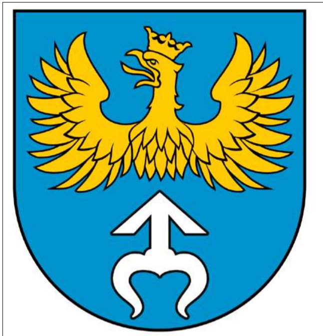
Herb oraz inne symbole mają istotne znaczenie dla identyfikacji jednostki samorządu terytorialnego.

Centralnym elementem nowej identyfikacji jest herb. Projekt zakłada tarczę późnogotycką z błękitnym polem. W jej górnej części znalazł się złoty, uszczerbiony herb książąt opolskich, czyli połowa orła znanego z symboliki regionu - województwa opolskiego. Dolną część tarczy zajmuje herb Odrowąż w kolorze srebrnym. To bezpośrednie nawiązanie do silnie zakorzenionego na tym terenie kultu św. Jacka Odrowąży oraz