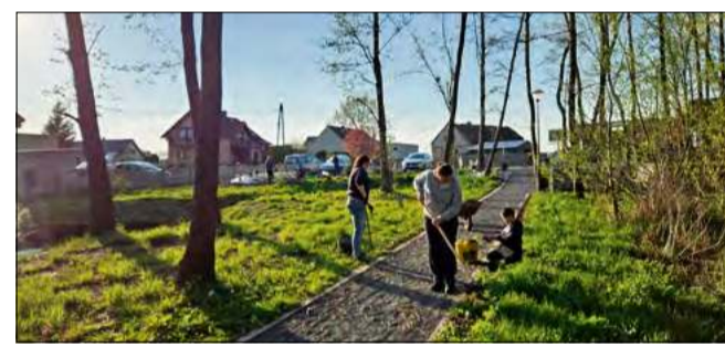
Akcja pokazała, że nawet niewielka grupa osób może realnie wpłynąć na wygląd i funkcjonowanie lokalnej przestrzeni.

Ważnym punktem będzie także kiermasz książek (15 maja), który potrwa od rana do wieczora. Przez cały tydzień działać będą też dodatkowe inicjatywy – m.in. możliwość oddania zaległych książek bez konsekwencji oraz akcja „Weź i daj się zaskoczyć”, polegająca na wypożyczaniu zapakowanych książek w ciemno.