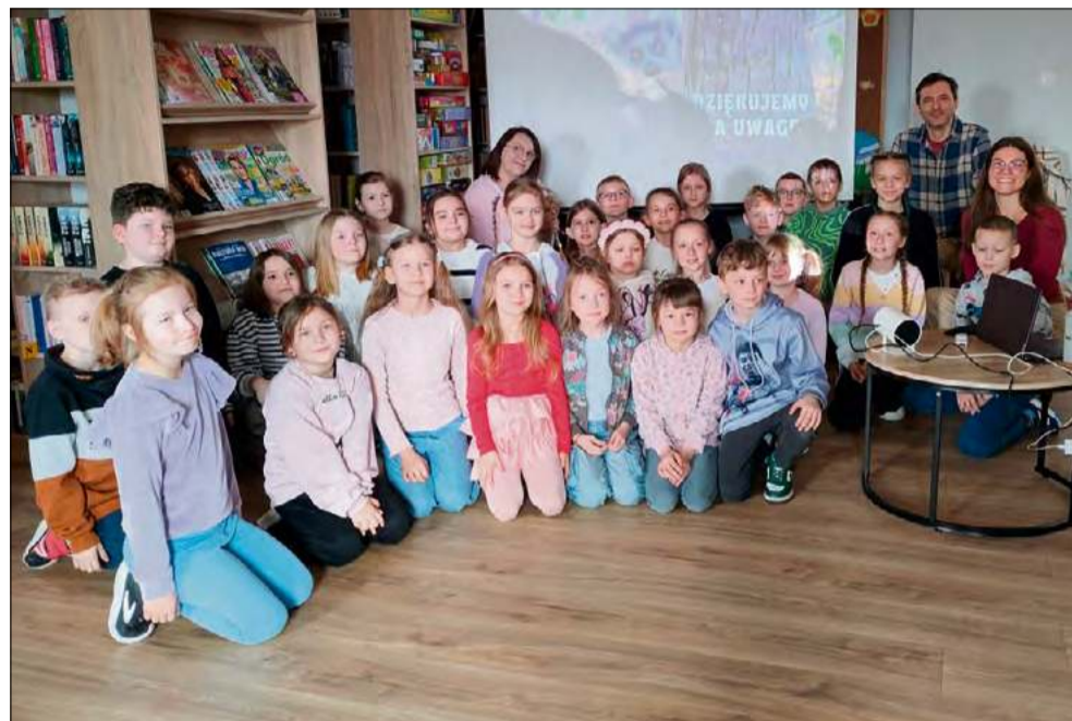
Dzieci z ogromnym zaangażowaniem zadawały pytania prowadzącym.