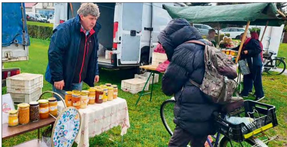
Czwartkowe popołudnie pełne smaków – „Straganik” na Placu Eichendorffa kusi regionalnymi przysmakami i domową jakością.

Miód z pasieki, wędzone ryby, domowe ciasta, zdrowe kiszonki, rzemieślnicze sery, pyszne wędliny, oleje, żywe octy, warzywa i owoce - w tym tygodniu krapkowicki Plac Eichendorffa znów wypełni się zapachem przeróżnych specjałów.