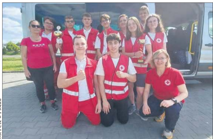
OR PCK w Płocku

W etapie okręgowym Ogólnopolskich Mistrzostw Pierwszej Pomocy PCK drużyna „Elektryka” zajęła drugie - a drużyna III LO - trzecie miejsce