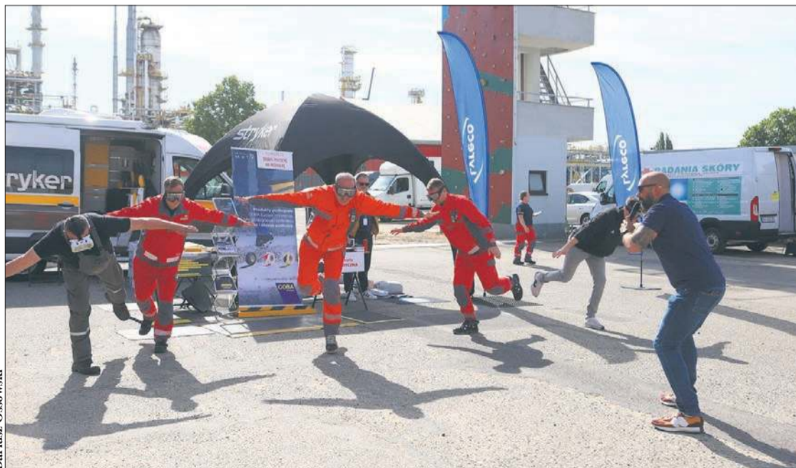
Po założeniu alkogogli i narkogogli można się było przekonać, jak reaguje organizm w odmiennych stanach świadomości