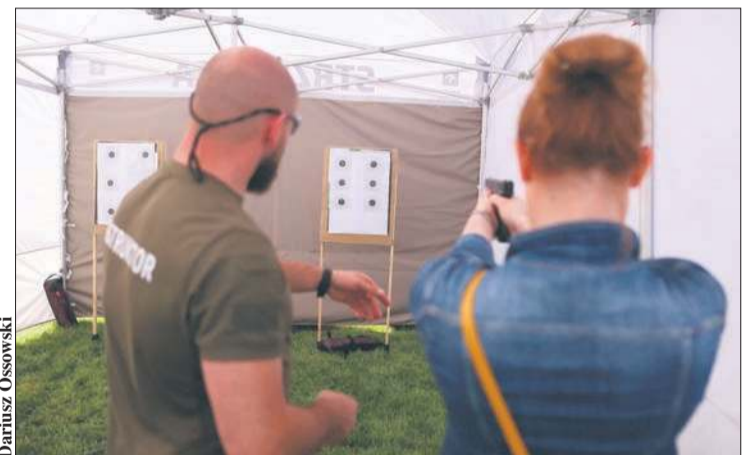
ORLEN Ochrona zaprosiła chętnych do namiotu, gdzie kryła się strzelnica