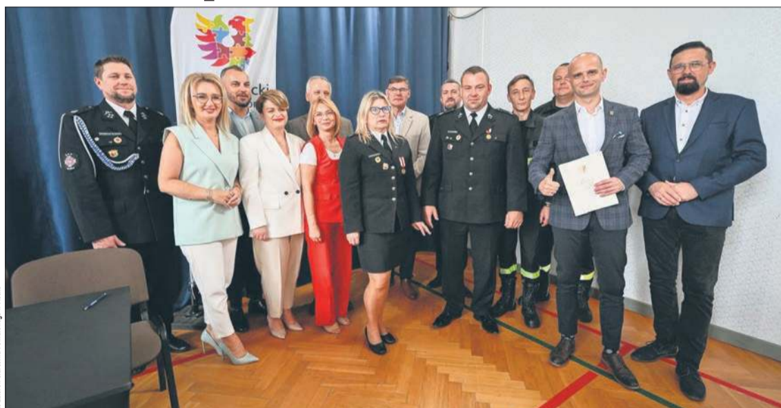
Beneficjentami programu zostali m.in. strażacy z terenu gminy Bielsk