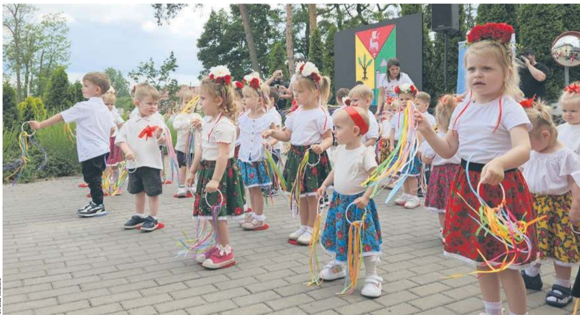
Dzieci uczęszczające do żłobka przygotowały występ artystyczny

który wtedy otrzymaliśmy, powinien trafić do naszego żłobka. Właśnie dlatego przekazuję go na ręce pani dyrektor – powiedział wójt.