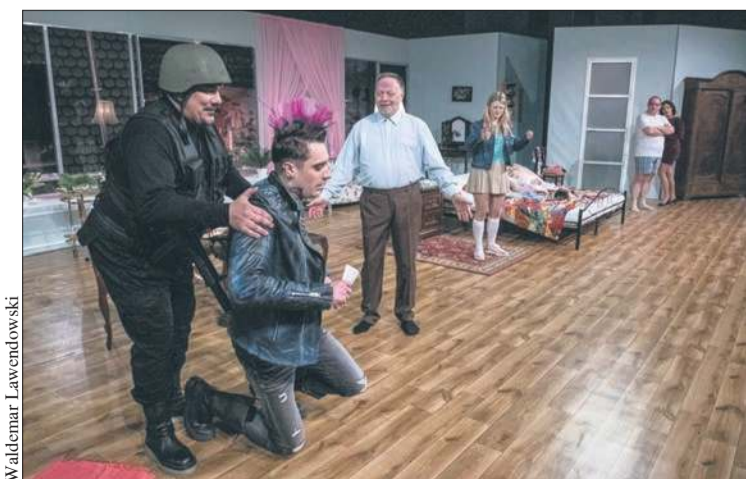
Spektakl „Gdzie jest garnitur?” w reż. Stefana Friedmanna

- Pomyśleliśmy o wszystkich, o najmłodszej i najstarszej publiczności, a także o osobach ze szczególnymi potrzebami. Zatem każdy będzie mógł