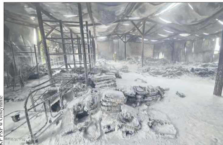
Hala przemysłowa po pożarze

Zmarł kapelan plockiego szpitala oraz DPS-u w Brwilnie