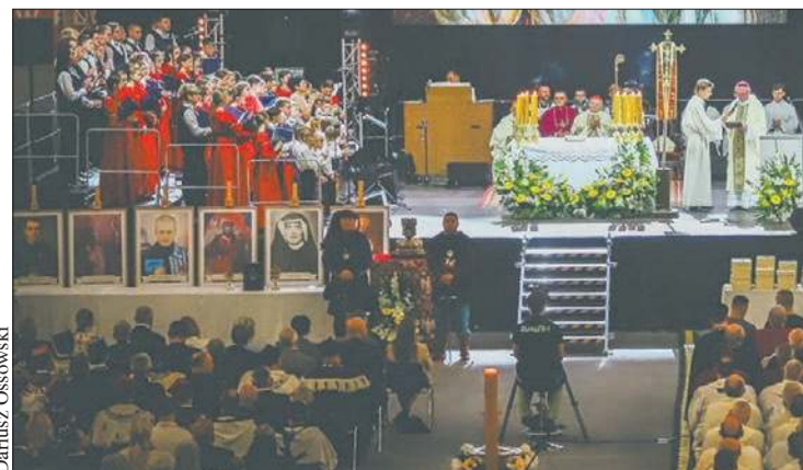
Podczas obchodów jubileuszowych wystawiono hermę św. Zygmunta, przy której wartę honorową pełnili członkowie Płockiej Drużyny Kuszniczej