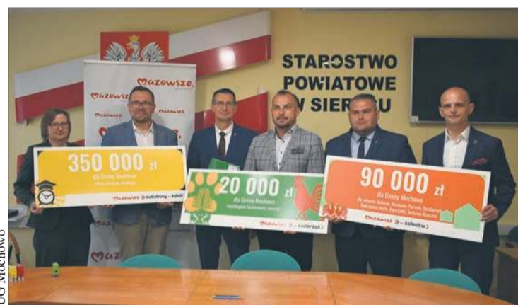
Gmina Mochowo otrzymała środki na realizację 4 projektów