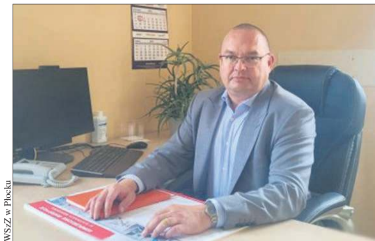
WSZ w Płocku

Pracę w Wojewódzkim Szpitalu Zespolonym w Płocku rozpoczął w maju 2009 roku.