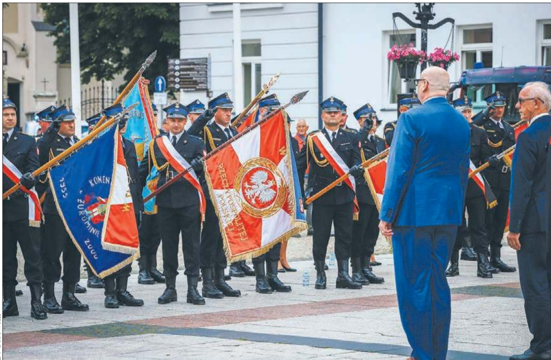
Uroczystości z okazji Mazowieckiego Dnia Strażaka odbyły się w ubiegłym tygodniu na Starym Rynku w Płocku