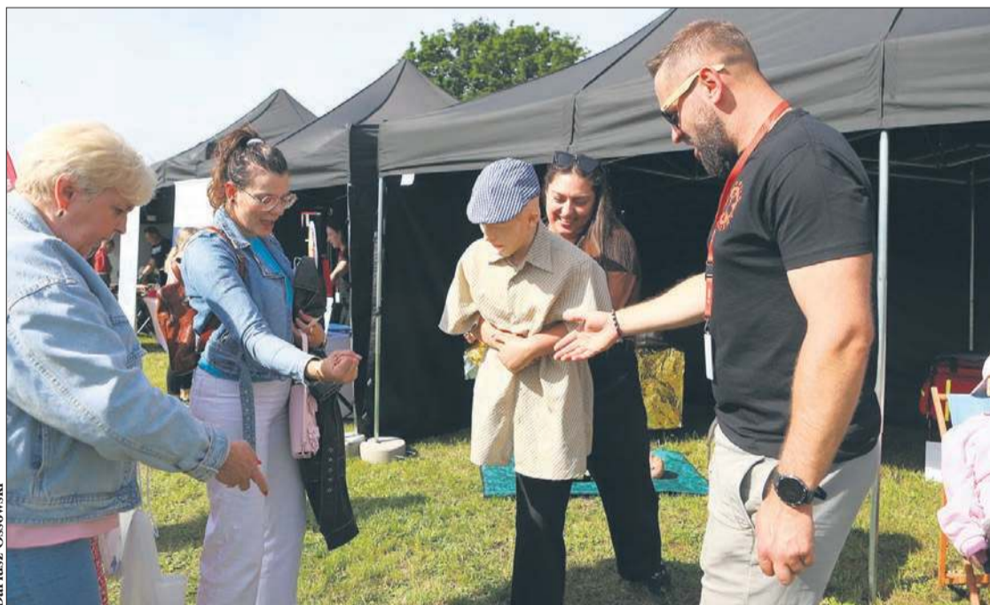
Podczas warsztatów z pierwszej pomocy przedmedycznej ratownicy udzielali cennych wskazówek