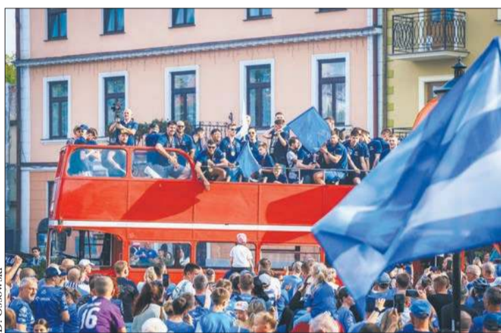
5 czerwca - feta z okazji mistrzostwa Polski szczypiornistów

Po raz dziewiąty w historii i drugi z rzędu ORLEN Wisła mistrzem Polski