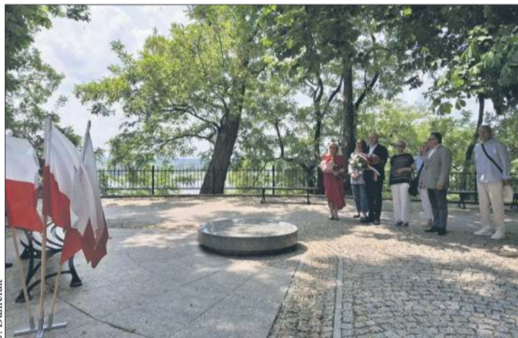
Obchody rocznicy wyborów z 1989 roku w Płocku