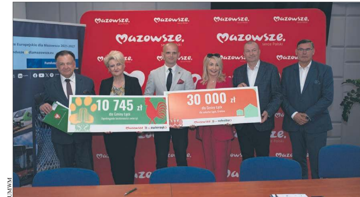
Wśród beneficjentów znalazła się m.in. gmina Łąck

Sejmik Mazowsza dofinansowuje zakup autobusów szkolnych dowożących dzieci do mazowieckich szkół. W regionie płockim i ciechanowskim samorząd województwa dofinansował zakup 13