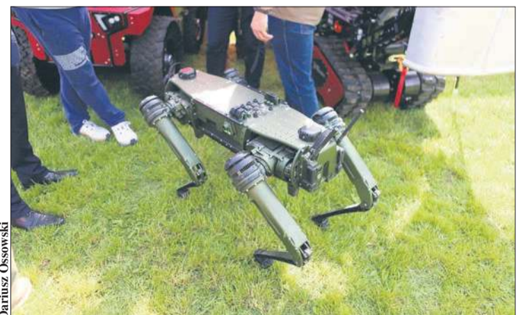
Na stoiskach prezentowano nowoczesne technologie monitorowania zabezpieczenia technicznego