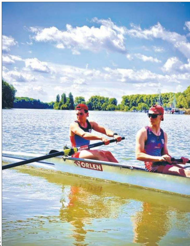
Płocka dwójka bez sternika