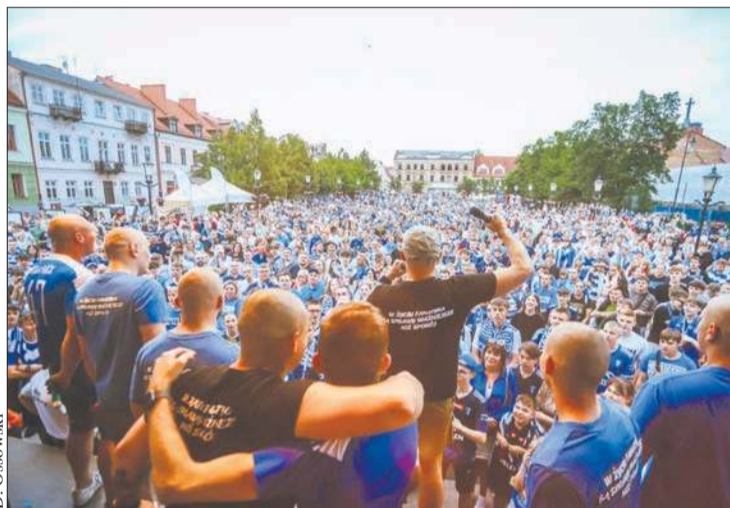
30 maja - feta z okazji awansu piłkarzy nożnych do Ekstraklasy