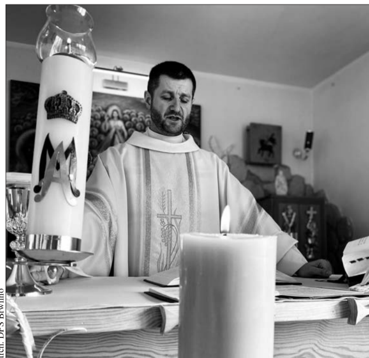
arch. DPS Brwilno

Spotkanie prezydenta z mieszkańcami osiedla Skarpa