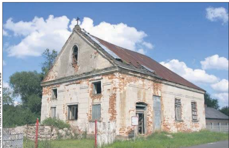
Muzeum Mazowieckie w Płocku