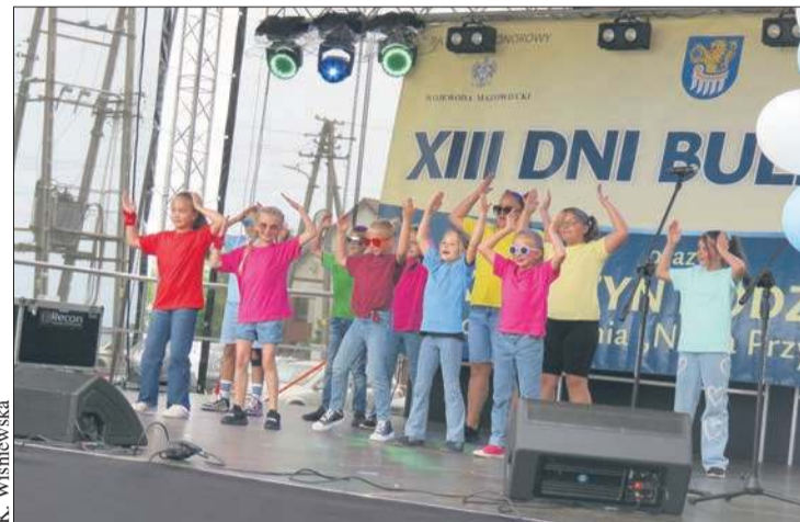
Na scenie zaprezentowali się też najmłodsi mieszkańcy gminy

Głos zabrała również obecna na uroczystości posłanka Wioletta Kulpa, która pogratulowała wójtowi sprawnego kierowania gminą. - To przepiękne święto – tradycja, którą kontynuują państwo, i która z roku