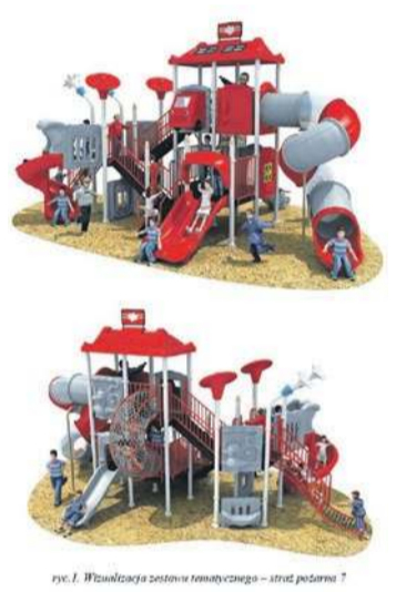
rys. 1. Wznowienie placu zabaw – straż pożarna 7