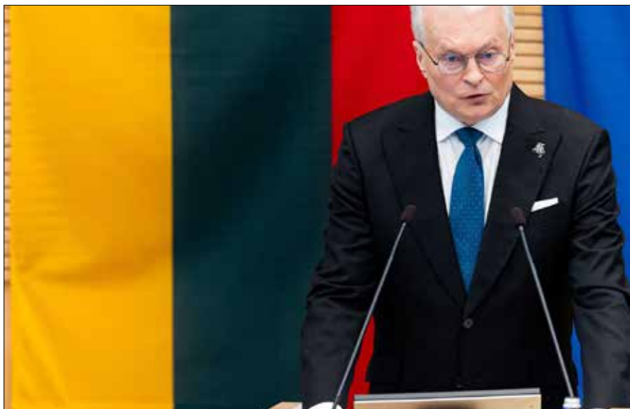
Prezydent wygłosił siódme w swej karierze orędzie

16 czerwca Gitanas Nausėda wygłosił w Sejmie tradycyjne, roczne orędzie. To było siódme jego orędzie. „Od pewnego czasu obserwujemy, jak łatwo wszelkie różnice zdań stają się pretekstem do publicznego »polowania na czarownice«. Jak szybko argumenty ustępują miejsca atakom personalnym, nieprzyzwoitym