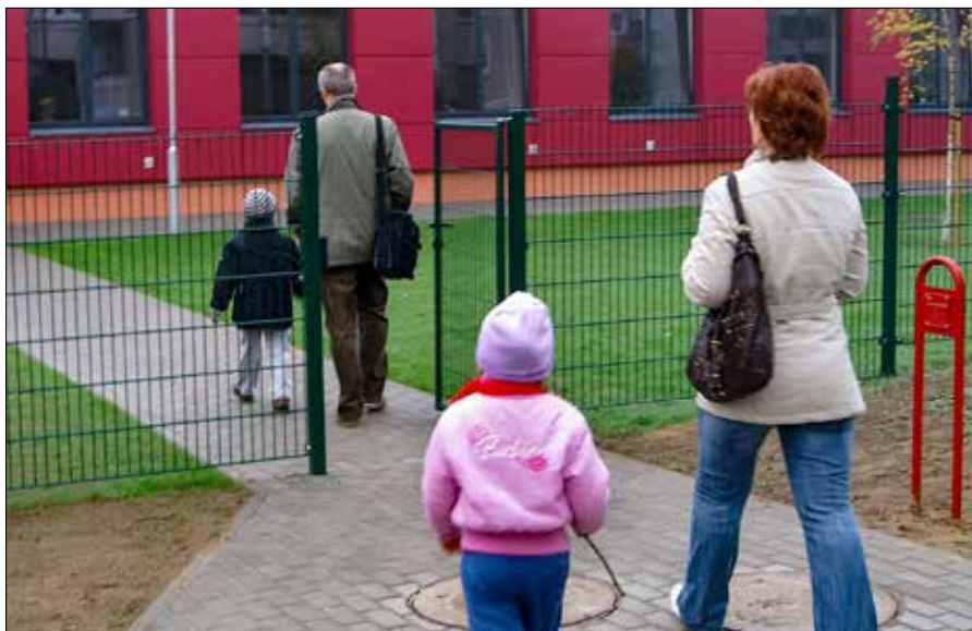
Nowe systemy bezpieczeństwa mają zwiększyć ochronę dzieci i pracowników w wileńskich przedszkolach

„Naszym celem jest zapewnienie bezpieczeństwa najmłodszym mieszkańcom Wilna. Chcemy, aby rodzice i pracownicy przedszkoli czuli się spokojni, a dzieci dorastały w bezpiecznym otoczeniu. Dlatego konsekwentnie inwestujemy w rozwiązania, które zapew-