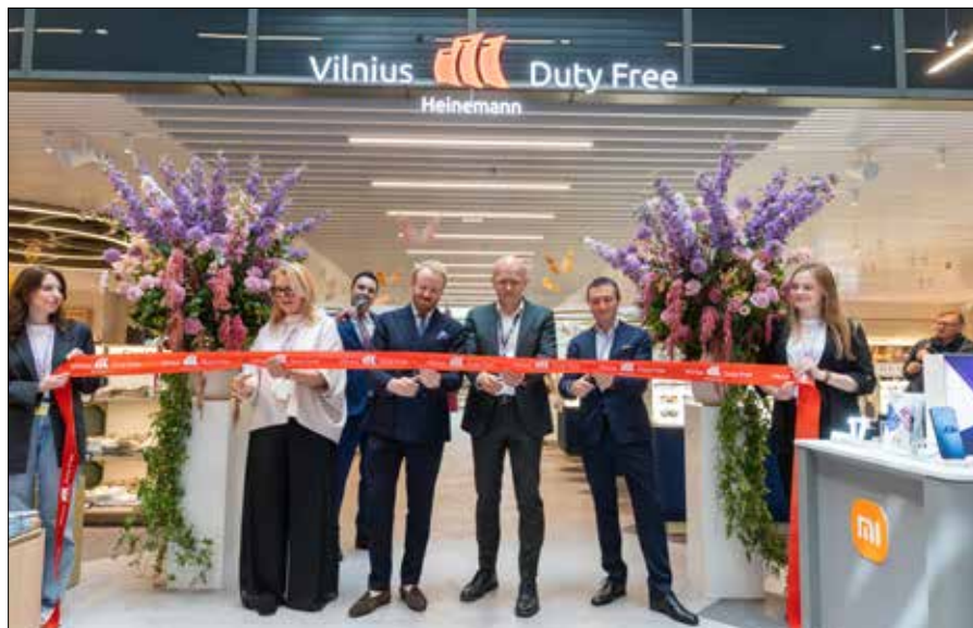
Oficjalne otwarcie odnowionej przestrzeni. Wartość projektu przebudowy starego terminala odlotów wynosi 15 mln euro

„Nowoczesne lotnisko oraz szeroka siatka połączeń bezpośrednich są niezbędne do podnoszenia konkurencyjności miasta. Dlatego Samorząd Miasta Wilna od wielu lat realizuje program wspierania połączeń bezpośrednich, który pomaga otwie-