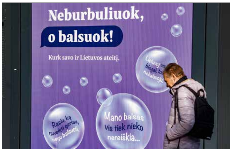
Litwa zaczyna iść ku nowelizacji Kodeksu Wyborczego

Druga ze zmian przewidzianych w projekcie dotyczy wy-