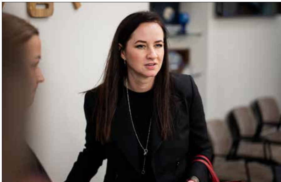
■ Inga Ruginiene została premierem pod koniec sierpnia 2025 r.