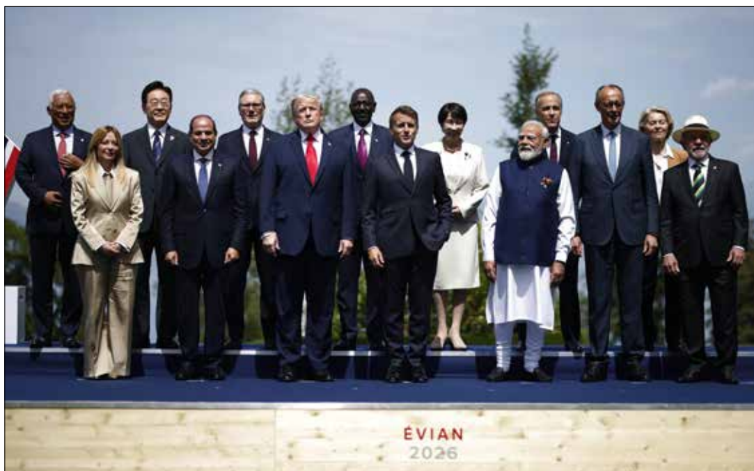
Liderzy G7 we francuskim Evian zapowiedzieli wzmocnienie sankcji na rosyjską ropę i gaz