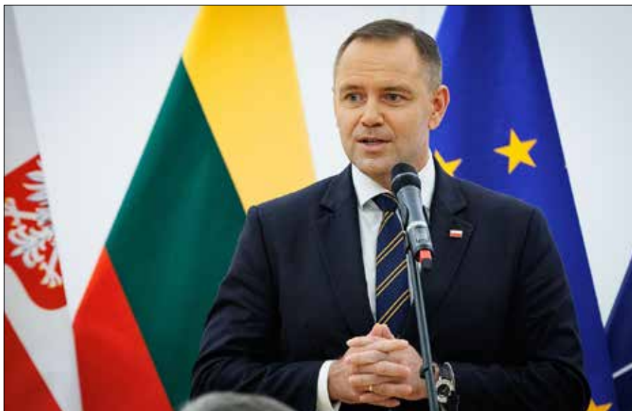
Gitanas Nausėda zaznaczył, że rozmawiał z Karolem Nawrockim o wspólnej polsko-litewskiej wolnej strefie ekonomicznej

„Szczególnie cieszy obecny stan relacji z Polską. Ścisłe współpracujemy, realizujemy wspólne projekty infrastrukturalne i związane z mobilnością wojskową, a także regularnie organizujemy dwustronne ćwiczenia wojskowe. W styczniu wraz z prezydentem Polski, Karolem Nawrockim,