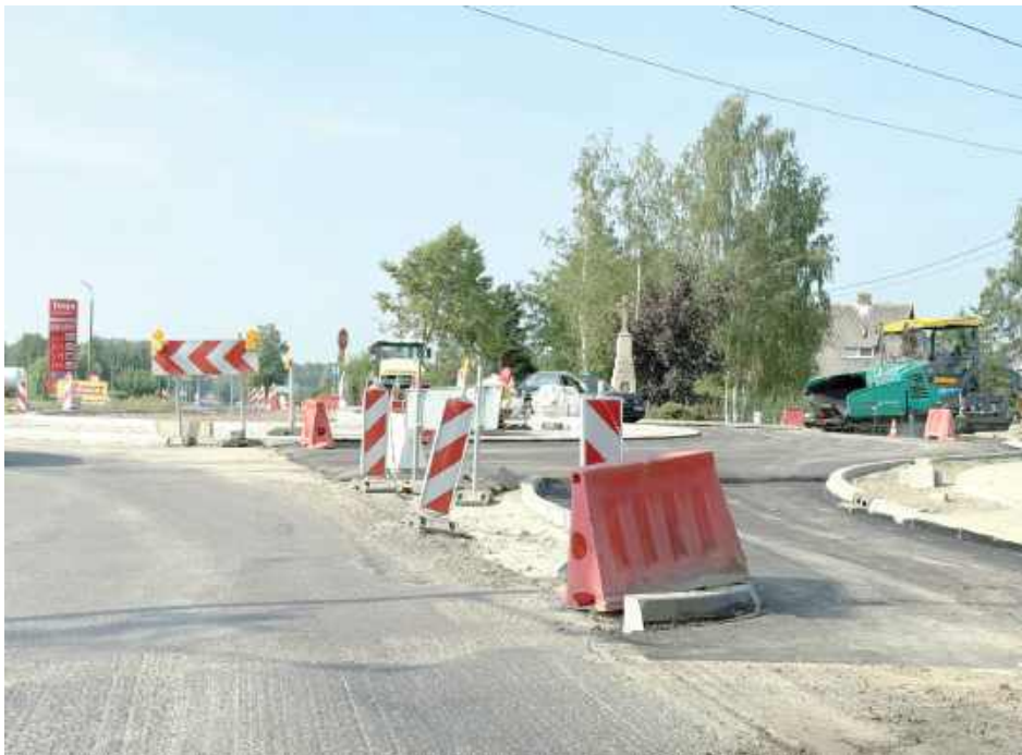
Firma realizująca inwestycję jest na etapie kładzenia asfaltu

Jeśli wszystko pójdzie zgodnie z planem, to już w październiku kierowcy będą mogli korzystać z nowego ronda, jakie powstaje na drodze wojewódzkiej 824 między Puławami a Żyrzynom. Jak informują władze gminy Końskowola, prace są na ukończeniu. Drogowcy są na etapie wylewania asfaltu.