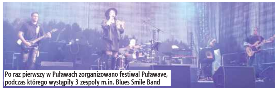
Po raz pierwszy w Puławach zorganizowano festiwal PuławaWave, podczas którego wystąpiły 3 zespoły m.in. Blues Smile Band