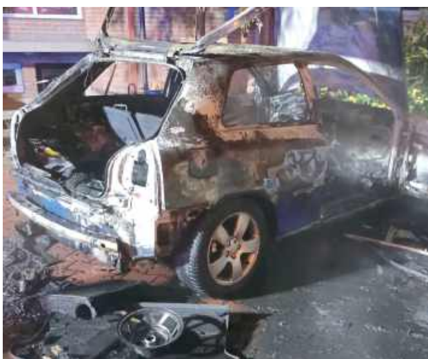
Osobowe Audi spaliło się doszczętnie. Na szczęście podróżującym nim osobom nic się nie stało

Podczas jazdy spod maski zaczął wydobywać się dym. Kierowca próbował sam ugasić pożar, ale nie pomogła nawet interwencja strażaków. Auto spłonęło doszczętnie.