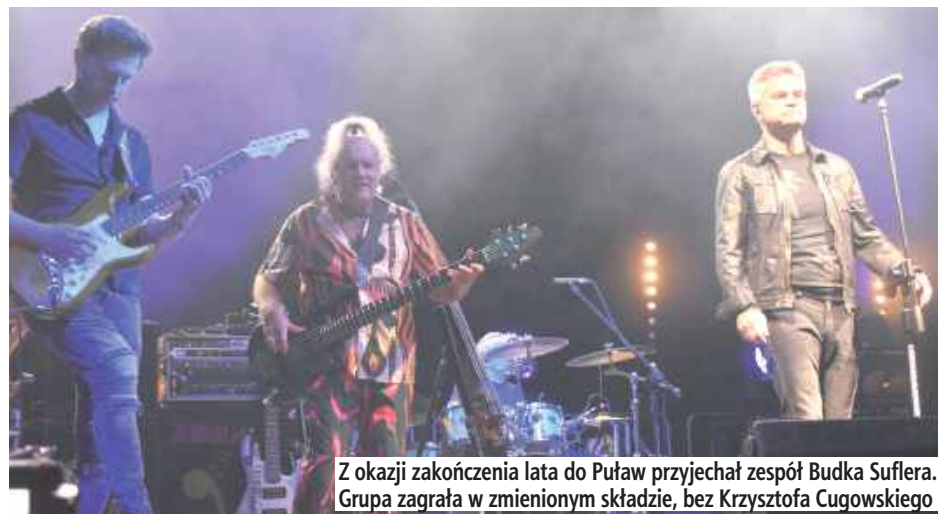
Z okazji zakończenia lata do Puław przyjechał zespół Budka Suflera. Grupa zagrała w zmienionym składzie, bez Krzysztofa Cugowskiego