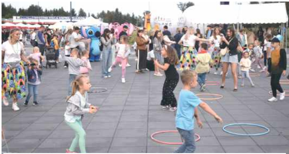
Dzieci w różnym wieku mogły wziąć udział w animacjach. Chętnych do wspólnej zabawy nie brakowało