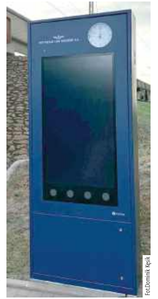
Nowością na dworcu jest także wyświetlacz informacyjny pokazujący przyjazdy i odjazdy pociągów

w tym miejscu - brak wystarczającej liczby miejsc parkingowych. Na terenie należącym do miasta znajduje się obecnie 25 stanowisk postojowych. To jednak zdecydowanie za mało, zwłaszcza że nie zawsze udaje się znaleźć wolne miejsce, nawet gdy chcemy zostawić samochód jedynie na kilkanaście minut. Część kierowców pozostawia swoje auta na kilka godzin, a zdarzają się również przypadki zajmowania miejsc przez kilka dni. Choć w ubiegłym roku ustawiono znak ograniczający czas parkowania do jednej godziny, nie przyniosło to spodziewanego efektu.