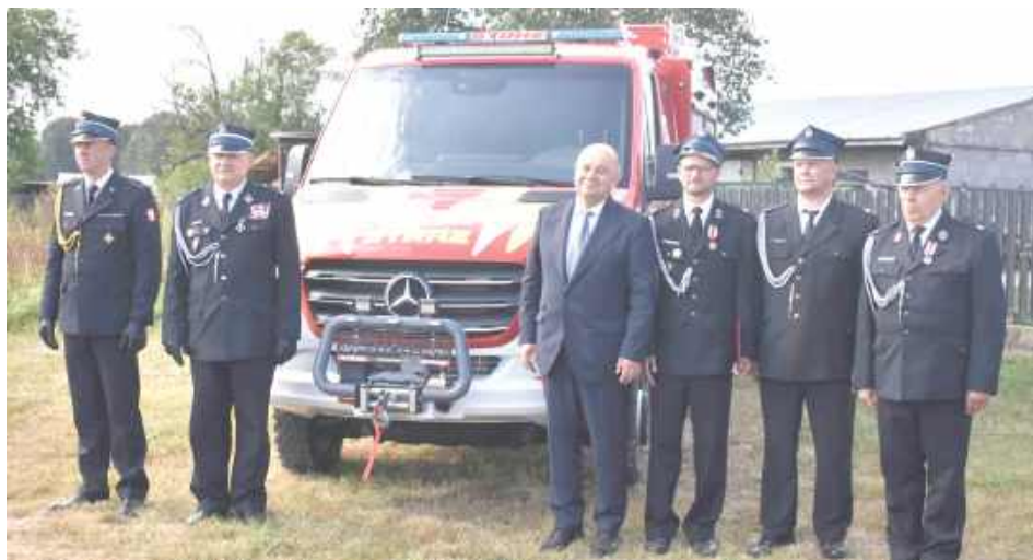
Od teraz strażacy z Kozła mają do dyspozycji nowy, lekki wóz ratowniczo-gaśniczy marki mercedes

Mieszkańcy wsi i okolic spotkali się na obchodach z okazji 60-lecia istnienia Ochotniczej Straży Pożarnej. Podczas wydarzenia wręczono jednostce sztandar, przekazano proporzec dla Młodzieżowej Drużyny Pożarniczej, odznaki dla druhów oraz poświęcono nowy samochód.