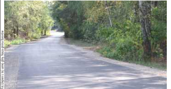
Zmodernizowana droga ma 452 metry długości

Gm. Baranów: W Pogonowie zakończono modernizację drogi dojazdowej do gruntów rolnych, która znacząco poprawi warunki komunikacyjne dla mieszkańców i rolników.