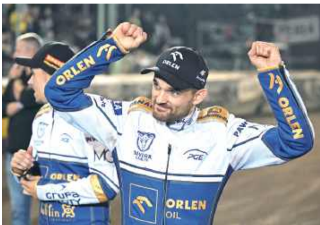
Żużlowcy z Lublina piąty raz z rzędu pojedą w finale

W meczu wyjazdowym żużlowcy z Lublina wygrali z rywalami 47:43 i byli bliżej awansu do wielkiego finału. Wystarczyło oczywiście ponownie wygrać z siebie albo chociaż nie roztrwonąć przewagi czterech punktów. Pierwsza seria pokazała jednak, że GKM jest zespołem silnym i bardzo zadziornym, bo wynik wskazywał jedynie 14:10 dla Motoru po dwóch wygranych 4:2 i dwóch remisach. Druga seria bez równania okazała się jeszcze bar-