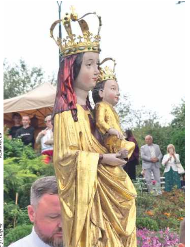
Cudowna figura Matki Bożej Kębelskiej znana jest z wielu cudów. W tym roku w księdze cudów zapisano kolejne cztery