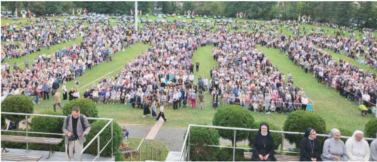
Pielgrzymi jak co roku licznie zgromadzili się na wąwolnickich błoniach