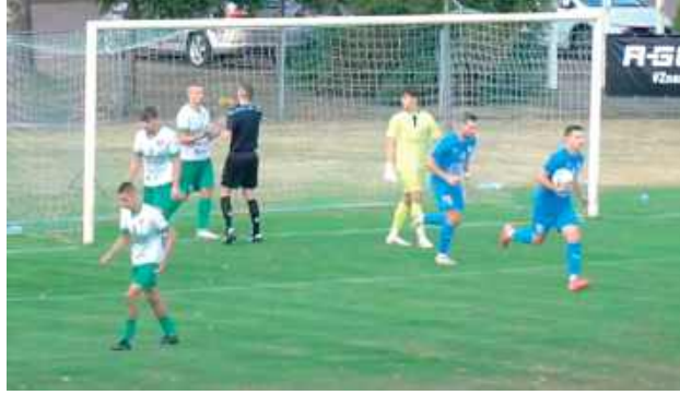
Lewart doznał pierwszej porażki w sezonie. W sobotę kolejny bój. Tym razem z Orłętami Łuków

Lewart nie zamierzał się jednak poddawać. W doliczonym