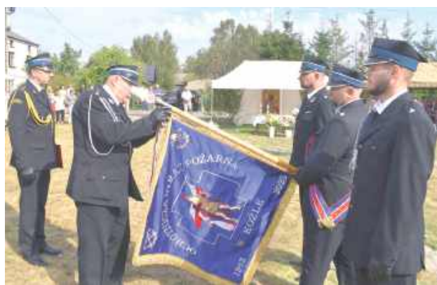
Podczas uroczystości jednostce z OSP z Kozła nadano i przekazano sztandar

Z okazji okrągłego jubileuszu przygotowano uroczystości. Po zbiorce gminnych jednostek i pocztów sztandarowych, od-