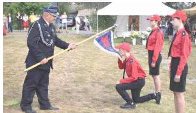
Uroczystości miały szczególny charakter dla Młodzieżowej Drużyny Pożarniczej w Kozle, która funkcjonuje od 2021 r. W szeregach MDK działa 40 osób. W sobotę jej przedstawiciele odebrali poświęcony proporzec

Ważnym momentem było również przekazanie jednostce nowego samochodu ratowniczo-gaśniczego marki Mercedes. Po głównej części uroczystości mieszkańcy mogli obejrzeć defiladę pocztów sztandarowych,