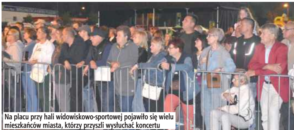
Na placu przy hali widowiskowo-sportowej pojawiło się wielu mieszkańców miasta, którzy przyszedli wysłuchać koncertu