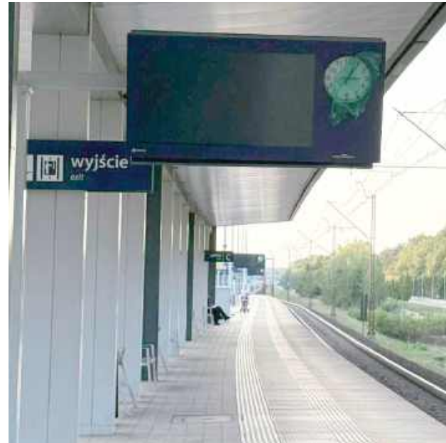
Na głównym peronie stacji Puławy Miasto pojawiły się nowe tablice informacyjne. Teraz podróżni czekający na pociąg będą mogli łatwo sprawdzić, czy przyjedzie on punktualnie

Od niedawna na stacji w Puławach można jednak zauważyć istotne zmiany. Pojawiły się nowoczesne elektroniczne tablice informacyjne na peronach oraz w rejonie wejścia. Choć jeszcze nie zostały uruchomione, już wkrótce w czytelny sposób będą prezentować aktualne dane o ruchu pociągów.