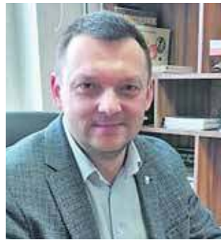
Michał Skrzydło pożegnał się ze stanowiskiem burmistrza w 2024 roku