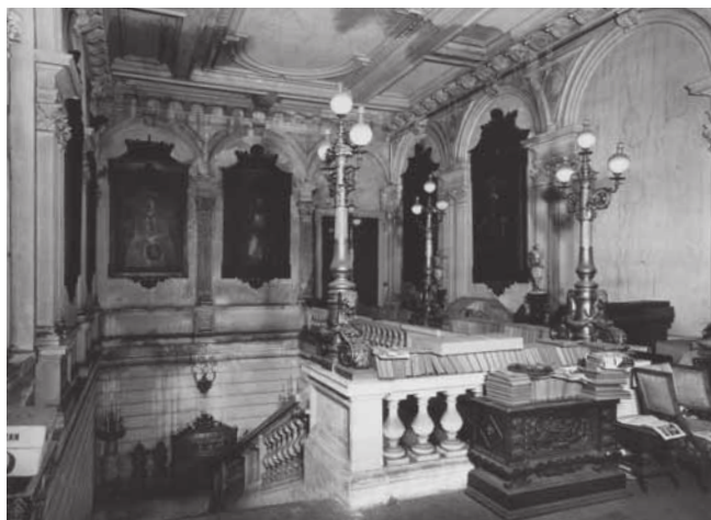
Wnętrze pałacu Hugona Henckel von Donnersmarcka w Wiedniu