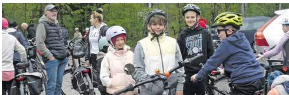
Trasa wiodła do Kalet