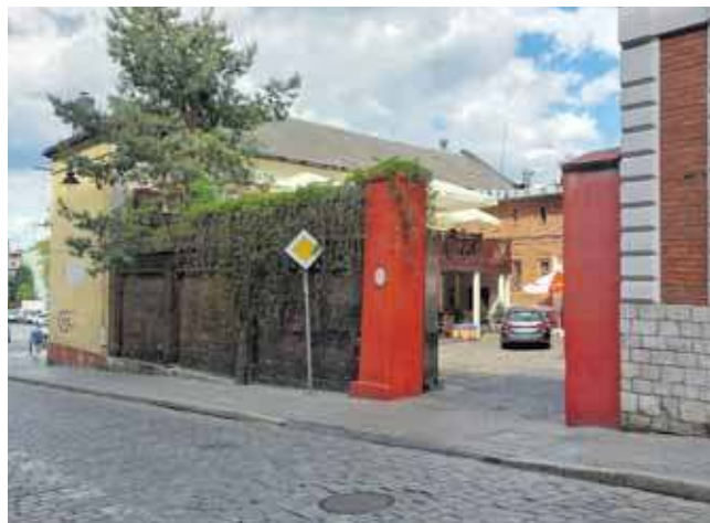
Do tej pory kamienicę przy ul. Strzeleckiej 1 próbowano sprzedać trzykrotnie. Bez powodzenia

Na działce stoi budynek usługowy z około 1886 roku, wpisany do „Gminnej ewidencji zabytków” i objęty ochroną konserwatorską. Obiekt składa się z dwóch części: