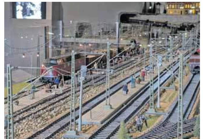
Podczas Nocy Muzeów czynny będzie Dworzec Kultury w Tarnowskich Górach, gdzie można oglądać makietę kolejową