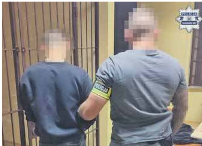
Do zdarzenia doszło podczas zakrapianej alkoholem imprezy

Napastnicy zaczęli bić i kopać 37-letniego mężczyznę, po czym siłą odebrali mu telefon komórkowy. Na tym