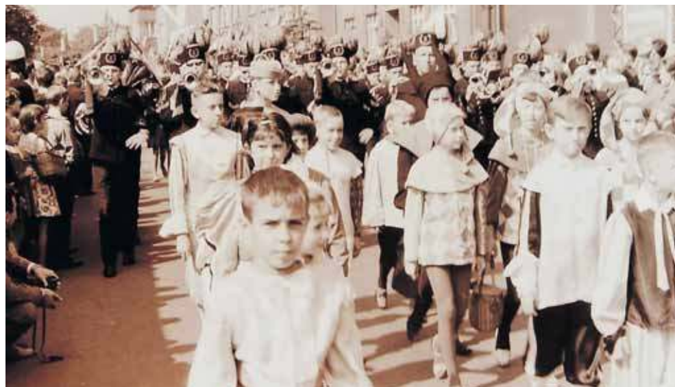
Pochód gwarkowski ulicami miasta