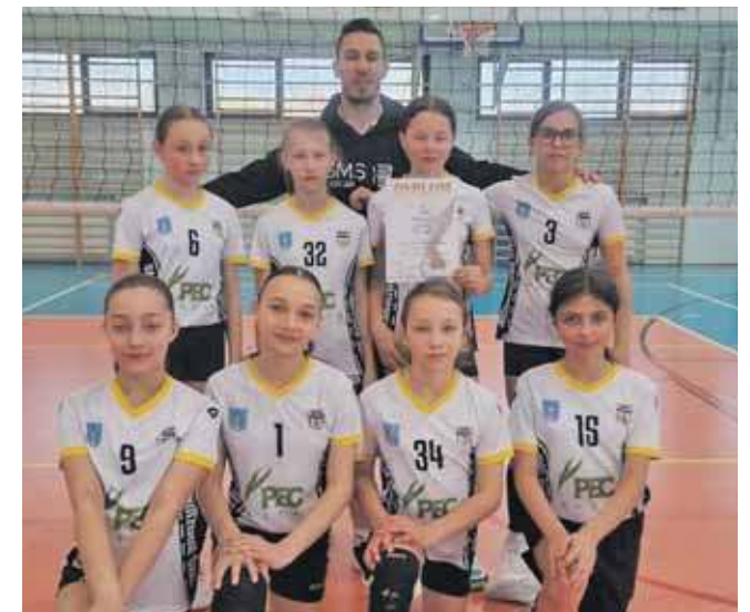
Uczennice Szkoły Mistrzostwa Sportowego w Radzionkowie zdobyły II miejsce w półfinałach wojewódzkich