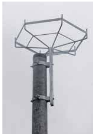
Platforma lęgowa czeka na bociany

Realizacja inwestycji była możliwa dzięki wsparciu przez Wojewódzki Fundusz Ochrony Środowiska i Gospodarki Wodnej w Katowicach. Projekt otrzymał dotację w wysokości 176 tys. zł w ramach II edycji konkursu „Zielona Przestrzeń”.