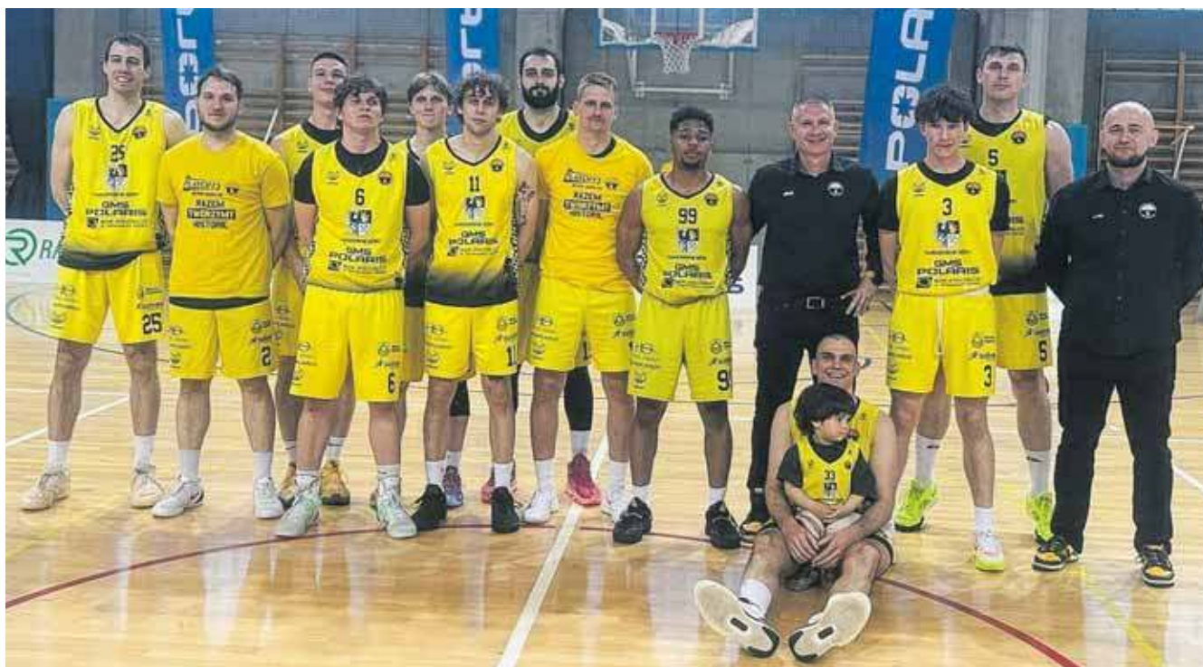
Koszykarze z Tarnowskich Gór wciąż w grze

Drugie starcie na wyjeździe było w niedzielę, 10 maja. W meczu z PGE Turów Zgorzelec koszykarze z Tarnowskich Gór wygrali 93:82. – W hali faworyta, przy pełnych trybunach, pod ogromną presją, a mimo to wyszli na parkiet i pokazali, że serce tej drużyny jest ogromne – komentuje KKS Tarnowskie Góry. (ESP)