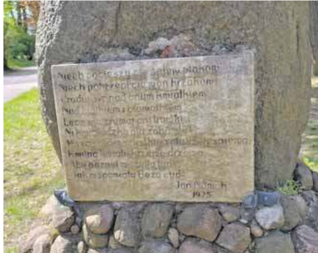
Tablica wymaga odnowienia

– Od dwóch lat zwracam na to uwagę. Byłem w urzędzie