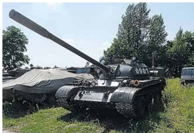
Noc Muzeów w Zbrosławicach to niepowtarzalna okazja, by z bliska zobaczyć imponujące pojazdy wojskowe

Noc Muzeów w Zbrosławicach to niepowtarzalna okazja, by z bliska zobaczyć imponujące pojazdy wojskowe oraz sprzęt militarny, który na co dzień nie jest dostępny dla szerokiej publiczności. Tegoroczna edycja zapowiada się szczególnie atrakcyjnie – organizatorzy przygotowali premiery nowych eksponatów, które po raz pierwszy zostaną zaprezentowane odwiedzającym.