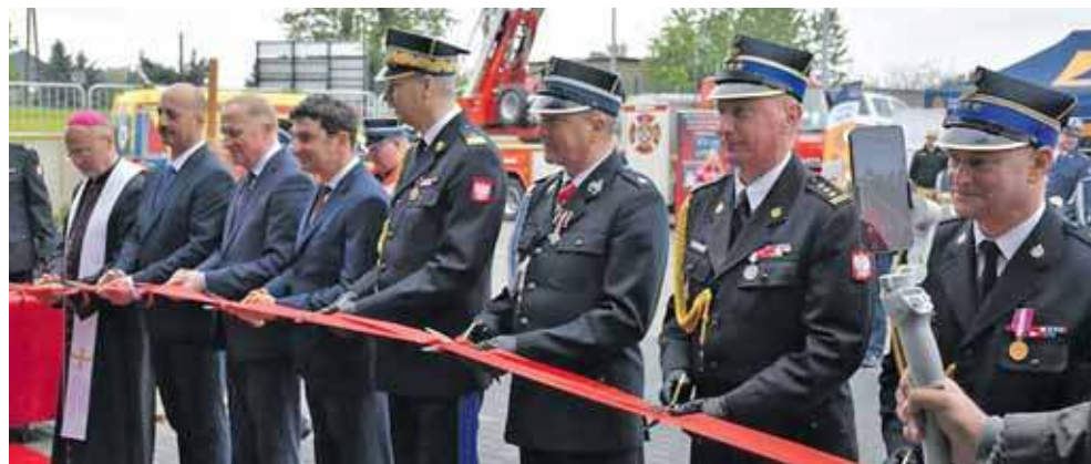
Ceremonia przecięcia wstęgi

W nowym obiekcie utworzono również nowoczesne Centrum Edukacji Bezpieczeństwa „Ognik”. Sala edukacyjna została podzielona na sześć stref tematycznych, które uczą najmłodszych mieszkańców zasad bezpieczeństwa poprzez realistyczne scenografie i interaktywne elementy.