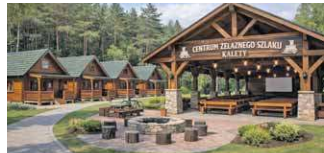
Wizualizacja Centrum Żelaznego Szlaku, które powstaje w Kaletach

Nowa infrastruktura obejmie także zadaszoną multimedialną wiatę turystyczną, która umożliwi organizację