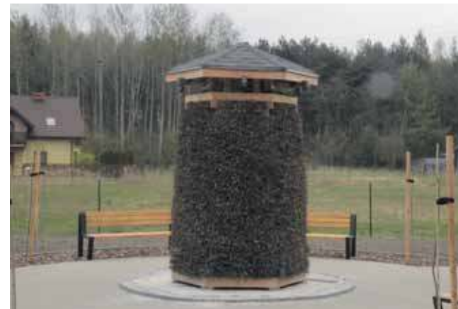
W centrum znajduje się teźnia solankowa

Jak podkreślają organizatorzy konkursu, inicjatywa