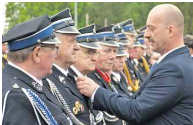
Obchody Dnia Strażaka to okazja do wręczenia odznaczeń

Nowa siedziba Komendy Powiatowej PSP wraz z Jednostką Ratowniczo-Gaśniczą została wybudowana na działce o powierzchni 1,5 hektara. Dwukondygnacyjny budynek ma ponad 3 tysiące metrów kwadratowych powierzchni użytkowej.