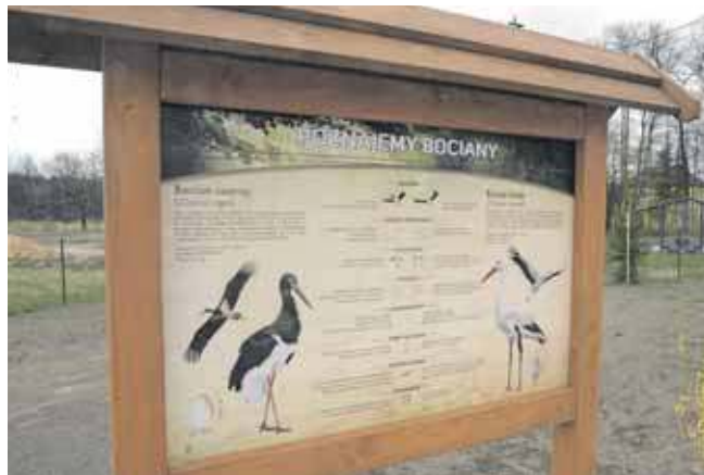
W Zielonej ustawiono kilka tablic edukacyjnych o tematyce ornitologicznej

W ramach zadania zrealizowano kompleksową aranżację terenu przy ul. Ofiar Katynia. Powstały m.in.: - teźnia solankowa,