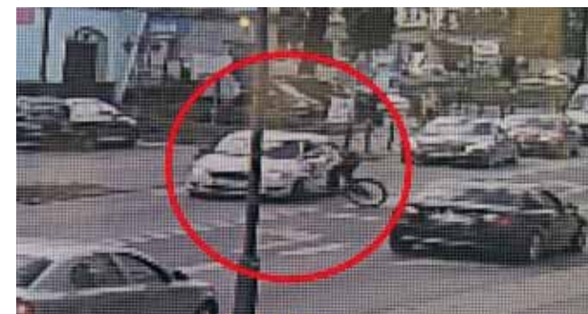
Rowerzystka wjechała wprost w Skodę