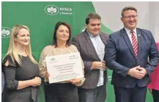
W poprzedniej edycji konkursu dofinansowanie otrzymała Szkoła Podstawowa im. Jana Pawła II w Boniowicach