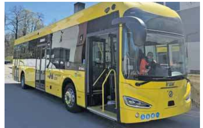
To model debiutujący w Górnośląsko-Zagłębiowskiej Metropolii

– Do naszej floty dołączy 7 nowoczesnych, w pełni elektrycznych autobusów Irizarie bus 12 – informuje PKM Świerklaniec.