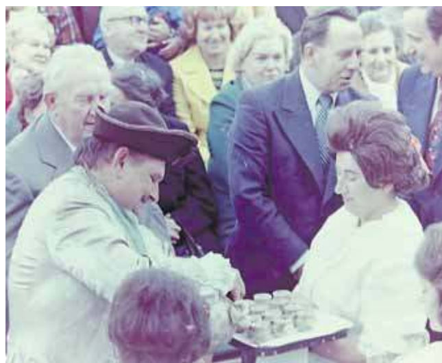
Sedlaczek częstuje winem