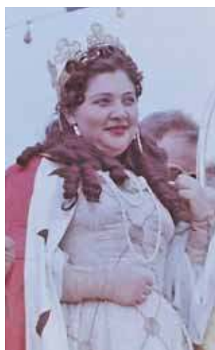
Marysieńka sprzed lat

Zobaczcie, jak bawiliśmy się na Gwarkach lata temu i jak wówczas wyglądał gwarkowski pochód. (esp)