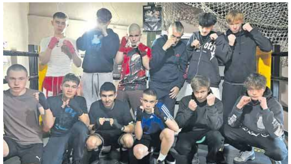
Boks uczy umiejętności, które przydają się w życiu

Co ciekawe, treningi są bezpłatne. – Prowadzę je z pasji, nie po to, żeby zarobić. Pasja jest potrzebna, żeby robić coś dobrze. Po prostu zależy mi na tych młodych ludziach. Kiedy byłem w ich wieku nie mieliśmy dostępu do klubów sportowych, nie mieliśmy gdzie się pożytywnie wyszumieć, nauczyć