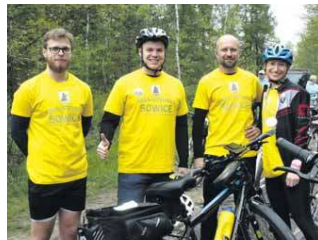
Na rajd zaprosiła Rada Dzielnicy Sowice

Do pokonania była ok. 30-kilometrowa trasa do ścieżki dydaktycznej Kalety Truszczyca Trzy Dęby. (ESP)