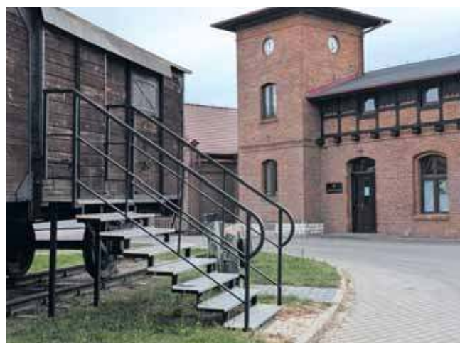
W programie wydarzenia znalazło się zwiedzanie wystawy stałej z przewodnikiem

Przez cały czas trwania wydarzenia dostępna będzie również wystawa czasowa „Mieli wrócić za 14 dni”.