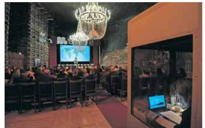
Choć Wieliczka i Tarnowskie Góry mają różne rodowody, płynie z nich ta sama lekcja: skuteczna transformacja kopalni w obiekt muzealny wymaga działania jeszcze na etapie aktywnej eksploatacji złóż

– Nasze rodzime doświadczenia pokazują, jak ważne jest myślenie o kopalniach z dużym wyprzedzeniem. Proces ich zamykania powinien być jednocześnie procesem otwierania muzeum