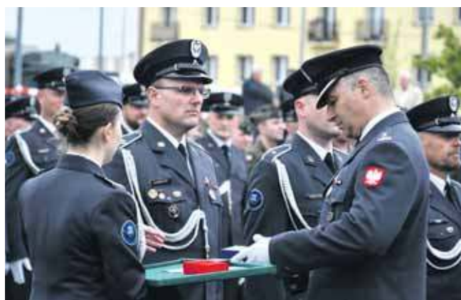
Nie zabrakło odznaczeń, wyróżnień, listów gratulacyjnych i awansów

– Jesteśmy służbą niewidoczną, ale właśnie to jest naszą siłą. Stanowimy pierwszą linię obrony, od