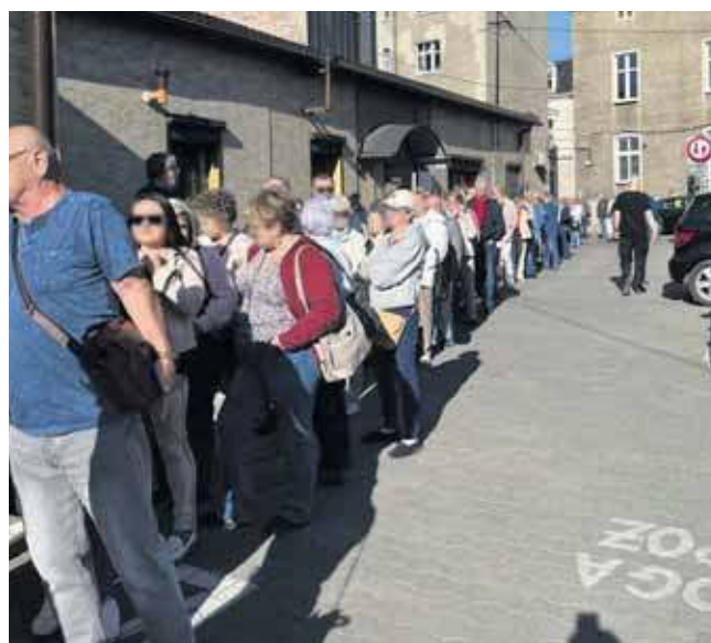
Długa kolejka przed przychodnią

„Z danych sprawozdawczych przekazywanych przez NZOZ Animed w Tarnowskich Górach do Śląskiego Oddziału Wojewódzkiego NFZ wynika, że placówka prowadzi rejestrację pacjentów na wizyty w poradniach specjalistycznych codziennie od początku bieżącego roku. Mimo to Śląski OW NFZ zwrócił się do dyrekcji placówki z prośbą o wyjaśnienie sytuacji widocznej na nagraniu. Dyrekcja NZOZ Animed kategorycznie zaprzeczyła informacjom, jakoby zapisy do poradni specjalistycznych były prowadzone wyłącznie raz w miesiącu. Pacjenci mogą umawiać wi-