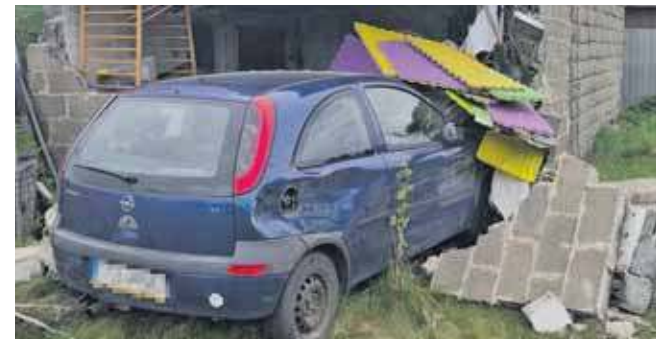
Kierująca miała w organizmie blisko 3 promile alkoholu

W sobotę przed godz. 13 w Kaletach samochód wjechał w budynek. Przyczynę niedyspozycji kobiety, która siedziała za kierownicą, wyjaśnił alkomat.