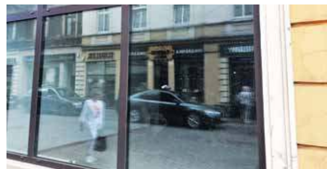
Zgłosił się jeden oferent, zaproponował czynsz w wysokości 6984 zł

Zgłosił się jeden oferent, zaproponował czynsz w wysokości 6984 zł. To Piekarnia