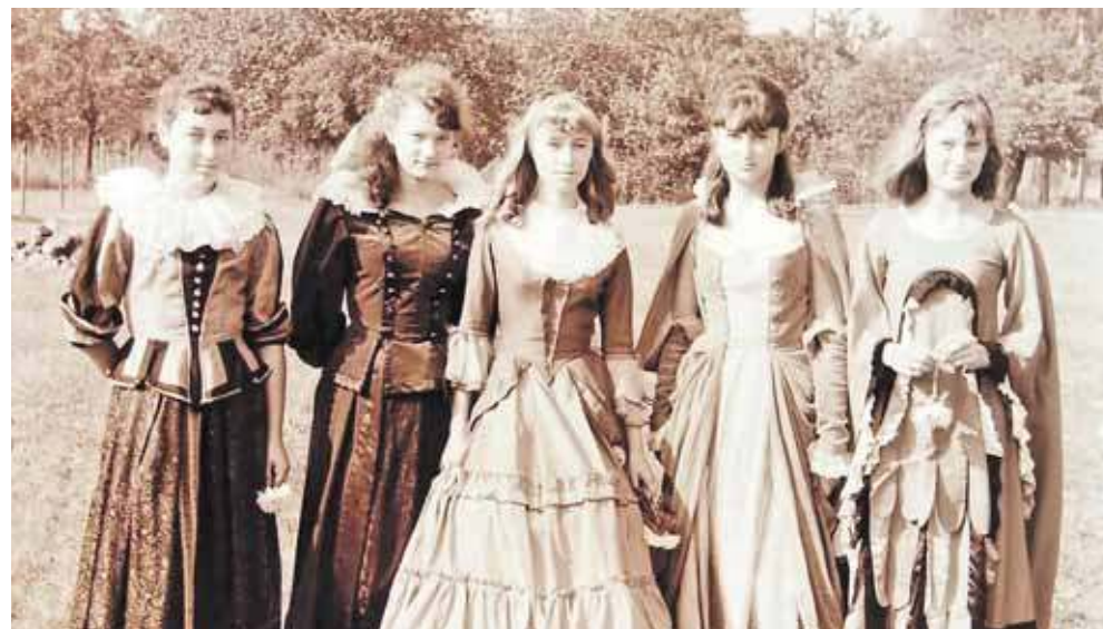
Piękne panie w pochodzie. Ktoś je rozpoznaje?