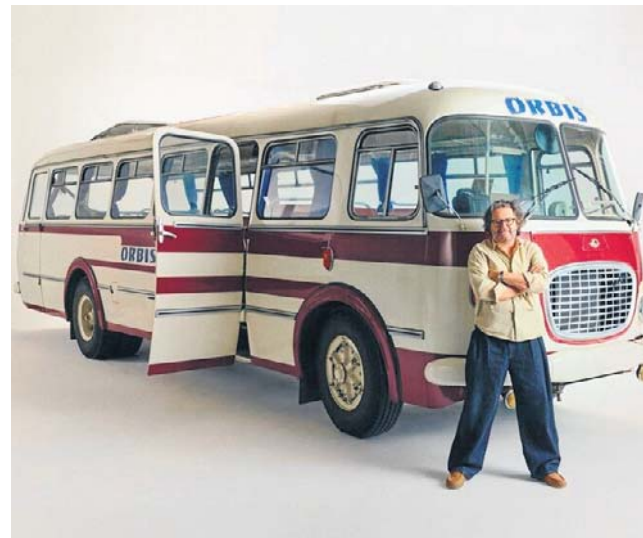
Grzegorz Turnau wyrusza w trasę. Posłuchamy go w Krakowie, Warszawie, Gdańsku, Wrocławiu i Poznaniu

Rok 2025 był kamieniem milowym dla wprowadzenia nowych dźwięków na Letnie Brzmienia. Pomysł koncertu orkiestry symfonicznej na letnim festiwalu zaowocował projektem Edyty Bartosiewicz i Good Taste Orchestra „To jest mój sen”, który pokazał, jak silne emocje może wywołać połączenie piosenek znanych z radiowych playlist z symfonicznym brzmieniem. W tym roku festiwal rozwija ten kieru-