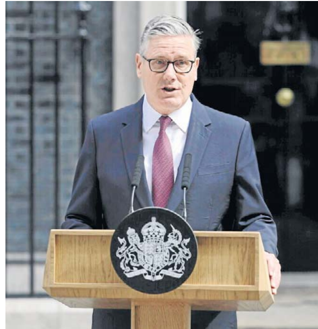
Premier Wielkiej Brytanii Keir Starmer spotkał się z mediami przy Downing Street 10. Oświadczył, że pozostanie szefem rządu do czasu wyłonienia jego następcy

Wcześniej Starmer podsumował swoje osiągnięcia, prze-