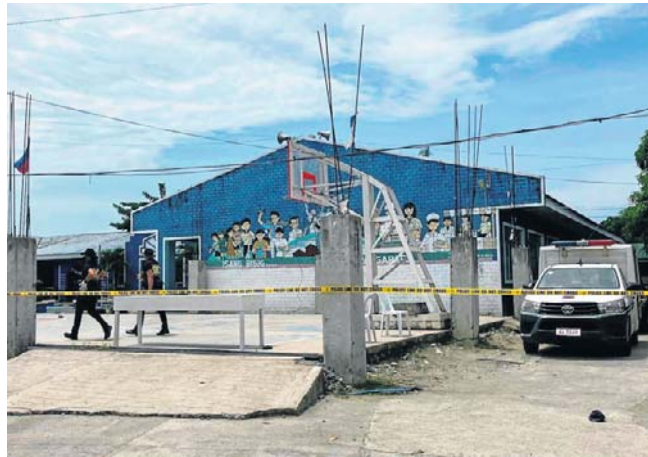
Do szkoły wysłano dodatkowe siły policyjne, aby zapewnić bezpieczeństwo uczniom i pracownikom