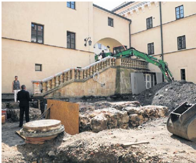
Trwa remont i przebudowa Muzeum Archeologicznego w Krakowie a przy okazji są kolejne ciekawe odkrycia

Anna Piątkowska anna.piatkowska@polskapress.pl