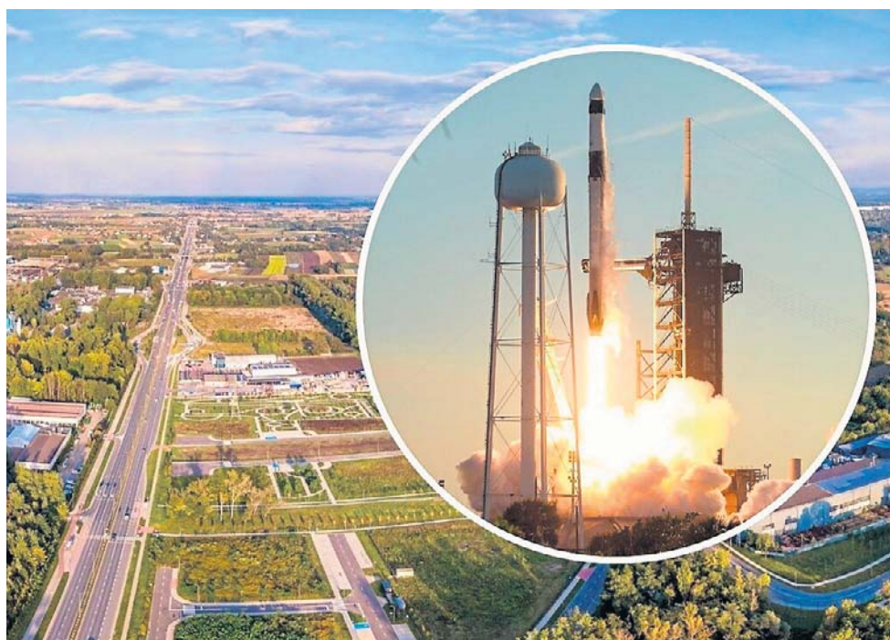
Na terenach Nowej Huty Przyszłości może powstać Europejska Agencja Kosmiczna

I wylicza: - Mamy rozpoznawalne w świecie instytucje nauki, prowadzące już badania dla sektora kosmicznego i tworzące technologie. Mamy blisko 140 tysięcy studentów, z których co rok na rynek pracy trafia kilka tysięcy absolwentów. Mamy ponad 190 tysięcy firm i wypracowane szybkie ścieżki tworzenia nowych. Światowe