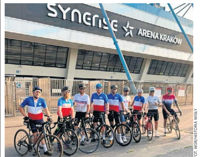
Kibice „Białej Gwiazdy” na 120-lecie krakowskiego klubu przejechali na rowerach symboliczny dystans 190,6 km