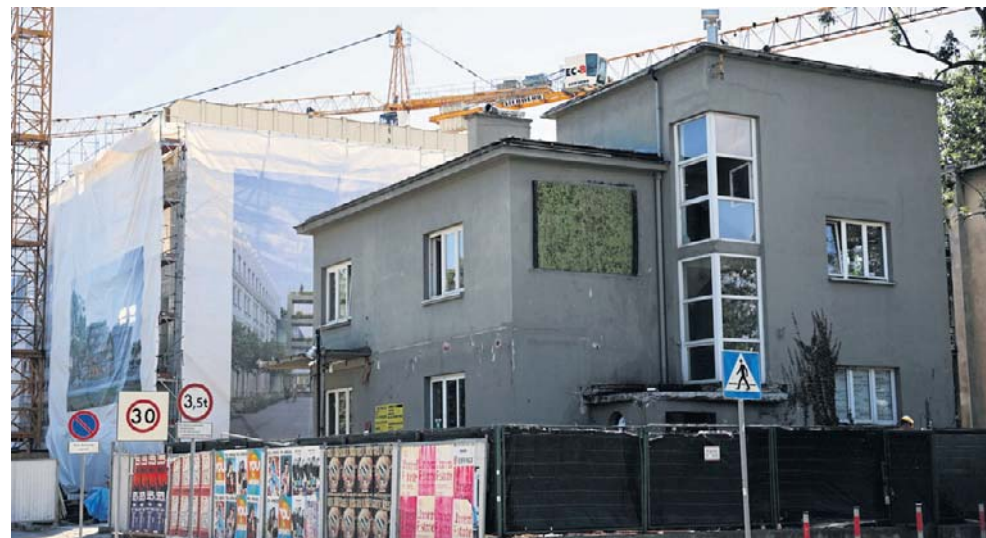
FOT. ANDRZEJ BANAS

- Postanowieniem z dnia 15 czerwca 2026 r. (...) Małopolski Wojewódzki Konserwator Zabytków uzgodnił zamierzenie inwestycyjne: 1. Rozbiórka ist-