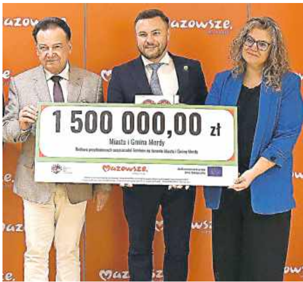
Gmina ma powody do radości.

Pozyskana kwota to dokładnie 1 500 000 zł, z czego aż 1 106 400 zł stanowią środki z Europejskiego Funduszu Rolnego