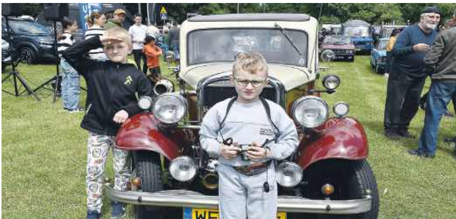
To edycja, która prawdopodobnie przebiła wszystkie poprzednie, jeśli chodzi o liczbę wystawców i odwiedzających.

Od rana teren imprezy tętnił życiem. „Mrowisko 2026” odbyło się w formule, która od lat łączy zlot, piknik i spotkanie pasjonatów motoryzacji, ale tegoroczna edycja – jak podkreślają organizatorzy – mogła być jedną z największych w historii. Wydarzenie