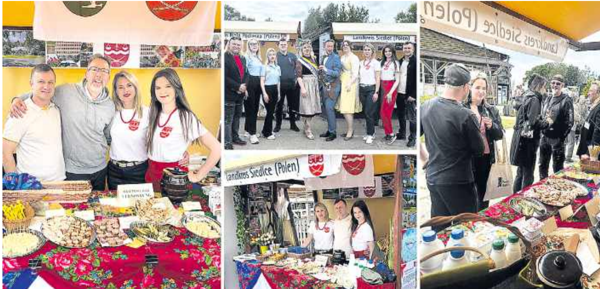
Wydarzenie było również okazją do dalszego rozwijania współpracy międzynarodowej.

Brandenburskie Dni Otwarte Rolnictwa organizowane są od 1994 roku i należą do najbardziej prestiżowych wydarzeń promujących rolnictwo oraz regionalne produkty. Co roku przyciągają wystawców i odwiedzających z zaprzyjaźnionych