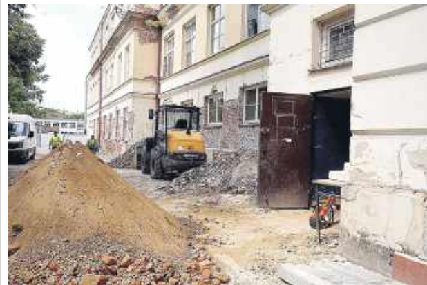
Na ten remont szkoła czekała ponad 20 lat.

Przypomnijmy: umowy na kompleksową termomodernizację placówki podpisano 24 marca. Jak podkreślano, inwestycja o wartości blisko 11,5 mln zł, finansowana niemal w całości z Krajowego Planu Odbudowy, ma nie tylko odmienić wygląd historycznych budynków, ale i przynieść