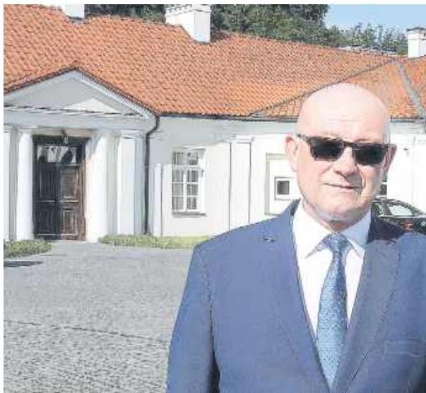
- W demokratycznym państwie prawa sam fakt prowadzenia postępowania nie może być utożsamiany z winą - napisał w liście do pracowników uczelni były rektor.

W marcu tego roku, na zapytanie ministra nauki i szkolnictwa wyższego Marcina Kulaska o możliwość odwołania rektora zarówno Rada Uczelni, jak i Senat uznały, że "brak jest podstaw do podejmowania działań o charakterze sankcyjnym". Oba organy powołały się wtedy na zasadę domniemania niewinności i brak oficjalnych ustaleń wskazujących na naruszenie prawa.