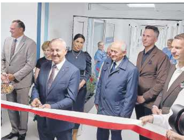
Uroczyste oddanie do użytku

Metamorfoza placówki przy ul. Bema była możliwa dzięki udziałowi w międzynarodowym