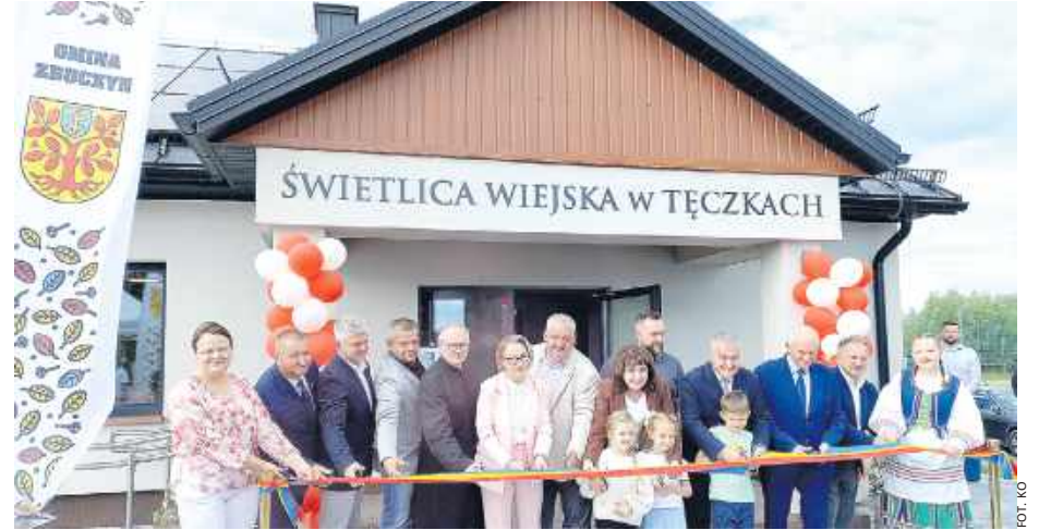
Goście i mieszkańcy symbolicznie przecięli wstęgę, oddając świetlicę do użytku.

mogą być razem: spotykać się, działać, rozwijać swoje zainteresowania, pielęgnować tradycje czy nawet wspólnie się modlić. - W gminie Zbuczyn kierujemy się ideą tworzenia tzw. trzecich miejsc. Pierwszym miejscem jest dom, drugim praca, a trzecim przestrzeń, do której człowiek przychodzi dlatego, że po prostu lubi tam być. To miejsce, w którym mieszkańcy mogą być razem i przeżywać ważne momenty swojego życia: od chrzciny, komunii i jubileuszy po stypy - zaznaczył wójt. Zwrócił również uwagę, że świetlica w Tęczkach powstała w miejscu, w którym od dziesięcioleci koncentrowało się życie nie tylko samych Tęczek, ale całej wschodniej części gminy Zbuczyn. - To tutaj funkcjonowało w czasach słuźnie minionych kółko rolnicze. Tutaj mieszkańcy wypożyczali sprzęt rolniczy, składowali plony, ale też rozmawiali o sprawach ważnych dla swojej miejscowości. Dzisiaj symbolicznie zamykamy tamten rozdział historii, tworząc nowoczesną, w pełni wyposażoną przestrzeń odpowiadającą potrzebom współczesnych czasów. Mieszkańcy Tęczek są ludźmi niezwykle aktywnymi. Działa tutaj Koło Gospodyń Wiejskich, jest klub sportowy i wiele osób gotowych angażować się społecznie. Ta aktywność potrzebuje swojego miejsca. I właśnie taką przestrzeń ma być ta świetlica - zauważył wójt. I dodał: - Ostatnie miesiące są w naszej gminie wyjątkowe, jeśli bierzemy pod uwagę budowę i remonty świetlic. W kwietniu otworzyliśmy świetlicę w Zawadach, teraz oddaliśmy do użyt-