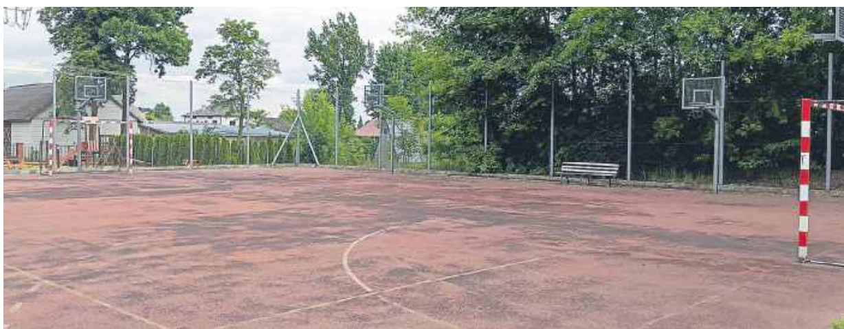
Zakres zaplanowanych robót obejmuje renowację nawierzchni boiska wielofunkcyjnego.

Dobra wiadomość dla społeczności lokalnej i wszystkich miłośników aktywności ruchowej. Boisko przy Szkole Podstawowej w Śmiarach doczeka się remontu.