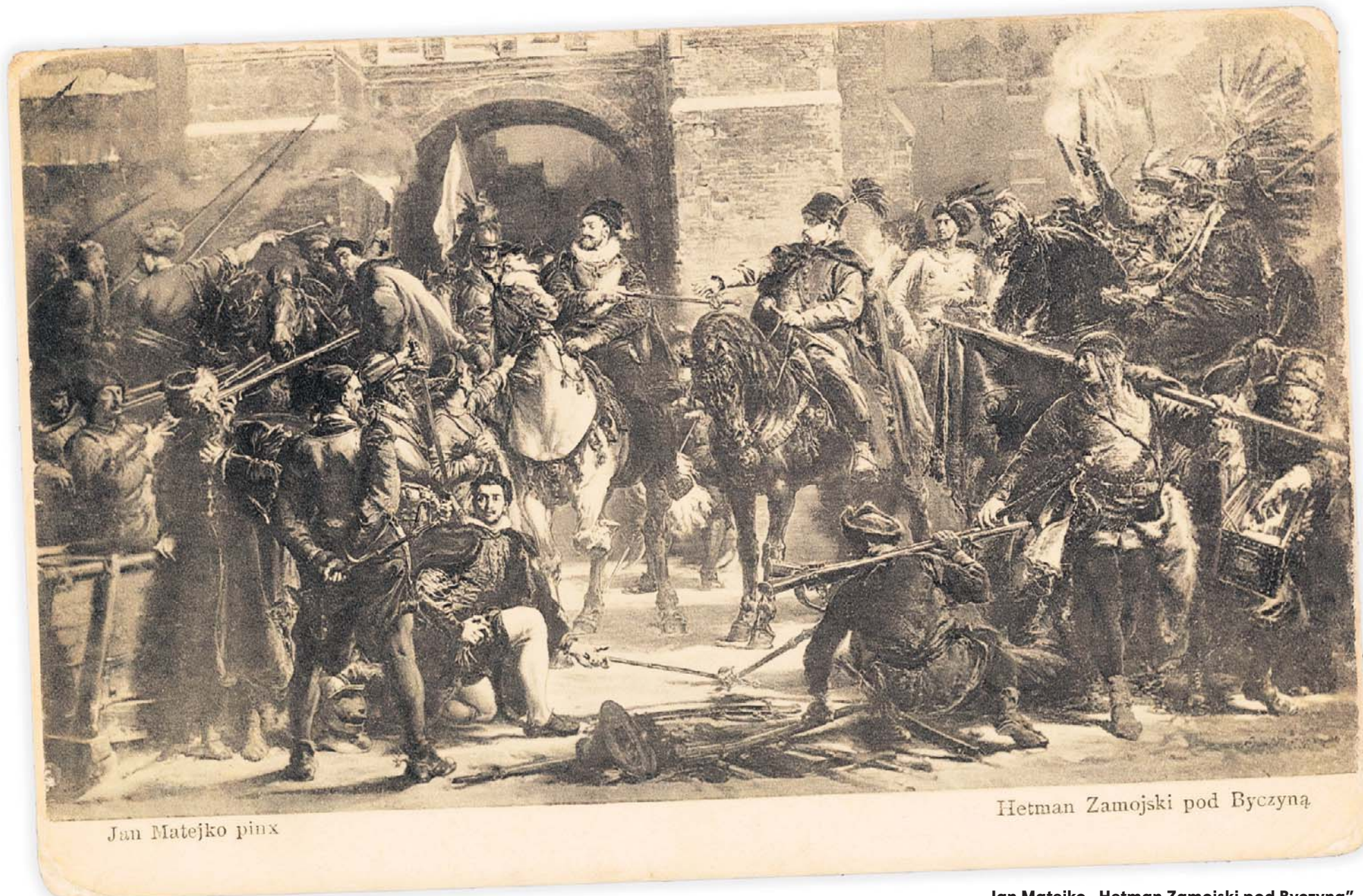
Hetman Zamojski pod Byczyną

Bitwę pod Orszą uważa się za pierwsze zwycięstwo husarii - ale to tylko częściowa prawda. Wtedy bowiem ta formacja była jeszcze lekką jazdą bez charakterystycznych zbroi. Dopiero pod Byczyną wystąpiła ona jako formacja ciężkozbrojna, miała nawet pierwszą wersję słynnych skrzydeł przyklejonych do tylnego łęku siodła. Właśnie tam narodziła się legenda.