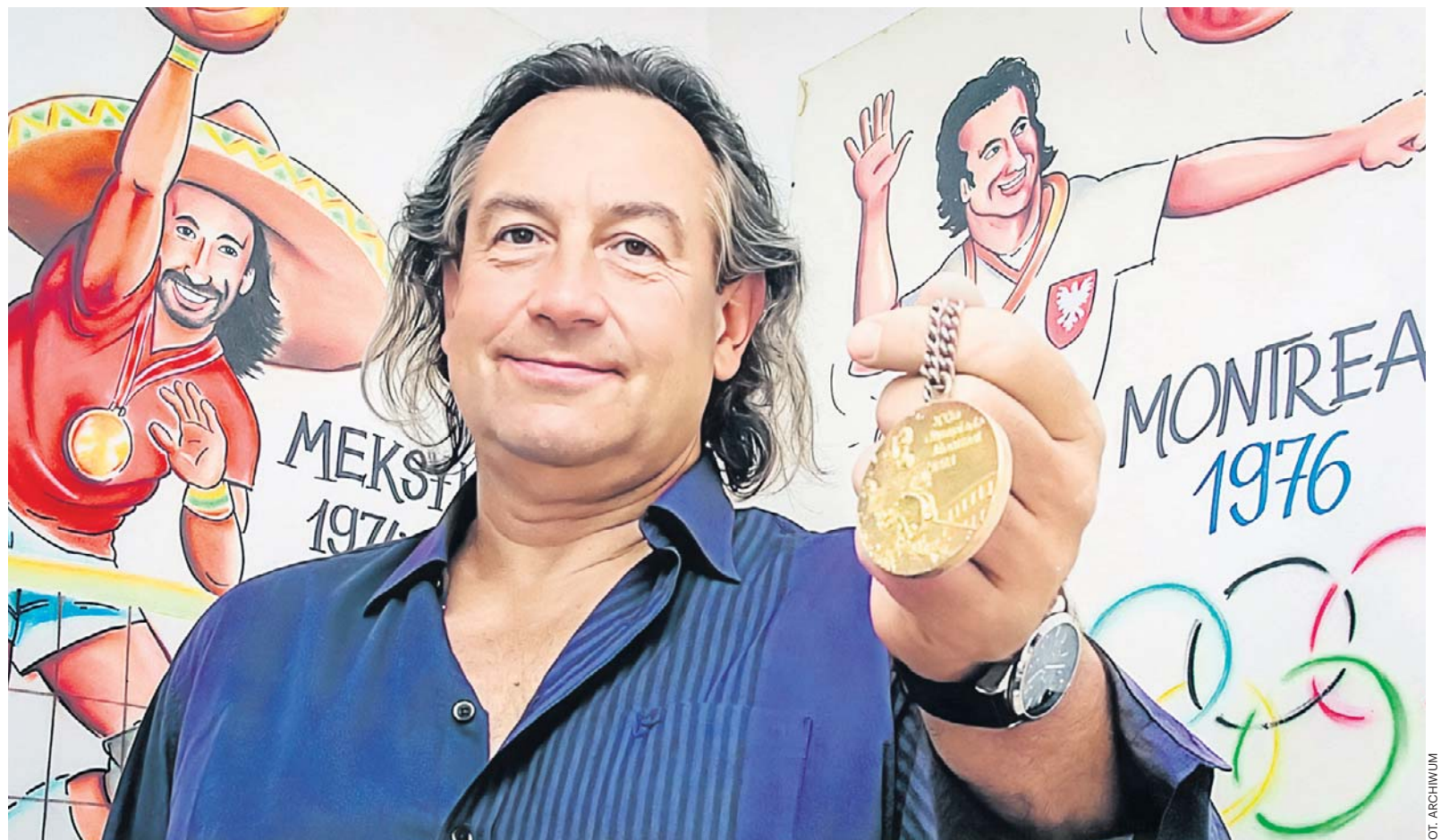
Tomasz Wójtowicz jest jednym z najbardziej utytułowanych siatkarzy w historii tego sportu. Przez Międzynarodową Federację Piłki Siatkowej został wybrany do ósemki najlepszych siatkarzy XX wieku. Znalazł się w siatkarskiej Galerii Sław – Volleyball Hall of Fame

– Muszę przyznać, będąc w pewnym stopniu nieobiektywnym, że tak skonstruowanego siatkarza nie widziałem do tej pory. Umiał zrobić wszystko. Miał charakter stworzony do sportu. Nigdy nie był zestresowany, nawet przed najważniejszymi meczami. Znał swoją rolę i wiedział, że jest killerem, który musi wziąć na siebie odpowiedzialność w najtrudniejszych momentach. Ale na nim to nie ciążyło. To było dla niego naturalne. To dla mnie największy siatkarz do tej pory – wspomina Ryszard Bosek.