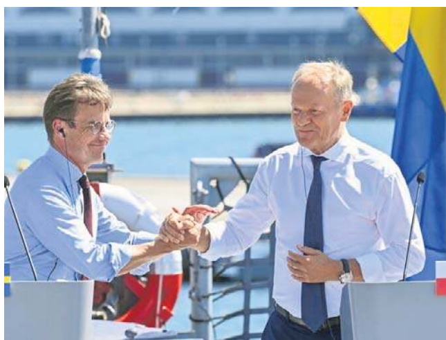
Premierzy Donald Tusk i Ulf Kristersson wzięli udział w polsko-szwedzkich konsultacjach międzyrządowych

Jak zaznaczył premier Tusk podczas konferencji prasowej z premierem Szwecji Ulfem Kristerssonem, jest to historyczna umowa o dużym znaczeniu dla obronności i współpracy między oboma krajami.