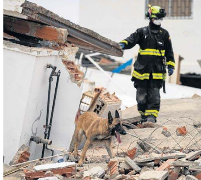
Kolumbijski ratownik i jego pies tropiący poszukują zaginionych osób na obszarze dotkniętym trzęsieniem ziemi w Catia La Mar w Wenezueli

Argentyńscy żołnierze pomagający w akcji ratunkowej