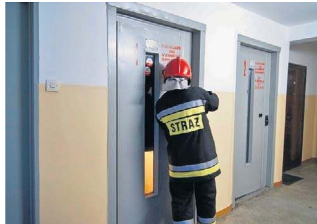
Pięć osób utknęło w windach. Z gorących, klaustrofobicznych pułapek ratowali ich strażacy

Koszmar przeżyli też Łodzianie, którzy w niedzielę próbowali wrócić do Łodzi pociągami przez Warszawę. Awaria sieci trakcyj-