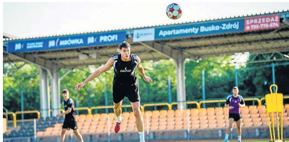
To nic, że mamy potworny upał – nie ma przeprosić. Piłkarze ŁKS Łódź pilnie trenują podczas zgrupowania w Busku-Zdroju. Pierwszy mecz ligowy 25 lipca w Siedlcach

Na wtorek (30 czerwca) łodzianie mają zaplanowany sparing z Dinamem Bukareszt. Mioniony sezon rywal łodzian zakończył na piątym miejscu w ekstraklasie Rumunii. W 30 meczach zdobył 52 punkty. Mistrzowska Univesitatea Craiova zgromadziła 10 punktów więcej. Przypominamy, że pierwotnie łodzianie mieli się zmierzyć z innym pierwszoligowcem Stalą Mielec. Do Łodzi ełka-