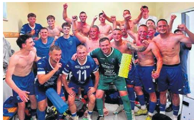
Radość piłkarzy Pogoni Bełchów po wygranym meczu rewanżowym o Klasę Okręgową z LZS Staw 2:0

Przypominamy, że mistrzowie ośmiu grup Klasy A wywalczyli bezpośredni awans do czterech grup Klasy Okręgowej, która rozpocznie nowy sezon w połowie sierpnia. ©