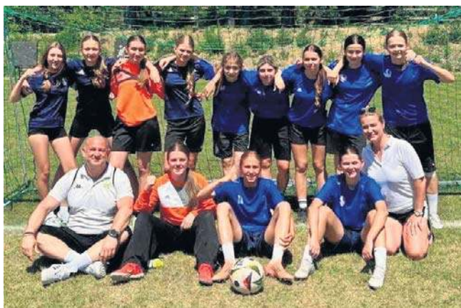
Piłkarki Szkoły Podstawowej nr 10 w Sieradzu okazały się najlepsze podczas turnieju w Głuchołazach