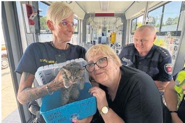
- Taki dzielny kociak zasługuje na ciepły dom. Wybrałam mu imię - będzie Szynek - mówi nowa opiekunka kota

Dziennik Łódzki ☎ 42 715 80 68 bok.prenumerata@polskapress.pl prenumerata.dzienniklodzki.pl