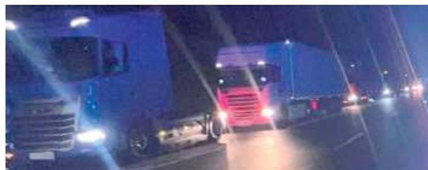
38-latek miał w organizmie niemal 2 promile alkoholu. Drugi kierowca 39-latek miał w organizmie ponad promil alkoholu

Biała Podlaska: Funkcjonariusze zatrzymali dwóch kierowców ciężarówek. Obaj byli pijani. To obywatele Białorusi, którzy w takim stanie jechali do granicy RP.