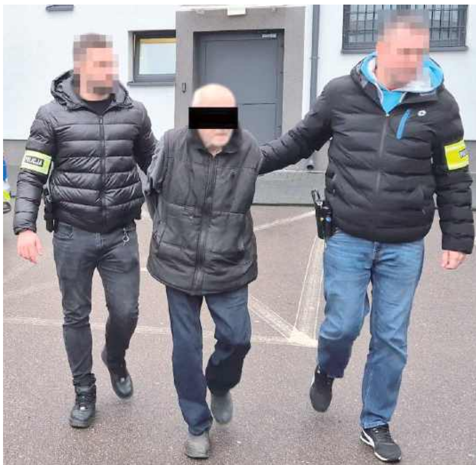
Mężczyzna został aresztowany

- Ze wstępnego zgłoszenia wynikało, że 73-letnia kobieta została pobita przez męża, z obrażeniami przewieziono ją do szpitala. Mundurowi zatrzymali sprawcę przemocy, 73-latek został umieszczony w policyjnej celi - informuje asp. szt. Marcin Józwiak z KPP w Łukowie. - Wyjaśniający okoliczności zgłoszenia policjanci dowiedzieli się, że w trakcie awantury domowej mężczyzna, bijąc i kopiąc żonę, groził jej zabójstwem i chciał ją też udusić. Na szczęście pokrzywdzona kobieta wyrwała się swemu oprawcy i wezwała pomoc. Teraz nic już jej nie grozi.