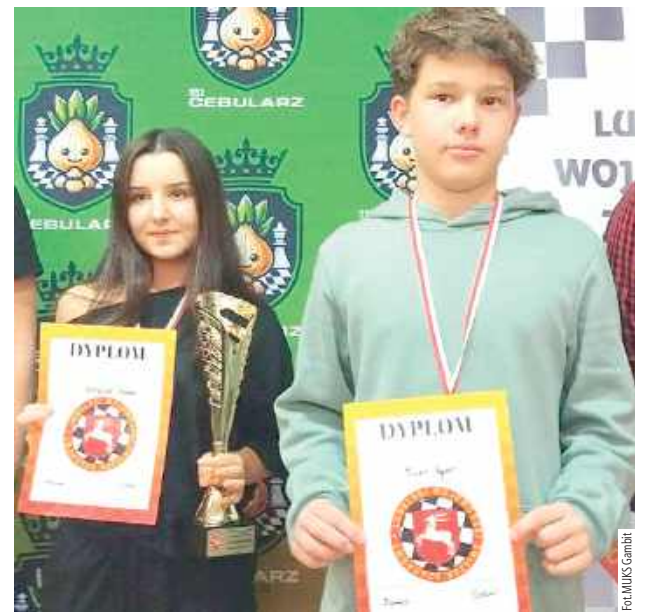
Zawodnicy wrócili do Międzyrzecza z ogromnymi sukcesami!

W MUKS Gambit Międzyrzec Podlaski mają powody do dumy. Podczas Mistrzostw Województwa Lubelskiego w szachach nasi młodzi zawodnicy zaprezentowali się znakomicie, zdobywając czołowe miejsca w swoich kategoriach wiekowych.