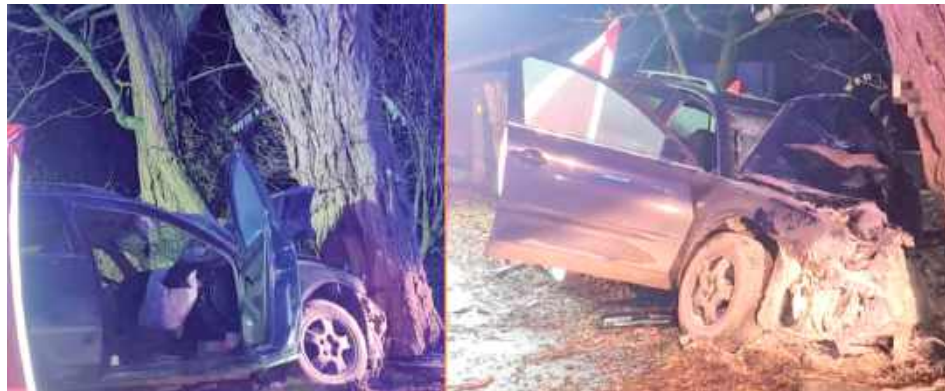
Ze wstępnych ustaleń policji wynika, że kierująca Volkswagenem obywatelka Ukrainy z nieznanymi przyczynami zjechała z drogi gminnej i uderzyła w przydrożne drzewo

POWIAT OPOLSKI: Tragiczny wypadek w Starych Kaliszanach. 46-letnia kobieta zginęła po tym, jak Volkswagen, którym kierowała, zjechała z drogi gminnej i uderzyła w drzewo. Pasażer trafił do szpitala, a policja i prokuratura wyjaśniają okoliczności zdarzenia.