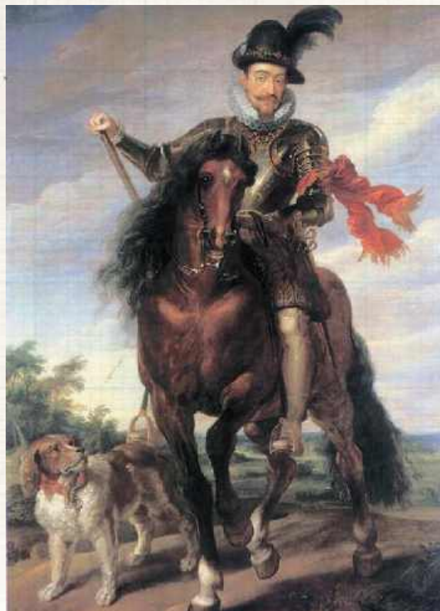
Zygmunt III na koniu, portret z około 1624 roku namalowany pewnie przez jednego z uczniów Rubensa

później konfederaci barscy przy próbie porwania ukorzą się ostatecznie przed mocno wątpliwym skądinąd majestatem Stanisława Augusta... Nikogo nie zdziwiło, że sprawcę zgładzono, mimo że sam król apelował o łaskę. Zdziwienie budziło nadzwyczajne okrucieństwo egzekucji. A także błyskawiczne niemal tempo załatwienia sprawy. Dysku-