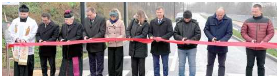
Choć symboliczne przecięcie wstęgi już się odbyło, pełne oddanie drogi do ruchu nastąpi po zakończeniu modernizacji ul. Kusocińskiego, planowanej najpóźniej na kwiecień 2026 roku

Ulica, nazwana na cześć zasłużonego historyka i regionalisty, powstała jako zupełnie nowy odcinek, łączący przedłużenie ul. Kusocińskiego z ul. Lubelską, tuż przy moście nad Krzną. Choć uroczyste przecięcie wstęgi już się odbyło, kierowcy będą mogli w pełni korzystać z trasy dopiero po zakończeniu przebudowy ul. Kusocińskiego – zgodnie z harmonogramem najpóźniej w kwietniu 2026 roku.