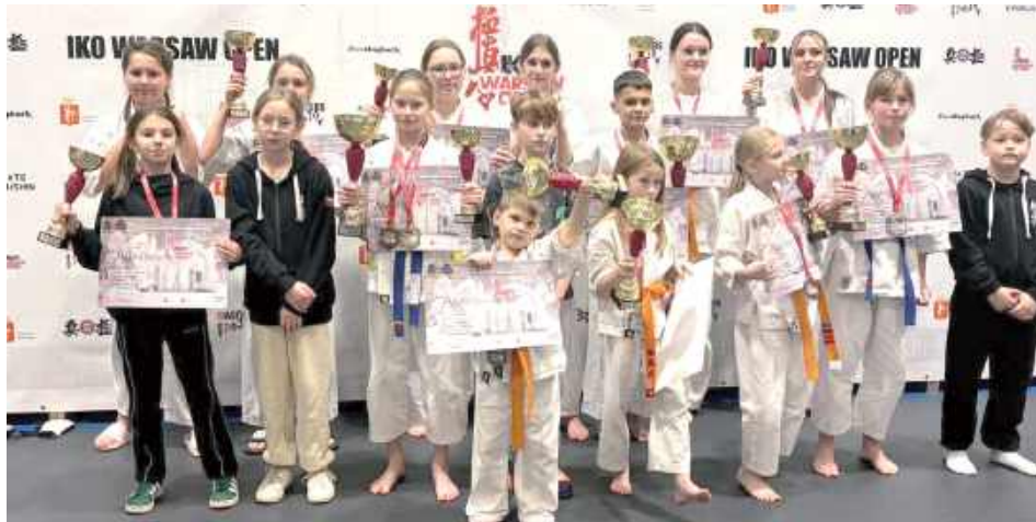
Nasza ekipa wróciła ze stolicy z workiem medali!

- Jestem niezwykle dumny z naszych zawodników. Pokazali nie tylko wysokie umiejętności techniczne, ale też ogromną determinację i ducha sportowej ry-