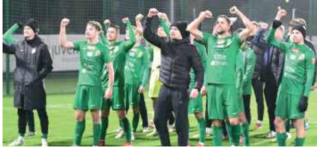
Piłkarze Podlasia w swoim przedostatnim występie w tym roku ulegli 0:1 Chełmiance Chełm

Wydawało się, że padnie wynik bezbramkowy. Obie drużyny szukały okazji głównie po szybkich przejściach z obrony do ataku, a najgroźniejszą sytuację przed 90. minutą stworzyło Podlasie. Jednak to gospodarze zdołali zadać decydujący cios. W pierwszej z pięciu doliczonych minut piłka po strzale Chełmianki odbiła się od poprzeczki bramki Oskara Jeża, a w zamieszaniu podbramkowym najlepiej odnalazł się były napastnik m.in. Lecha Poznań i Piasta Gliwice - Pa-