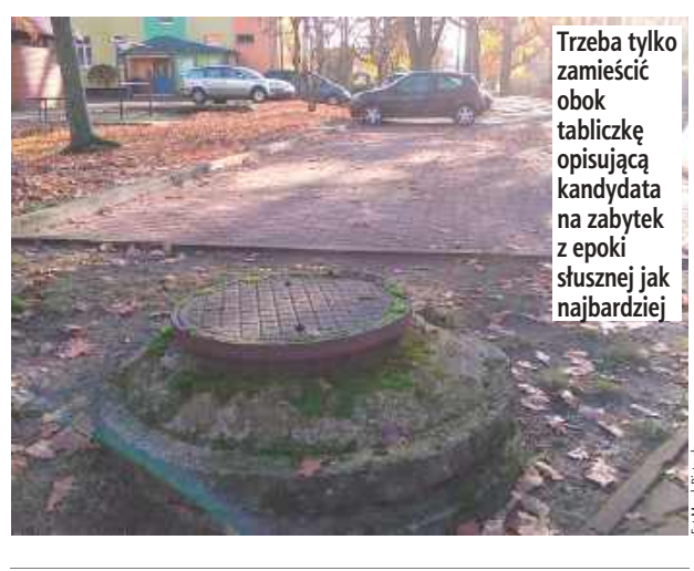
Trzeba tylko zamieścić obok tabliczkę opisującą kandydata na zabytek z epoki słusznej jak najbardziej

Taki okaz studzienki można spotkać niedaleko ulic Parkowej i Adama Mickiewicza. Wystaje ona na kilkadziesiąt centymetrów ponad chodnik. Tylko podczas wielkiej powodzi tysiąclecia, której jeszcze tam nie było, może zbierać falę powodziową do kanalizacji deszczowej. Podobnych relikwów w dawnym województwie koło-brzeskim nie brakuje. Rehabilitacja czasów słusznie minionych będzie „ciężka” (zamiast trudna), jak mówi większość społeczeństwa mierząca wszelkie trudności w kilogramach, a może nawet w tonach... (Pim)