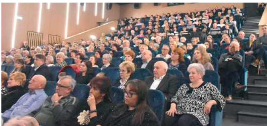
Mieszkańcy tłumnie wypełnili salę widowiskową, aby wysłuchać koncertu

Wydarzenie zatytułowane „Międzyrzec Podlaski – Niepodległej” zgromadziło licznie przybyłą publiczność, która w atmosferze wzruszenia i dumy mogła wysłuchać najpiękniejszych pieśni oraz utworów patriotycznych w wykonaniu wybitnych artystów polskiej sceny muzycznej.