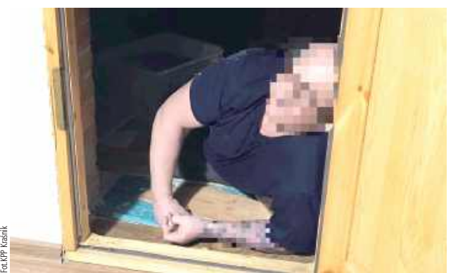
Mężczyzna został skazany na karę ponad 2 lat pozbawienia wolności