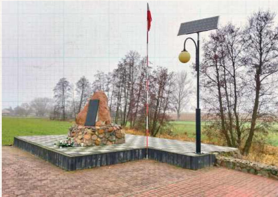
W 1973 r., w trzydziestolecie zbrodni, ofiarom wystawiono pomnik z nazwiskami wszystkich zabitych