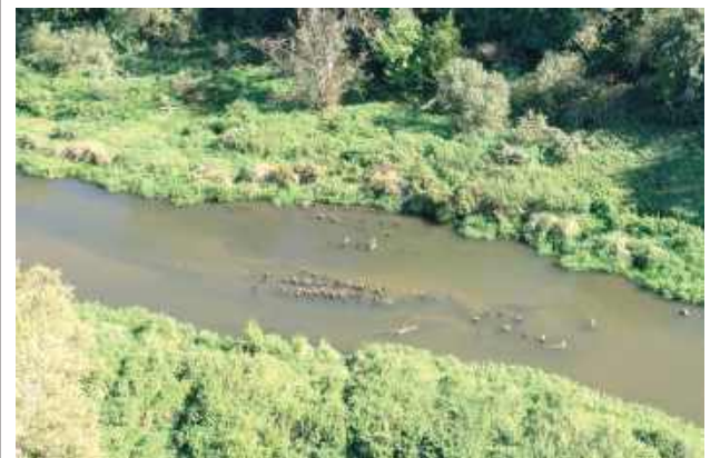
Projekt kładki został przewidziany w ramach większego programu rewitalizacji „Wdrożenie elementów zielonej sieci dla Miasta Łęczna”

W wyniku obniżenia się poziomu wody w rzece Wieprz w Łęcznej odsłoniło się blisko sto drewnianych słupów wbitych w dno — pozostałości konstrukcji dawnego mostu. Wezmą je pod lupę konserwatorzy.