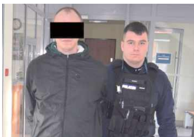
Grozi mu do 8 lat pozbawienia wolności

Radzyń Podlaski: Policjanci zatrzymali 35-letniego mieszkańca Radzyna Podlaskiego, podejrzanego o znęcanie się fizycznie i psychicznie nad swoimi rodzicami oraz bratem. W trakcie jednej z awantur pobił ojca, używając rury od odkurzacza.