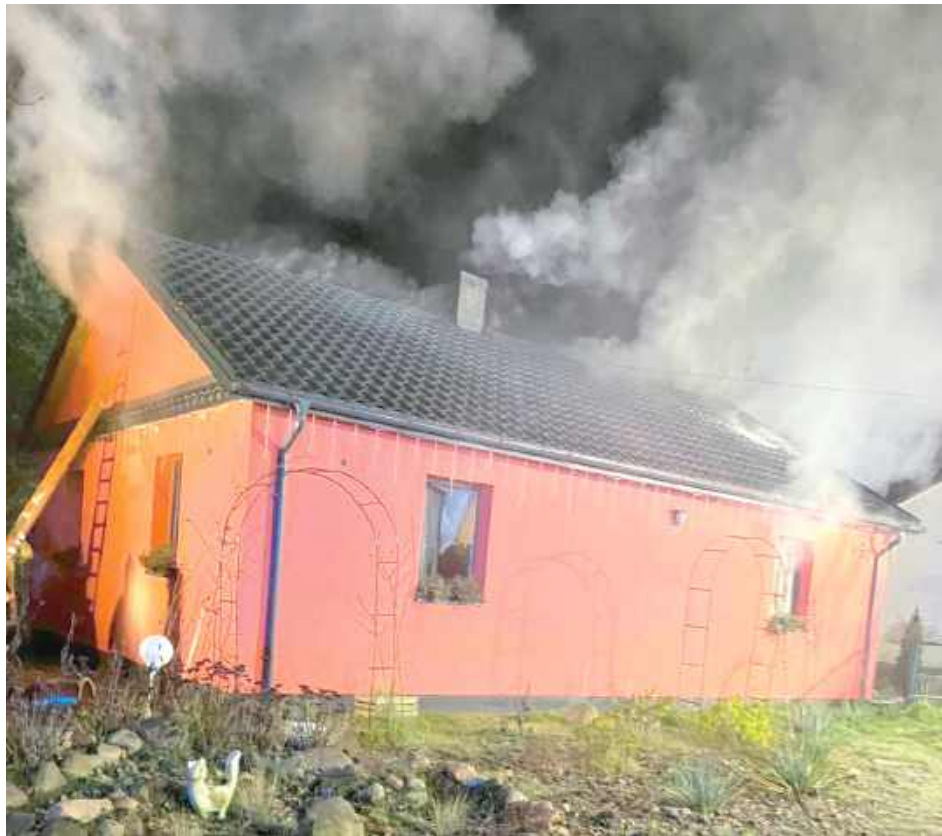
GR Do zdarzenia doszło 20 listopada

Na miejscu interweniowały dwa zastępy Jednostki Ratowniczo-Gaśniczej Parczew, zastęp OSP Jasionka, zastęp OSP Koczergi, policja i pogotowie ratunkowe.