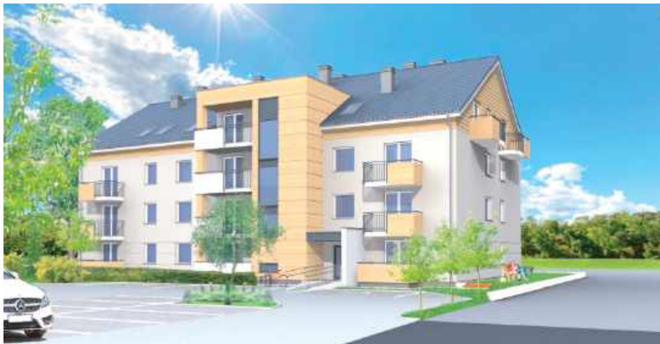
Wizualizacja planowanego bloku komunalnego

Akurat po dziesięciu latach zastoju w budownictwie lokali komunalnych w Białej Podlaskiej wreszcie, jeszcze w 2025 roku, zostanie ogłoszony przetarg na oczekiwaną od lat inwestycję spółki miejskiej Zakład Gospodarki Lokalowej. Być może w 2028 roku zostanie oddany blok przy ul. Łomaskiej.