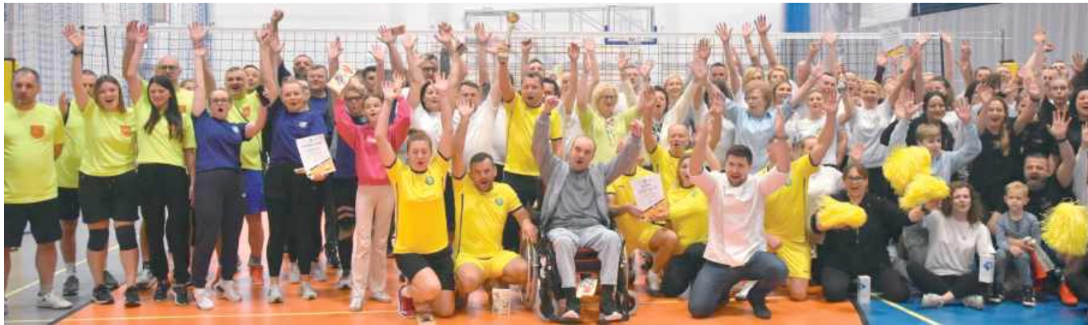
Podczas wydarzenia udało się zebrać 7059,88 zł

Równoległe z rozgrywkami sportowymi odbyły się warszta-