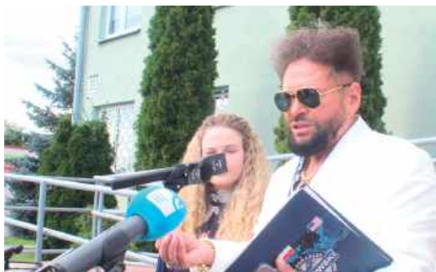
Detektyw Krzysztof Rutkowski wyjaśnia, ile pieniędzy klientów poszło na leczenie współwłaściciela firmy

Sprawa stała się głośna najpierw w lipcu 2024 r., gdy biuro słynnego detektywa Krzysztofa Rutkowskiego i Telewizja.Patriot24.net zorganizowały pod białską Komendą Miejską Policji briefing prasowy, dotyczący - jak określili - „licznych wyłudzeń dokonanych przez spółkę