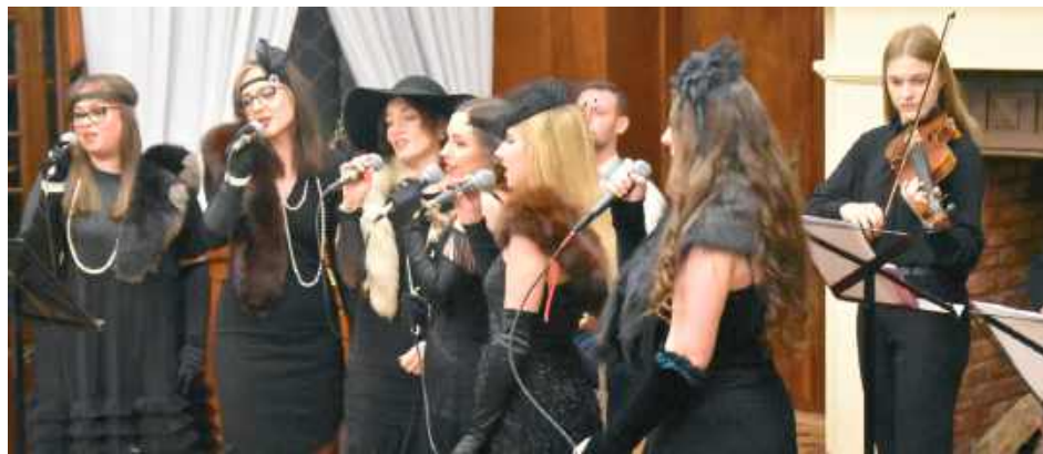
Muzyczną podróż do dawnych lat zapewniła grupa „Jesienne Róże”

W wydarzenie aktywnie włączyła się również Miejska Biblioteka Publiczna w Międzyrzeczu Podlaskim, organizując warsztaty rodzinne tworzenia drzew genealogicznych oraz zajęcia plastyczne z robienia czarnych róż – in-