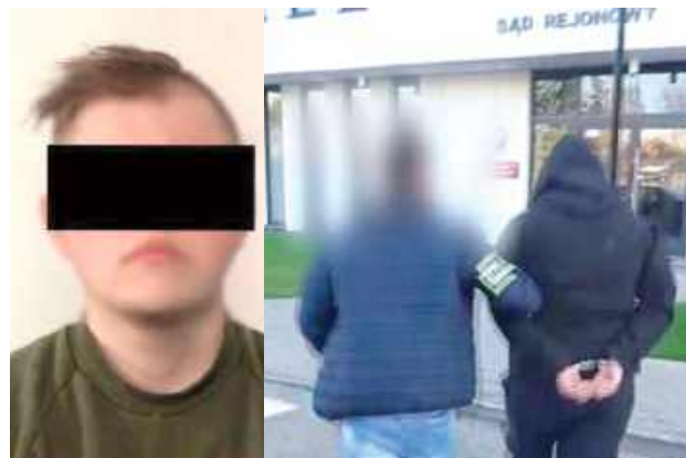
5-latek najbliższe trzy miesiące spędzi w areszcie, co ma zabezpieczyć dalszy tok postępowania i zapewnić bezpieczeństwo pokrzywdzonym

POWIAT OPOLSKI: Dramatyczna interwencja w powiecie opolskim zakończyła się zatrzymaniem 25-latka, który - jak wynika z materiału policji - od miesiąca miał znęcać się nad własnymi rodzicami. Finałem domowych awantur była sobota, gdy mężczyzna podczas kolejnej agresywnej napaści miał grozić matce nożem. Na miejsce natychmiast wezwano patrol.