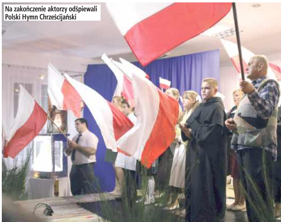
Na zakończenie aktorzy odśpiewali Polski Hymn Chrześcijański

Grupa nie zwalnia tempa. W marcu 2026 r. planuje po-