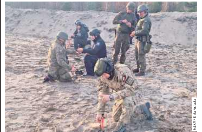
W ramach doskonalenia zawodowego mundurowi pogłębiali wiedzę na temat rozpoznawania zagrożeń związanych z ładunkami wybuchowymi.

Zakończyła się druga część wspólnego szkolenia policjantów i żołnierzy Batalionu Saperów 1. Warszawskiej Brygady Pancernej im. Generała Tadeusza Kościuszki. Policjanci wchodzący w skład nieetatowych grup rozpoznania minersko-pirotechnicznego pogłębiali swoją wiedzę na temat realizacji działań minerskich i niszczeń.