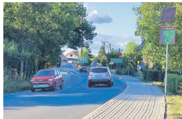
Radarowe tablice prędkości stanęły na wjazdach do miejscowości przy drodze nr 395