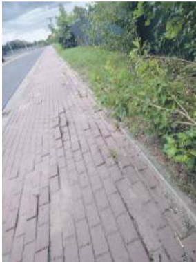
Tak obecnie wygląda fragment chodnika przy ul. Glinianej, o którym sygnalizuje nasz Czytelnik

przyczynę, naprawa fragmentów chodnika przy ul. Glinianej, które tego wymagają, została zlecona CUKiT Strzelin. Jednostka ta uwzględniła konieczne prace w swoich planach na IV kwartał bieżącego roku. Wówczas będzie można również zweryfikować potencjalne oddziaływanie korzeni w tych lokalizacjach – wyjaśnia wiceburmistrz.