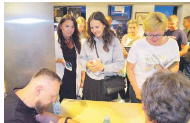
Kolejka do podpisywanych książek