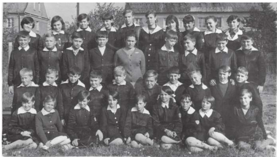
Jedna z klas szkoły nr 1. Zdjęcie zrobione najprawdopodobniej w 1952 roku

Wydawałoby się, że zaplanowana na 18 września uroczystość rocznicowa zakończy działania osób zaangażowanych w odtworzenie dziejów szkoły. Okazuje się, że nie. Planowane jest wydanie monografii, wciąż jednak brakuje osoby, która spięłaby całość. Prowadzone są też starania nad powołaniem czegoś w rodzaju muzeum dawnej szkoły, bo jest sporo ciekawych ekspona-