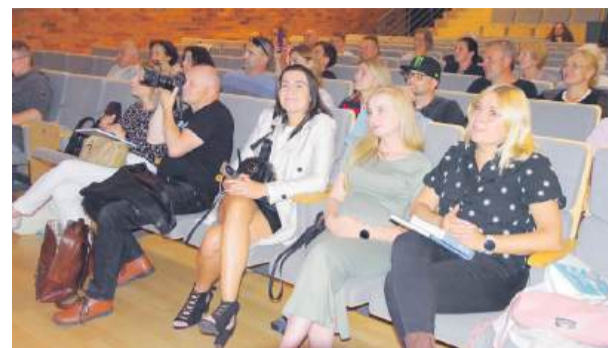
Widownia podczas jednego z paneli