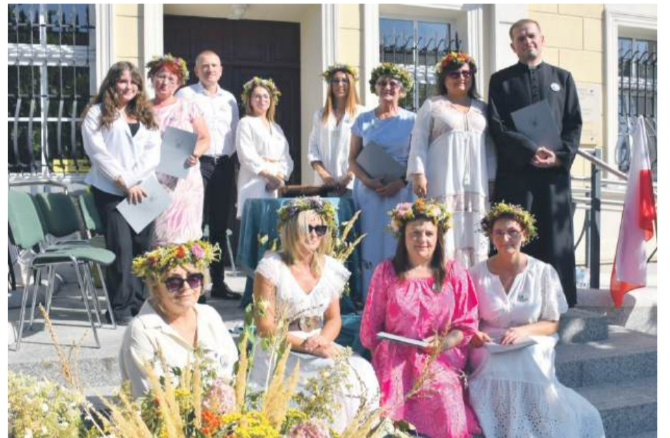
Pamiątkowe zdjęcie osób czytających utwory Jana Kochanowskiego w Wiązowie.