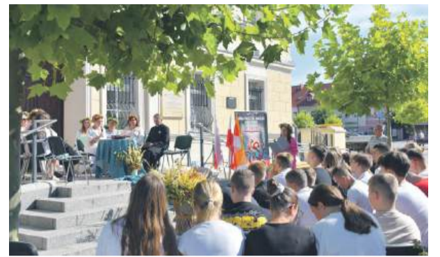
Młodzież ze Szkoły Podstawowej im. Piastów Śląskich w Wiązowie z uwagą przysłuchiwała się czytanim utworom.