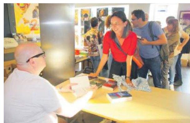
Można było także porozmawiać z pisarzami