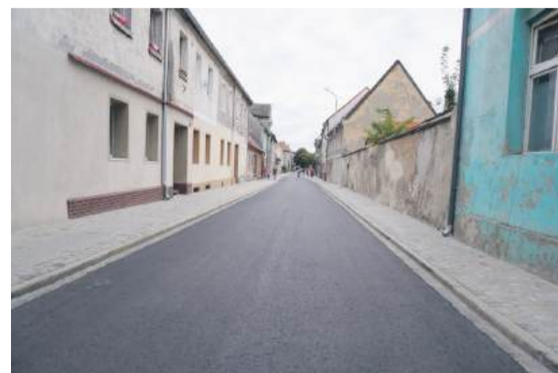
Zakończono remont ul. Strzelińskiej w Wiązowie

Umowa na remont drogi została podpisana w listopadzie ubiegłego roku. Gmina Wiązów otrzymała prawie 825 tys. zł dofinansowania na to zadanie z Rządowego Funduszu Rozwoju Dróg. Łączna wartość inwestycji to ponad 1,1 mln złotych. Zakres prac objął wykonanie chodników po obu stronach drogi i nową nawierzchnię bitumiczną.