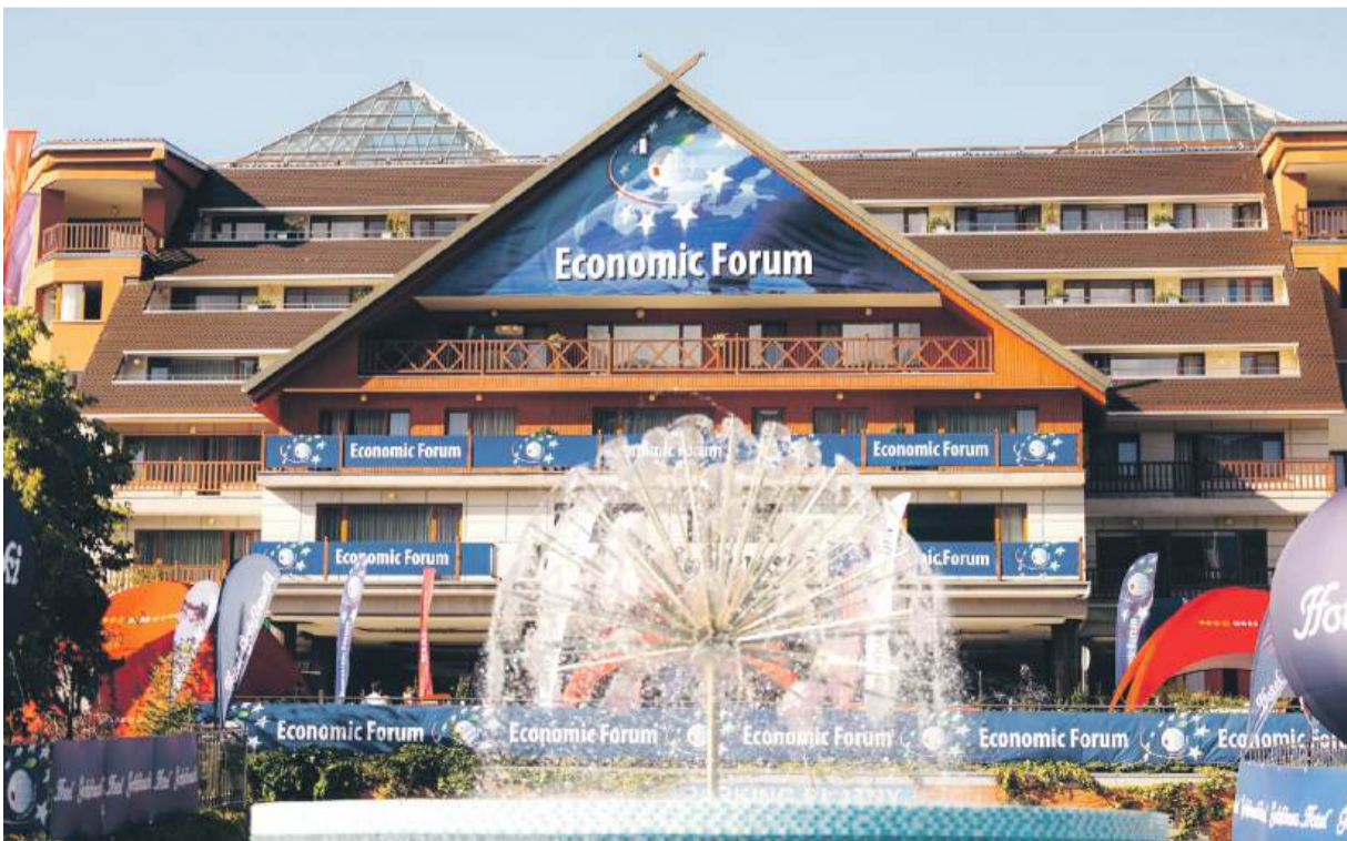
Forum Ekonomiczne odbyło się zgodnie z tradycją w Hotelu Gołębiewski w Karpaczu