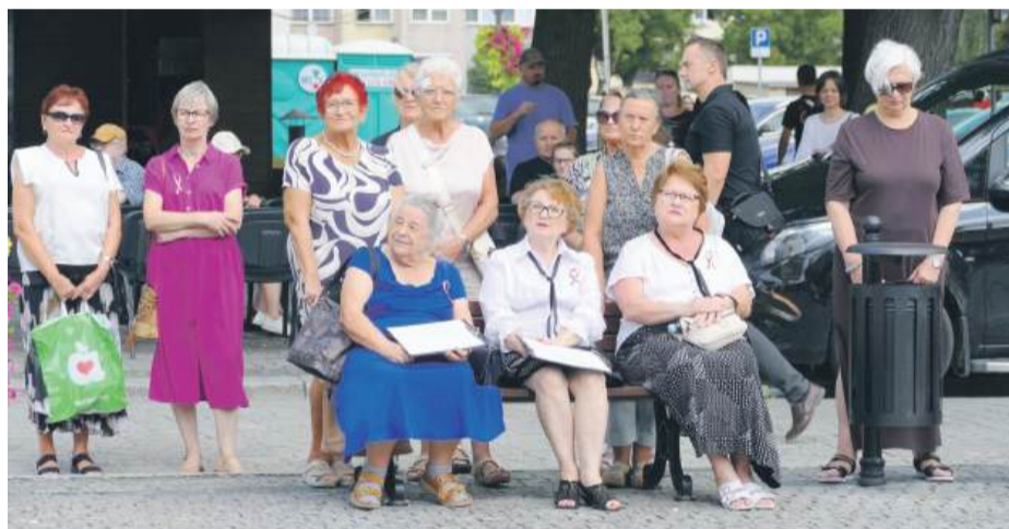
Publiczność i zaproszeni goście