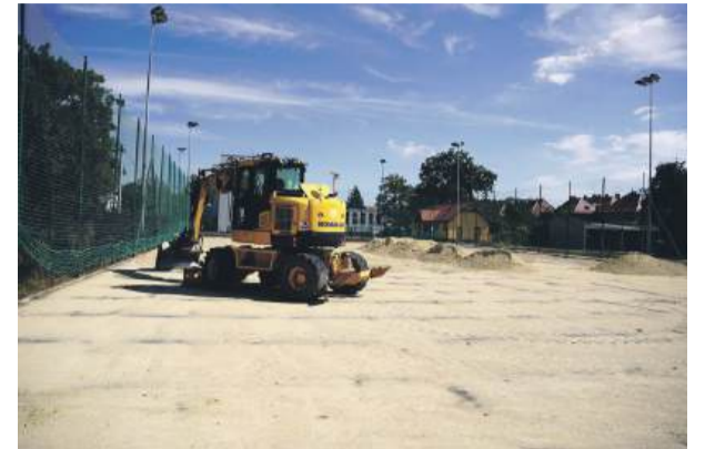
Na boisku przy „czwórce” trwały prace modernizacyjne.

która znajduje się tuż przy placówce. PSP nr 4 w Strzelinie. W strzelińskiej „piątce” modernizacji kompleksu boisk. W strzelińskiej „piątce”