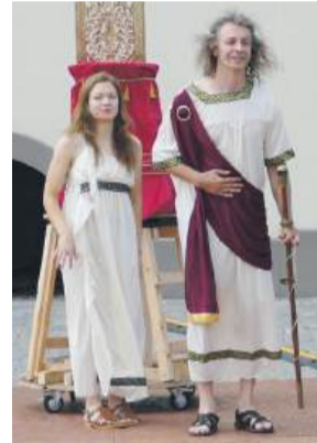
Aktorzy Teatru Stajni Metamorficznej wystawili fragment „Odprawy Posłów Greckich”