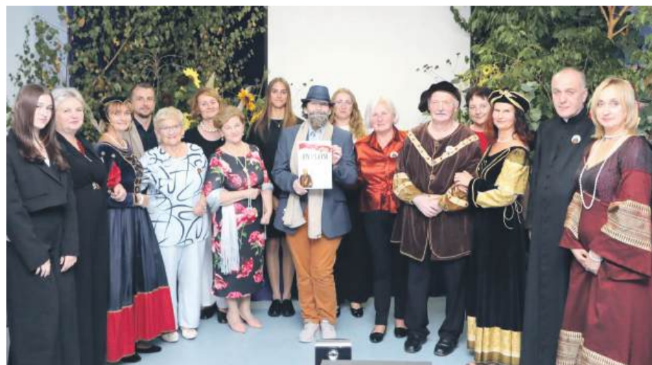
Organizatorzy i lektorzy tegoroczego Narodowego Czytania

i budzić refleksję. Było to nie tylko święto książki, ale i wspólnoty – spotkanie, które zostanie w pamięci uczestników na długo. Wojciech Cerkowniak