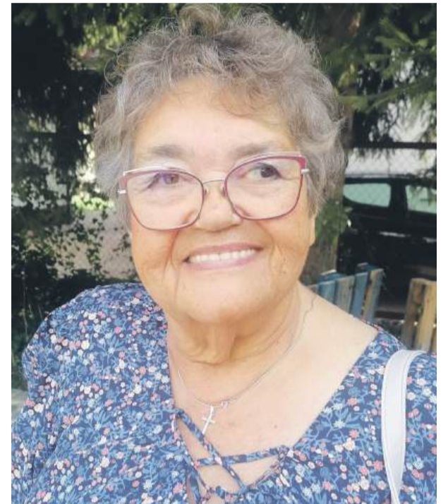
Kryisia z uśmiechem podawała mi przepis na awaryjny obiad ze słoika