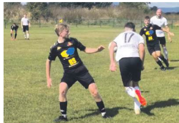
Czarni pokonali Świtez i zajmują pierwsze miejsce