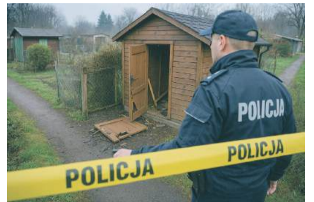
Na miejscu od rana prowadzone były czynności dochodzeniowo-śledcze. Fot. ilustracyjne