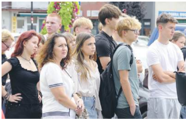
Wśród słuchających byli nauczyciele i uczniowie szkół średnich