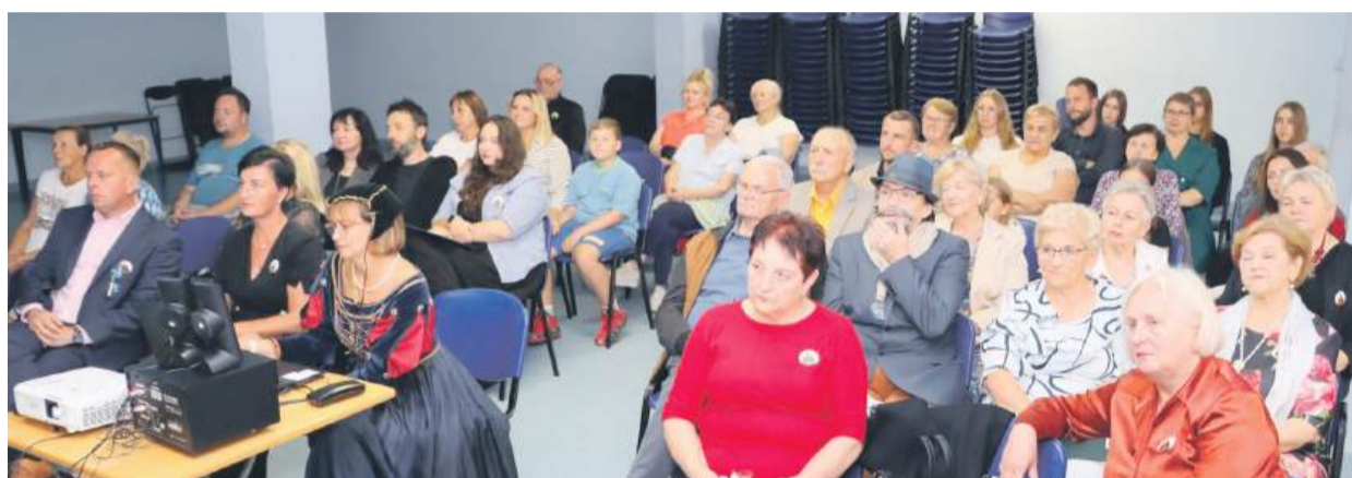
W Narodowym Czytaniu w Przewornie uczestniczyło liczne grono mieszkańców gminy