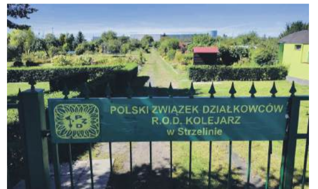
Z dotychczasowych zgłoszeń wynika, że skradziono głównie sprzęt ogrodniczy i elektronarzędzia, m.in. kosiarki, narzędzia, a nawet lodówkę