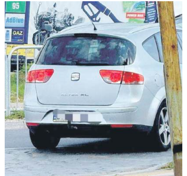
Kierująca samochodem osobowym uderzyła w przechodzącą dziewczynkę, po czym odjechała z miejsca zdarzenia.