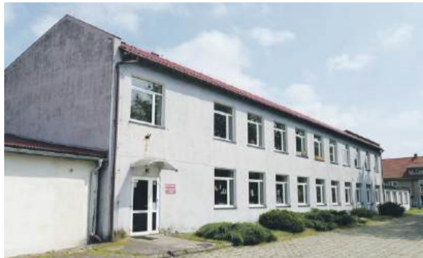
Prace związane z termomodernizacją budynku dawnej szkoły w Jegłowej mają zakończyć się w czerwcu przyszłego roku

linowej, Polnej i Skalników. Na zakończenie wójt Jarosław Taranek poinformował radnych, że gmina Przeworno otrzymała ponad 1,2 mln zł z Europejskiego Funduszu Rozwoju Regionalnego na kompleksową termomodernizację budynku oświatowego w Jegłowej. – Mamy już w przybliżeniu 1,5 mln zł na utworzenie żłobka, ale to są pieniądze na zagospodarowanie wnętrza budynku, teraz otrzymaliśmy środki na zewnątrz. Termin realizacji in-