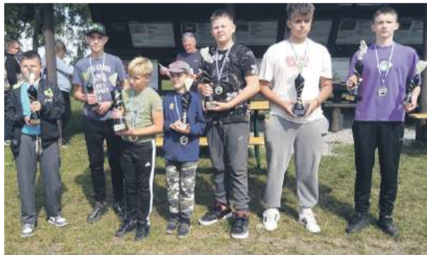
Najlepsi wędkarze w obu kategoriach wiekowych z pucharami i statuetkami.