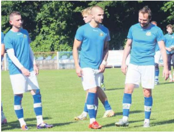
Piłkarze ze Strzelina wygrali kolejny mecz