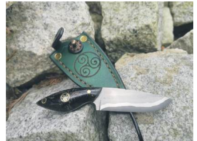
Nóż biżuteryjny typu „neck”. Stal wykonana w technice san mai z rdzeniem węglowym, rękojeść z szyszek olchy w żywicy z akcentem celtyckim wewnątrz pinu oraz na skórzanej pochwie.