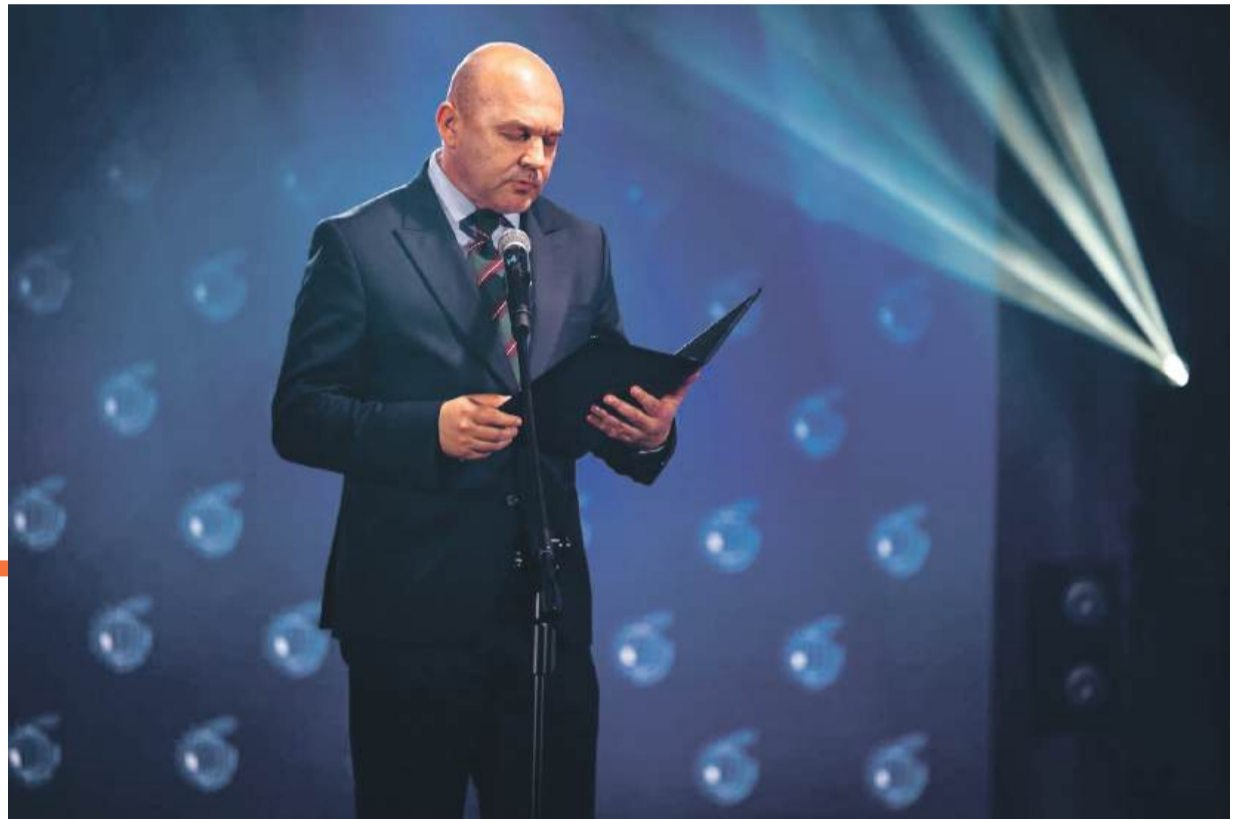
Wicemarszałek Województwa Dolnośląskiego Wojciech Bochnak podczas wygłaszania uroczystej laudacji na rzecz laureatów.

bieżące wyzwania stojące przed samorządami: od problemów z finansowaniem inwestycji, po strategię rozwoju lokalnego i regionalnego. - Dziś samorzady oczekują konkretnych i szybkich rozwiązań. Rozmawialiśmy o tym, jak skutecznie pozyskiwać środki zewnętrzne, jakie inwestycje są kluczowe oraz co możemy poprawić w ramach współpracy z poziomem województwa. Dolny Śląsk jest regionem zróżnicowanym, dlatego tym bardziej chcemy by każda gmina mogła rozwijać się w dobrym tempie. Po 3 dniach mamy bardzo szeroki obraz tej sy-