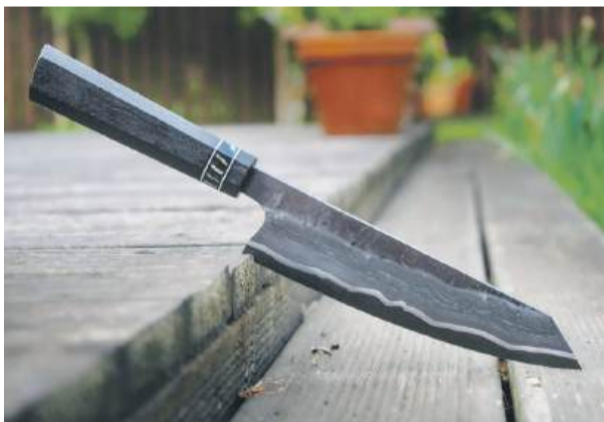
Nóż kuchenny typu Kiritsuke - wykonany przez Mieszka w tradycyjnej technice San-Mai z pięciu warstw stali. Rękojeść ze stabilizowanego drewna czarnego dębu ze wstawką z zęba mamuta. Fot. „By The Wood” Bartosz Winiarski