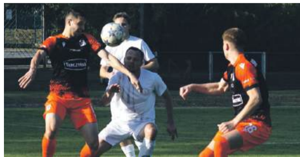
Piłkarze Strzelinianki odpadli z pucharowej rywalizacji

była wyrównana i zakończyła się bezbramkowym remisem. Tuż po zmianie stron rywale zdołali jednak otworzyć wynik spotkania, a w 90 minucie ustalili rezultat na 2:0. Wygrana gości