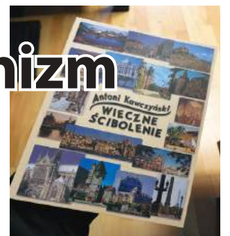
Książka opublikowana przez Wydawnictwo TiO. Do nabycia w księgarni „U Leszka” - Legionowo, Stefana Batorego 10

Gdy odłożyłem gazetę, przyszedł mi na myśl Lech Wałęsa, człek nieuczony i nie pozujący na intelektualistę, przeciwnie, przyjmujący nadany mu tytuł doktora honoris causa z przyrzuceniem oka. Zapytano go, co mniema o społeczeństwie poprzedniej doby, w wysokim stopniu upartyjnionym. Co