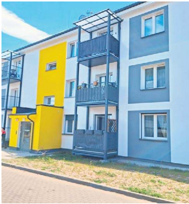
Mieszkania komunalne znajdują się między innymi w przebudowanym niedawno bloku przy ulicy Rolniczej 9