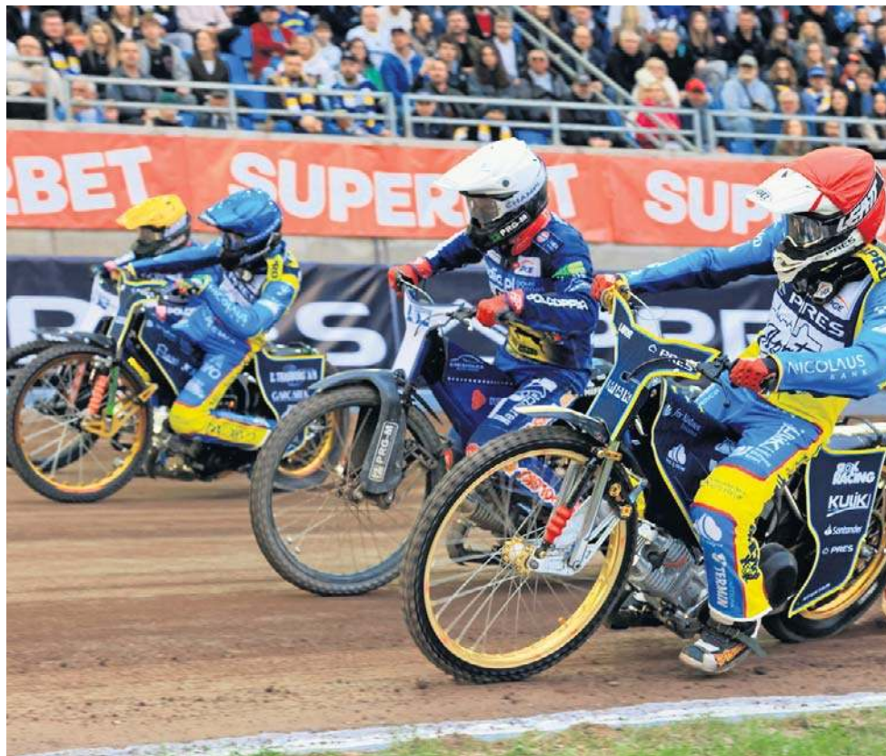
Torunianie niespodziewanie mieli ogromne problemy z Unią Leszno