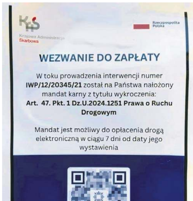
Tak wygląda fałszywe wezwanie do zapłaty mandatu

Apele o czujność zresztą nagleśnia teraz nie tylko KAS w Kujawsko-Pomorskiem, ale i całym krajem, a także policja. Najwyraźniej w połowie kwiet-