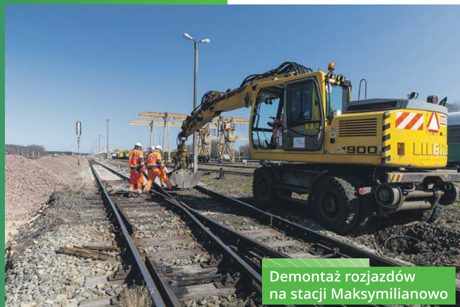
Demontaż rozjazdów na stacji Maksymilianowo

Jednym z najbardziej wymagających elementów inwestycji będzie budowa dwupoziomowego skrzyżowania obu linii. Oznacza to, że jedna z nich zostanie poprowadzona pod drugą – w specjalnie zaprojektowanym tunelu. To rozwiązanie stosowane jest rzadko, ponieważ większość skrzyżowań kolejowych odbywa się w jednym poziomie.