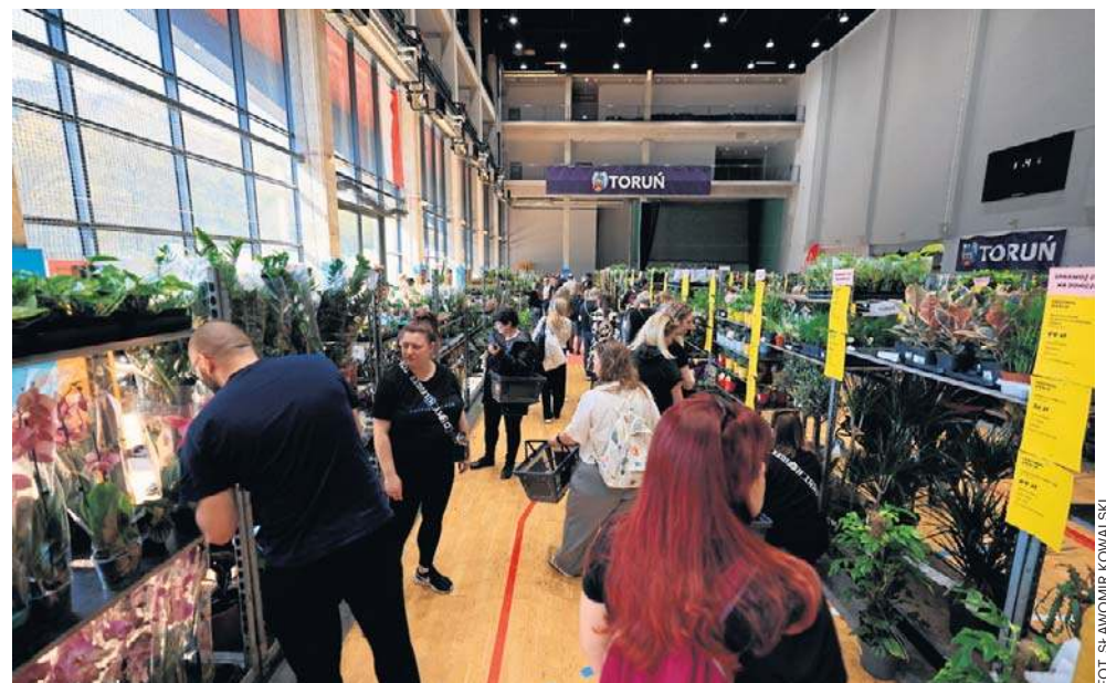
Weekend stał też pod znakiem Festiwalu Roślin zorganizowanego w Arenie Toruń