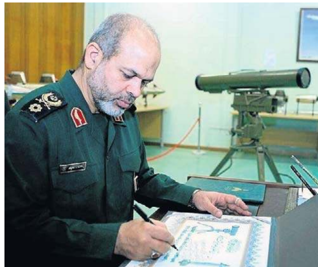
Generał Vahidi, dowódca Korpusu Strażników Rewolucji Islamskiej, rządzi dziś de facto Iranem

Media powiązane z IRGC ogłosiły również w sobotę, że Iran nie zgodził się na udział w kolejnej rundzie negocjacji ze Stanami Zjednoczonymi z powodu „nadmierzonych” żądań USA.