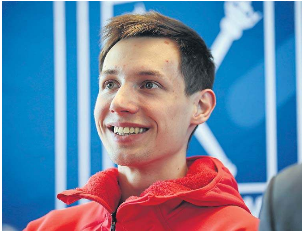
Kacper Tomasiak w minionym sezonie odniósł życiowe sukcesy. Na igrzyskach olimpijskich zdobył trzy medale

- W zasadzie nie zastanawiałem się jeszcze aż tak bardzo nad tym. Na pewno będzie ła-