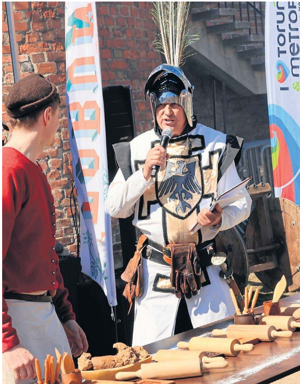
Cała impreza odbyła się w wyjątkowym, średniowiecznym klimacie nawiązującym do historii Torunia i jego piernikarskich korzeni