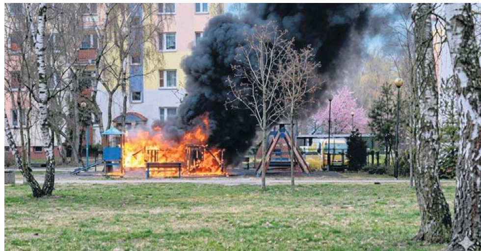
Pożar placu zabaw przy ulicy Wyszyńskiego 16 wyglądał bardzo groźnie. Na szczęście nikt nie ucierpiał

- Będziemy jednak trzymać kciuki za zupełnie nowy plac zabaw, który może zostać zrealizowany w ramach procedury Budżetu Obywatelskiego (nabór wniosków trwa do 24 kwietnia). To realna i najszybsza szansa na wsparcie mieszkańców, a przede wszystkim dzieci z tego osiedla w odzyskaniu ich ulubionego miejsca zabaw - dodaje prezydent Torunia. ©©