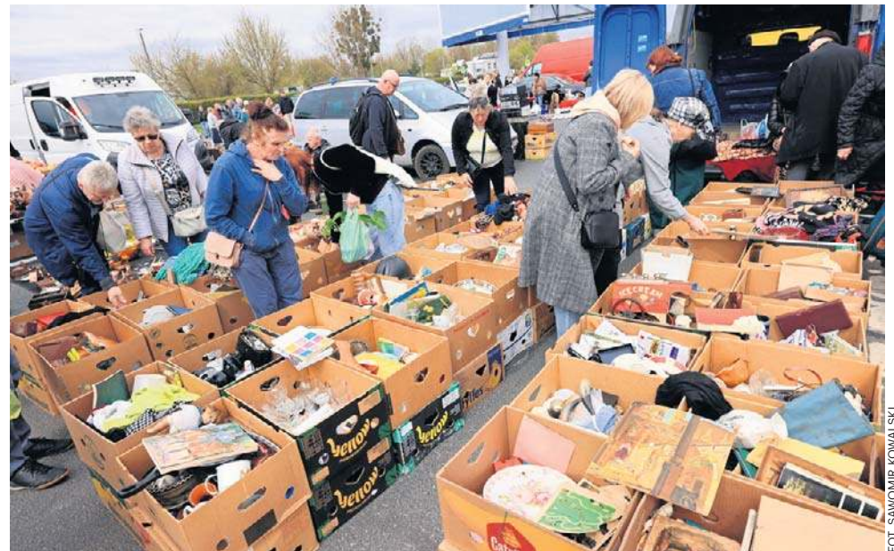
Pchli targ organizowany jest na parkingu CH „Kometa” przy ul. Grudziądzkiej w Toruniu