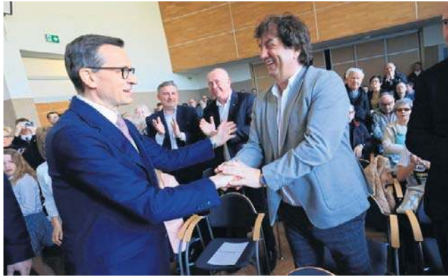
Mateusz Morawiecki wita się z uczestnikami spotkania

Gospodarzem sobotniego spotkania w Toruniu był poseł Krzysztof Szczucki, reprezentujący w Sejmie okręg toruński, w czasach rządów premiera Morawieckiego szef Rządowego Centrum Legislacji oraz krótko - minister edukacji i nauki. Co istotne, od 1 kwietnia jest on zawieszony w prawach członka PiS. To konsekwencja złamania dyscypliny zarządzonej w klubie PiS podczas głosowania Sejmu nad odrzuceniem weta prezydenta Karola Nawrockiego do nowelizacji Ko-