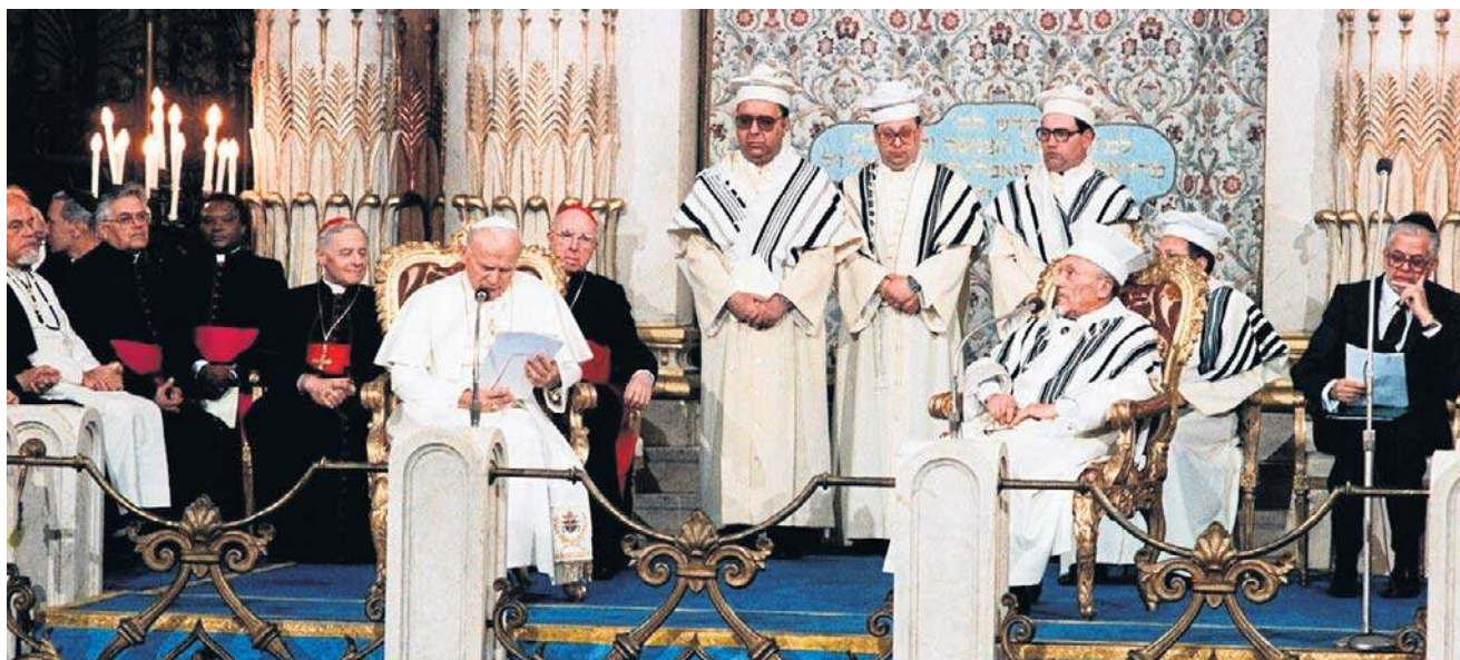
Przemawiając w synagodze, Jan Paweł II podkreślił, że nie można Żydom jako narodowi przypisywać żadnej dziedzicznej ani zbiorowej winy za to, co popełniono podczas męki Jezusa

Po raz pierwszy od czasów apostołskich, 40 lat temu, następca Świętego Piotra wszedł do żydowskiego domu modlitwy, modlił się i przemawiał do Żydów. Watykan od synagogi nad Tybrem dzieli niespełna kilometr, ale na gruncie ekumenizmu była to odległość bardzo długa. A jej echa słychać i dziś.