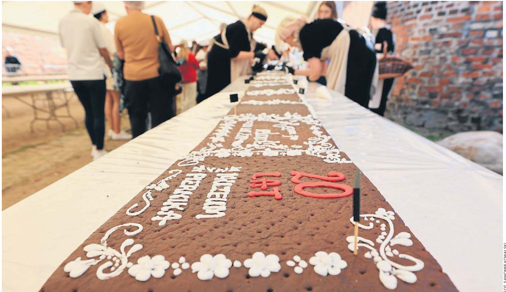
Rekord padł! Od 18 kwietnia najdłuższy piernik w Polsce wynosi 124,6 metra.

Organizatorzy planowali pobić dotychczasowy rekord wynoszący ponad 80 metrów długości, ustanowiony wcześniej podczas wydarzenia w Jaworze. Udało się pobić ten wynik. Od 18 kwietnia najdłuższy piernik w Polsce wynosi 124,6 metra. Ale to nie było jedyne wydarzenie tego weekendu w Toruniu. ©©