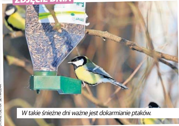
W takie śnieżne dni ważne jest dokarmianie ptaków.