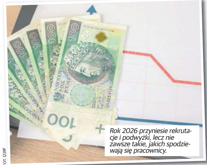
Rok 2026 przyniesie rekrutację i podwyżki, lecz nie zawsze takie, jakich spodziewają się pracownicy.

- Rośnie zapotrzebowanie na doświadczonych ekspertów, łączących bogate doświadczenie i wiedzę z zaawansowanymi kompetencjami cyfrowymi, leaderskimi oraz miękkimi. Pracodawcy mają jednak świadomość, że pozyskanie takich