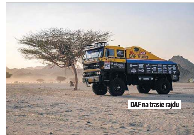
DAF na trasie rajdu

- Ten DAF to kultowa ciężarówka. Ona ma dwa silniki. Przedni silnik napędza tylny most, a tylny - przedni most. Niezwykła konstrukcja, ma 800 koni - dodaje Grodzki