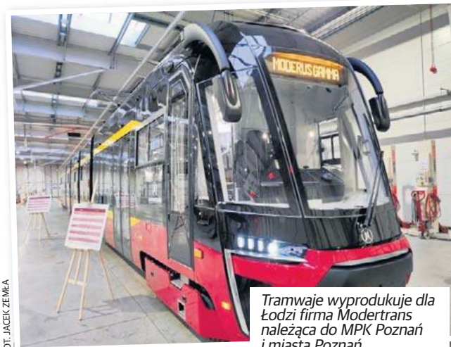
Tramwaje wyprodukowane dla Łodzi firma Modertrans należąca do MPK Poznań i miasta Poznań.

Jednak raczej nie obejdzie się bez zakupu wagonów używanych, bo czeka nas rozwój sieci tramwajowej w Łodzi, a duża część najstarszych Konstali 805Na jest już w stanie kwalifikującym je na złom.