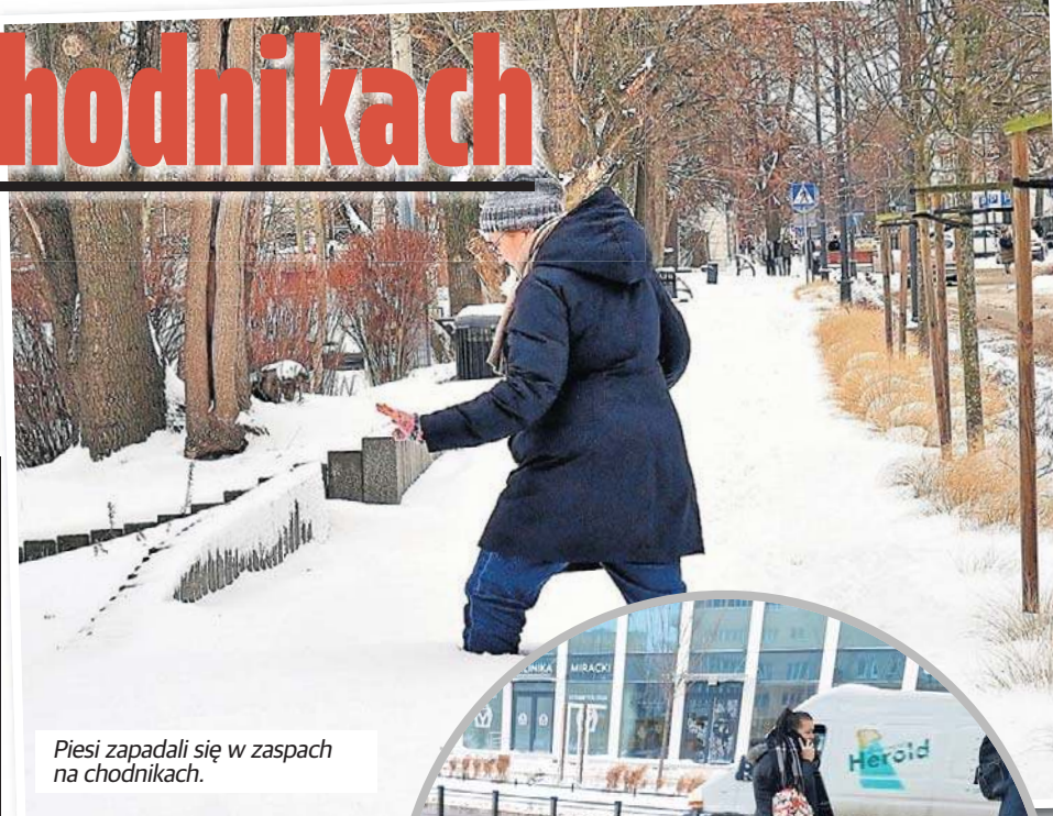
Piesi zapadali się w zaspach na chodnikach.

Łodzianie mogą zgłaszać sygnały o nieodsnieżonych miejscach pod nr 42 638 49 73 albo mejlowo: zima@uml.lodz.pl. Za odsnieżanie chodników od-