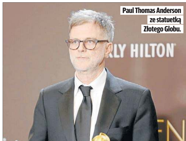
Paul Thomas Anderson ze statuetką Złotego Globu.

Anderson, dziękując za wyróżnienie na gali w Los Angeles, powiedział, że tworzenie filmów to „jedyne legalne sposoby na bycie paranoikiem w świetle reflektorów”. Film utrzymany w charakterystycznym dla twórcy stylu koncen-