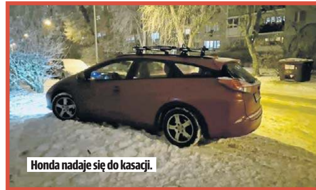
Honda nadaje się do kasacji.