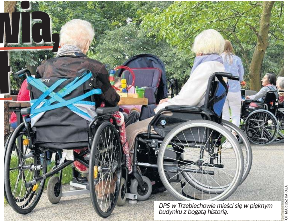
DPS w Trzebiechowie mieści się w pięknym budynku z bogatą historią.

- Jak szybko będą następować zmiany - trudno powiedzieć. Często patrzę z ogromnym zadziwieniem na osoby młode, które, będąc w pełni sił, na początku kariery zawodowej, żyją tylko dniami dzi-