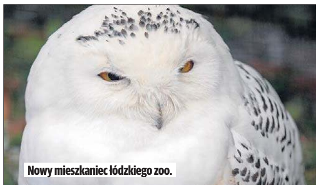
Nowy mieszkaniec łódzkiego zoo.