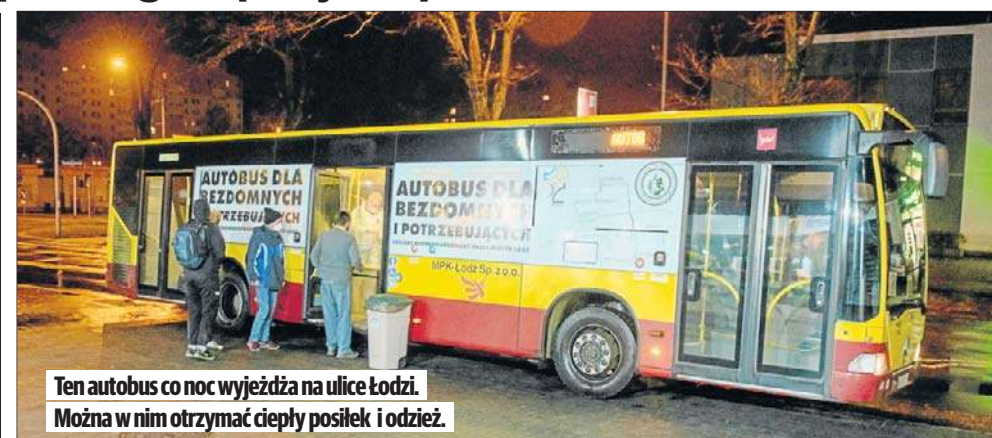
Ten autobus co noc wyjeżdża na ulice Łodzi. Można w nim otrzymać ciepły posiłek i odzież.

- Bezdomni, osoby w trudnej sytuacji życiowej, chętnie ko-