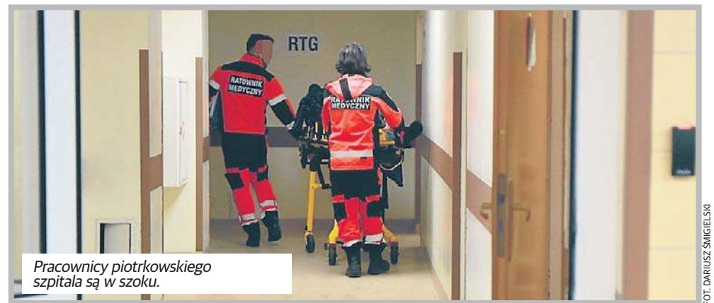
Pracownicy piotrkowskiego szpitala są w szoku.

- Lekarz usiłował zaproponować diagnostykę, odpowiedzią była agresja. Na koniec swojej wizyty pani pobiła dyżurujące osoby. Na miejsce został wezwany patrol policji, ale gdy dotarł, kobieta i towarzyszący jej męż-