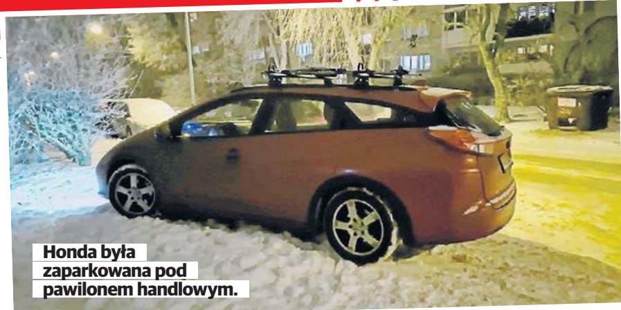
Honda była zaparkowana pod pawilonem handlowym.

• Ashton Kutcher i Mila Kunis zachwycili, Emma Stone podobno nie... STR. 13