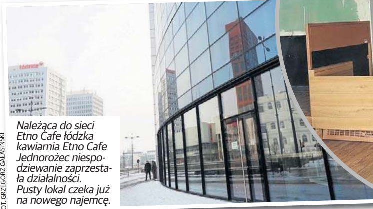
Należąca do sieci Etno Cafe łódzka kawiarnia Etno Cafe Jednorożec niespodziewanie zaprzestała działalności. Pusty lokal czeka już na nowego najemcę.

strzeń znajdującego się w tym samym budynku Centrum Medycznego Medicover. ©