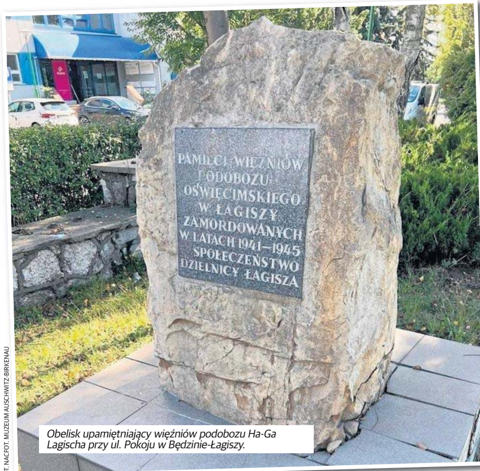
Obelisk upamiętniający więźniów podobozu Ha-Ga Łagischa przy ul. Pokoju w Będzinie-Łagiszy.