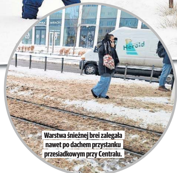
Warstwa śnieżnej brei zalegała nawet po dachach przystanku przesiadkowego przy Centralu.

powiada administrator lub zarządca nieruchomości. Jeśli tego nie zrobi, straż miejska może nałożyć mandat do 1,5 tys.