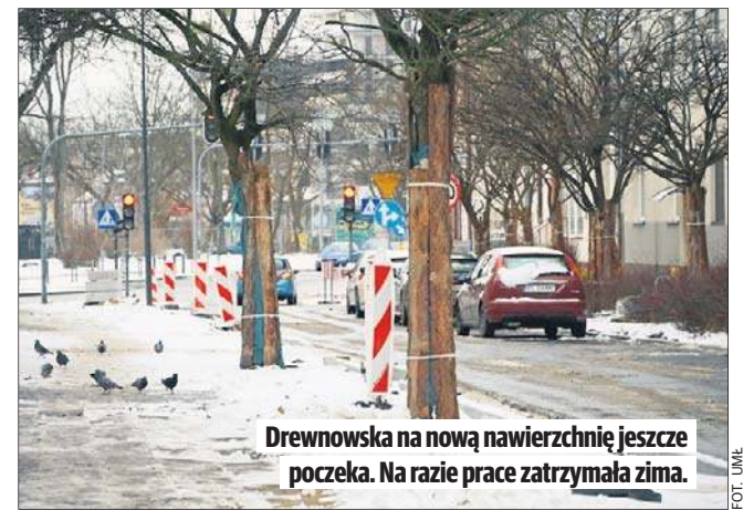
Drewnowska na nową nawierzchnię jeszcze poczeka. Na razie prace zatrzymała zima.

W tym roku nastąpi także zakończenie prac na Drewnowskiej. Między Zgierską i Zachodnią przed świętami zakończono układanie nowych sieci podziemnych, ale z powodu zimy drogowcy nie mogli dokończyć układania nawierzchni i przebudowy chodników. Tylko na jednym odcinku drogi pojawił się nowy asfalt. Gdy zima odpuści, prace zostaną dokończona, a ulica oddana do użytku.