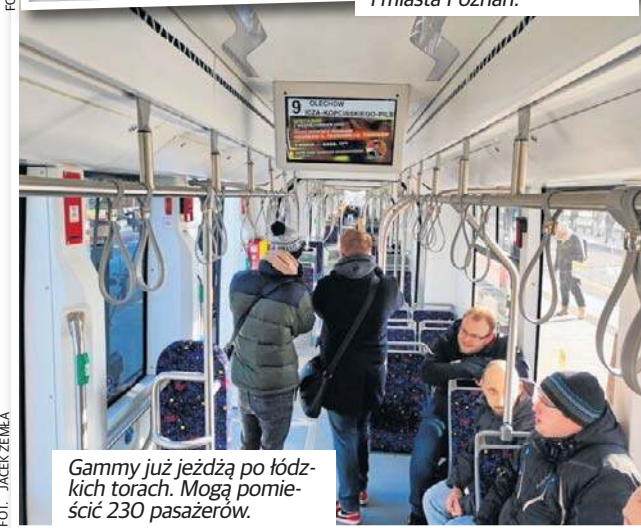
Gammy już jeżdżą po łódzkich torach. Mogą pomieścić 230 pasażerów.