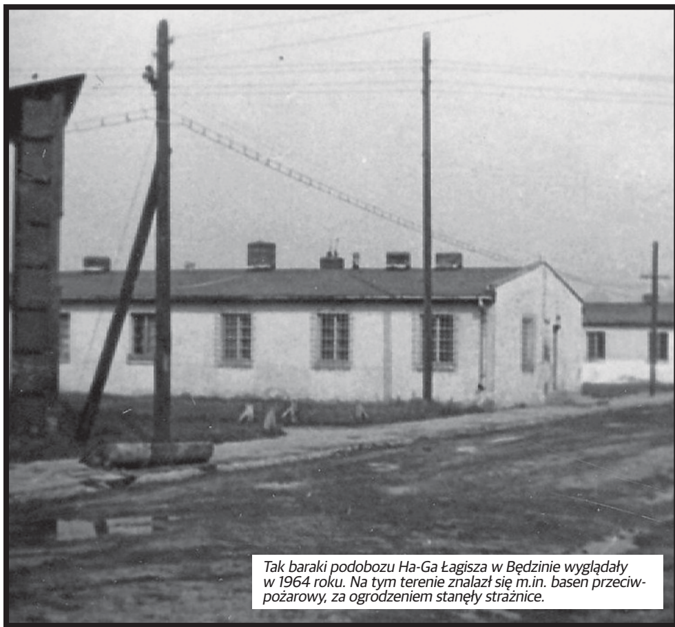
Tak baraki podobożu Ha-Ga Łagisza w Będzinie wyglądały w 1964 roku. Na tym terenie znalazł się m.in. basen przeciwpożarowy, za ogrodzeniem stanęły strażnice.