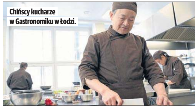
Chińscy kucharze w Gastronomiku w Łodzi.