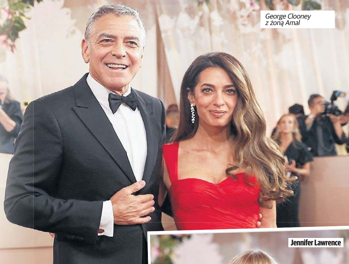
George Clooney z żoną Amal

Emma Stone na gali Złotych Globów pojawiła się w kremowym komplecie: topie odsłaniającym umięśniony brzuch i spódnicy od Louis Vuitton. Strój aktorki zdaniem internautów komentujących wydarzenie na platformie X, delikatnie mówiąc, był nietrafiony.