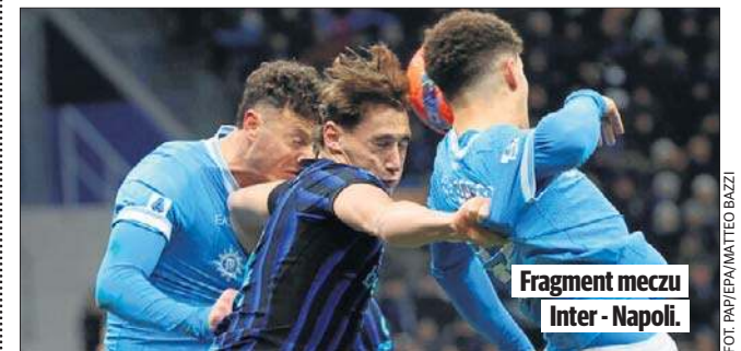
Fragment meczu Inter - Napoli.