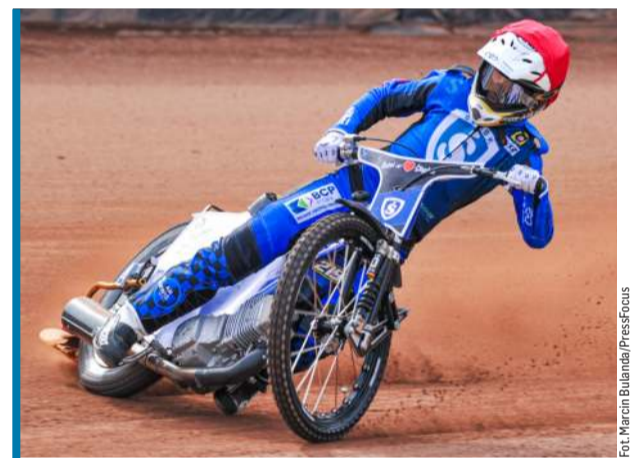
Czy Śląsk wygra drugi mecz z rzędu?