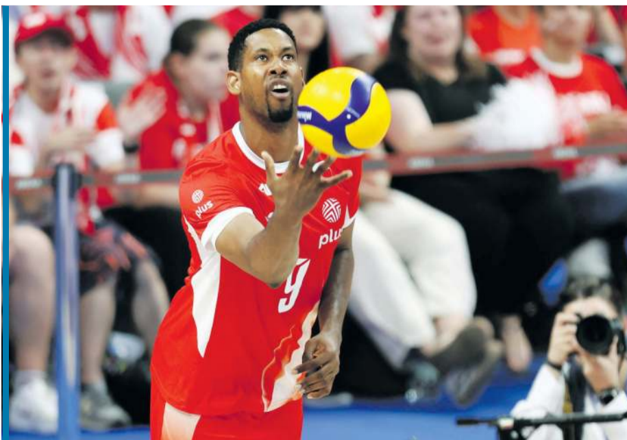
Wilfredo Leon zaprasza wszystkie dzieciaki na wspólny trening.