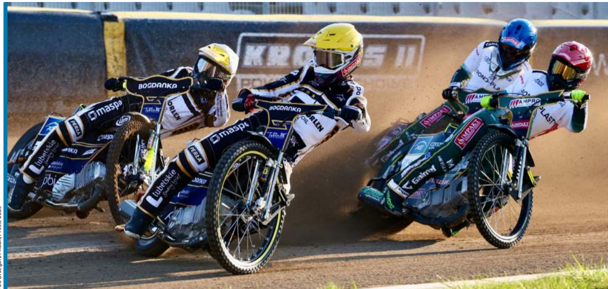
Zawodnicy Motoru na dwóch czołowych pozycjach. Tak wyglądała większość wyścigów w Częstochowie.