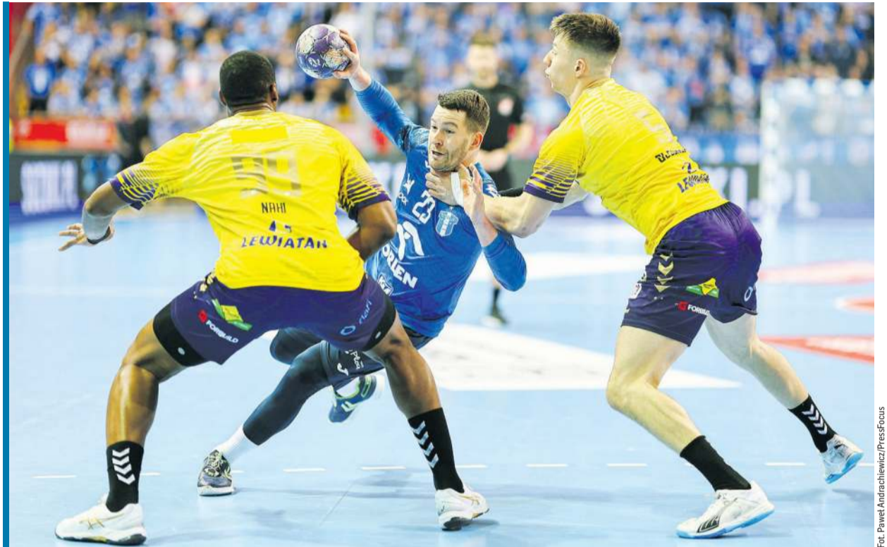
Już w sobotnim półfinale dojdzie do rewanżu za finał poprzedniej edycji Pucharu Polski.

Wszystko rozpocznie się w sobotę od półfinałów, które wyłonią finalistów niedzielnego starcia o trofeum. W XXI wieku rywalizacja o krajowy puchar zdominowana jest przede wszystkim przez zespoły z Płocka i Kielce. W nowym tysiącleciu to właśnie one zdobyły łącznie aż 23 tytuły, w 2002 roku triumfowała Warszawianka, natomiast w 2020 roku rozgrywki finałowe się nie odbyły. W sobotę kibice będą świadkami prawdziwego klasyku, w którym broniąca