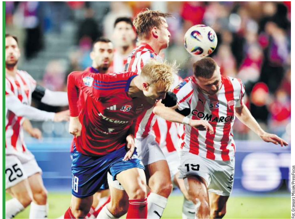
Raków w tym sezonie przegrał z Cracovią w lidze 0:2, ale w Pucharze Polski wygrał 3:0. Jak będzie w niedzielę?