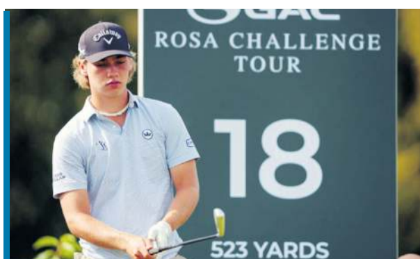
Drugiego dnia GAC Rosa Challenge Tour zagrał fenomenalnie.