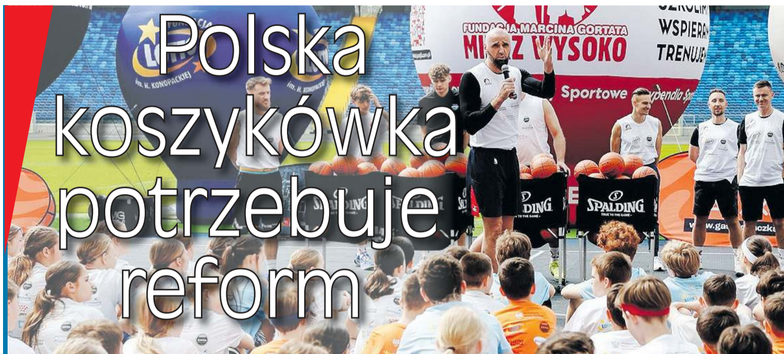
Blisko setka dzieciaków trenowała pod okiem Marcina Gortata na Stadionie Śląskim.