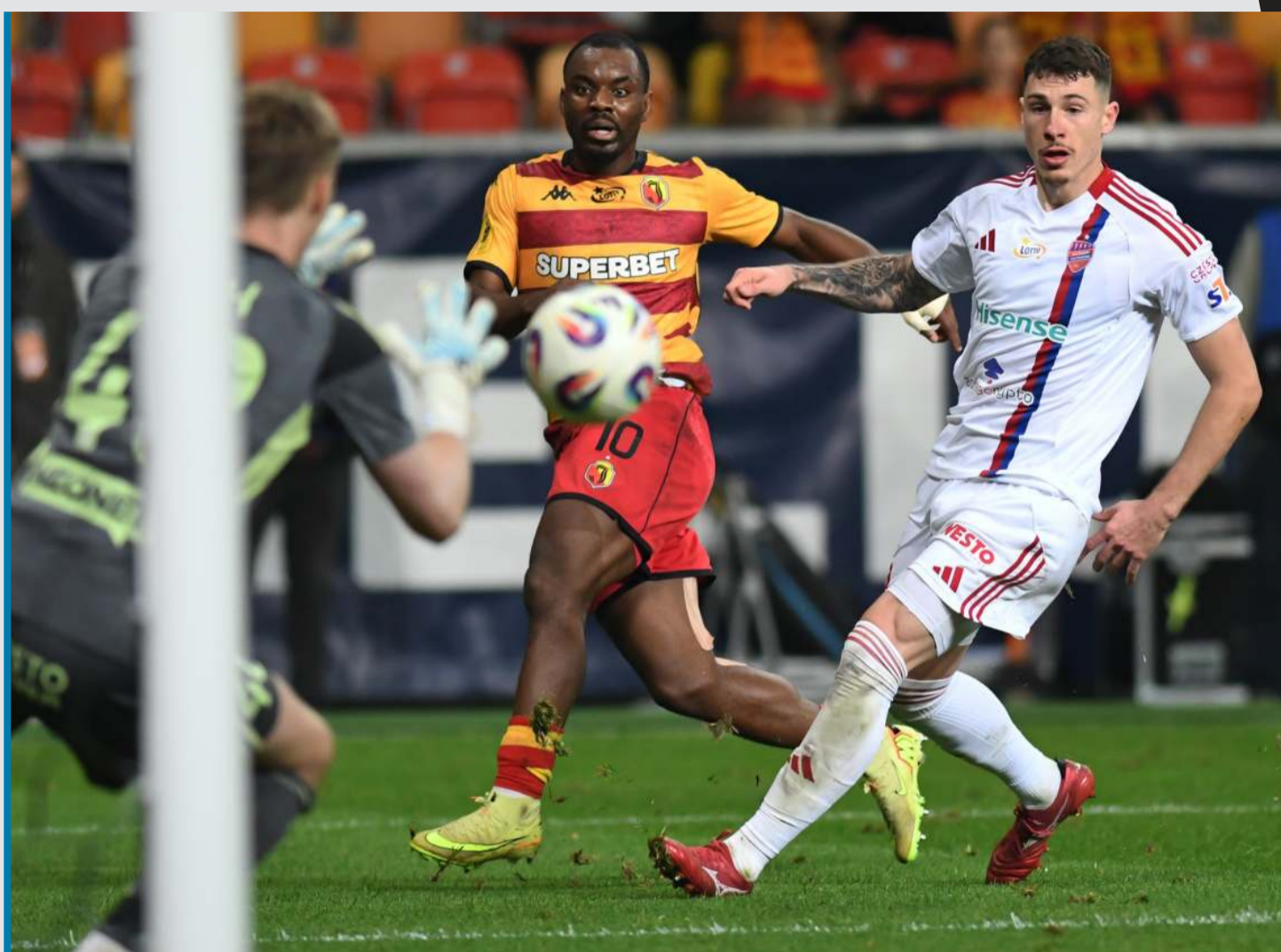
Gra naszych zespołów w Lidze Konferencji to nie sukces sportowy tylko obciach...?

wyczynowego uprawiania sportu jako swojego zawodu wykonywanego. W pierwszym wariantcie cały cykl szkolenia zawodnika jest podporządkowany schematowi wyszkolenia i kształtowania zawodników profesjonalnych posiadających właściwy, odpowiedni warsztat piłkarski i cechy motoryczne (wydolność, wytrzymałość, szybkość) gotowych do rywalizacji na poziomie zawodników I drużyny opcją ich wytransferowania po krótkim okresie gry w seniorach. W takiej sytuacji następuje brak naboru zawodników do I drużyny albo występuje on incydentalnie. Niemalże cały okres szkolenia młodzieży (juniorów) następuje tylko w kontekście wzbogacania i urozmaicenia warsztatu zawodniczego (poziomu technicznego i taktycznego) oraz kształtowania ich cech motorycznych. W sensie ogólnym trenerzy młodzieży skupiają się na kreowaniu ww. umiejętności ich podopiecznych, a nie ściśle na wyniku sportowym, który w piłce juniorskiej nie jest tak istotny jak w piłce profesjonalnej, dorosłej. Co więcej, ta zbyt wczesna specjalizacja w wyszkoleniu zawodniczym (co do zasady tak jest w Polsce) czyli osiągnięcie wyniku sportowego w wieku juniorskim odbija się standardowo negatywnie na poziomie przyszłych seniorów, którym brakuje umiejętności ściśle piłkarskich, bo ta wąska