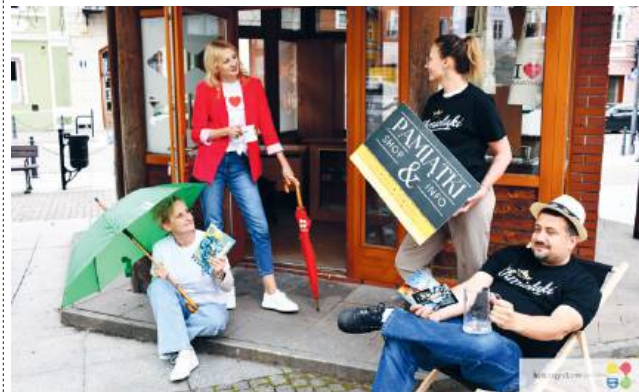
fol. UM Krasnostaw

W rynku miejskim rozpoczął działalność nowy punkt z pamiątkami, w którym lokalna tradycja łączy się z kreatywnym podejściem do promocji miasta i regionu.