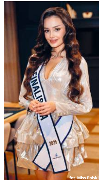
for. Miss Polski

MK: - Wydaje mi się, że najistotniejsza rada, jaką mogę dać, to to, że warto wychodzić poza swoją strefę komfortu, przełamać pewne lęki czy bariery, bo właśnie w taki sposób można się rozwijać i wyraźnie dostrzegać własny progres. Nie ma sensu przejmować się opiniami innych, ponieważ są to nasze decyzje i nasze marzenia. Osobiście nie spotkałam się dotąd z negatywnymi opiniami czy stereotypowym podejściem do brania udziału w konkursach piękności, ale zdaję sobie sprawę, że istnieje takie przypadki, a komentarze w stylu, że „skoro jest miss, to na pewno jest ładna, ale niekoniecznie ma coś do powiedzenia” nie mają nic wspólnego z rzeczywistością. Nie wiem, skąd się to bierze, ponieważ dziewczyny, które