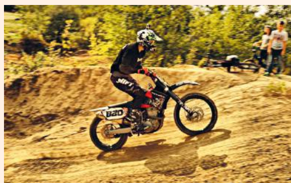
fol. Chełm Racing Team

Uczestnicy będą rywalizowali w kilku kategoriach: klasa kobiet, hobby, junior, junior 65, junior 85, eksperci z licencją, amatorzy i weterani. Długość i kształt trasy będą dostosowane do stopnia zaawansowania oraz wieku startujących. Każdy biorący udział w Pucharze Lubelszczyzny Wschodniej musi