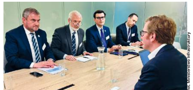
Wiceminister Stanisław Bukowiec spotkał się z europosłami zaangażowanymi w prace Komisji Transportu i Turystyki (TRAN)

Wszyscy są doskonale świadomi tego, że umowa zburza równowagę na rynku transportu drogowego – przewoźnicy z Ukrainy mają takie same prawa jak przewoźnicy z terenu unii, ale nie muszą z kolei spełniać unijnych wymogów. Przewoźnicy z terenu UE nie są w stanie konkurować z przewoźnikami ukraińskimi, ponieważ są zobowiązani do wypełniania chociażby tych wymogów, które związane są z europejskim „Pakiem mobilności”. To przepisy, które regulują między innymi warunki pracy kierowców, w tym ich wynagrodzenia, przepisy