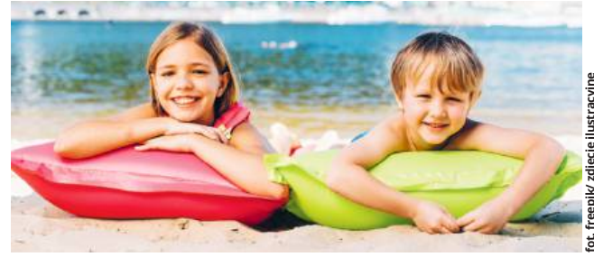
fort. freepik/ zdjęcie ilustracyjne

Publikowane są tam informacje dotyczące jakości wody, infrastruktury, warunków panujących na kąpielisku, jego klasyfikacji i profilu. Są tam także informacje o aktualnych przepisach, zaleceniach sanepidu i terminarzu organizacji kąpielisk. Na stronie zamieszczona jest mapa z zaznaczonymi kąpieliskami oraz ich wyszukiwarka. Po wybraniu konkretnej lokalizacji wyświetla się komunikat dotyczący trwania sezonu kąpielowego dla danego kąpieliska. W przypadku już aktywnych kąpielisk, czyli takich, w których sezon się już rozpoczął, możliwy jest odczyt pełnej informacji. W przypadku pozostałych dostępna jest informacja dotycząca planowanego startu sezonu kąpielowego.