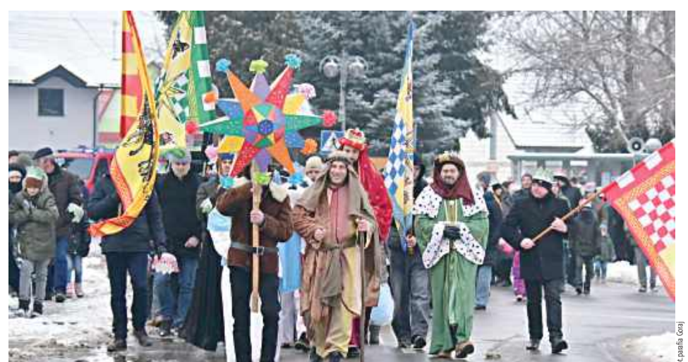
Po zakończeniu Eucharystii uczestnicy, prowadzeni przez symbol gwiazdy betlejemskiej oraz trzech królów, wyruszyli w barwnym orszaku ulicami miasta, by oddać pokłon Nowonarodzonemu