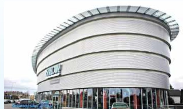
Blisko 12,5 tysiąca widzów obejrzało filmowy hit Zamościa w 2025 roku

Znany największe hity 2025 roku w Zamościu. Mowa o hitach filmowych, które mieszkańcy najchętniej oglądali w Centrum Kultury Filmowej „Stylowy”. Ten numer jeden obejrzało w ubiegłym roku, blisko 12,5 tysiąca kinomanów.