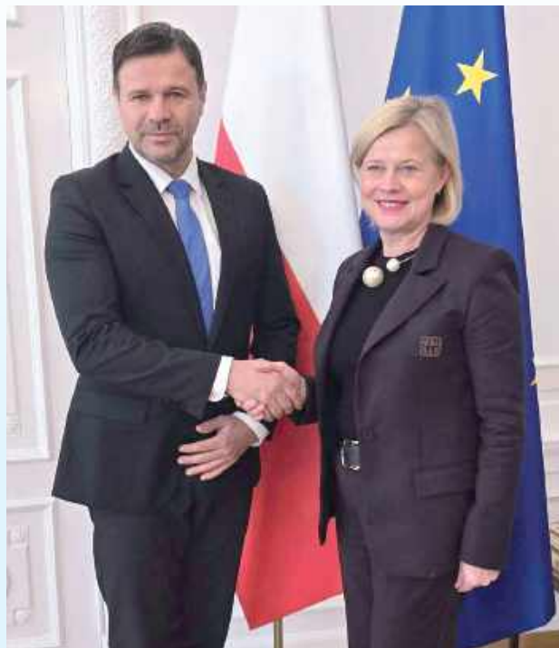
Prezydent Zamościa proponuje połączenie Centrum Kultury i Nauki w Pałacu Zamojskich z Muzeum Dzieci Zamojszczyzny

Pałac Zamojskich jest wpisany do rejestru zabytków i objęty ochroną konserwatorską. Jest też częścią wpisanego na listę UNESCO Starego Miasta w Zamościu. Niestety znajduje się w coraz gorszym stanie technicznym i wizualnym. Brak regularnych, kompleksowych prac konserwatorskich i remontowych sprawił, że elewacje są uszkodzone, mury