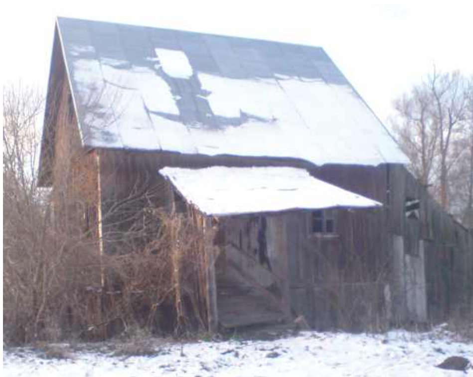
Młyn w Soli z końca XIX wieku

Pierwsze wzmianki pochodzą już z XVII wieku, jednak dokładniejsze dane pochodzą z lat 80 XVIII wieku, kiedy to młynarze Gawurzynowscy mieli młyn wymagający pilnego remontu. Mapa z 1804 roku wzmiankuje ten młyn, który znajdował się przy Czarnej Ładzie, a około 15 lat później wybudowano folwark Zofiampol. W skład tego folwarku wchodził także dom młynarza. Stary, ponad stuletni obiekt spłonął w latach 10.