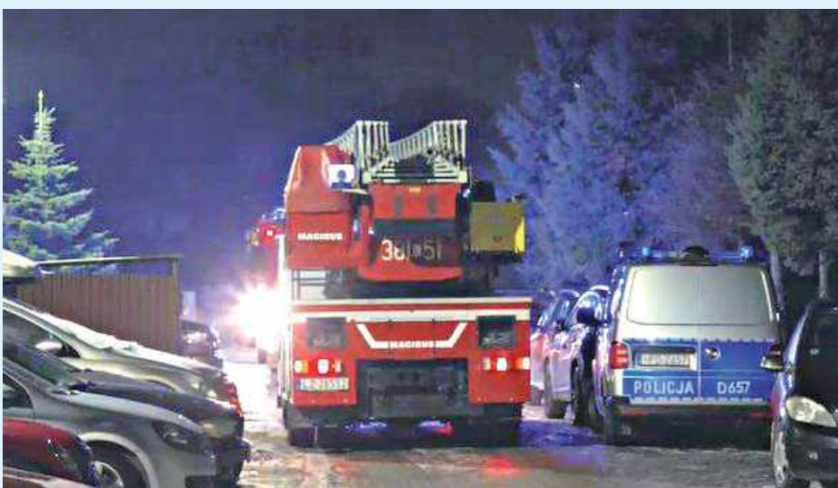
Policjant z Zamościa pomógł 77-latce wydostać się z bloku, w którym wybuchł pożar