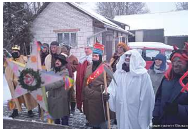
Hej kolęda, kolęda!