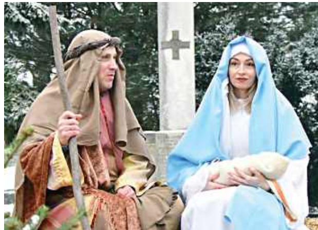
Wspólne kołędowanie i radosna atmosfera podkreślały uroczysty charakter wydarzenia