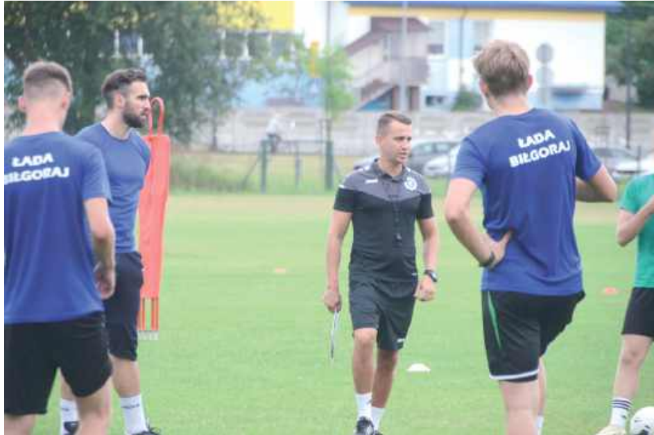
Piłkarze Łady będą trenować cztery razy w tygodniu. To zajęcia na siłowni OSiR i na boisku w Majdanie Starym

- Mogę powiedzieć, że chcemy sprawdzić kilku lokalnych młodych chłopaków. Jeszcze juniorów. Nie wykluczam, że niektórym damy szansę z myślą o przyszłości. Na ten moment nic więcej nie mogę powiedzieć o ewentualnych