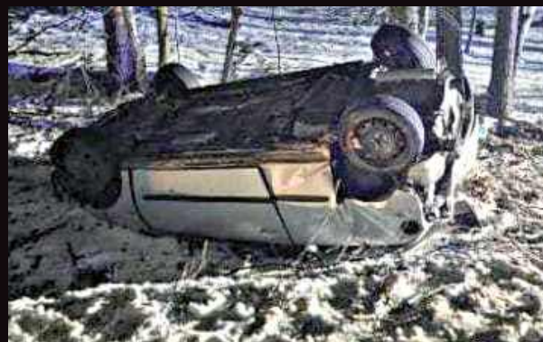
Dachowanie w Hucie Turobińskiej. 31-latek zginął na miejscu