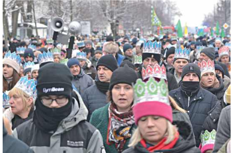
Orszak Trzech Króli ulicami Biłgoraja