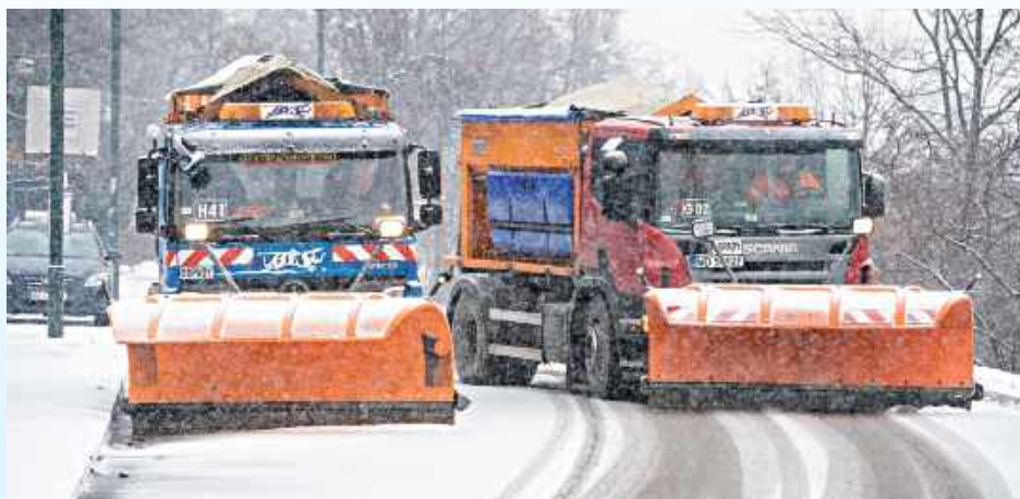
Na niektórych drogach Zamojszczyzny dopuszczalne przerwy w przejeździe mogą sięgać nawet 24 godzin

Tylko niewielka część, około 24 kilometrów, obejmuje wyż-