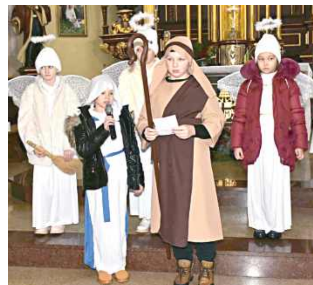
Piękne jasełka w wykonaniu dzieci