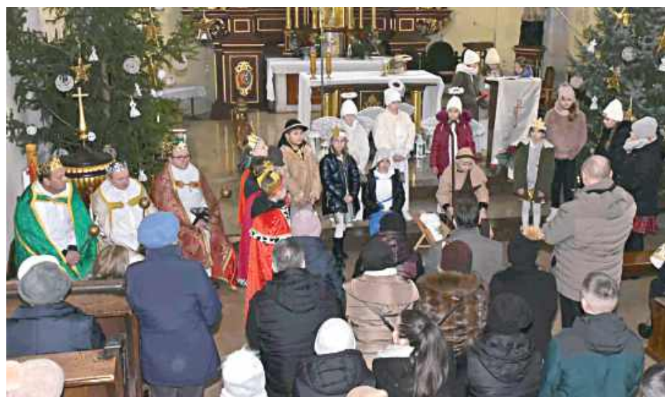
Po dotarciu do świątyni zaprezentowano jasełka w wykonaniu uczniów Szkoły Podstawowej w Gródkach