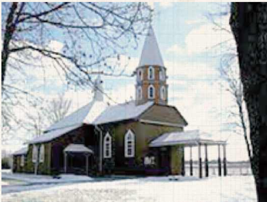
Dawna cerkiew, obecnie kościół w Lipinach Górnym