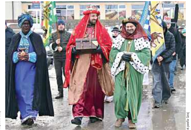
Orszak Trzech Króli przeszedł ulicami Goraja