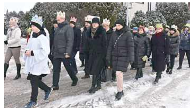
W Turobinie tradycji stało się zadość