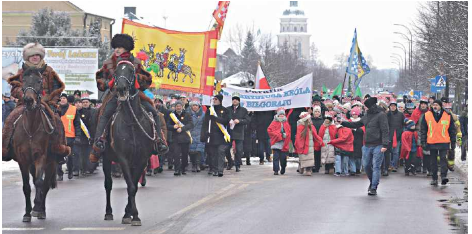
Orszak Trzech Króli ulicami Biłgoraja