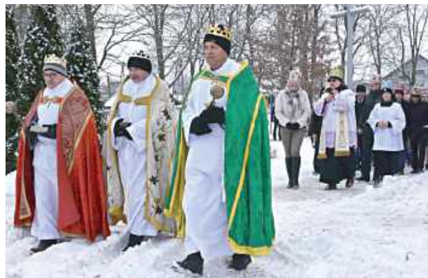
Orszak, tradycyjnie już, prowadzili trzej królowie