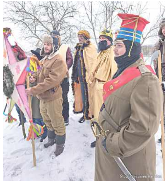
Ułani z Biszczy stworzyli nową piękną tradycję