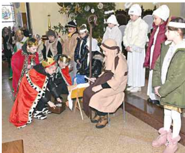
Pokłon Trzech Króli w turobińskim kościele