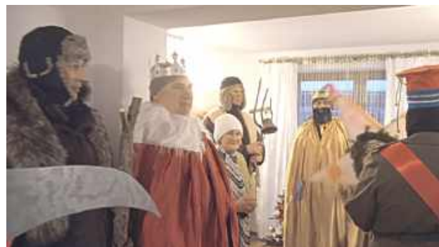
Mieszkańcy ciepło i serdecznie witali kolędników