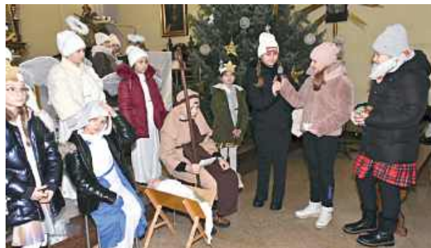
Orszak Trzech Króli przeszedł ulicami Turobina