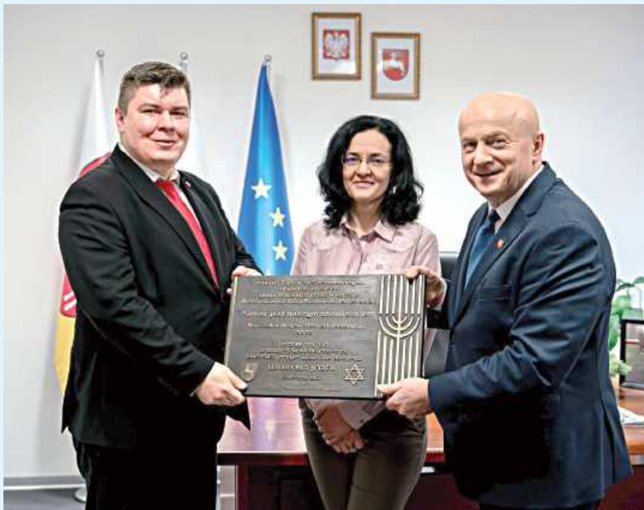
Ta tablica zawisnie na synagodze w Szczepieszynie

- Jako burmistrz mam obowiązek być pośrodku — tak, aby łączyć ludzi, a nie ich dzielić. Tablica, zgodnie ze stanowiskiem Rady Miejskiej, będzie umieszczona na synagodze (budynek MDK). W naszej wspólnocie są różne poglądy, różne emocje i różne wrażliwości. Wszystkie one zasługują na wysłuchanie, ale nie mogą prowadzić do podziałów. Historia Szczepieszyna jest faktem. 55 proc. przedwojennej populacji miasta stanowili Żydzi (obecnie 0 proc.). Tablica, o której mowa, nie jest manifestem politycznym ani ideologicznym. Jest wyłącznie znakiem pamięci o ludziach, którzy przez lata współtworzyli nasze miasto, pracowali na jego rozwój. Nie ma tu „drugiego dna”, ukrytych intencji ani prób narzucania komukolwiek poglądów. Jest pamięć, jest historia i jest szacunek