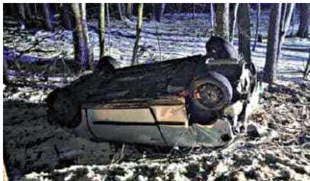
Ze wstępnych ustaleń policjantów pracujących na miejscu zdarzenia wynika, że 31-letni mieszkaniec powiatu biłgorajskiego, kierując Seatem, na łuku drogi nie dostosował prędkości do warunków panujących na drodze

Do wypadku doszło na drodze wojewódzkiej 835 w miejscowości Huta Turobińska. Ze wstępnych ustaleń policjantów pracujących na miejscu zdarzenia wynika, że 31-letni mieszkaniec powiatu biłgorajskiego, kierując Seatem, na łuku drogi nie dostosował