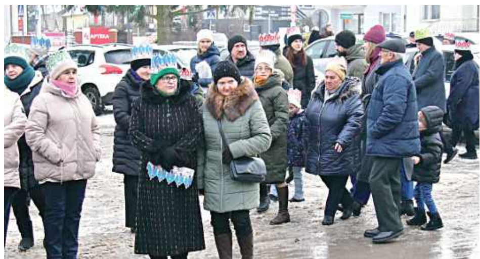
Mieszkańcy chętnie uczestniczyli w tym barwnym wydarzeniu