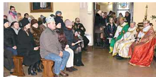
Po jasełkach odprawiona została msza święta, stanowiąca duchowy finał wydarzenia