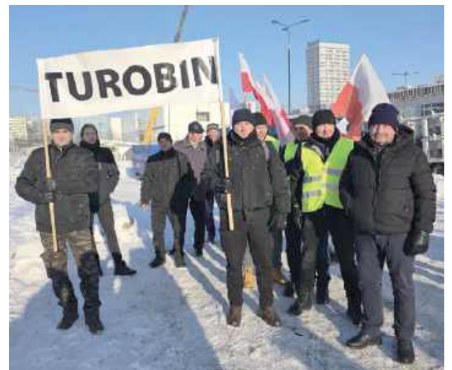
Delegacja z gminy Turobin na proteście rolników w Warszawie