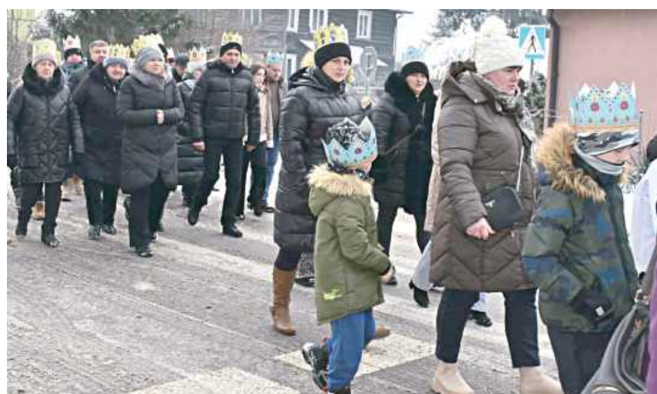
Mieszkańcy Turobina przeszli 6 stycznia w Orszaku Trzech Króli

W Uroczystość Objawienia Pańskiego, 6 stycznia w Turobinie odbył się Orszak Trzech Króli, który zgromadził mieszkańców gminy oraz gości pragnących wspólnie przeżyć to tradycyjne i radosne wydarzenie. Barwny przemarsz, jasełka oraz wspólna modlitwa stworzyły wyjątkową atmosferę święta.