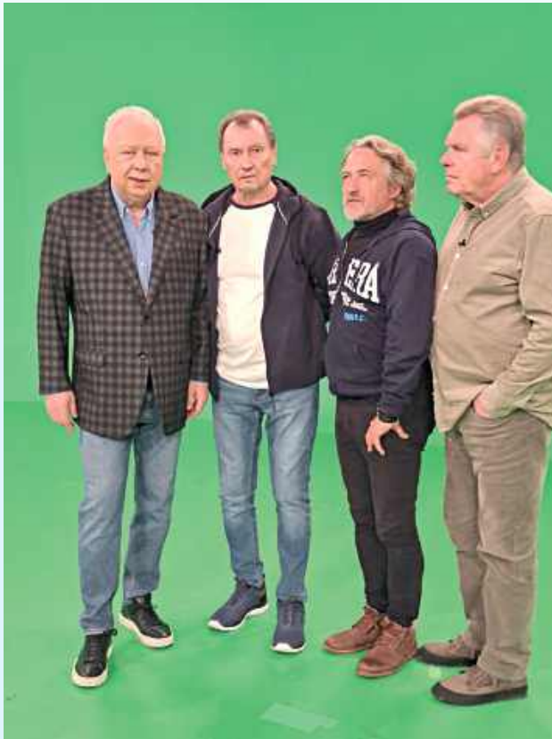
Zespół VOX wziął udział w nagraniu programu Marka Sierockiego