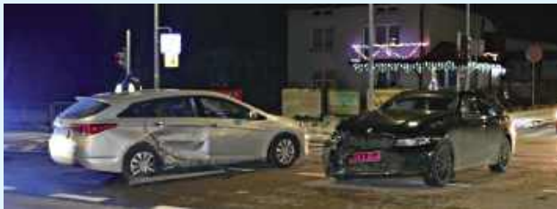
Do zderzenia dwóch samochodów osobowych doszło na skrzyżowaniu w Kalinowicach

Z ustaleń policjantów zamojskiego ruchu drogowego wynika, że kierujący pojazdem marki Hyundai, 38-letni mieszkaniec Zamościa, poruszał się od strony Pniówka. Mając zielone światło, rozpoczął manewr skrętu w lewo w kierunku Zamościa. Nie upewnił się jednak, czy z przeciwnej strony nie jedzie żaden pojazd. Okazało się, że w tym samym czasie