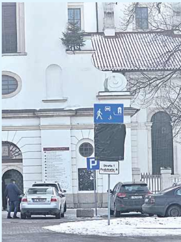
Na Starym Mieście w Zamościu zostały zasłonięte tablice informujące o strefie płatnego parkowania

Wskazywana w komentarzach kwota ma charakter szacunkowy i hipotetyczny. W obowiązującym porządku prawnym nie stanowi ona „należności”, której niepobranie mogłoby być kwalifikowane jako szkoda finansowa lub naruszenie dyscypliny finansów publicznych. Do momentu wejścia w życie uchwały roz-