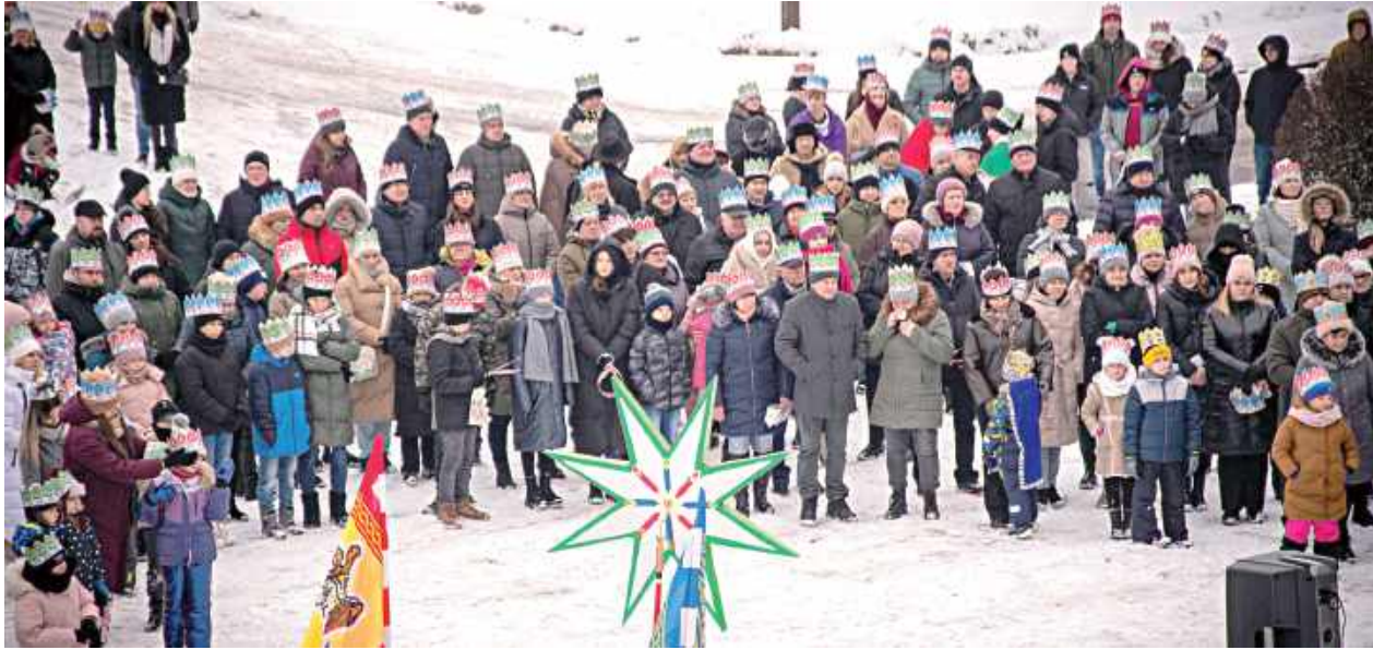
Orszak Trzech Króli w Terespolu

We wtorek, 6 stycznia w Terespolu-Zaorendzie odbył się Orszak Trzech Króli, zorganizowany przez parafię pw. Matki Bożej Częstochowskiej.