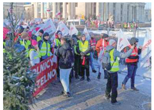
Rolnicy rozpoczęli zgromadzenie przed Pałacem Kultury i Nauki w Warszawie, a następnie przeszli Alejami Jerozolimskimi pod Kancelarię Prezesa Rady Ministrów oraz Sejm. Głównym motywem manifestacji był sprzeciw wobec umowy handlowej UE-Mercosur

- Stoimy po stronie polskiego rolnika i polskiego produktu! Gdy w Brukseli zapadają decyzje o umowie z Mercosurem, mówimy jasno: nie zgodzimy się na rozwiązania, które osłabiają polski eksport i rynek zbytu w UE.