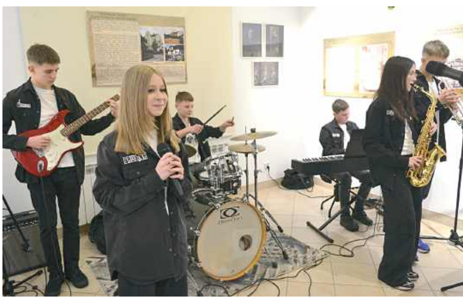
Zespół Las&Rock dał piękny pokaz świątecznego klimatu

Występ trwał ponad godzinę i został bardzo dobrze przyjęty przez zgromadzoną publicz-