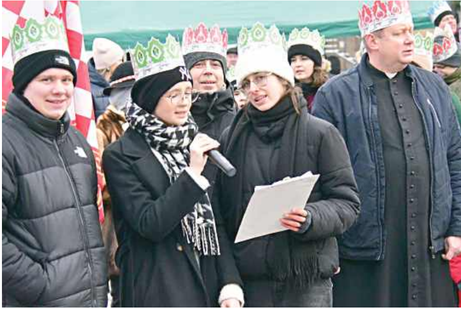
Orszak Trzech Króli w Goraju

Po raz szósty ulicami Goraja przeszedł Orszak Trzech Króli, gromadząc licznych mieszkańców miasta oraz gości, którzy wspólnie celebrowali uroczystość Objawienia Pańskiego. Wydarzenie na stałe wpisało się w kalendarz lokalnych inicjatyw religijnych i kulturalnych.