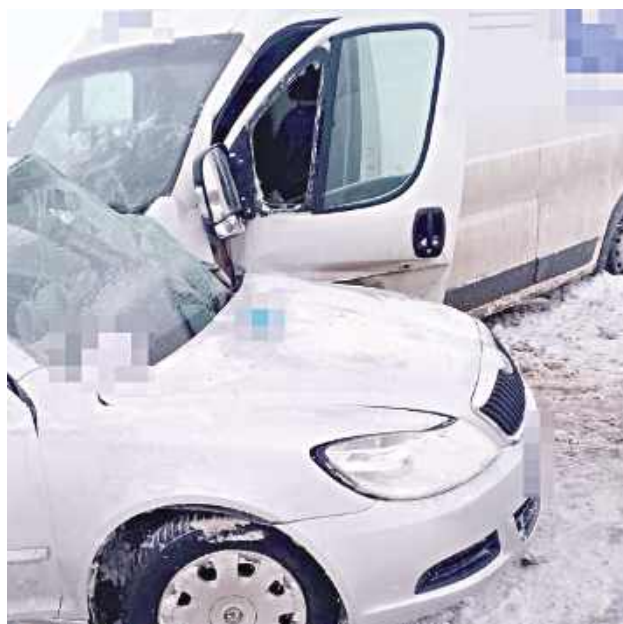
Pomimo natychmiast podjętej reanimacji życia 18-latek nie udało się uratować

Ze wstępnych ustaleń funkcjonariuszy pracujących na miejscu zdarzenia wynika, że młody kierowca Skody, mieszkaniec powiatu biłgorajskiego, na łuku drogi w obszarze niezabudowanym stracił panowanie nad pojazdem. Samochód wpadł w poślizg, a następnie doszło do czołowo-bocznego