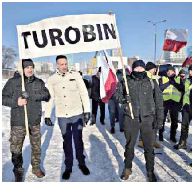
Do protestujących rolników z gminy Turobin dołączył poseł Janusz Kowalski

- Jako gmina Turobin pojechaliśmy busem, udało się zebrać trochę ludzi, którzy chcieli pojechać. Protesty trwają już chyba za dwa lata. Nic nie osiągnęliśmy do tej pory, rząd nas cały czas zbywa, wręcz można by powiedzieć, że wyśmiewa nasze