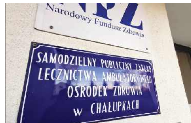
■ Ośrodek zdrowia w Chałupkach budzi niepokoje mieszkańców

Przypomnijmy, temat ośrodka zdrowia w Chałupkach szeroko opisywaliśmy w artykule „Czy ośrodek zdrowia w Chałupkach zostanie zlikwi-