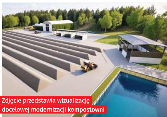
Zdjęcie przedstawia wizualizację docelowej modernizacji kompostowni

Obecna moc przerobowa kompostowni jest niewystarczająca, aby zapewnić przetwarzanie wszystkich bioodpadów zbieranych w ciągu roku na terenie Raciborza.