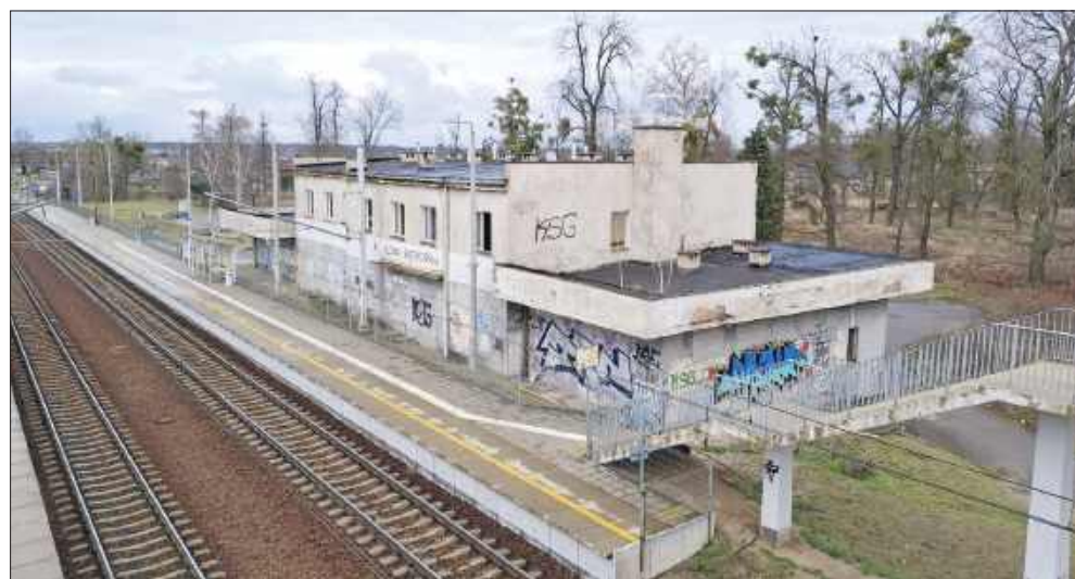
■ Na zdjęciu stacja kolejowa w Kuźni Raciborskiej

Jednocześnie burmistrz zapowiada spotkanie urzędników z Kuźni Raciborskiej z przedstawicielami PKP Polskie Linie