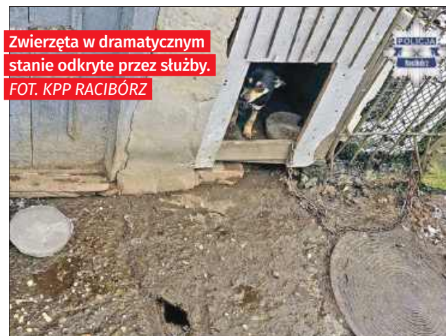
Zwierzęta w dramatycznym stanie odkryte przez służby.

– Na miejscu okazało się, że przebywające tam psy