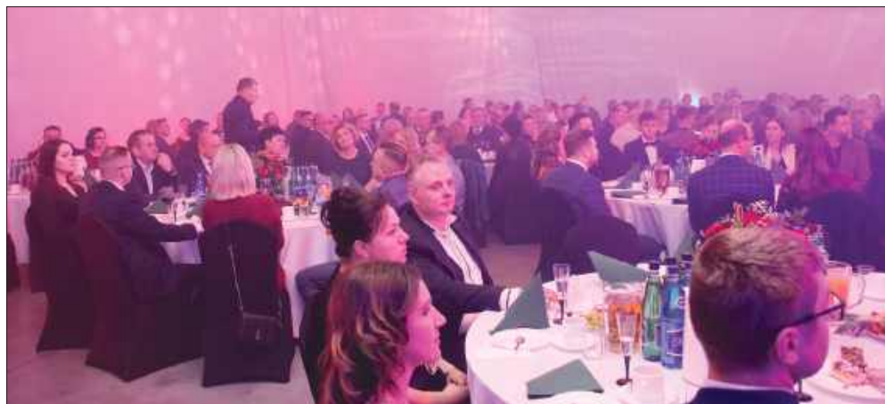
■ Hala w Pietrowicach Wielkich na czas wydarzenia przechodzi spektakularną metamorfozę