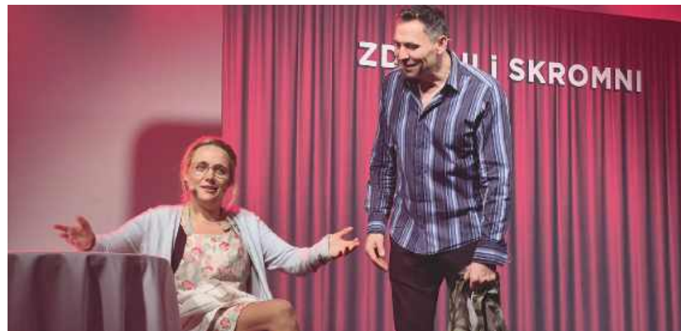
■ Podczas części artystycznej publiczność bawił kabaret Zdolni i Skromni