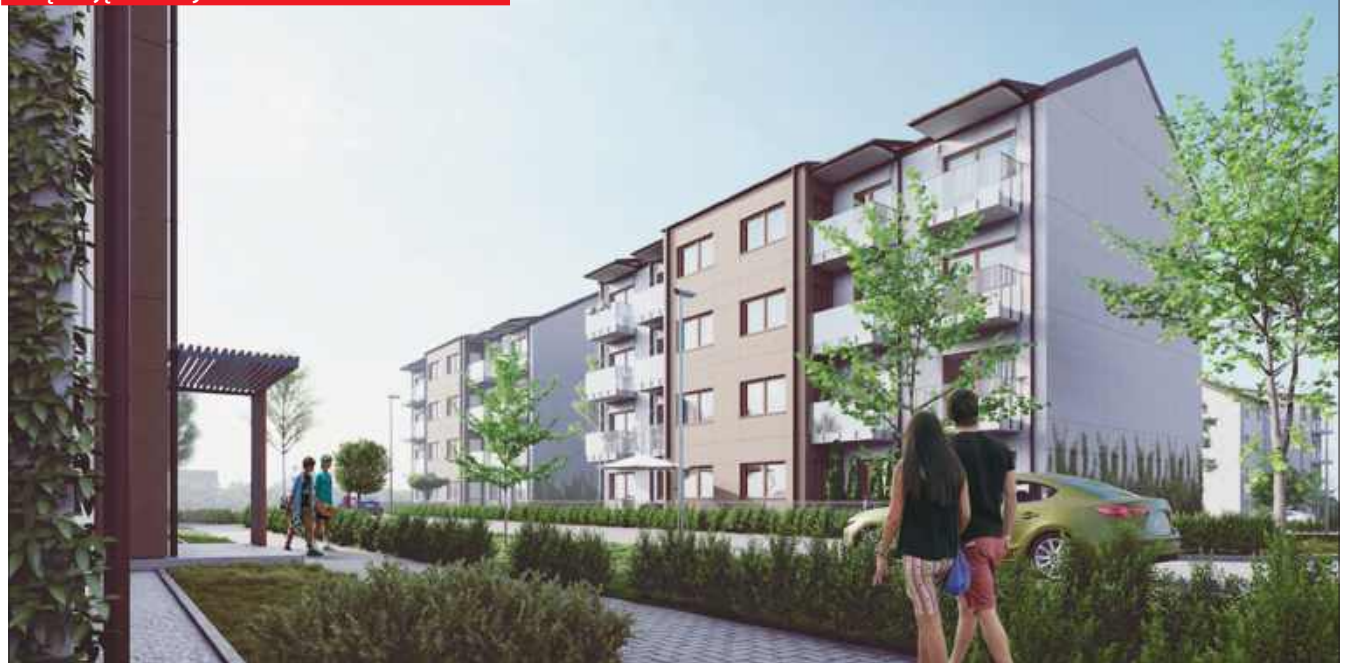
Kilka lat temu przedstawiono taką wizję budowy bloków w Kuźni Raciborskiej

procent (co w przypadku mieszkania o powierzchni 50 m 2 oznacza około 69 tys. zł, z możliwością rozłożenia tej kwoty na raty – przyp. red.), udało się również znacząco poprawić przyszłe stawki czynszowe, a także – co istotne – wprowadzono możliwość dojścia do własności lokalu po 20 latach najmu. Wcześniej taka opcja w ogóle nie była przewidziana. (mad)