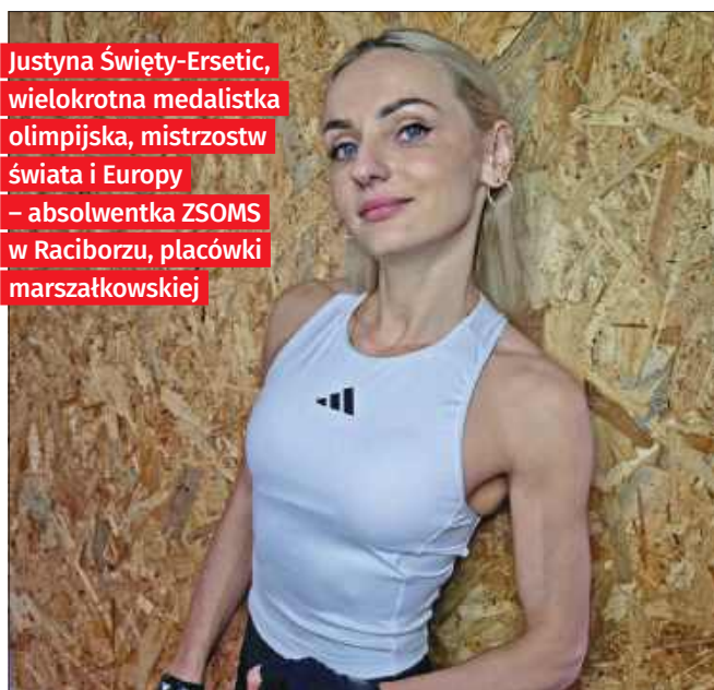
Justyna Święty-Ersetic, wielokrotna medalistka olimpijska, mistrzostw świata i Europy – absolwentka ZSOMS w Raciborzu, placówki marszałkowskiej

głównie z powiatów raciborskiego, wodzisławskiego, rybnickiego, nyskiego, kędzierzyńsko-kozielskiego