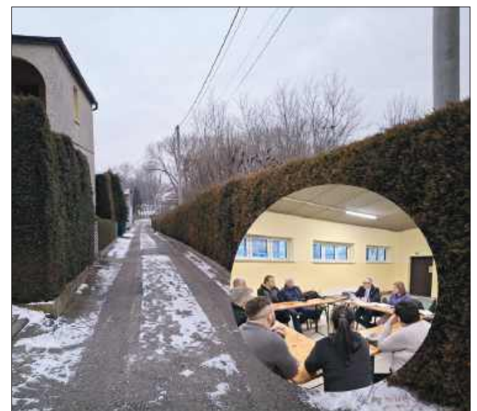
■ Ulica Lipowa w Makowie to niewielka, ślepa uliczka w centrum wsi, będąca dojazdem do kilku posesji.

Samorząd powołuje się przy tym na przepisy z dnia 21 marca 1985 r. o dro-