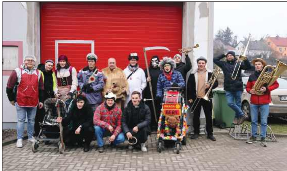
■ Przebierańcy karnawałowi, którzy wyruszyli spod remizy w Sławikowie

Na podstawie art.35 ust. 1 i 2 ustawy z dnia 21 sierpnia 1997 r. o gospodarce nieruchomościami (t.j. Dz. U. z 2024r. poz. 1145 z późn. zm.)