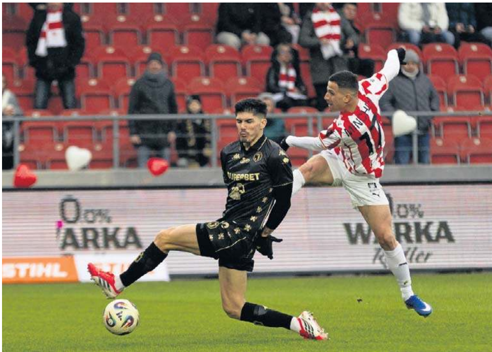
Jagiellonia sięgnęła po punkt w meczu z Cracovią

Szkoleniowiec Żółto-Czerwonych postawił na Samed Bazdara, który dobrze wypadł w swoim pierwszym meczu w barwach Jagiellonii z Motorem Lublin (4:1).