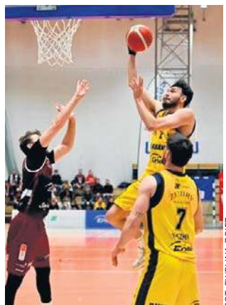
Koszykarze Żubrów ulegli Spójni 69:104

Siatkówka Jeden punkt drużyny KS Necko Augustów