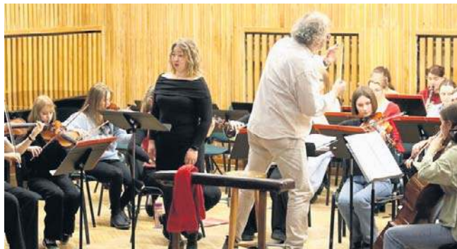
Koncert odbędzie się 20 lutego, o godz. 19

Koncert zaplanowano na 20 lutego 2026 r., o godz. 19 w sali koncertowej Zespołu Szkół Muzycznych przy ul. Podleśnej 2 w Białymstoku. Udział w koncercie jest bezpłatny, jednak obowiązują wejściówki. Rezerwacji można dokonywać telefonicznie (85 6784 296) od 16 lutego, a bilety odbierać w budynku administracji BCO przy ul. Warszawskiej 15, w godzinach pracy kancelarii. Liczba miejsc jest ograniczona.