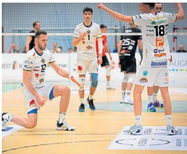
Siatkarze KS Necko Augustów znajdują się na trzynastym miejscu w tabeli I ligi

Więcej koncentracji w ostatniej partii zachowali siatkarze