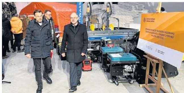
Sprzęt zakupiony z Programu Obrony Cywilnej i Ochrony Ludności został zaprezentowany w obecności m.in. wojewody podlaskiego

Zakupiony sprzęt, jak podkreślali obecni na konferencji, nie będzie tylko magazynowany, ale będzie już teraz służył mieszkańcom w razie potrzeby.