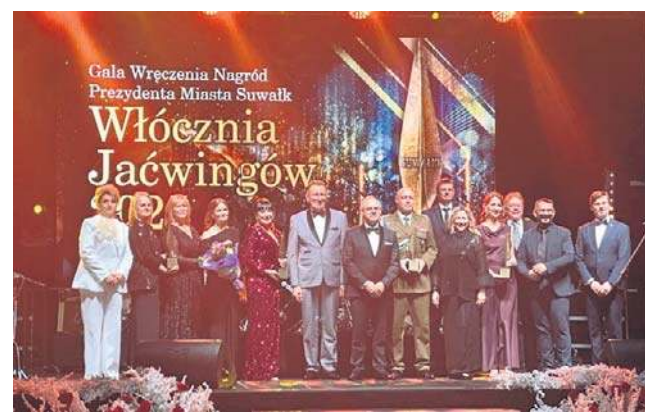
Tegoroczni laureaci zgodnie przyznali, że to wyjątkowa nagroda, która dodaje motywacji do dalszego działania

Nagroda Prezydenta Suwałk Włócznie Jaćwingów to jedno z najważniejszych wyróżnień w mieście. Włócznie przyznawane są osobom, firmom, instytucjom czy stowarzyszeniom za wybitne zasługi dla miasta we wszystkich dziedzinach życia publicznego. Podczas uroczystej gali w sobotę poznaliśmy kolej-