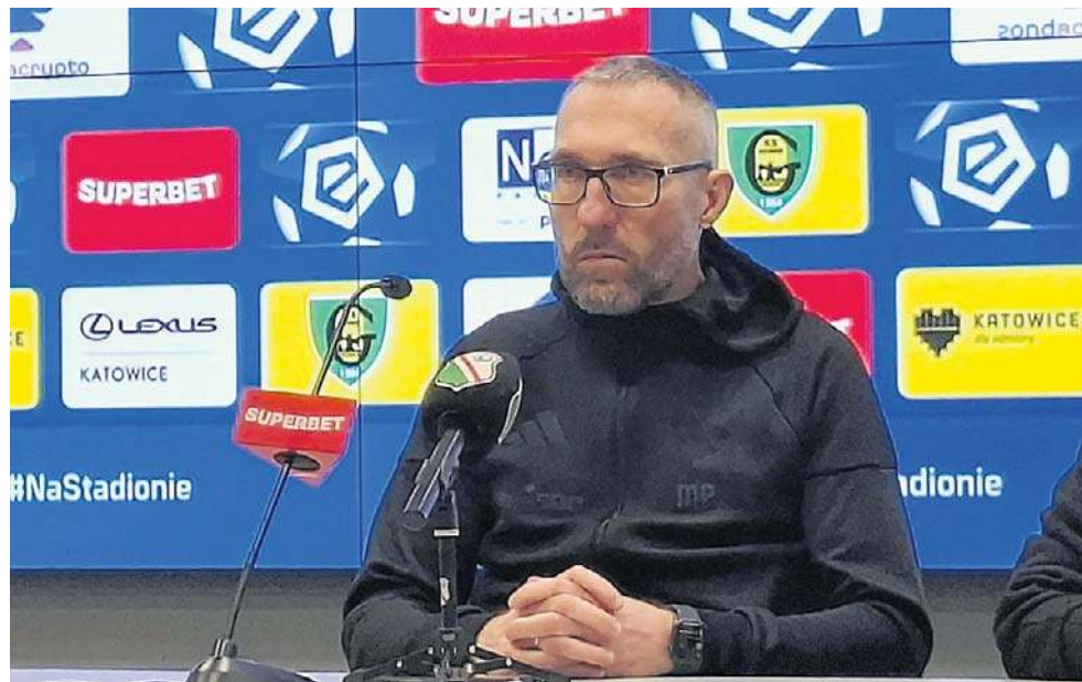
Do 12 meczów z rzędu wzrosła ligowa niemoc Legii. To jej najgorsza seria w historii...