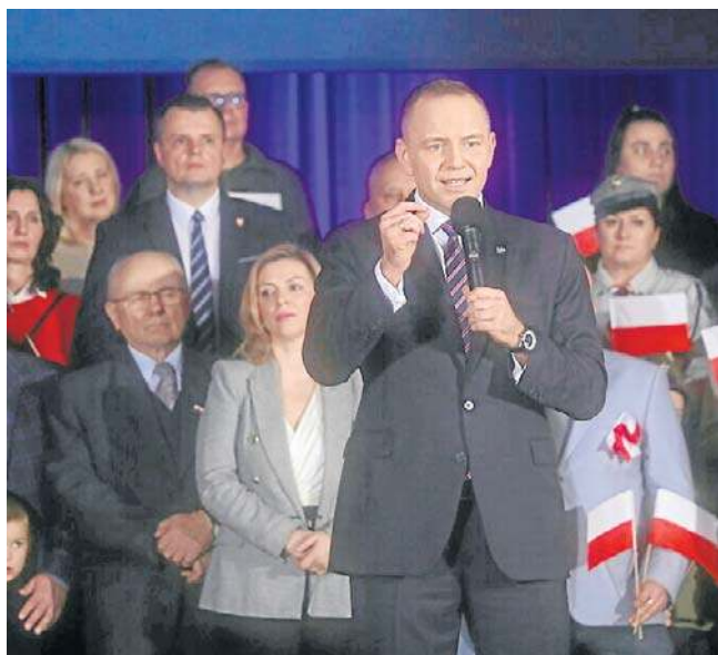
W domu kultury w Hajnówce Karol Nawrocki spotkał się z mieszkańcami, samorządowcami, parlamentarzystami

Prezydent mówił, że przyjechał do Hajnówki także po to, by powiedzieć, że polscy żołnierze, strażnicy graniczni i mieszkańcy Hajnówki „wciąż czekają na przeprosiny za to, co działo się kilka lat temu, gdy polska granica była atakowana wojną hybrydową z Białorusi”, bo - jak mówił - na całej wschodniej granicy dyskusja o bezpieczeństwie „nie jest abstrakcją”. - Tu granicę widać, tu granicę czuć, tu granicę się broni, tu obrońcy granicy mają swoją twarz, swoje rodziny i ponoszą każdego dnia wielką odpo-