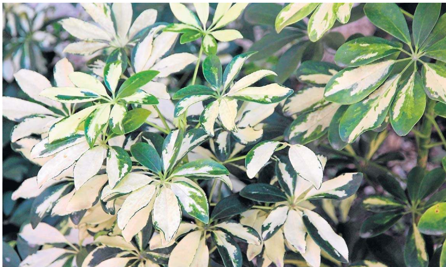
Duże, dłoniaste liście, przypominające pokrojem oryginalne parasolki, są największą ozdobą szeffler

Szefflera parasolowata i drzewkowata to rośliny dość wytrzymałe na różne warunki