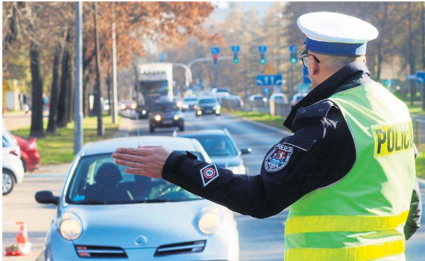
Dopuszczalne prędkości na drogach w Polsce to: 50 km/h w terenie zabudowanym, 90 km/h na drogach jednojezdniowych, 100-120 km/h na drogach ekspresowych, 140 km/h na autostradach. Zawsze należy jednak zwracać uwagę na znaki drogowe

W przypadku kierujących posiadających prawo jazdy krócej niż rok i limit 20 punktów karnych, konsekwencje wyciągane są, kiedy zdobywa minimum 21 punktów, czyli przekracza limit. W ich przypadku starosta wydaje decyzję o cofnięciu uprawnień. Oznacza to ponowne przejście całej procedury ubiegania się o prawa jazdy. Najpierw konieczny jest kurs, a później zdanie egzaminu teoretycznego i praktycznego.