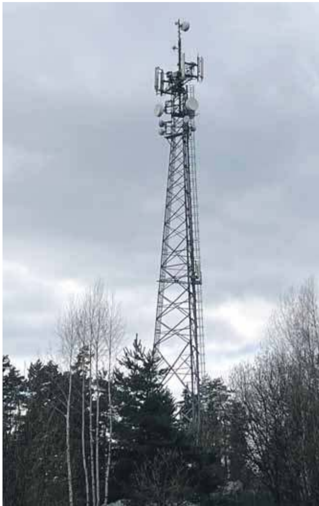
Jeśli tak dalej pójdzie, to Rabka będzie znana tylko z anten. To będzie nasza jedyna atrakcja...

Burmistrz powtarza jak mantrę, że magistrat w kwestii przeciwdziałania budowie kolejnych gigantycznych anten ma związane ręce. Przypomina nowelizację prawa telekomunikacyjnego, które miało wzmocnić