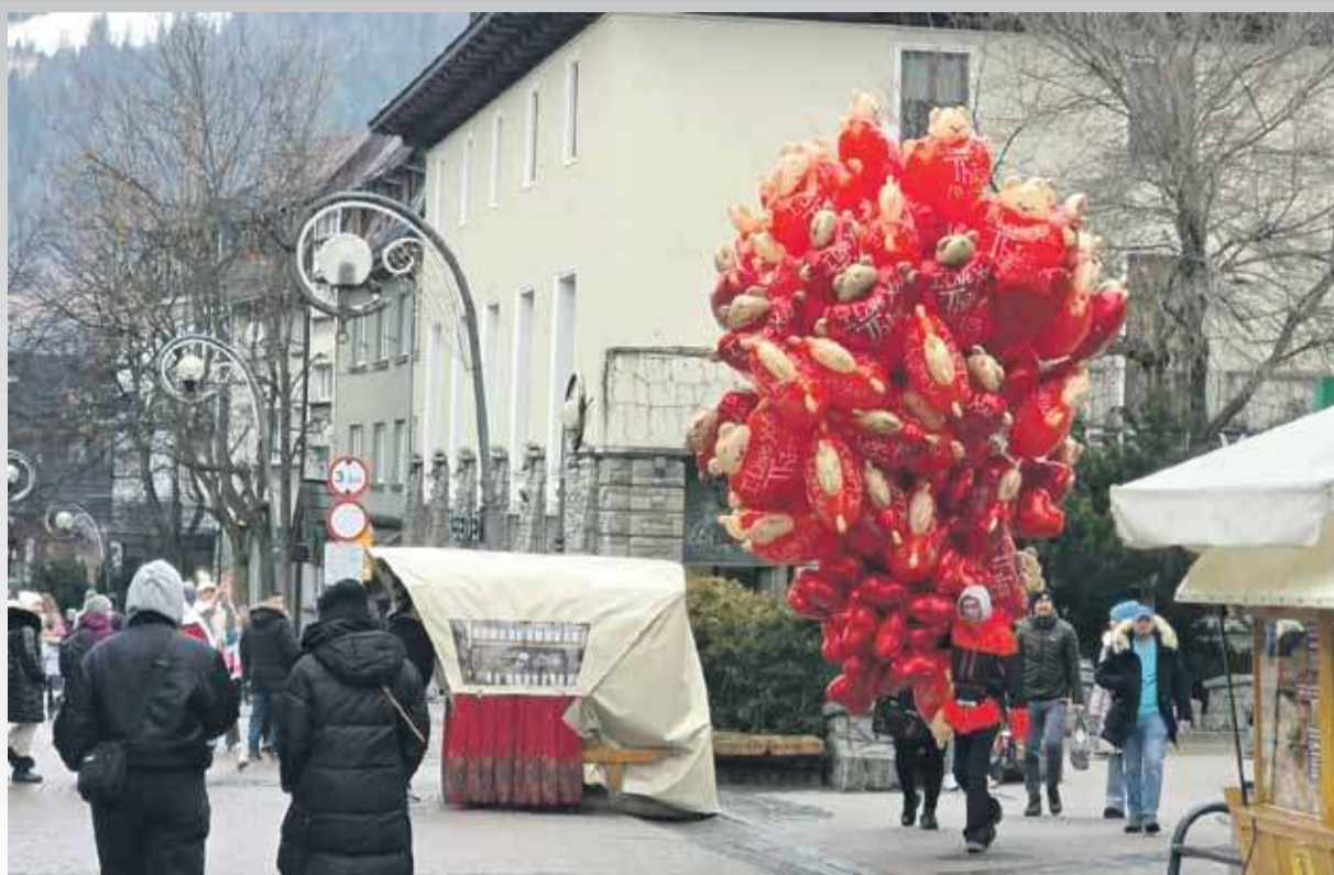
Udało nam się przetrwać te trzy dni. Najpierw tłusty czwartek, później piątek trzynastego, a na końcu sobotnie Walentynki.