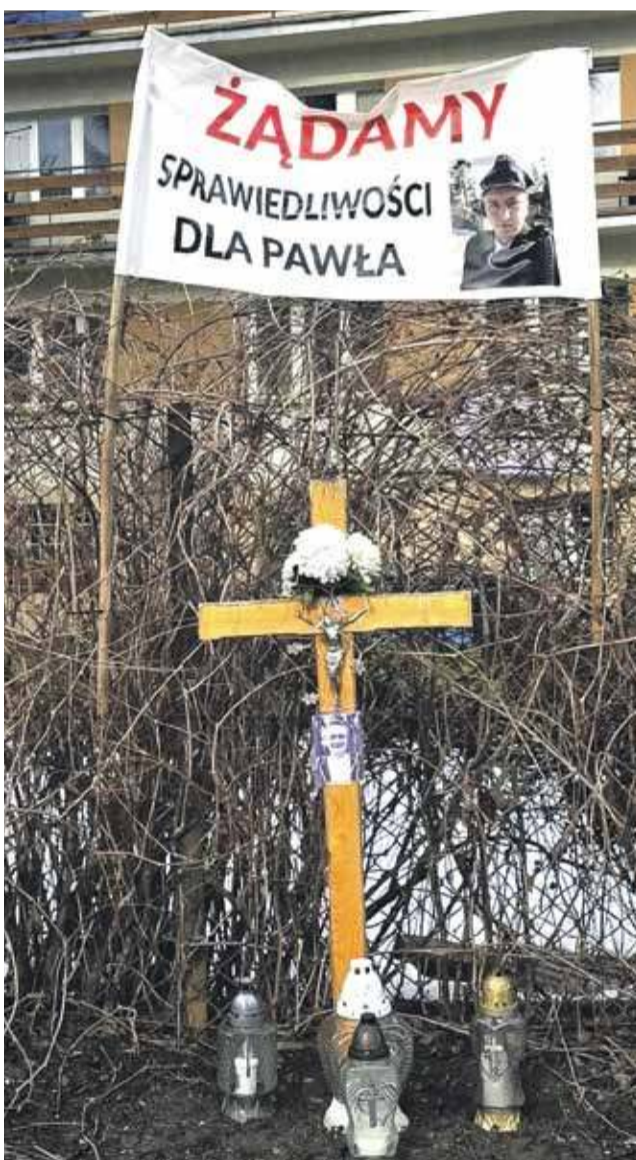
Biały Dunajec. Miejsce, gdzie młody strażak stracił życie.