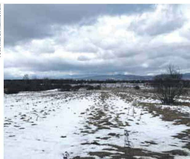
Jeśli powstanie, to będzie to zapewne jedna z najbardziej malowniczo położonych biogazowni w kraju.