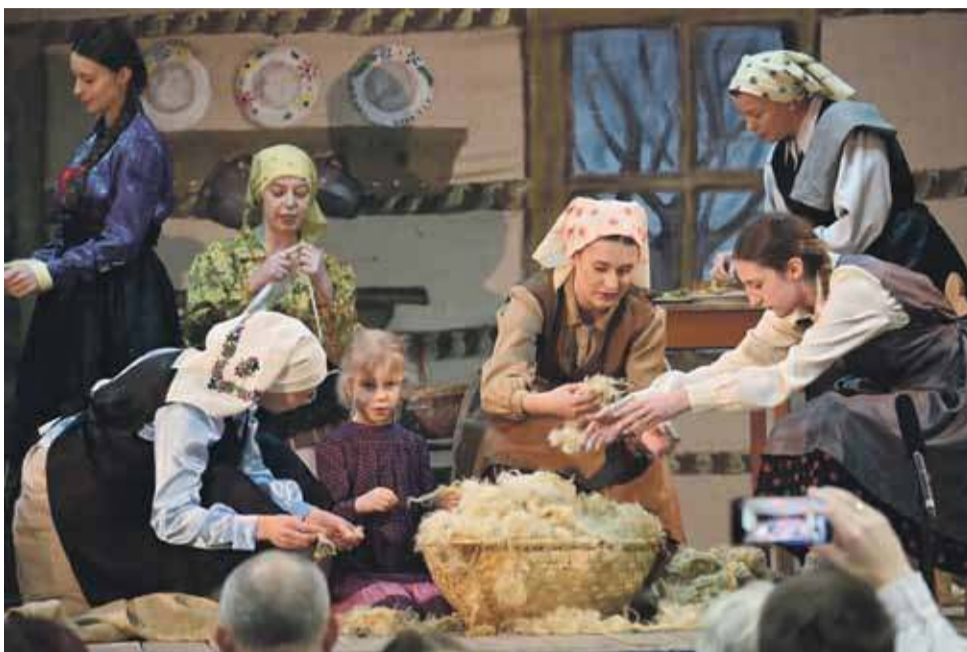
Przedstawienie pt. „Cuchranie wełny” pokazały „Niedzickie Zazraki” z Niedzicy.