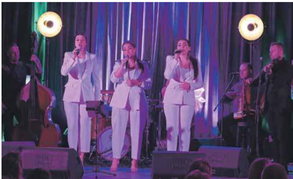
Zespół Jedla zawładnął w walentynkowy wieczór czarnodunajeczną sceną.