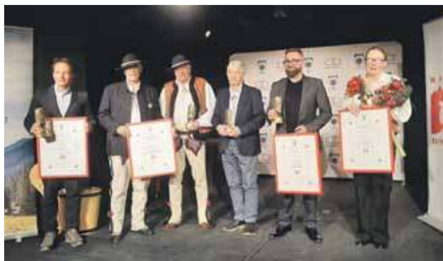
Laureaci Marki Tatrzańskiej 2025