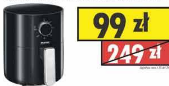
Frytkownica beztłuszczowa Air Fryer MPM MFR-12

Timer w zakresie: 1-60 min. | Kosz o pojemności 2 l Moc 800 W | Termostat do 200°C | 2 lata gwarancji