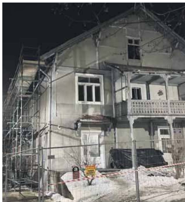
Zabytkowa willa „Krzywoń”.