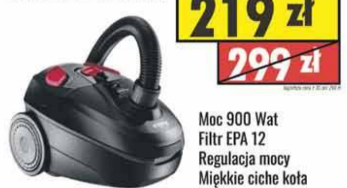
Odkurzacz Amica VM1043

NOWY SKLEP W CZARNYM DUNAJCU ul. Kolejowa