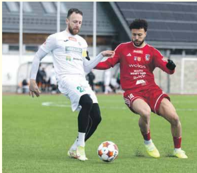
Podhale w ostatnim sparingu pokonało drużynę z Bielska.