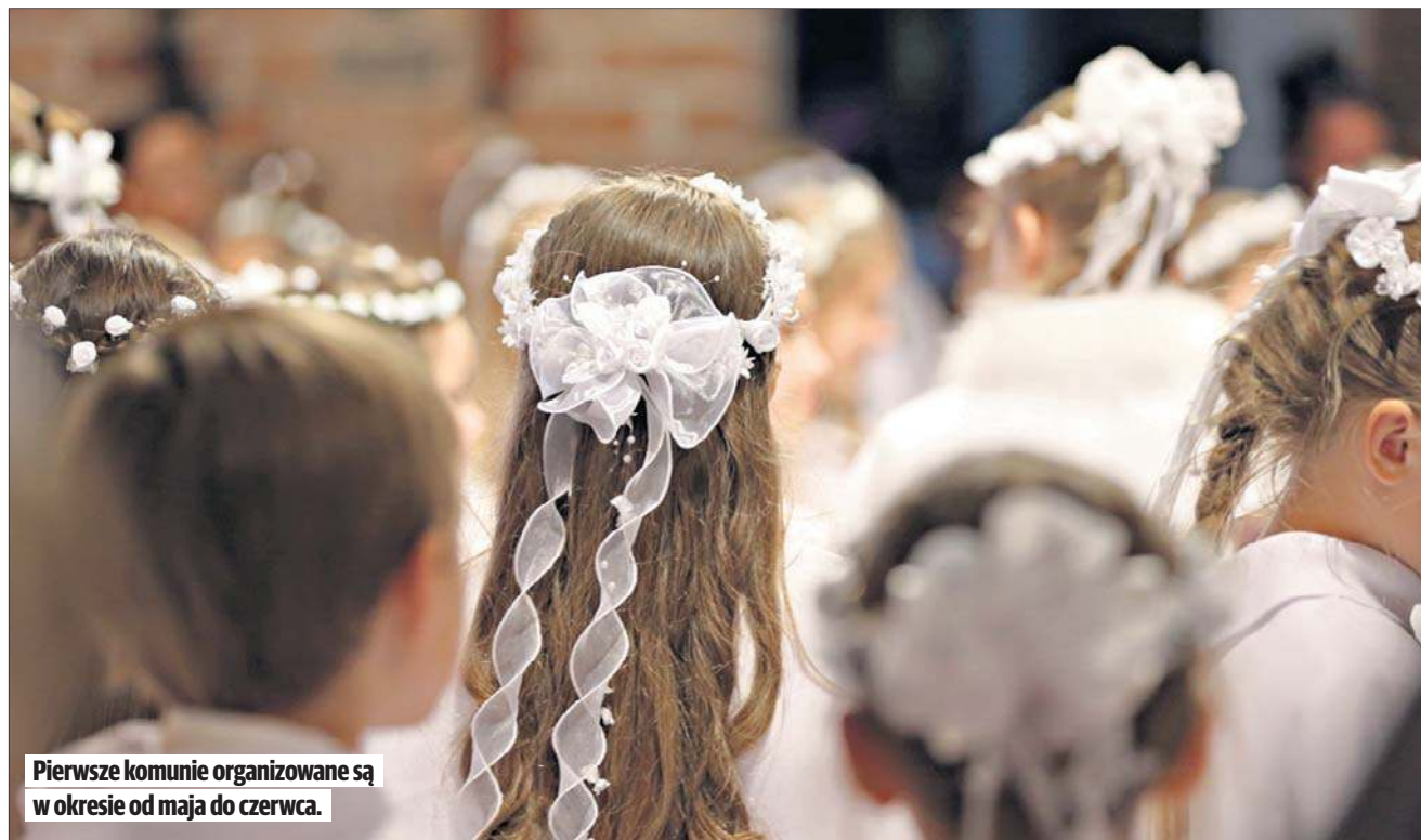
Pierwsze komunie organizowane są w okresie od maja do czerwca.

Pierwsza Komunia Święta to w Kościele katolickim uroczyste, pierwsze w życiu przyjęcie Eucharystii, czyli konsekrowanego chleba i wina. To moment, w którym dziecko w pełni uczestniczy we Mszy Świętej.