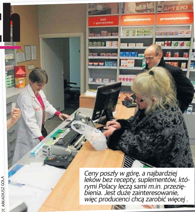
Ceny poszły w górę, a najbardziej leków bez recepty, suplementów, którymi Polacy leczą sami m.in. przeziębienia. Jest duże zainteresowanie, więc producenci chcą zarobić więcej.