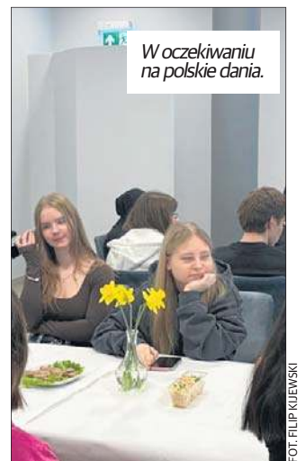
W oczekiwaniu na polskie dania.

Uczestnicy, którzy odpowiedzieli poprawnie, otrzymali gadżety uczelni i inne upominki. Chętni mogli też pomalować pisanki - studenci samodzielnie ozdabiali jajka i poznawali jedną z najbardziej rozpoznawalnych polskich tradycji.