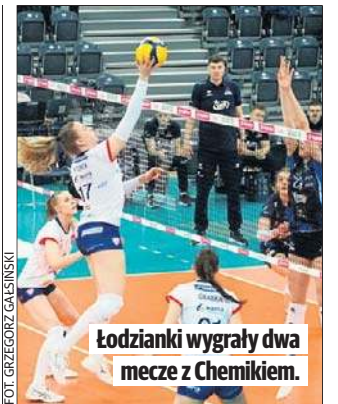
Łodzianki wygrały dwa mecze z Chemikiem.

W półfinałach, poza Budowlanymi są już KS DevelopRes