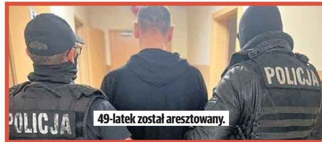
49-latek został aresztowany.

- O godz. 11 policjanci pojawili się na ul. Nałkowskiej, gdzie według relacji świadka na klatce schodowej miała leżeć kobieta w kałuży krwi. Po dotarciu na miejsce mundurowi zastali 49-letniego mężczyznę, który reanimował 34-latkę. - informuje asp. Kamila Sowińska z Komendy Miejskiej Policji w Łodzi. - Funkcjonariusze przejęli od niego czynności do momentu przyjazdu medyków. Przybyli na miejsce lekarz stwierdził zgon 34-latkę. W rozmowie z funkcjonariuszami mężczyźni przyznali, że się znają i dzień wcześniej spo-