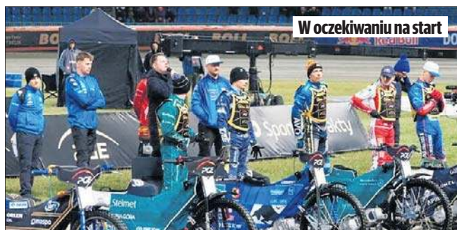
W oczekiwaniu na start