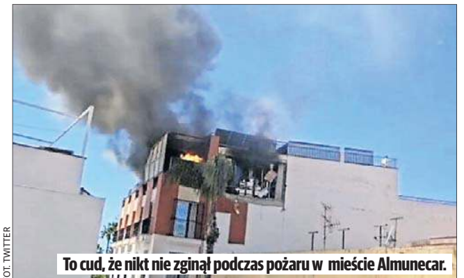
To cud, że nikt nie zginął podczas pożaru w mieście Almunecar.

Dzieło „Lentetuin, de pastoriu in te Nuenen in het voorjaar” („Wiosenny ogród, ogród plebanii w Nuenen wiosną”) zostało skradzione 30 marca 2020 roku z muzeum Singer Laren, które prezentowało je czasowo po wypożyczeniu z Groninger Museum. Do kradzieży doszło w dniu urodzin Vincenta van Gogha.