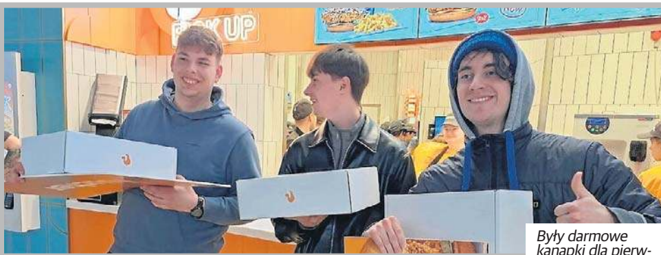
Były darmowe kanapki dla pierwszych stu osób.

czącej już kilkadziesiąt osób kolejki. Czekali zawinięci w koce i zmarznięci. - Graliśmy w planszówki i pokera, trochę spaliśmy. Było naprawdę bardzo zimno, błogosławieństwem było to, że galeria wpuściła nas na chwilę, żebyśmy mogli się ogrzać - mówi „kolejkowicz”.