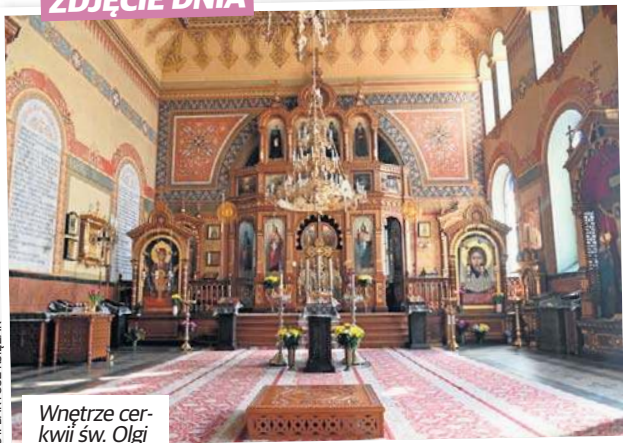
Wnętrze cerkwi św. Olgi w Łodzi.