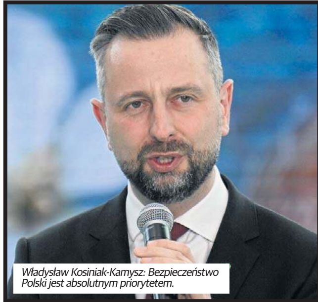
Władysław Kosiniak-Kamysz: Bezpieczeństwo Polski jest absolutnym priorytetem.

Wszystko w związku z odwetowymi uderzeniami Iranu, który odpowiada ostrzałem na amerykańsko-izraelskie natoty. W Polsce znajdują się dwie baterie systemu Patriot, razem liczące 16 wyrzutni. Zostały dostarczone do Polski trafiły do 3. Brygady Rakietowej Obrony Powietrznej w Sochaczewie (woj. mazowieckie) i w grudniu 2025 r. ogłoszono ich pełną gotowość operacyjną. W latach 2027-2029 do Polski trafić ma kolejnych 48 wyrzutni Patriot, czyli następne 6 baterii. Poza jednostką w Sochaczewie mają one wejść na wyposażenie dywizjonów obrony powietrznej w Bytomiu, Gdyni oraz Skwierzynie w woj. lubuskim