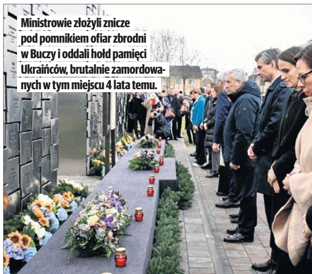
Ministrowie złożyli znicze pod pomnikiem ofiar zbrodni w Buczy i oddali hołd pamięci Ukraińców, brutalnie zamordowanych w tym miejscu 4 lata temu.

Kallas podkreśliła, że Europa nie pozwoli, by Ukraina zniknęła z pola zainteresowania społeczności międzynarodowej w obliczu wojny na Bliskim Wschodzie. Zaznaczyła, że osiągnięcie sprawiedliwego i trwałego pokoju nie jest możliwe bez