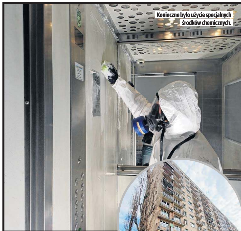
Konieczne było użycie specjalnych środków chemicznych.

- Czyszczenie, dezynfekcja oraz ozonowanie mają na celu usunięcie nieprzyjemnych zapachów. Naszym zadaniem jest przygotowanie windy do stanu użytkowania. Technicznie jest sprawna, był już dozór techniczny. Pozostaje