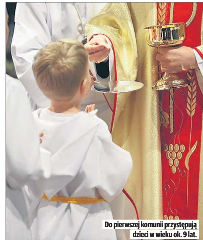
Do pierwszej komunii przystępują dzieci w wieku ok. 9 lat.