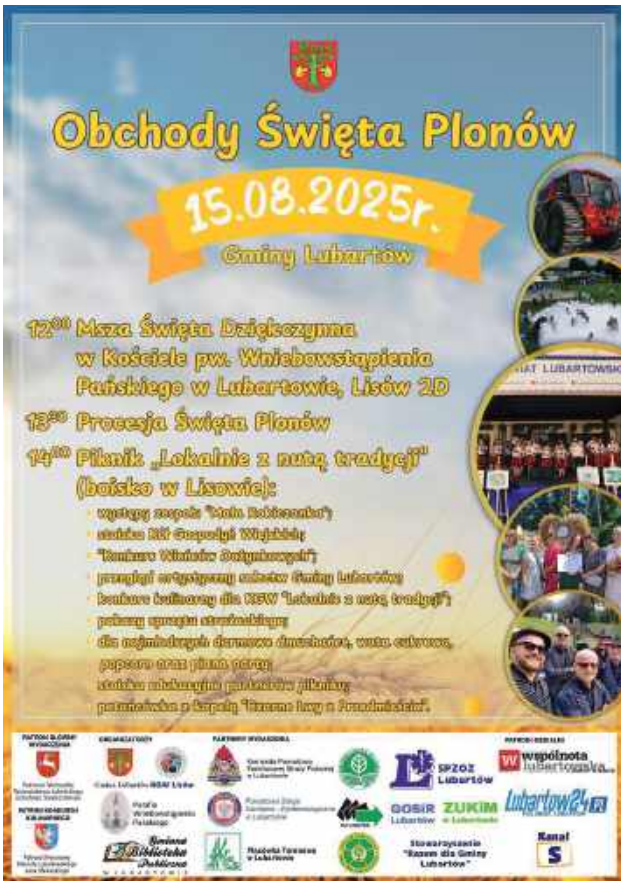
Dożynki gmina Lubartów