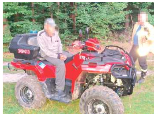
Mężczyzna został znaleziony w lesie, kilka kilometrów od domu

- Z przekazanej informacji wynikało, że tego dnia mężczyzna wyszedł na grzyby do lasu. Jednak przez wiele godzin nie powrócił do miejsca zamieszkania. Kiedy bliskim