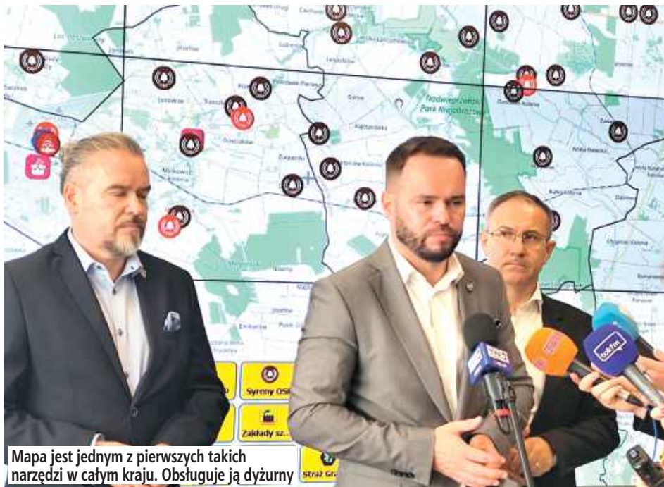
Mapa jest jednym z pierwszych takich narzędzi w całym kraju. Obsługuje ją dyżurny

Są na nią naniesione wszystkie zasoby, które są najbardziej istot-