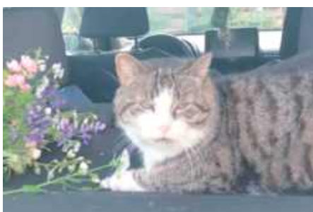
Borysek, Irena Konopka, Biała Podlaska