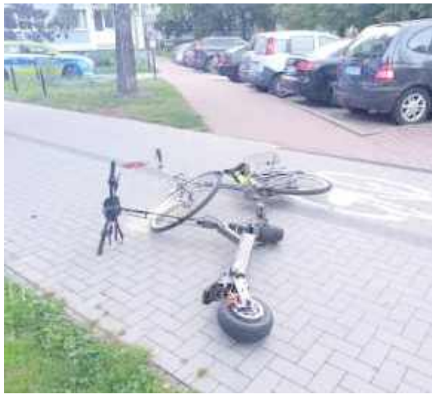
Rowerzystka i kierujący hulajnogą jechali w przeciwnych kierunkach i podczas wymijania zderzyli się czołowo

- Skierowani na miejsce policjanci ustalili, że podczas wykonywania manewru wymijania oboje uczestnicy nie zachowali