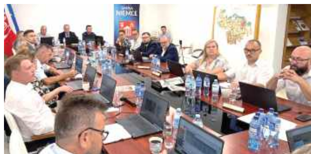
Najnowszy pomysł, który przegłosowano podczas ostatniej sesji, to zobowiązanie Komisji Rewizyjnej do ponownego przeanalizowania sprawy i przygotowanie opinii. Resztą ponownie mają zająć się radni