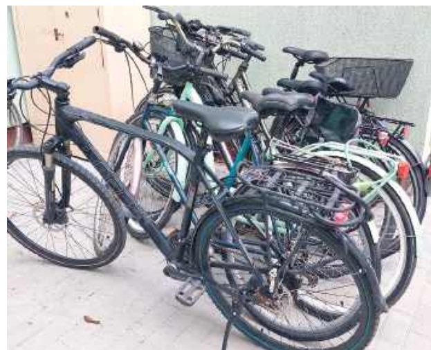
Mężczyzna usłyszał łącznie 7 zarzutów dotyczących kradzieży, gdzie wartość jednośladów została oceniona na kwotę niemal 10 tys. zł

Biała Podlaska: Za kradzież rowerów odpowie 49-latek. Zauważył go przebywający na urlopie policjant. Funkcjonariusze zabezpieczyli do sprawy 11 jednośladów jak też zdemontowane elementy rowerów. Zarzuty usłyszał też 24-letni paser.