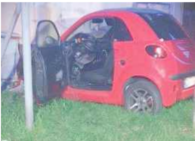
33-latek z Puław nie miał prawa jazdy, uciekał przed policją, a w samochodzie miał amfetaminę

33-latek zignorował znaki do zatrzymania, dawane mu przez zwoleńskich policjantów. Został zatrzymany po pościgu, gdy stracił panowanie nad autem i uderzył w budynek. W środku miał narkotyki.