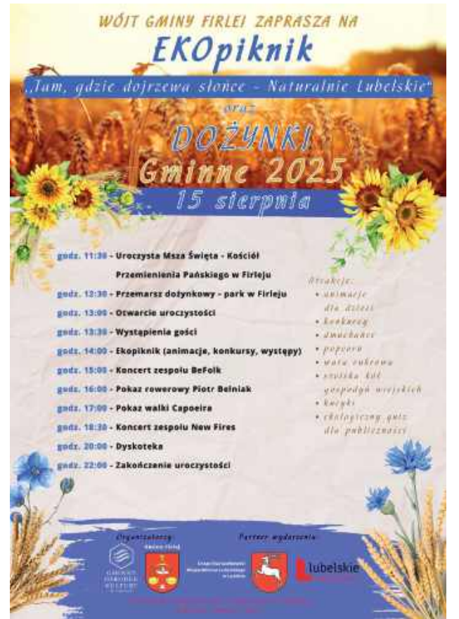
Dożynki w Firleju

Sezon dożynkowy już się rozpoczął. Za nami święta plonów w Ostrówku. Jakie gwiazdy zobaczymy w naszych gminach?