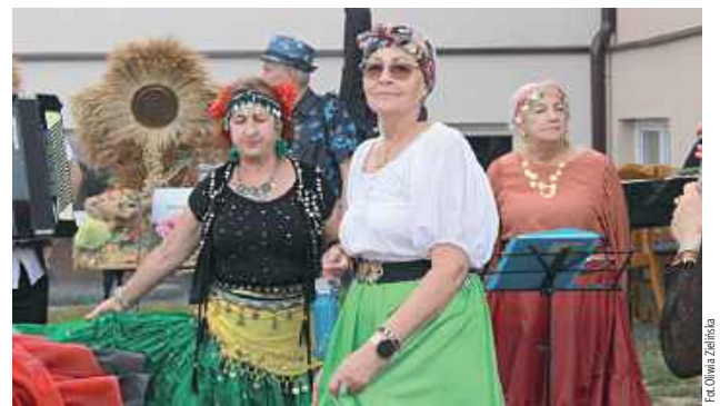
Nie zabrakło zabawy pod sceną