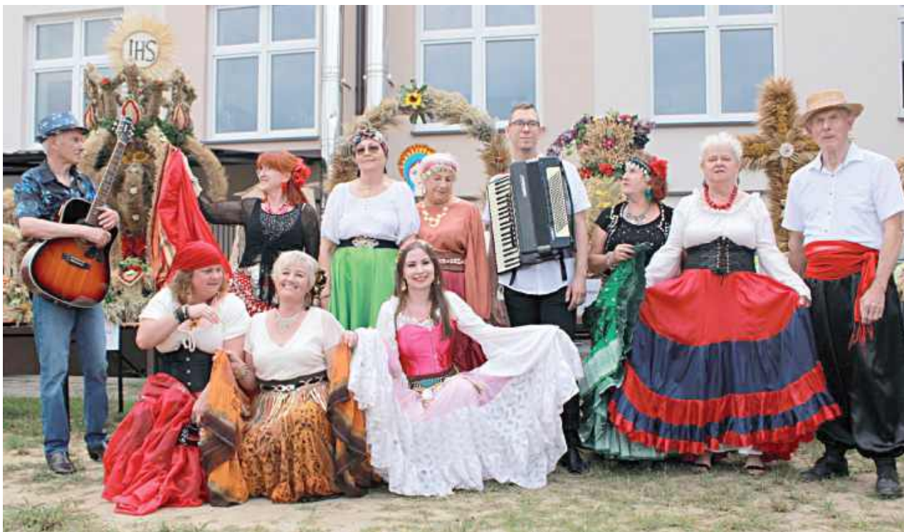
Humor dopisywał uczestnikom uroczystości

Leszkowice: W niedzielę (10 sierpnia) w Leszkowicach odbyło się barwne i radosne święto plonów – dożynki gminy Ostrówek. Wydarzenie zainicjowała msza święta o godz. 12 na placu przy szkole podstawowej.