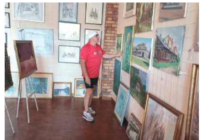
W Węgrowie Janusz Kobyłka zwiędził wystawę obrazów malarza Jerzego Stachury