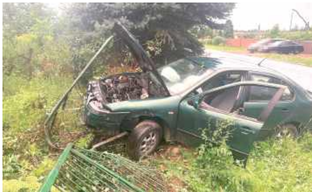
Kierowca Seata, który wjechał w płot, zdębiał, gdy okazało się, że osoba, którą poprosił o pomoc w ukryciu rozbitego auta, okazała się policjantem puławskiej komendy

Wszystko działo się w miniony piątek, 1 sierpnia w Leokadiowie. Tuż po godz. 19 mieszkańcy miejscowości usłyszeli potężny huk. Z kilku najbliższych posesji wybiegli na drogę, aby zobaczyć, co się stało. Ich oczom ukazał się osobowy Seat, który wylądował w rowie i uszkodził ogrodzenie. Wśród osób, które zareagowały na hałas, był funkcjonariusz z Wydziału do Walki z Przestęp-