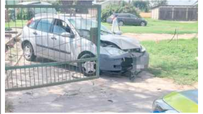
Kierowca Forda wydmuchał 3 promile

Usłyszał huk, a po chwili zobaczył Forda na bramie