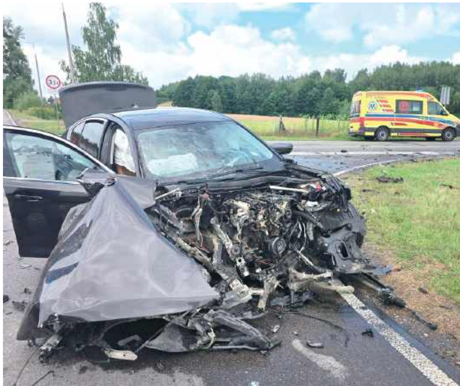
Kobieta podróżowała z 8-letnim dzieckiem. Oboje trafili do szpitala

Kobieta podróżowała z 8-letnim dzieckiem. Oboje trafili do szpitala. I chociaż całe zdarzenie wyglądało groźnie, to dla jego uczestników zakończyło się je-