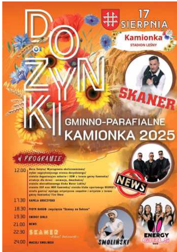
Dożynki w Kamionce