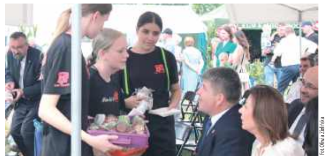
Trwała również akcja charytatywna