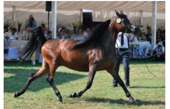
Dużym zainteresowaniem kupujących cieszyła się również Wencedora

Aukcja Summer Sale, która odbyła się w poniedziałek, oferowała 28 koni - głównie młode klacze i ogiery - po bardziej przystępnych cenach, przyciągając zarówno krajowych, jak i zagranicznych kupców.