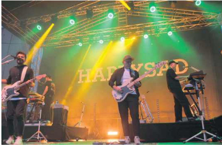
Na scenie wystąpiła m.in. Happysad - gwiazda wieczoru w drugim dniu imprezy

1. Koszt wynajmu sceny, wraz z informacją o firmie lub podmiocie, który realizował usługę; 2. Koszt technicznej obsługi sceny - w tym nagłośnienie, oświetlenie, multimedia, montaż/demontaż; 3. Inne koszty powiązane bezpośrednio z użytkowaniem sceny, o ile zostały ujęte w odrębnych fakturach lub umowach. Jednocześnie prosimy o zapewnienie, aby dane za oba lata dotyczyły tożsamego zakresu świadczeń,