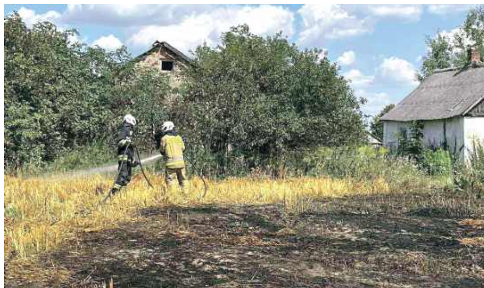
9 sierpnia około godz. 11.30 w Sedliskach paliły się bele słomy w maszynie. Pożar gasiły zastępy OSP Kamionka i JRG Lubartów