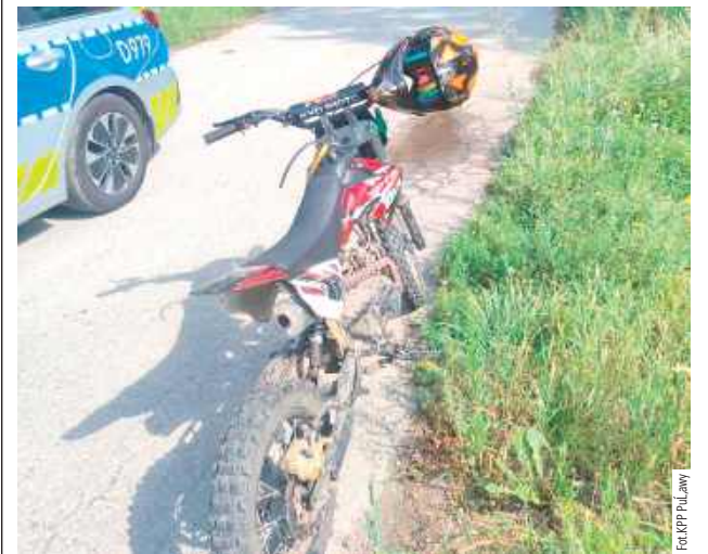
Młody kierowca niejedno miał na sumieniu. Nie dość, że jechał pojazdem niedopuszczonym do ruchu, to w dodatku był pod wpływem alkoholu

Motocykl bez tablic rejestracyjnych zatrzymali policjanci z puławskiej drogówki w Górach w gminie Markuszów. Kierowca nie tylko to miał na sumieniu.