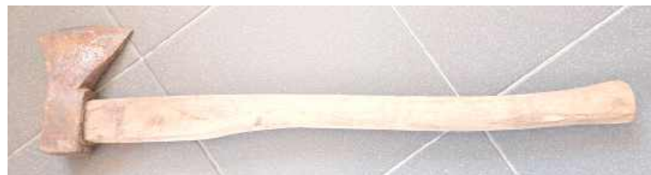
Takim przedmiotem wymachiwał mężczyzna biesiadnikom

- Jak wynika z ustaleń w sprawie, na jednej z posesji grupa znajomych zorganizowała wieczór kawalerski. Nocą przyszedł do nich okoliczny mieszkaniec. Mężczyzna skarżył się na hałas, jednak zdecydował się dołączyć do biesiadników. Po pewnym