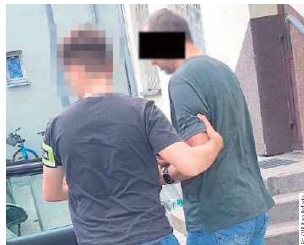
W chwili zatrzymania 49-latek miał ukryte pod ubraniem nożyce do przecinania linek zabezpieczających rowery przed kradzieżą

- Z relacji pokrzywdzonych, którzy zgłosili się do bialskiej komendy wynikało, że łupem amatorów cudzego mienia padały zarówno zabezpieczone, jak też niezabezpieczone jednoślady. Sprawą zajęli się funkcjonariusze zwalczający przestępczość przeciwko mieniu bialskiej komendy. Żmudna praca policjantów przyniosła efekty. Przed weekendem jeden z funkcjonariuszy tego wydziału, będąc na urlopie, rozpoznał mężczyznę podejrzewanego o kradzież rowerów. Znajdował się na jednym z bialskich osiedli. Wchodząc do klatek schodowych kontrolował ich zawartość... Funkcjonariusz natychmiast zareagował. Po-