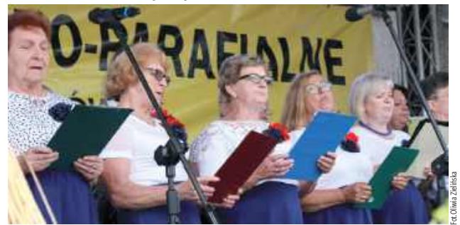
Na scenie wystąpiły zespoły ludowe