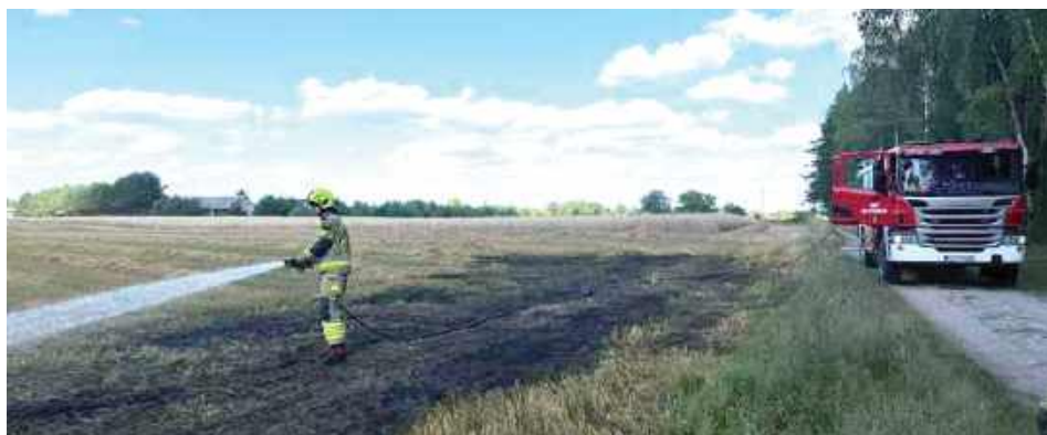
9 sierpnia około godz. 15.30 paliła się słoma i ściernisko w Lusławie. Pożar gasiły zastępy OSP Ostrówek, OSP Kamienowola i JRG Lubartów

W miniony weekend strażacy z powiatu lubartowskiego musieli gasić pożary związane z pracami w czasie żniw.