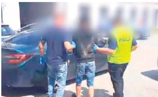
24-latek został zatrzymany i doprowadzony do aresztu policyjnego. W momencie zatrzymania był trzeźwy

Został powiadomiony o tym, że młody mężczyzna strzela do ludzi z broni gazowej. Na miejsce zdarzenia niezwłocznie zostały skierowane służby ratunkowe oraz opol-