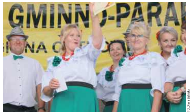
Nie brakowało radości po wynikach konkursu wieńców