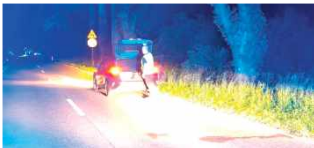
Do wypadku doszło w Bochothnicy (gmina Kazimierz Dolny) na drodze wojewódzkiej 824 prowadzącej z Opola Lubelskiego do Puław

Z poważnymi obrażeniami ciała do szpitala trafił 40-letni mieszkaniec Puław potrącony przez osobówkę w Bochothnicy (gmina Kazimierz Dolny). 74-latek jadący BMW uderzył w niego, wyprzedzając inne samochody.