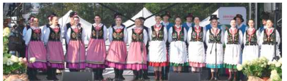
Dodatkowymi atrakcjami były finał lubelskiej edycji Konkursu Bitwa Regionów oraz prezentacje Kół Gospodyń Wiejskich

Na tegorocznych aukcjach obecni byli kupcy z Arabii Saudyjskiej, Zjednoczonych Emiratów Arabskich, Stanów Zjednoczonych, Australii, Szwecji, Szwajcarii, Belgii i Holandii. Wielu z nich powróciło do Janowa po kilku latach przerwy.