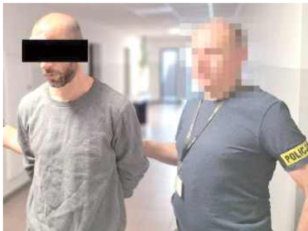
39-latkowi grozi do 20 lat więzienia