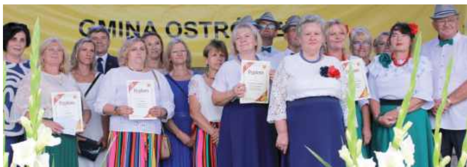
Przygotowano łącznie 8 wieńców

Po nabożeństwie miało miejsce oficjalne powitanie uczestników, dzielenie chleba oraz konkurs wieńców dożynkowych, będący wyrazem szacunku dla pracy rolników i zachowania lokalnych tradycji. Wieniec wykonany przez Koło Gospodyń Wiejskich z Kamienowoli został ogłoszony najpiękniejszym. Drugie miejsce w konkursie zajęli wie-