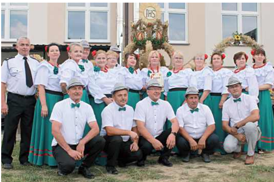
Wieniec z Kamienowoli zwyciężył