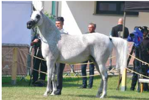
Najwyższą cenę uzyskała janowska klacz Adelita, uznana za gwiazdę tegorocznej aukcji

Kulminacyjnym punktem była niedzielna aukcja Pride of Poland, podczas której licytowano 15 klaczy, w tym 14 z państwowych stadnin i jedną z hodowli prywatnej. Sprzedano 13 koni za łączną kwotę 1,331 mln euro, co jest jednym z lepszych wyników