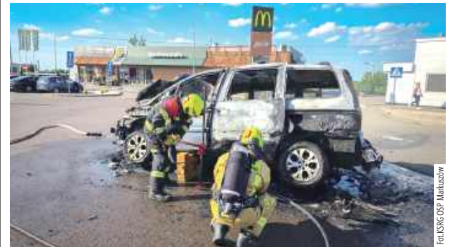
Samochód spłonął całkowicie. Na szczęście pasażerom i kierowcy nic się nie stało, bo w porę opuścili pojazd

Na parkingu przy drodze ekspresowej S12 doszczętnie spłonął osobowy Citroen. Wracala nim z wakacji rodzina z Łodzi.