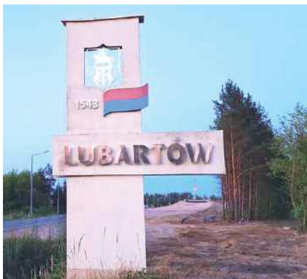
Lubartowskie witacze mają być przeniesione

Konieczność przeniesienia witaczy jest związana z budową drogi S 19. Ich obecna lokalizacja koliduje z przebiegiem budowanej drogi. Po przeniesieniu mają być ustawione przy drogach wjazdowych: ul. Lipowej i ul. Gen. Kleeberga w Lubartowie. Miasto zaprasza do składania ofert na opracowanie kompleksowej dokumentacji dotyczącej ich demontażu i ponownego i ustawienia. W grę wchodzi także odnowienie wit-