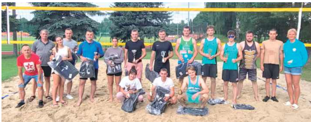
Pamiątkowe zdjęcie uczestników zmagania

W pierwszą sobotę sierpnia kompleks sportowy MOSiR przy al. Jana Pawła II w Parczewie stał się areną zmagania najlepszych plażowych duetów z regionu.