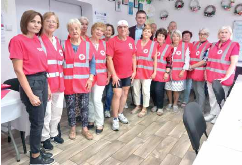
Pierwszym przystankiem na trasie był Łuków. W Klubie Seniora PCK spotkał się z jego członkami, którzy wysłuchali relacji z wcześniejszych wypraw i planów na tegoroczną trasę

5 sierpnia lubartowski cyklista dotarł do Węgrowa. Zwiędził wystawę dzieł malarza