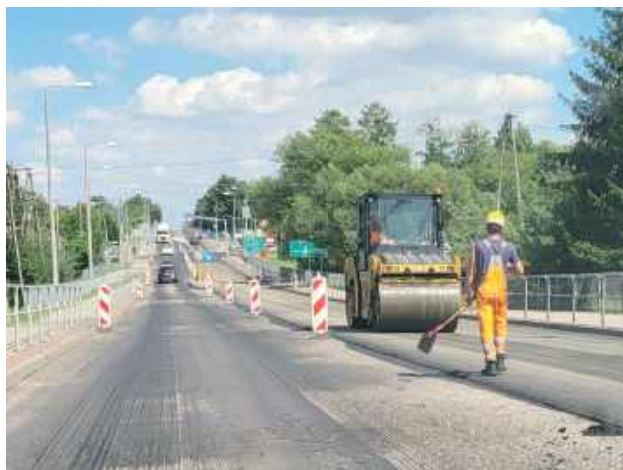
Remontowany był fragment trasy od stacji paliw do skrzyżowania w Przytocznie

Fragment trasy o dużym natężeniu ruchu, znajdujący się na terenie powiatu lubartowskiego, był remontowany przez drogowców. Występowały utrudnienia.