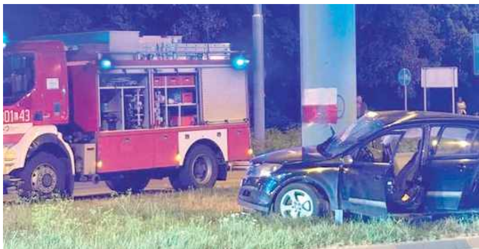
Kierujący samochodem marki Opel stracił panowanie nad pojazdem, zjechał na lewą stronę jezdni, a następnie na pas rozdzielający jezdnię, po czym prawym bokiem pojazdu uderzył w filar kładki dla pieszych

- Ze wstępnych ustaleń policjantów wynikało, iż kierujący samochodem marki Opel stracił panowanie nad pojazdem, zjechał na lewą stronę jezdni, a następnie na pas rozdzielający jezdnię, po czym prawym bokiem pojazdu uderzył w filar kładki dla pieszych. W wyniku zdarzenia z poważnymi obrażeniami ciała do szpitala trafiła 40-letnia pasażerka Opla. Jak się okazało, 39-letni kierowca był kompletnie pijany. Badanie alkomatem wykazało ponad 2 promile alkoholu w organizmie. Dodatkowo mężczyzna posiadał dożywotni zakaz kierowania pojazdami. Od razu został przez policjantów zatrzymany - informuje podinspektor Kamil Gołębiowski z KMP w Lublinie.