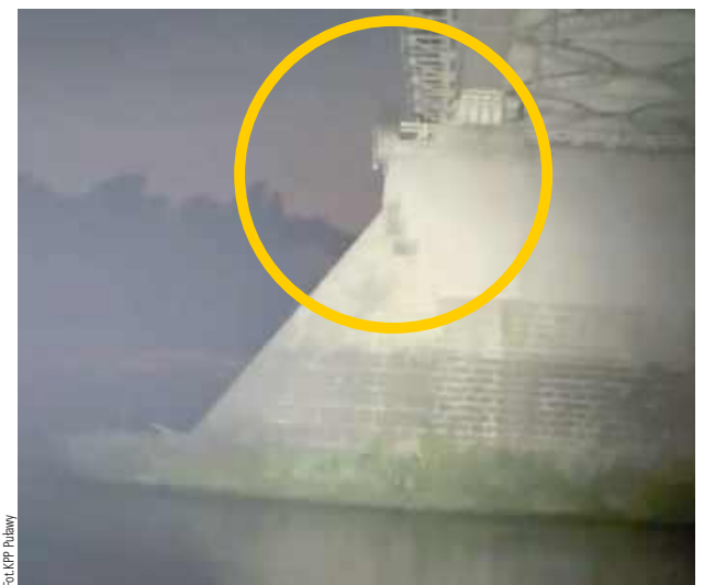
Był późny wieczór. Dziewczyna siedziała na przęsłach pod mostem i w każdej chwili mogła znaleźć się w wodzie