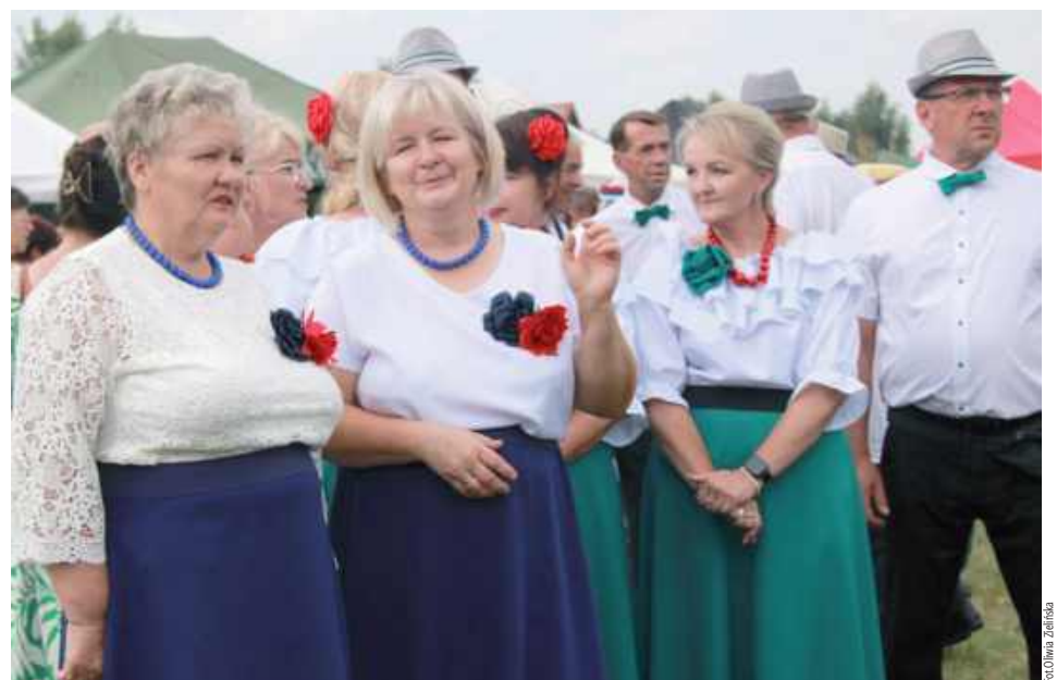
Przedstawiciele KGW przed ogłoszeniem wyników