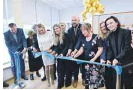
skich seniorów do zapisów, które prowadzi Miejski Ośrodek Pomocy Społecznej.

Klub czynny jest od poniedziałku do piątku w godzinach od 15.00 do 19.00 z wyłączeniem dni ustawowo wolnych od pracy. Serdecznie zapraszamy wszystkich zakopian-