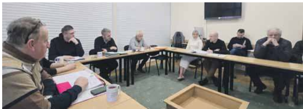
Radni sprawą służebności i miejsc parkingowych dla mieszkańców zajmują się już prawie półtora roku.