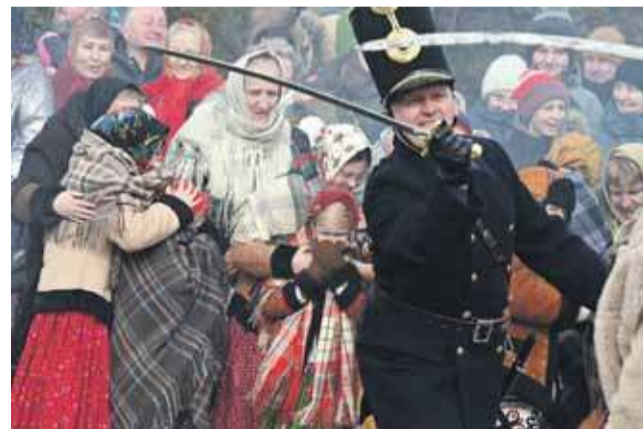
Walki toczyły się na oczach górali.

nej Romualda Fiutowskiego oddział około 20 strażników i 150 chłopów czarnodunajeckich, których atak powstańcy odparli, ale na krótko. 23 lutego do Chochołowa przybyła nowa grupa strażników wraz ze zmuszonymi do walki chłopami z Czarnego Dunajca. Tym razem górale bez pomocy z zewnątrz (powstanie w Krakowie odwołano o czym wieść nie dotarła na czas na Podhale) musieli się poddać.