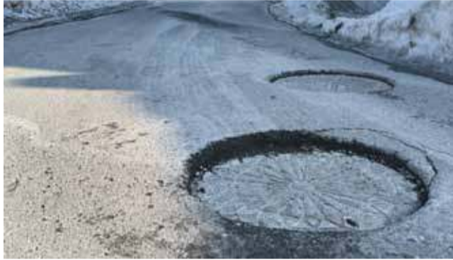
Ulica Bystra została wyremontowana ledwie rok temu.