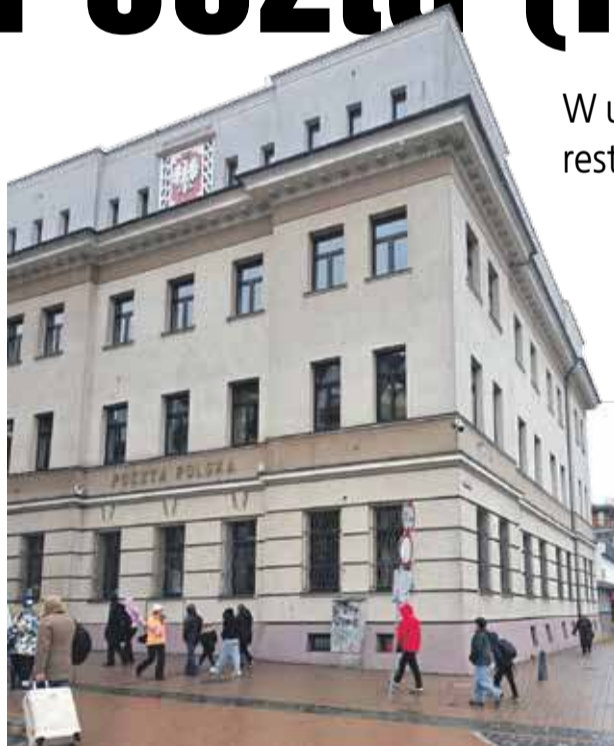
Poczta w Zakopanem mieści się w samym centrum miasta.

W urzędzie pocztowym będziemy mieć kolejną restaurację i apartamenty dla turystów.