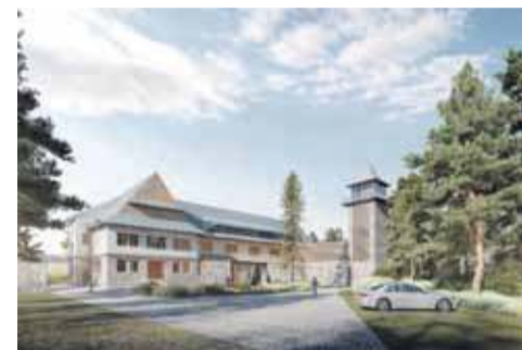
Wizualizacja Sokolnia - projekt: kropka studio / klub architektury www.kropka-studio.pl

Po adaptacji budynku „Sokolni” zgodnie z zatwierdzonym już projektem budowlanym powstanie w nim „Strefa dla mieszkańca” - wielofunkcyjne miejsce, obejmujące przestrzeń do spotkań, relaksu, kreatywności oraz wsparcia różnych grup