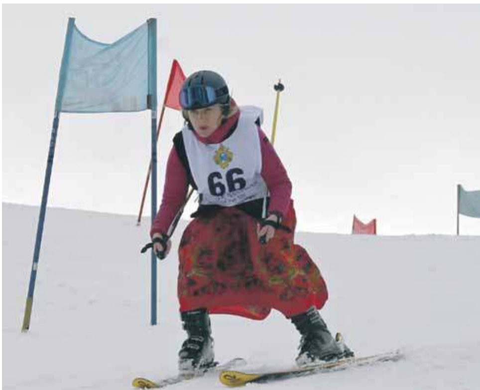
Zawodnicy osiągnęli spore prędkości na nowotarskim Zadziale.