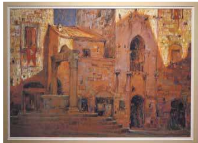
Autor zabiera swoich widzów w ciekawą artystyczną podróż.

Był stypendystą Ministra Kultury i Dziedzictwa Narodowego, nagradzany na Ogólnopolskim Biennale Pasteli, Triennale z Martwą Naturą oraz Laurem dla Młodych i Złotym Sygnetem „Adiunge optimorum”. Brał udział w ponad 60 wystawach zbiorowych i międzynarodowych m. in.