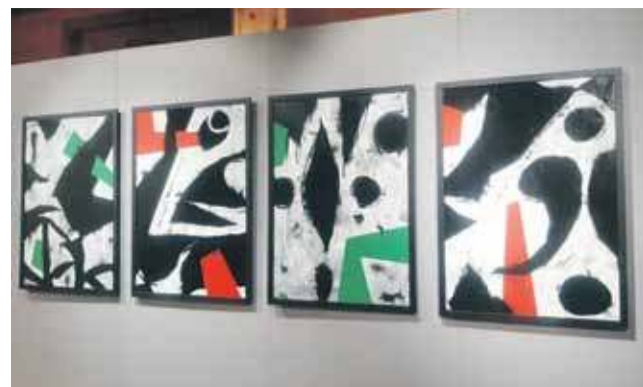
Cykl „Parzenica: Dekonstrukcje” Tomasza Grabowskiego to malarska eksploracja motywu głęboko zakorzenionego w kulturze Podhala.

Prezentowane prace tworzą różnorodną, a zarazem spójną nar-