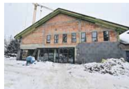
go z przedszkolem dla 125 dzieci w 5 oddziałach 25 osobowych. Otwarcie żłobka i przedszkole Miasto Zakopane planuje już we wrześniu 2026 roku

dzieci w 6 oddziałach 8-16 osobowych, zespolone-