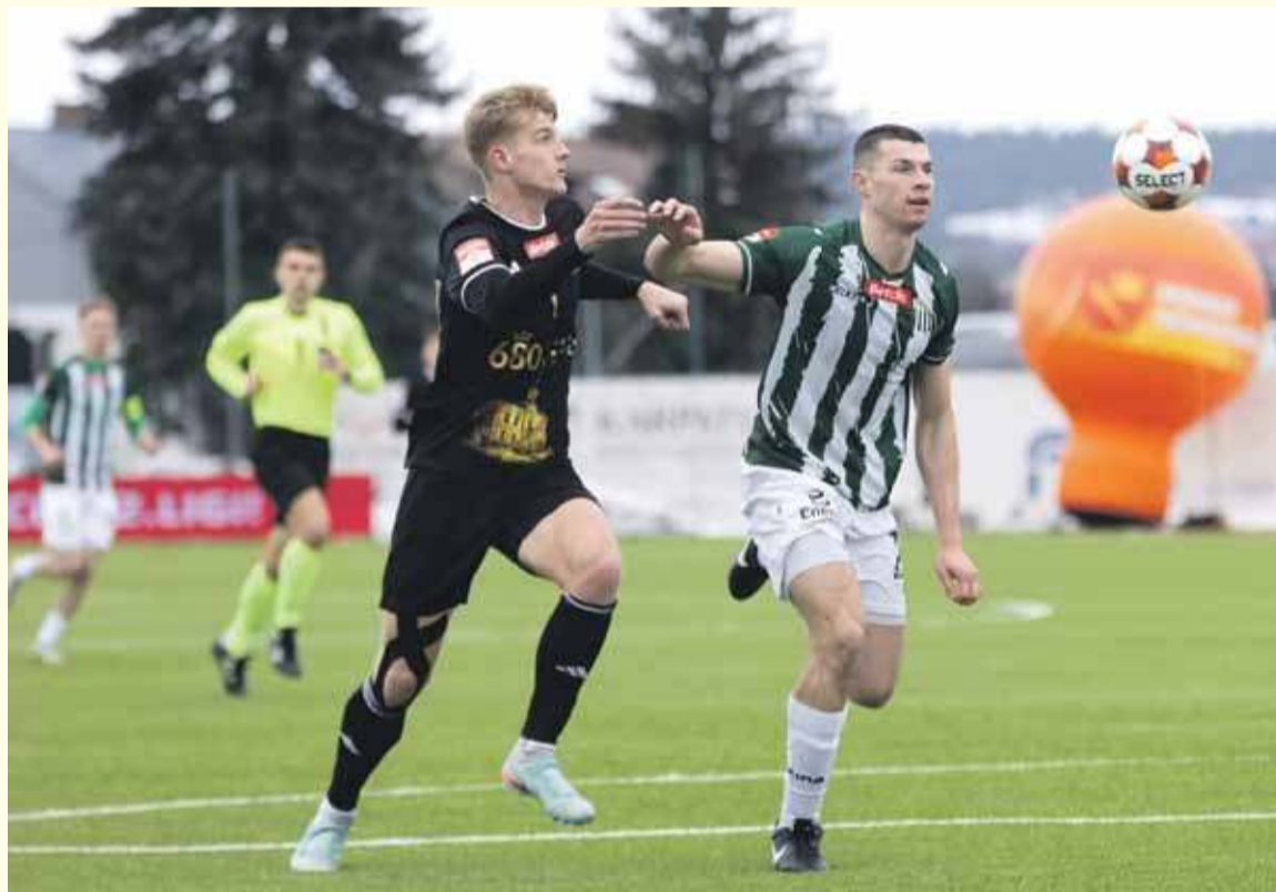
Kadr z meczu Podhale - Olimpia