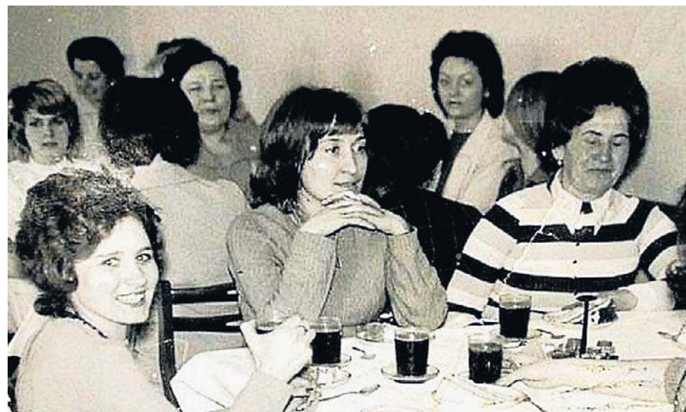
8 marca panie świętowały przy kawie i ciastkach

Dzień Kobiet zaczęto hucznie świętować po wojnie. W 1948 roku wielką akademię zorganizowano w gmachu Sądu Okręgowego na Placu Dą-