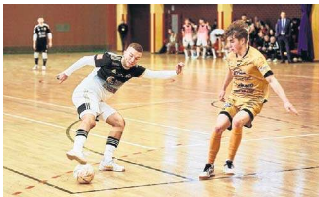
Jagiellonia Futsal Białystok rozegra najważniejszy mecz w tej rundzie z niepokonaną Wiarą Lecha Poznań

Drużyna z Poznania ma znakomity bilans - 15 zwycięstw i jeden remis, co najlepiej pokazuje, jaką siłą dysponuje. Jagiellończycy przegrali tylko raz - 2:3 właśnie w hali Wiary Lecha i są pod ścianą. Jeśli Żółto-Czerwoni marzą o bezpośrednim awansie, to muszą wygrać. Jeśli tak się nie stanie, pozostanie im obrona drugiego miejsca, gwarantującego udział w barażach o ekstraklasę.