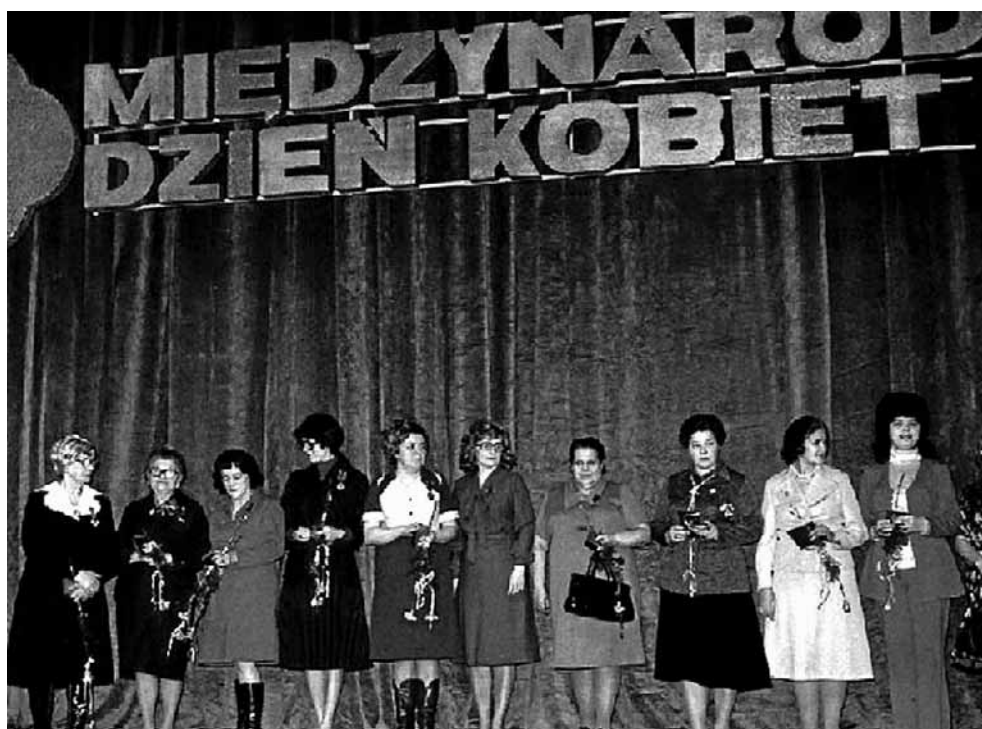
Władze PRL lubowały się w wielkich akademiach na cześć kobiet. 8 marca był też okazją do wręczenia kobietom odznaczeń

Lektor Polskiej Kroniki Filmowej z połowy lat siedemdziesiątych mówił: „Kobieta polska lat siedemdziesiątych to współtwórca największych osiągnięć naszej ojczyzny, otoczona szacunkiem i wszechstronną opieką państwa...”