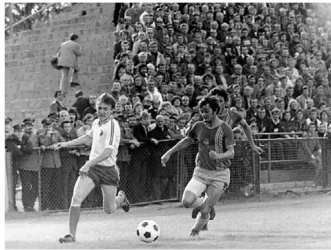
Zbigniew Boniek (z lewej) brylował w Widzewie Łódź, który odnosił wtedy sukcesy także na arenie międzynarodowej