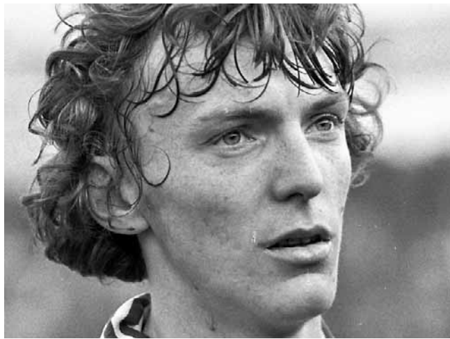
Zbigniew Boniek karierę zaczynał w Zawiszy Bydgoszcz, ale wkrótce trafił do Widzewa Łódź