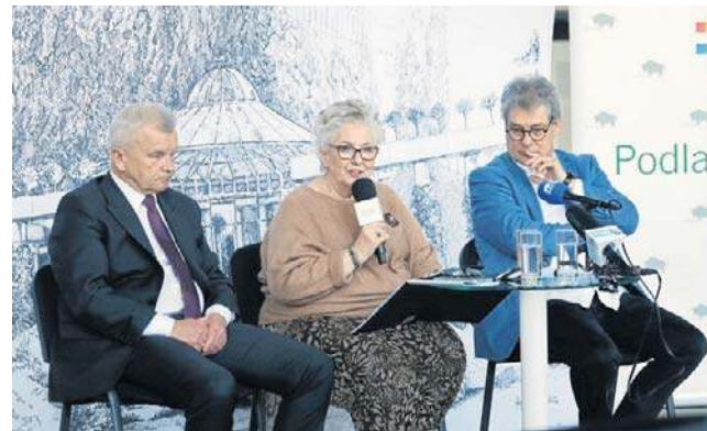
O szczegółach mówiono podczas konferencji prasowej