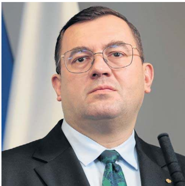
W Forum Rolniczym Województwa Podlaskiego weźmie udział m.in. minister rolnictwa Stefan Krajewski