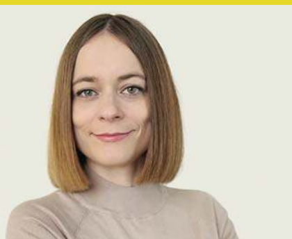
Nie wystarczy mniej jeść i więcej się ruszać |8