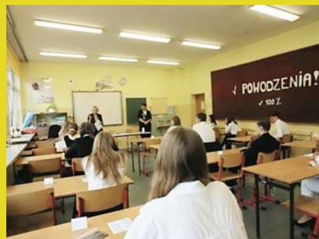
Uczniowie spod Olsztyna lepsi od miastowych |5