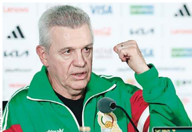
Javier Aguirre nie jest już selekcjonerem meksykańskiej reprezentacji