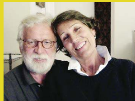
Rodzina jest siłą napędową ich życia |9