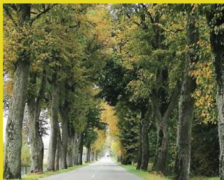
Batalia o 6678 drzew |2