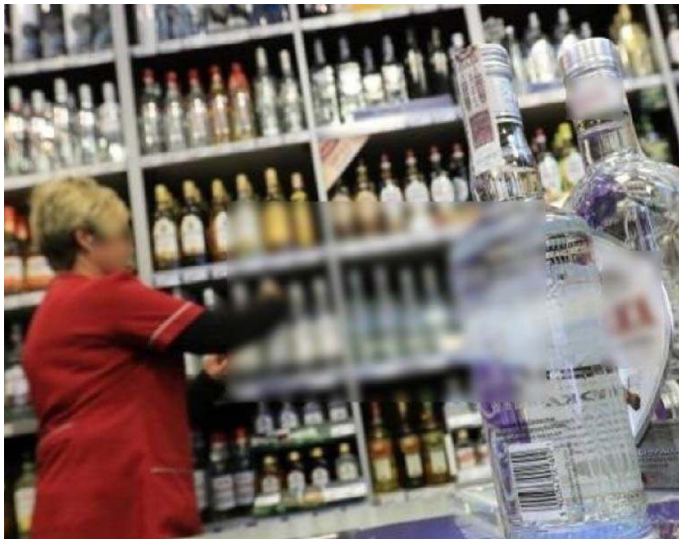
Zaraz po wprowadzeniu prohibicji niektórzy klienci byli zdziwieni, nawet zdenerwowani

- Policja nie gromadzi danych, które mogłyby odzwierciedlać wpływ nocnej prohibicji na liczbę zdarzeń, ale z rozmów z policjantami, m.in. dzielnicowymi wiemy, że nocami jest spokojniej. Otrzymujemy dużo mniej zgłoszeń np. z tych punktów miasta, gdzie działały nocne sklepy z alkoholem. Policja dostaje też podziękowania od mieszkańców takich rejonów, że wreszcie mogą spać po nocach, bo skończyły się libacje w pobliżu takich punktów handlowych. Iniejednokrotnie awantury wywołane przez nietrzeźwe osoby. Uważam, że jeśli nawet jednemu człowiekowi taki przepis, jak zakaz nocnej sprzedaży alkoholu pomoże, to i tak warto go wprowadzać. Z osobistych doświadczeń mogę powiedzieć, że rozmawiałem niedawno z ekspedientką jednego z marketów, gdzie często robię zakupy. Mówiła, że wreszcie