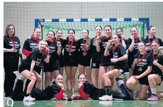
Szcypionistki i szcypioniści z SP nr 9 mogą się pochwalić dobrymi wynikami w skali regionu i kraju