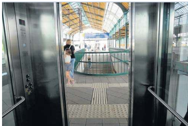
Z Legnicy pierwszy pociąg do Wrocławia rusza o g. 3.18