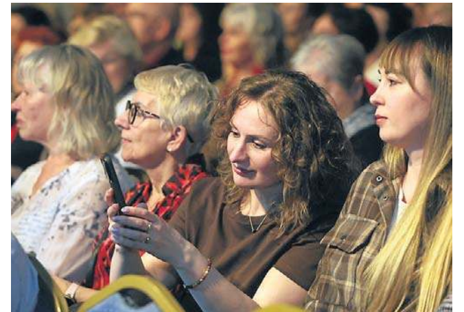
Legniczanki brawami przyjęły wykonanie muzycznych klasyków przez aktora, a ten obdarował je kwiatami