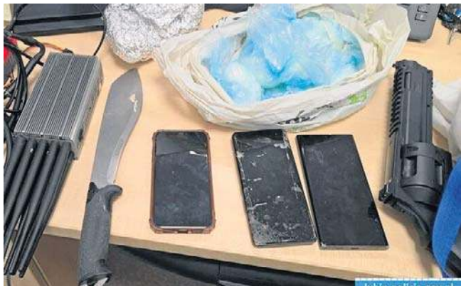
W mieszkaniu Lubinianina znaleziono duże ilości narkotyków, a także maczetę, zagłuszarkę i amunicję