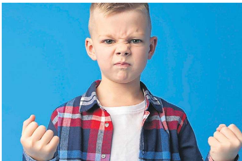
Coraz powszechniejszy problem - agresywne dziecko w grupie przedszkolaków.

Problemy z dziećmi wymagającymi specjalnego wsparcia - a najpierw diagnozy - są dziś powszechne. I różnie bywają rozwiązywane. Czasem jednak to nie profesjonalizm zwycięża, ale silne ludzkie emocje. - Agresywny chłopiec bijący innych, ewidentnie sam też potrzebujący pomocy, z naszego przedszkola ostatnio został zabrany przez rodziców i przeniesiony. Pamiętam tego kaca moralnego, którego jak i przynajmniej połowa rodziców po wszystkim mieliśmy. Człowiek w obronie bezpieczeństwa swojego dziecka, wiadomo, chce jak najlepiej. Los tamtego dziecka jakoś umknął w tym wszystkim. Wychowująca go samotnie matka pod presją zabrała go z placówki; wsparcia dla niego tutaj nie dostała - wspominają rodzice z Torunia, których dziecko uczęszczało do publicznej placówki w centrum miasta. ©