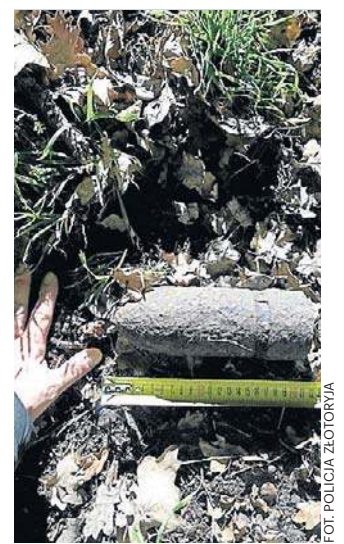
Takie znalezisko najlepiej zgłosić od razu na policję, bo może być bardzo niebezpieczne

Znaleziska przypominające niewybuchy nie wolno pod żadnym pozorem podnosić, odkopywać, przesuwać,