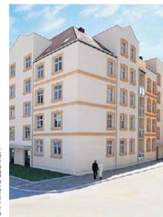
Obiekt domknie architektonicznie ten kwartał miasta