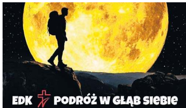
Plakat Ekstremalnej Drogi Krzyżowej 2026

- niebieska: Złotoryja - Jawor (kościół św. Marcina) - 36 km