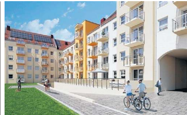
Tak na wizualizacjach prezentuje się nowy budynek TBS

Nie udało nam się uzyskać informacji na temat liczby osób nietrzeźwych, które trafiają na legnicki SOR. Do sprawy powrócimy.