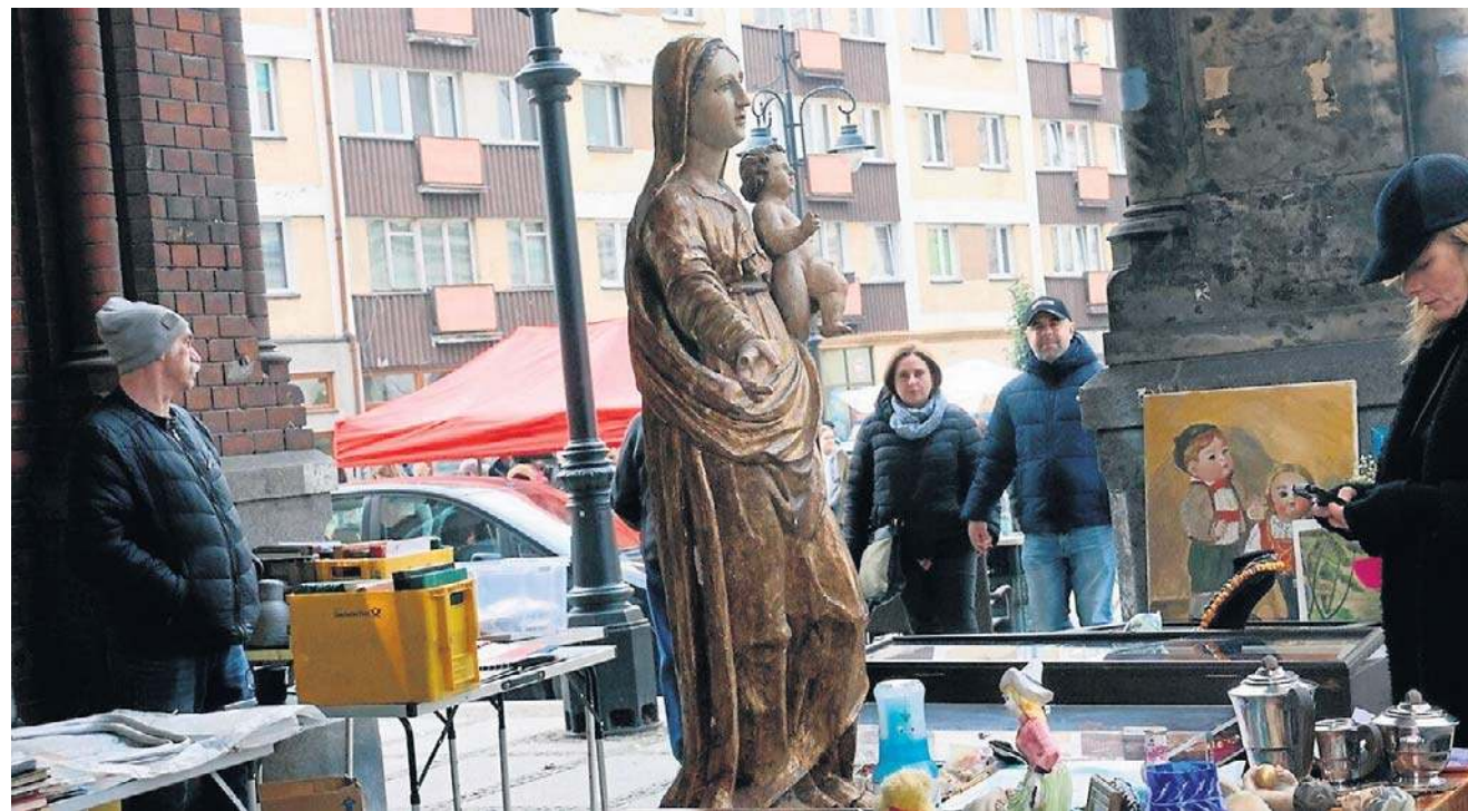
FOT. PIOTR KRZYŻANOWSKI

Rynek w Legnicy zamienił się 8 marca w tętniącą kolorami i aromatami przestrzeń inspirowaną kuchniami Azji. Wszystko za sprawą festiwalu Ekspedycja Orientalna. Były stoiska też z polską kuchnią. Jednocześnie odbywał się Jarmark Staroci - jak zwykle w każdą drugą niedzielę miesiąca, organizowany przez Towarzystwo Miłośników Legnicy „PRO LEGNICA”. Piotr Krzyżanowski