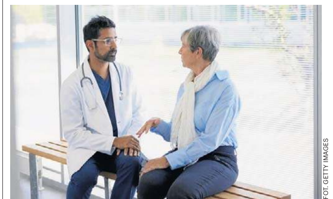
Powiększona (obrzęknięta) wątroba może powodować ból w prawym barku lub plecach. Dlatego takiego bólu nie wolno ignorować.

W takich sytuacjach konsultacja z lekarzem jest niezbędna, ponieważ wczesne wykrycie zmian w wątrobie zwiększa szanse na skuteczne leczenie. ©©