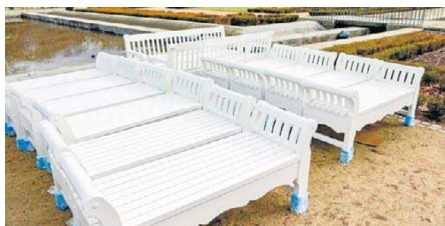
Nowiutkie ławki i siedziska są już rozstawione

Do dyspozycji odwiedzających fontannę w Parku Miejskim w Legnicy jest w sumie 49 ławek z oparciami oraz 10 siedzisk bez oparcia.