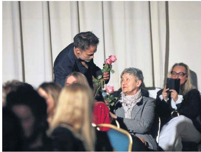
W Centrum Witelona były Targi dla kobiet (po lewej). W Sali Maneżowej zaśpiewał Maciej Zakościelny