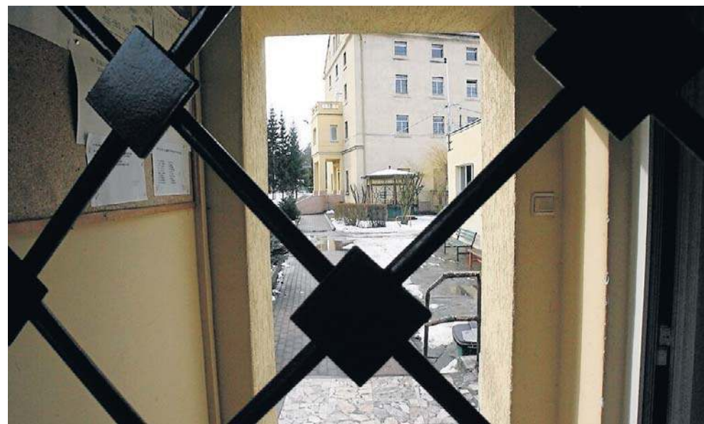
Sprawa znęcania się nad 13-latką stała się głośna w całym kraju

Jak relacjonowaliśmy wcześniej w „Panoramie”, do dramatycznych wydarzeń