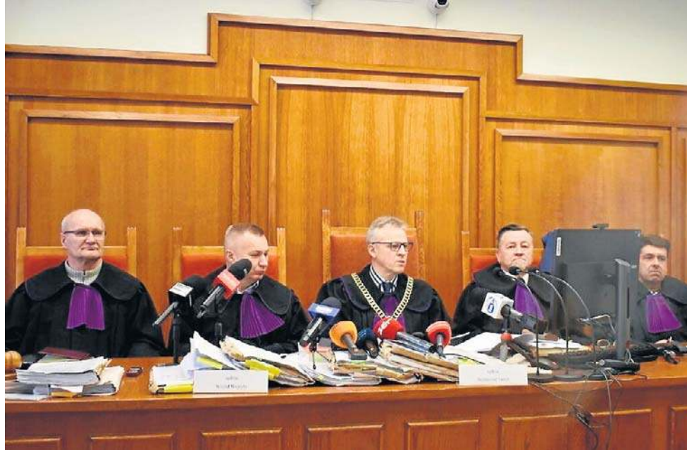
Sprawę rozpoznawał sąd w pięcioosobowym składzie