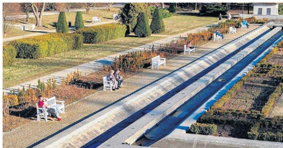
Nowe ławeczki objęte są ponad 3-letnią gwarancją. Będą na bieżąco naprawiane i konserwowane przez producenta

- W ramach podpisanego porozumienia, nowe ławki zostały objęte 42-miesięczną gwarancją. W jej ramach, dwa razy w roku, po lecie i po zimie, producent będzie dokonywał