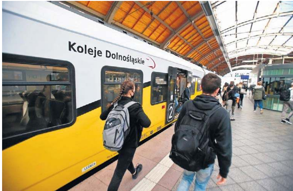
Od 8 marca łatwiej dojechać pociągiem do miejscowości położonych wokół Wrocławia

W różnych terminach wyłączone z ruchu będą odcinki: Polanica Zdrój - Kudowa Zdrój, Jelenia Góra - Szklarska Poręba Górna, Międzyzylesie - Lichkov, Szklarska Poręba Górna - Tanvald (Czechy).