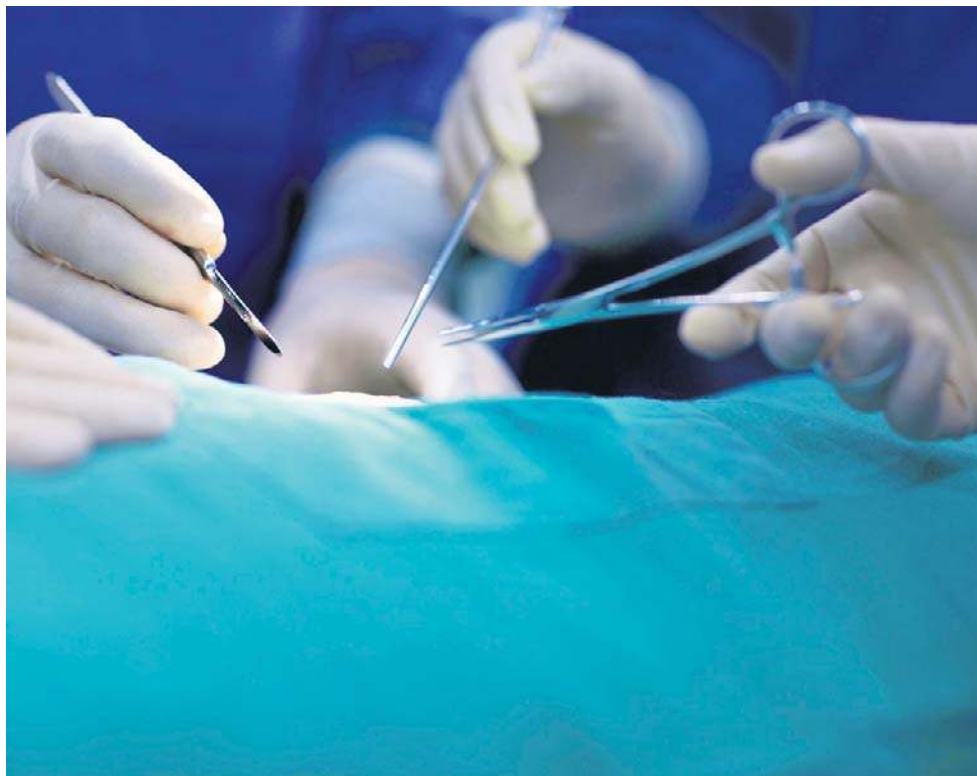
Przeszczep nerki to efekt starannie zaplanowanej, zespołowej pracy: lekarzy, sprawnych procedur i przygotowanych pacjentów.