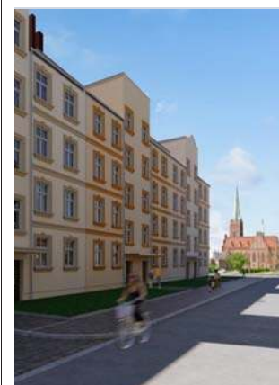
W budynku będzie 45 mieszkań

W budynkach TBS w Legnicy jest ponad pół tysiąca mieszkań.