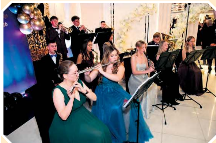
Do walca zagraли członkinie i członkowie Reprezentacyjnej Orkiestry Lasów Państwowych.