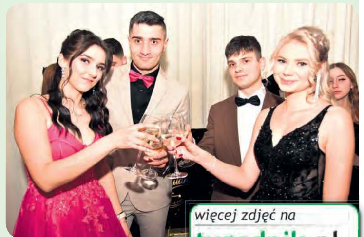
Toast za udaną zabawę!