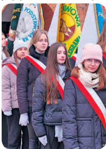
Uczniowie tucholskich szkół w pocztach sztandarowych.