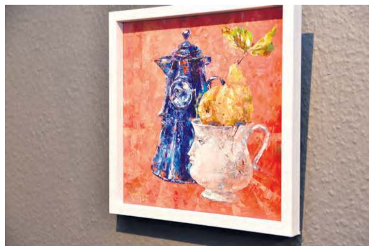
Jedna z niesamowitych prac Wiktorii Timofiejewej prezentowanych na wystawie.

ne w formie, zajmują niebywale dziwną przestrzeń. Jakby unosiły się w powietrzu, a zarazem trzymały na jednym palcu tej ziemi. Są po prostu niezwykle – podkreślała z kolei kuratorka wystawy.