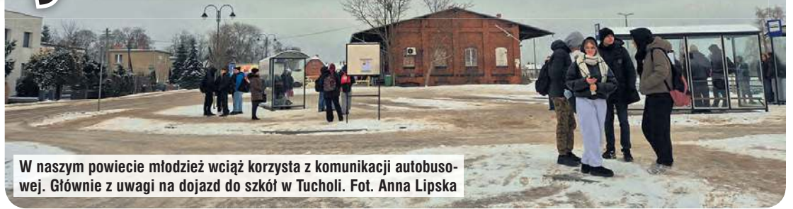
W naszym powiecie młodzież wciąż korzysta z komunikacji autobusowej. Głównie z uwagi na dojazd do szkół w Tucholi.

Od dyrektorki PKS-u chcieliśmy się dowiedzieć, czy od nowego roku zostały wprowadzone zmiany w rozkładzie jazdy na terenie powiatu tucholskiego. Na wspomnianym spotkaniu zorganizowanym w Tucholi można było usłyszeć przede wszystkim o potrzebie dodatkowego kursu w kierunku Lubiewa. To właśnie stamtąd docierały do nas zdjęcia i informacje