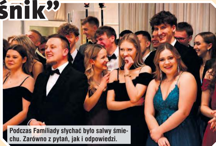
Podczas Familiady słychać było salwy śmiechu. Zarówno z pytań, jak i odpowiedzi.

– Patrząc na Was, widzę młodych ludzi pełnych uśmiechu, zapału, przygotowanych do tego, aby zawojować cały świat! Ży-