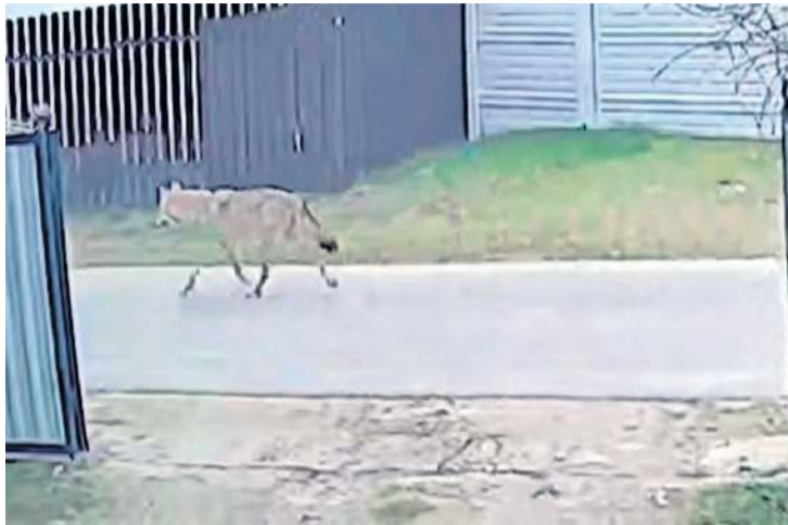
Wilki zarejestrowany jesienią przez prywatną kamerę w Brzeźnie.

Jeszcze w grudniu ubiegłego roku pisaliśmy, że gmina Śliwice prosiła swoich mieszkańców o zachowanie „szczególnej ostrożności” w związku z podchodzeniem wilków blisko posesji. Samorząd podkreślał, że w celu uniknięcia konfrontacji wilków z psami, właściciele czworonogów powinni zapewnić im odpowiednią opiekę i warunki. Przede wszystkim powinni zapobiec poruszaniu się psów luzem. Ważne, aby mieszkańcy zabezpieczyli pojemniki na odpady przed dostępem dzikich zwierząt.