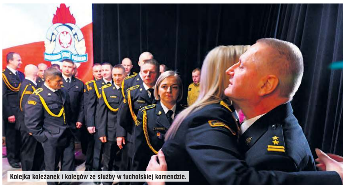
Kolejka koleżanek i kolegów ze służby w tucholskiej komendzie.