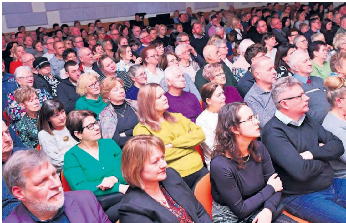
Sala widowiskowa TOK-u pękająca w szwach. Orkiestra LP sprawiła, że z tym zjawiskiem mieliśmy do czynienia dwa dni z rzędu.

co w ogóle nie dziwi i należy być do tego przyzwyczajonym. Nie ma w Tucholi czy regionie zespołu, który akurat na tuchol-