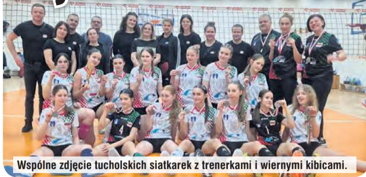
Wspólne zdjęcie tucholskich siatkarek z trenerkami i wiernymi kibicami.

nie. Przełożyło się to na samą grę, ale do piętnastego punktu. Później Pałac zaczął odjeżdżać z wynikiem i nie było łatwo nadrobić strat, ponieważ Bydgoszczanki grały zaciekle, uważniej i bez przestojów. Drugi set to od początku pogoń za gospodyniami, które od pierwszych akcji wypracowały sobie przewagę kilku punktów. Tucholanka miała kilka zrywów i akcji, które zmusiły rywalki do większego wysiłku. Mimo wszystko to gospodynie wygrały cały mecz, jednak nie bez wysiłku.