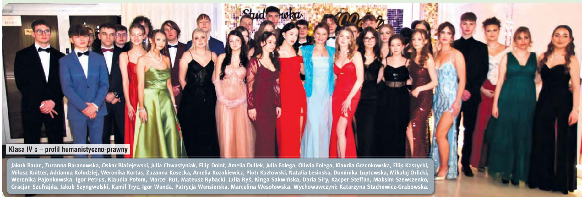
Klasa IV c – profil humanistyczno-prawny