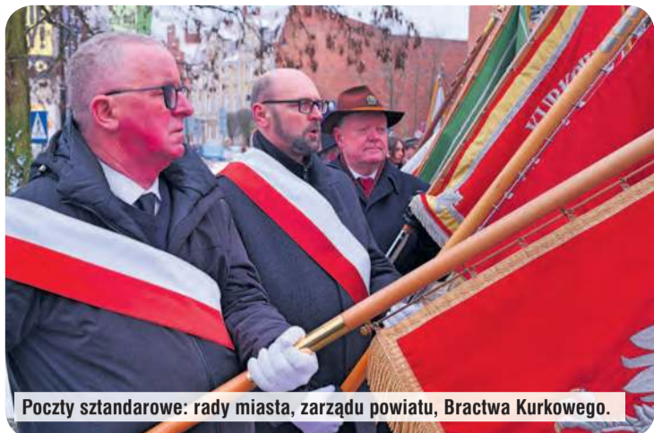
Poczty sztandarowe: rady miasta, zarządu powiatu, Bractwa Kurkowego.