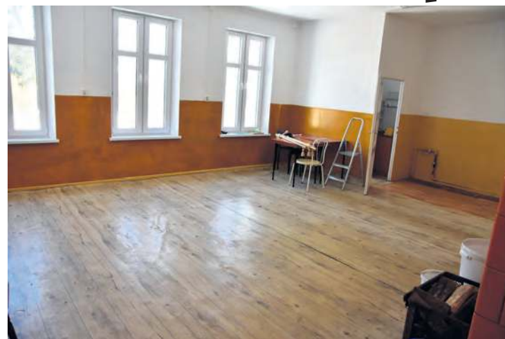
Mieszkańcy Brzeźna stwierdzili, że sklep był dla nich miejscem lokalnych spotkań. Tak wygląda to miejsce obecnie.

– Sklep został zlikwidowany z powodu zbyt niskich obrotów. Mieszkańcy o jego zamknięciu wiedzieli od początku grudnia, bo była wywieszka. Rozmawiałam również z panią z rady sołectkiej, która była zakłopotana tą sytuacją. Teraz mieszkańcy są niezadowoleni z zamknięcia sklepu, a wcześniej nie robili w nim