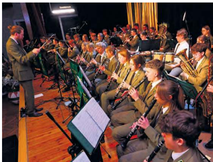
Szczelnie wypełniona jest także scena tucholskiego domu kultury. Tak liczny skład ma orkiestra.

skiej scenie i widowni praktycznie za każdym razem robi taką samą furorę. Pierwszego popołudnia sala widowiskowa pękała w szwach, co mieliśmy przyjemność zobaczyć osobiście.