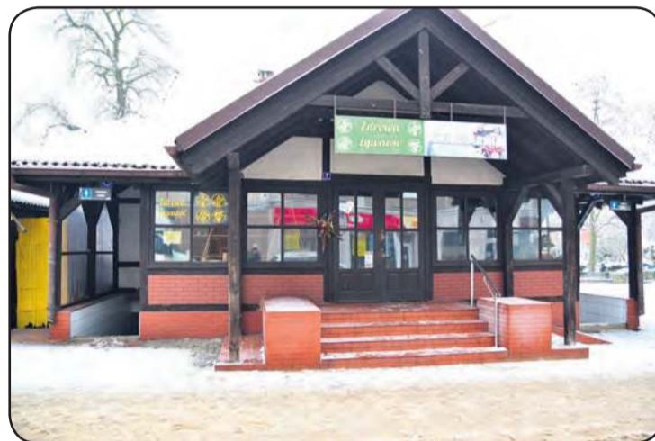
Publiczne toalety, które mieszczą się przy ul. Wryczy, od pewnego czasu pozostają nieczynne.