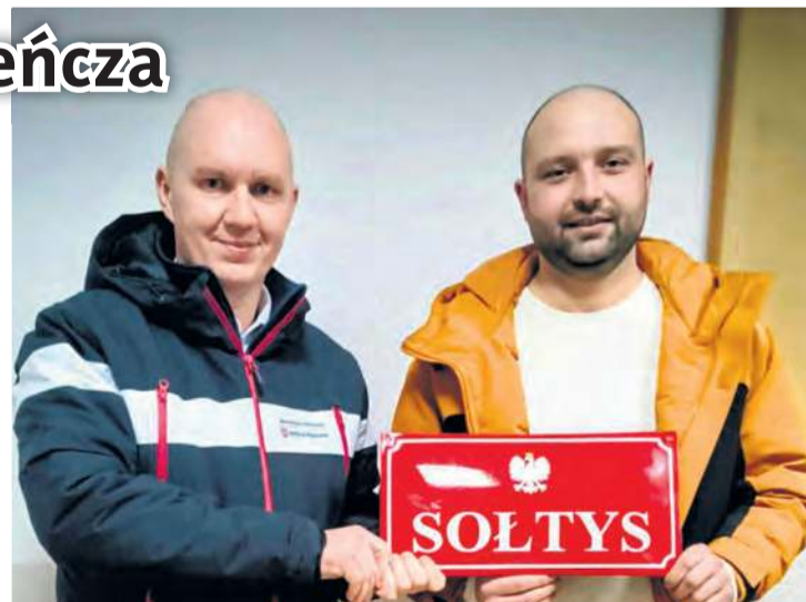
Nowemu sołtysowi gratulacje złożył wójt gminy.

bezpośrednio po zwycięskich wyborach, jak i podczas późniejszej sesji rady gminy. Z kolei dotychczasowa sołtys odebrała serdeczne podziękowania