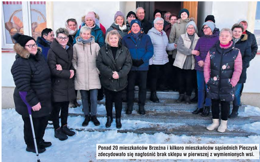
Ponad 20 mieszkańców Brzeźna i kilkoro mieszkańców sąsiednich Pieczysk zdecydowało się nagłośnić brak sklepu w pierwszej z wymienionych wsi.

biorców nie tyle z terenu gminy, a szerzej powiatu tucholskiego lub nawet spoza jego granic.