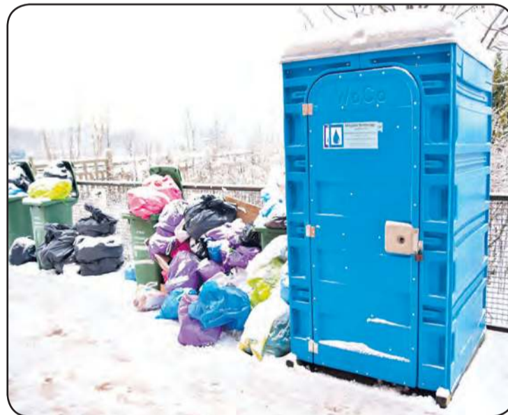
Po godzinie 15:00 pozostaje opcja skorzystania z toi-toia przy dworcu.

fizjologicznymi w centrum miasta, zanim inwestycje zostaną zrealizowane? Jak wskazuje burmistrz, dostępną opcją jest WC na dworcu, czynne od poniedziałku do piątku w godzinach 8:00-15:00.