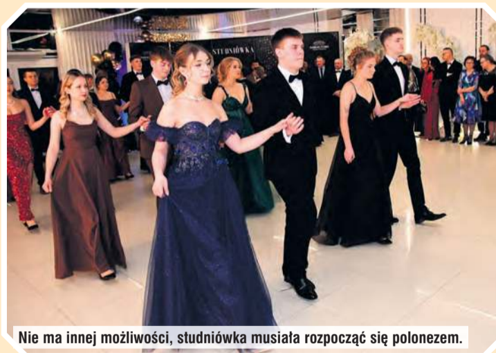
Nie ma innej możliwości, studniówka musiała rozpocząć się polonezem.