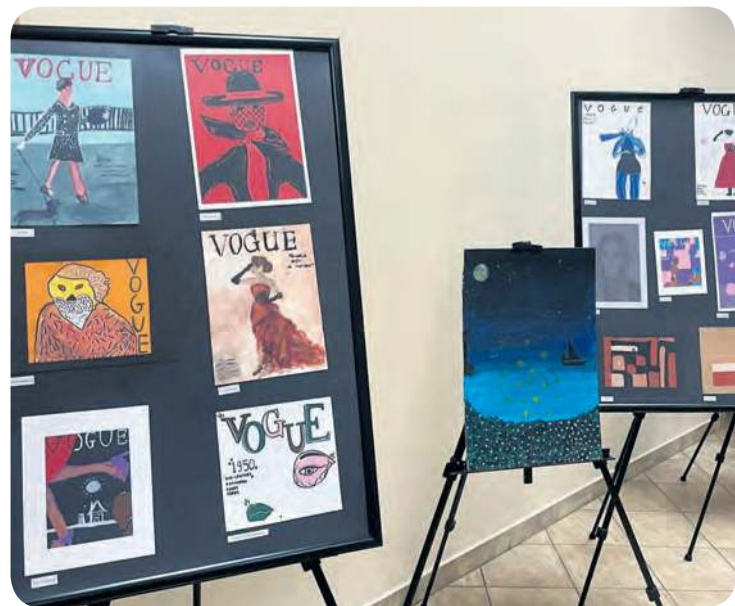
Jedną z inspiracji był magazyn poświęcony modzie, urodzie i sztuce – Vogue.