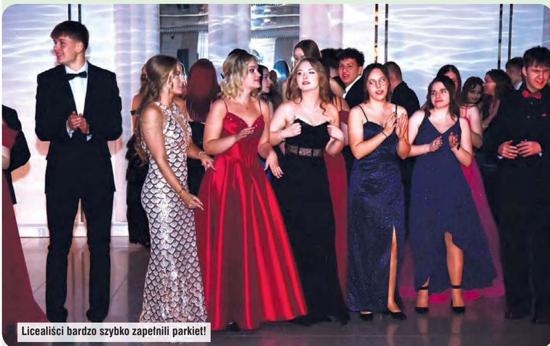
Licealiści bardzo szybko zapełnili parkiet!