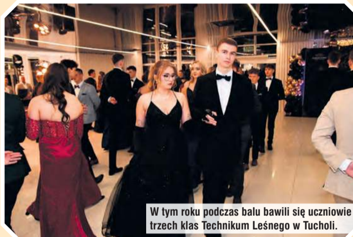
W tym roku podczas balu bawili się uczniowie trzech klas Technikum Leśnego w Tucholi.

Po gromkich brawach i watach przyszedł czas na tradycyjnego poloneza. Potem maturzyści zaprosili swoich nauczycieli do walca. I tutaj niespodzianka! Walca odtąńczono do muzyki na żywo – dzięki obecnym w sali członkiniom i członkom (w znacznej mierze maturzystom) Reprezentacyjnej Orkiestry Lasów Państwowych. Na czele, z batutą w rękę, sta-