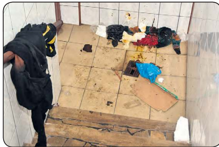
Taki przykry widok można było zastać przed wejściem do toalet przy ul. Wryczy w minionym tygodniu.

Plany gminy z pewnością cieszą mieszkańców, ale jak radzić sobie z potrzebami