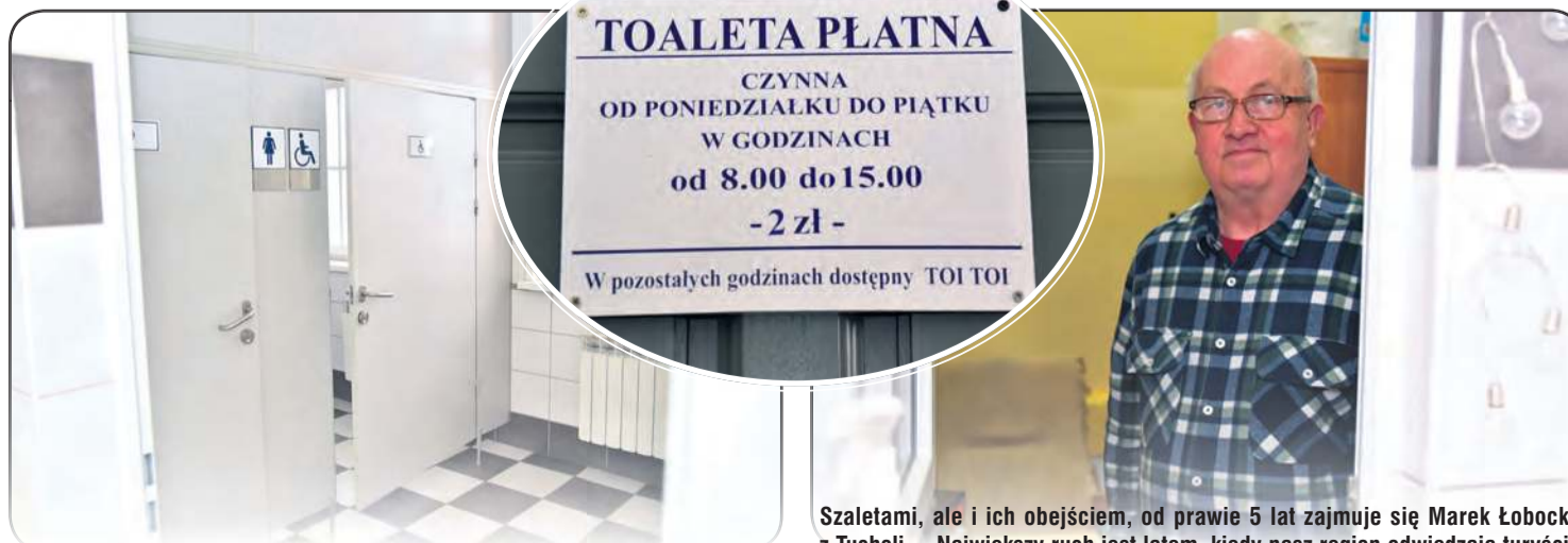
Toalety na dworcu są zadbane, czyste i przystosowane do potrzeb osób z niepełnosprawnością.