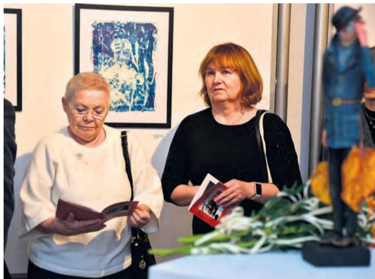
Uczestnicy wystawy mieli okazję obejrzeć m.in. obrazy wykonane w technice cyjanotypii (widoczne w tle).