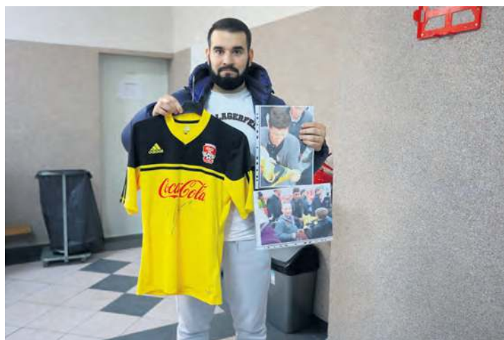
Nowy właściciel koszulki z autografem Roberta Lewandowskiego.

Same rozgrywki to znany turniejowy podział drużyn na cztery grupy i mecze każdy z każdym. Później system pucharowy pozwolił wyłonić ćwierćfinalistów i zespoły, które starły się w meczu o końcowy triumf. Na parkiecie spotkali się zawodnicy znani z lokalnych klubów piłkarskich. Wielu z nich grało niedawno w turniejach WOŚP-owych, teraz przybyli do Kęsowa. Każdy zespół