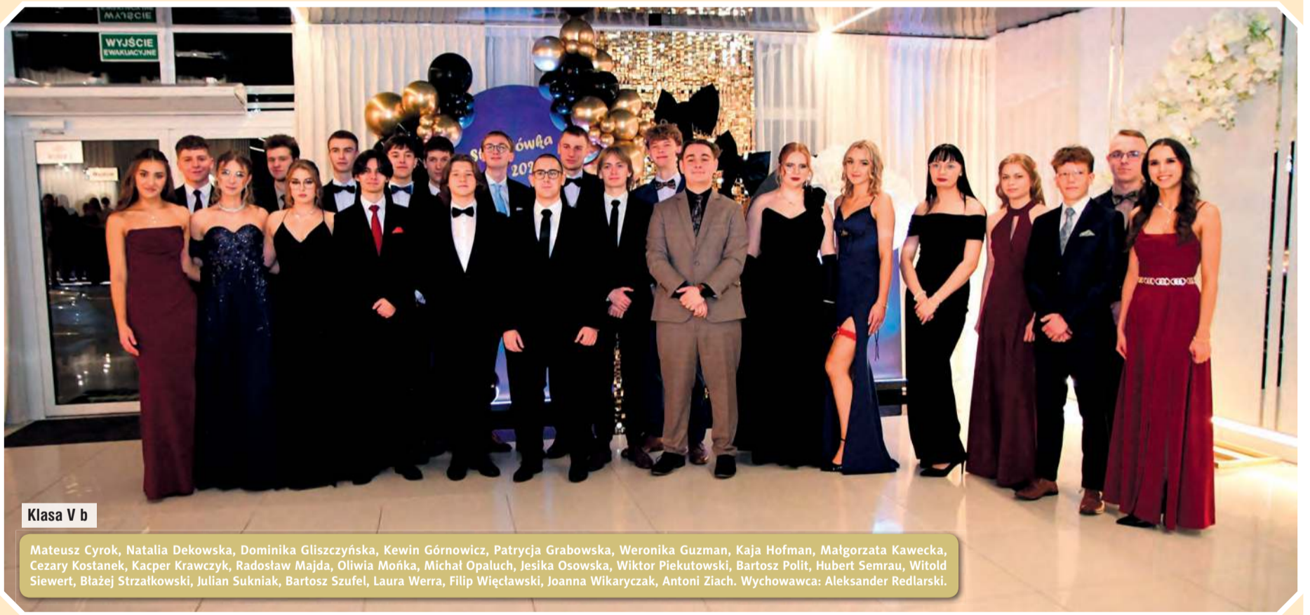
Klasa V b