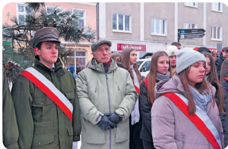
Podczas uroczystości ramię w ramię stanęli przedstawiciele różnych pokoleń.