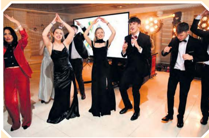
Po części oficjalnej i wszelkich niespodziankach przyszedł czas na głośną, szaloną zabawę.