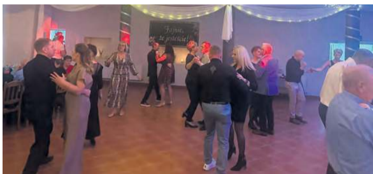
Wspólna zabawa trwała do godziny 1:30.