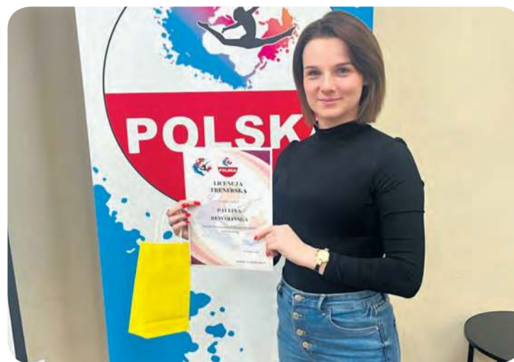
Nowe możliwości z licencją trenerską w ręku z pewnością jak najszybciej wejdą w życie na zajęciach.

grupie. Dawało to możliwość bardziej intensywnych ćwiczeń z poszczególnymi trenerami. Zostałam trenerką cheerleadingu basic taneczny – oto pełna nazwa według certyfikatu.