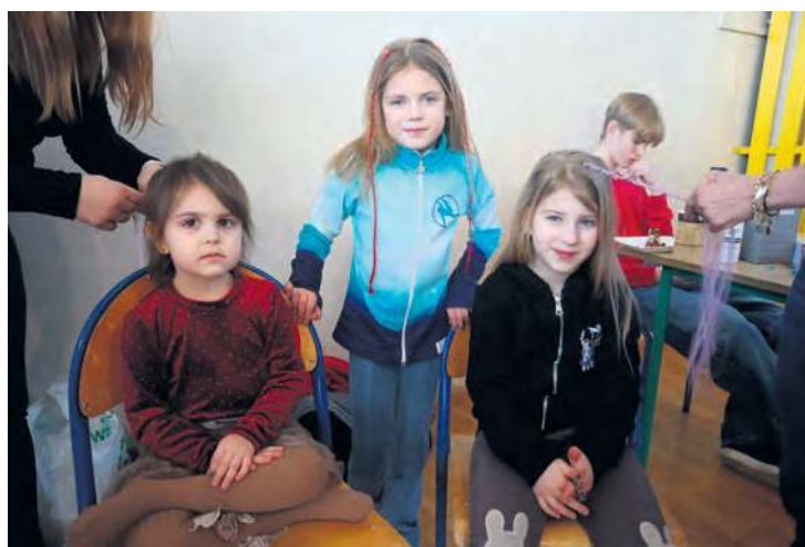
Najmłodsi uczą się od starszych dobra. Na turnieju mieli mnóstwo doskonałych przykładów.