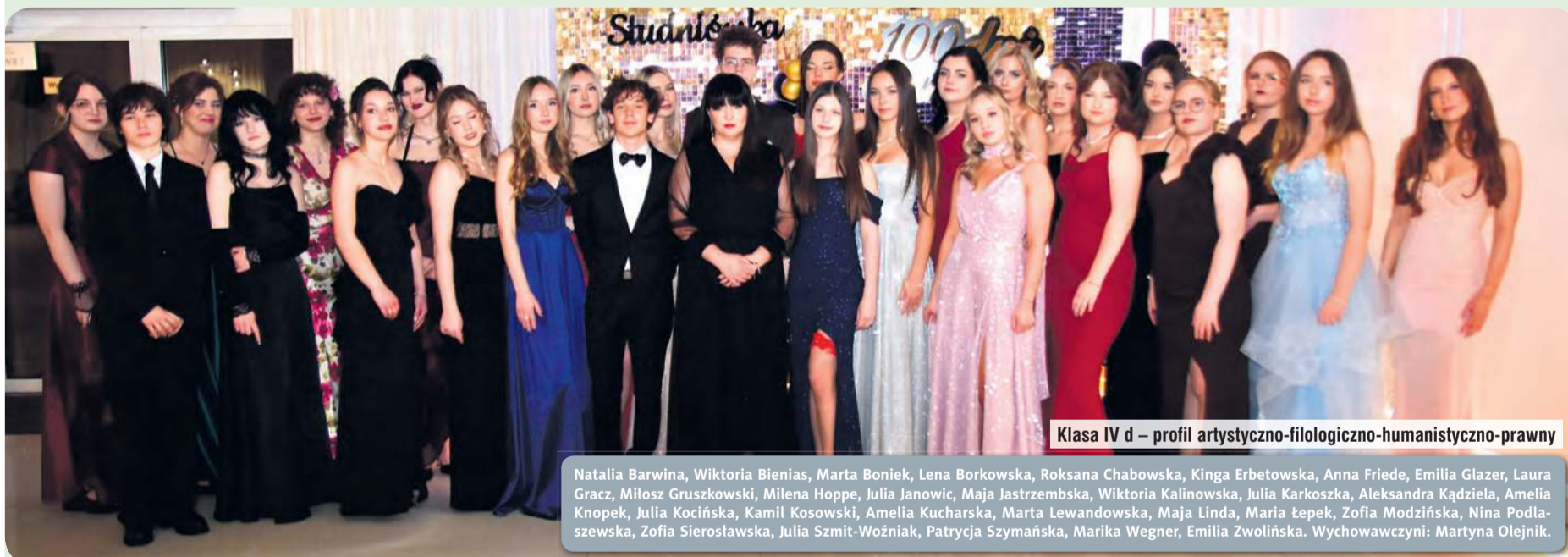
Klasa IV d – profil artystyczno-filologiczno-humanistyczno-prawny