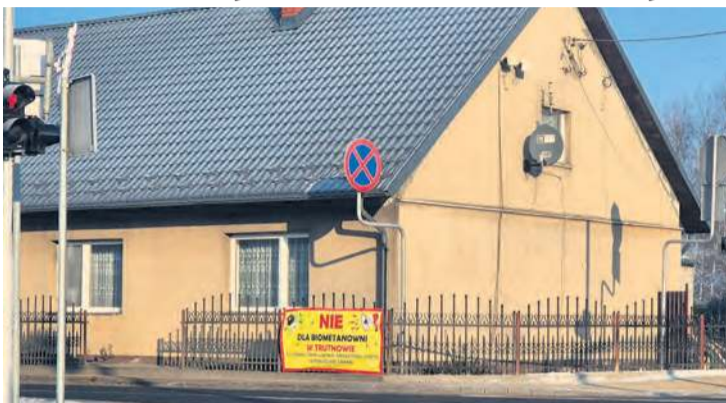
Baner wyrażający sprzeciw wobec budowy biometanowni w zawist w centrum Bystawia. Jak już wiemy z wcześniejszych artykułów, inwestycja miałaby powstać na powierzchni 5 ha, podpisano przedwstępna umowę kupna działki z jej właścicielem. Grunt, o którym mowa, znajduje się w lesie między drogą Błędzim-Świąkatowo a Trutnowem.

Wspomniana komisja skarg, rozpatrując pismo, zdecydowała o szczegółowym zbadaniu sprawy. Początkowo było to pozyskanie stanowiska głównego inicjatora budowy biometanowni, firmy PTX Sp. z o.o. oraz wystąpienie do Kujawsko-Pomorskiego Autopromocja