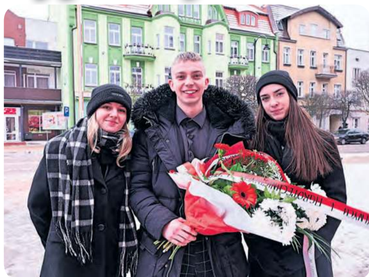
To okazja, którą w Tucholi należy świętować z uśmiechem – podkreślali organizatorzy obchodów powrotu Tucholi w granice Polski.