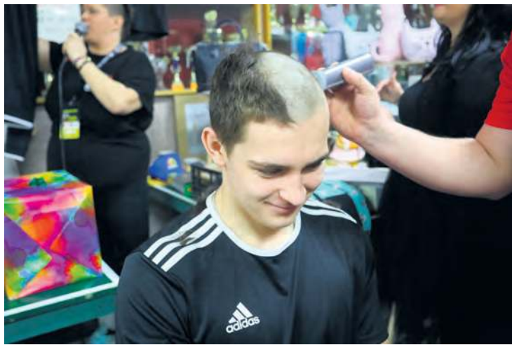
Możliwość ostrzyżenia tego młodego człowieka na zero kosztowała zwycięzcę licytacji 2000 zł.