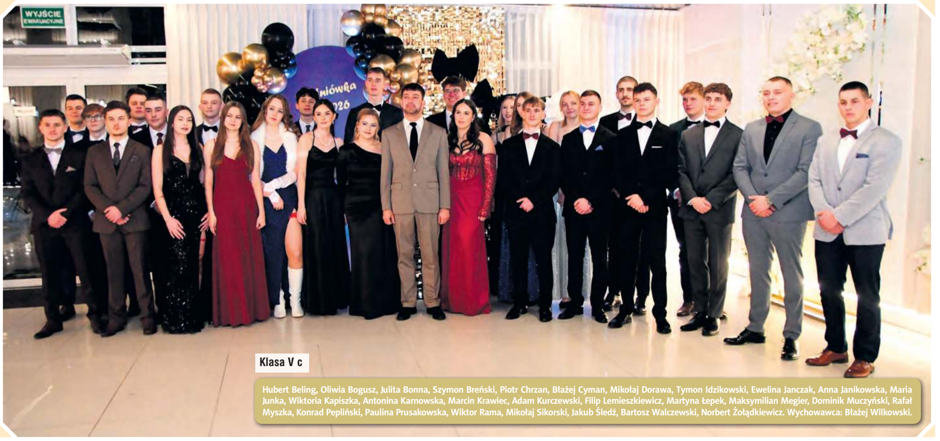
Klasa V c