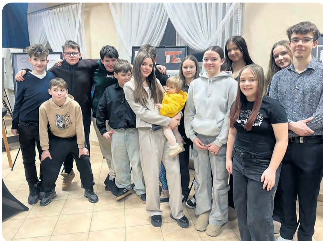
Młodzież z gminy Kęsowo ma powody do dumy. Jej wystawa została bardzo ciepło przyjęta.