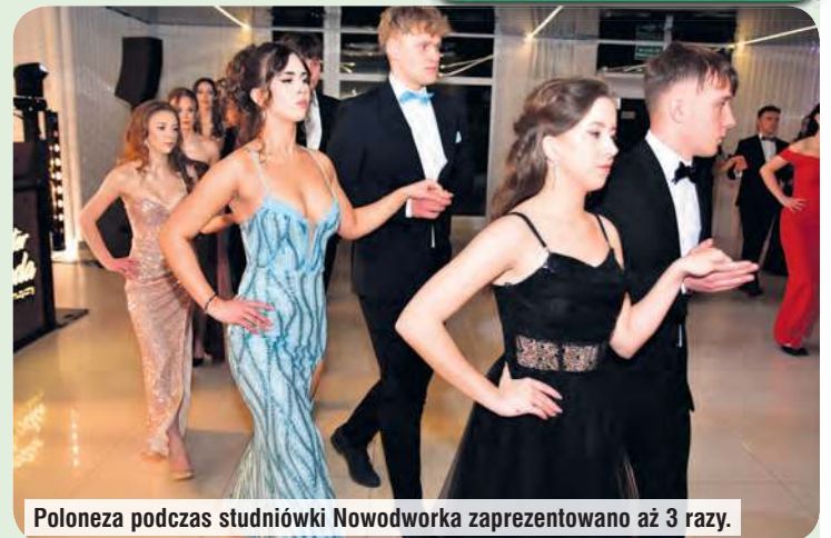
Poloneza podczas studniówki Nowodworka zaprezentowano aż 3 razy.

maturzystom, aby bal studniówkowy zapisał się dobrze w ich pamięci.