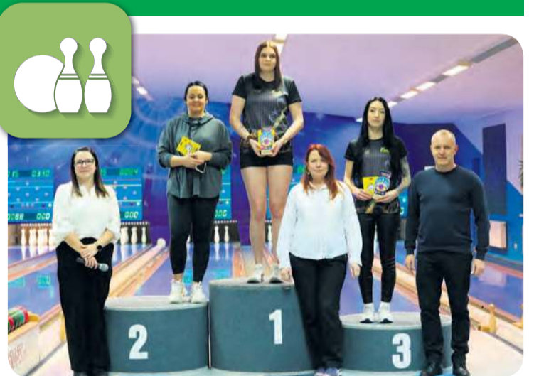
W kategorii kobiet wygrała zawodniczka superligi.

– To wszystko jeszcze przed kręglarzami. Tymczasem w sobotę panie i panowie spotkali się przy Pocztovej, by po raz ostatni dolożyć do swojego dorobku punkty z turnieju wliczanego do klasyfikacji indywidualnej.