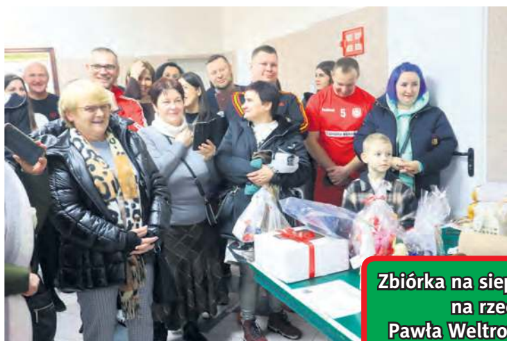
Ludzie otaczali ciasnym kręgiem miejsce licytacji.