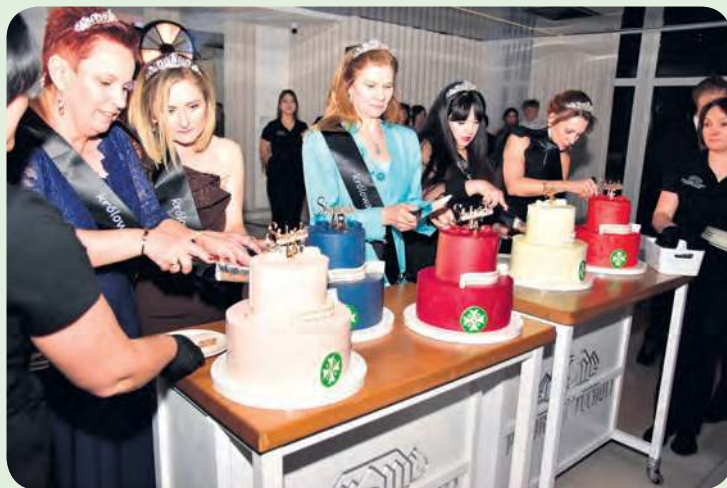
Maturzyści zadbali o słodki akcent wieczoru – torty. Ich krojenia podjęły się wychowawczynie.

– Żadna z tych wartości nie może osobno istnieć – dodał dyrektor, jednocześnie życząc