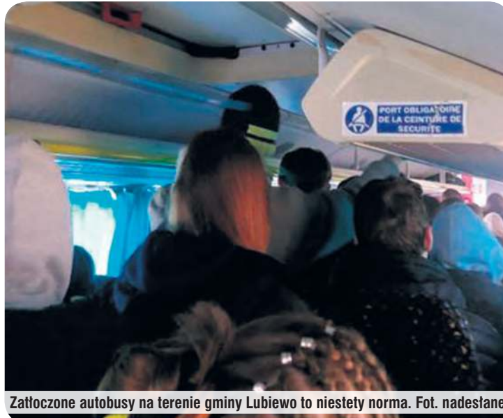
Zatłoczone autobusy na terenie gminy Lubiewo to niestety norma.

o przepełnionych autobusach. Temat poruszany był nawet na jednym z zebrań wiejskich w Minikowie.