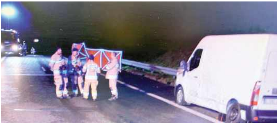
Ciężarówka potrafiła dwóch mężczyzn w wieku 49 i 28 lat, którzy na pasie awaryjnym wymieniali koło w busie

- Z ustaleń policjantów wynika, że dwaj mężczyźni w wieku 49 i 28 lat podczas wymiany koła w pojeździe zostali potrąceni przez samochód ciężarowy, którym kierował 28-letni obywatel Ukrainy. Mężczyźni mieli na sobie