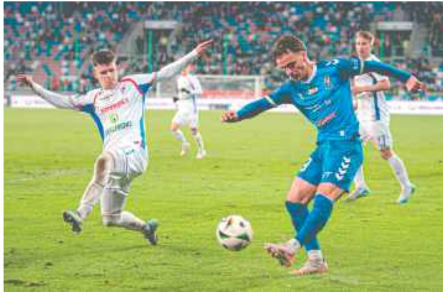
Pierwsze wyjazdowe zwycięstwo lubelskiego zespołu w tym sezonie

Do przerwy w Zabrzu nie padły żadne gole, a spotkanie nie