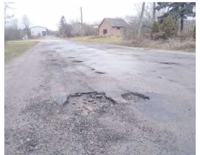
Tak droga w Idalinie wyglądała w lutym 2022 roku