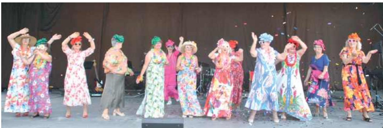
Scena tętniła życiem. Seniorki z Opolu Lubelskiego zaprezentowały kolorowy pokaz mody