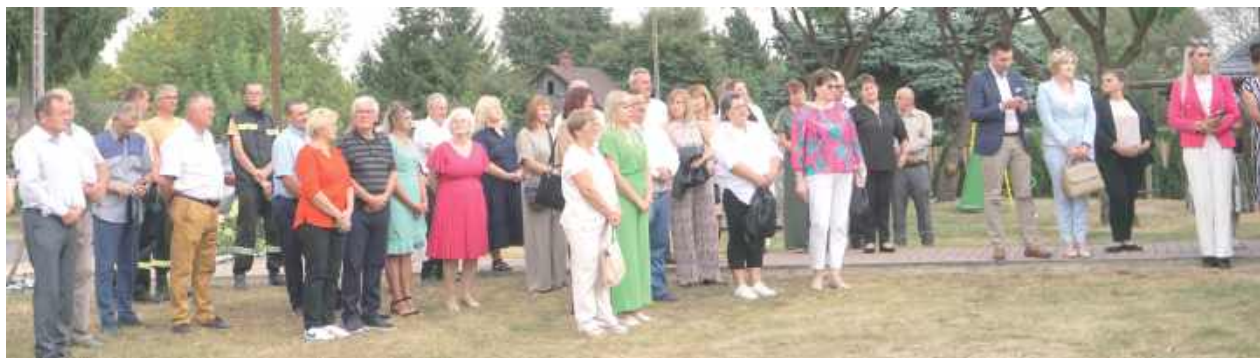
Na ten dzień czekali ponad 40 lat. Mieszkańcy licznie wzięli udział w piątkowym wydarzeniu