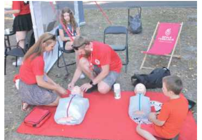
Na wydarzeniu nie brakowało stoisk tematycznych, które wzbudzały zainteresowanie nie tylko seniorów, ale i młodszych uczestników Senioraliów