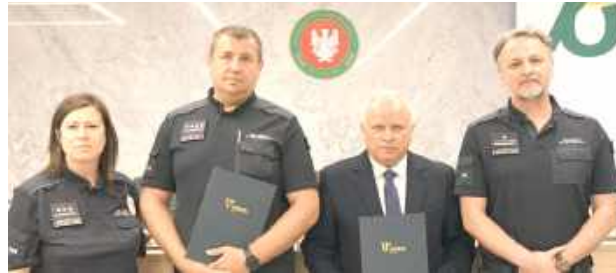
Umowa zakłada wspólne działania na rzecz edukacji, ekologii oraz resocjalizacji osób pozbawionych wolności

Umowa zakłada wspólne działania na rzecz edukacji,