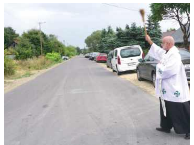
Nowa droga została także poświęcona

W piątek, 29 sierpnia odbyło się uroczyste otwarcie przebudowanego ciągu dróg powiatowych przebiegających przez miejscowości Prawno, Mazanów, Idalin oraz Chruślanek Józefowskie.