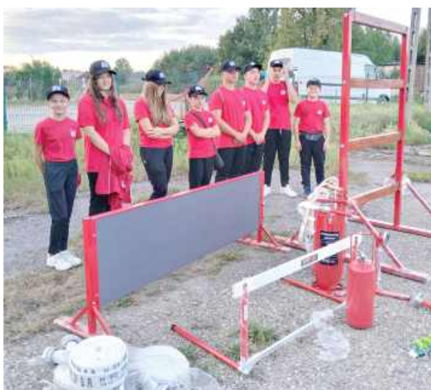
Na liście jednostek, które skorzystały z dofinansowania, znalazła się m.in. OSP Chruślanki Józefowskie

Środki zostały przeznaczone na wyposażenie drużyn, rozwijanie sprawności fizycznej młodzieży oraz przygotowanie ich członków do przyszłej służby w Ochotniczych Strażach Pożarnych. Program został zrealizowany w ramach otwartego konkursu ofert dla organizacji pozarządowych „Lubelskie wspiera Młodzieżowe Drużyny Pożarnicze” ogłoszonego przez Zarząd Województwa Lubelskiego.