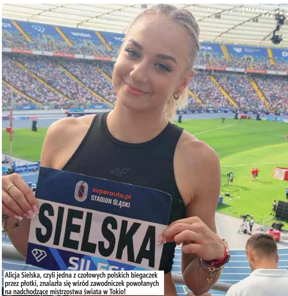
Alicja Sielska, czyli jedna z czołowych polskich biegaczek przez płotki, znalazła się wśród zawodniczek powołanych na nadchodzące mistrzostwa świata w Tokio!

Alicja Sielska po raz kolejny udowodniła swoją formę, osiągając znakomity wynik w biegu na 100 metrów przez płotki w Stalowej Woli. Pomimo niekorzystnych warunków atmosferycznych - wiatru o prędkości -2,3 m/s - Polka ustanowiła swój nowy rekord