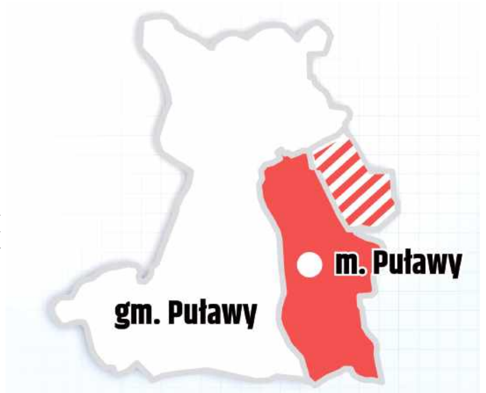
Prezydent Puław proponuje dołączenie do miasta znacznej części gm. Puławy

Zaznaczyła, że rozumie stanowisko mieszkańców i władz gminy, jednak jej zdaniem istotniejsze są sprawy miasta i jego