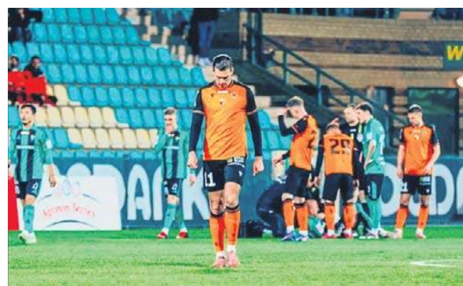
Chrobry miał dużą przewagę, ale nie miał skuteczności

28. kolejka Betclit 1 ligi przyniosła co najmniej kilka niespodzianek. Jedną z największych była wyjazdowa porażka walczącego o bezpośredni awans Chrobrego Głogów z despe-