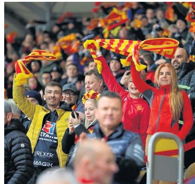
Kibice Sparty jak zwykle nie zawiedli. Spotkanie z Falubazem oglądał komplet 13 675 widzów