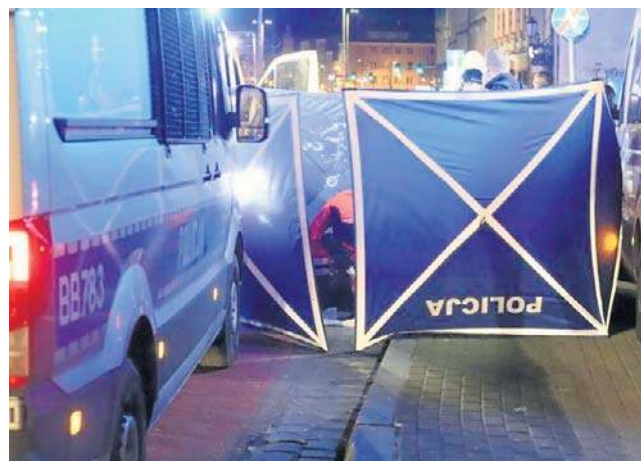
579 rannych i 10 zabitych to bilans 2025 roku we Wrocławiu. Na zdj.: potrącenie pieszego na ul. Kazimierza Wielkiego