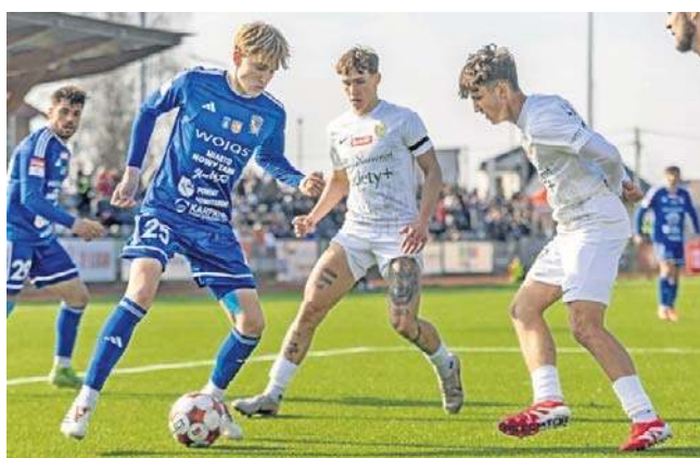
Śląsk w tabeli zbliżył się do miejsc dających grę w barażach