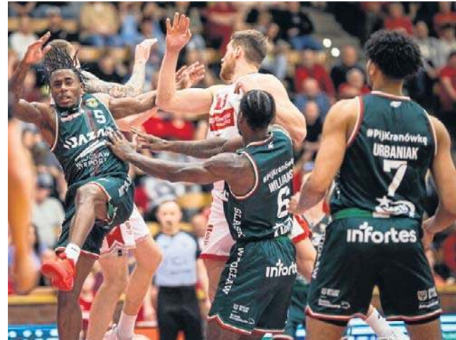
Gospodarze od początku narzucili twarde warunki

Wczoraj Górnik Zamek Książ Wałbrzych przegrał z Legią Warszawa 68:93. W stołecznej drużynie aż pięciu koszykarzy zakończyło spotkanie z dwucyfrową liczbą punktów. ©