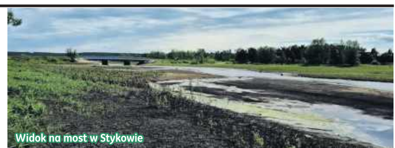
Widok na most w Stykowie

Dzień dobry, poniżej informacja... Na Zbiorniku Wodnym Brody Iłżeckie realizujemy roboty budowlane w ramach zadania inwestycyjnego: „Przebudowa jazów ZW Brody Iłżeckie wraz