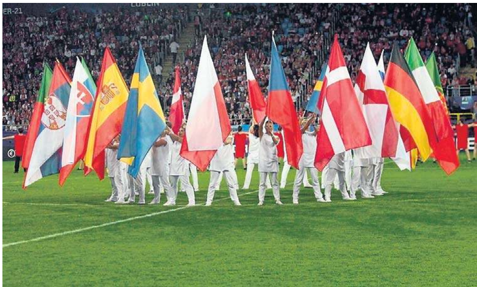
Reprezentacja, ale do lat 21, po raz ostatni na Arenie grała we wrześniu 2021 roku

- Mało ludzi w to wierzyło, że uda nam się zapewnić stadion, ale ja wierzyłem od początku. Determinacja i współpraca z różnymi instytucjami sprawiły, że tak się stało. Dużo biletów przekazaliśmy dla dzieci, młodzieży, szkół, bo tak naprawdę ten mecz jest dla nich. Niech piłka nożna będzie ich pasją. Apeluję do tych