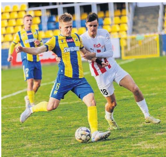
W Wielką Sobotę (4 kwietnia, godz. 15), w hicie kolejki Avia Świdnik zmierzy się u siebie z Chełmianką

Chełmianka w ślad za Avią Dwa oczka straty do Świdniczki ma trzecia Chełmianka (15-6-3 - taki sam bilans ma drugi KSZO 1929 Ostrowiec Świętokrzyski), która w der-