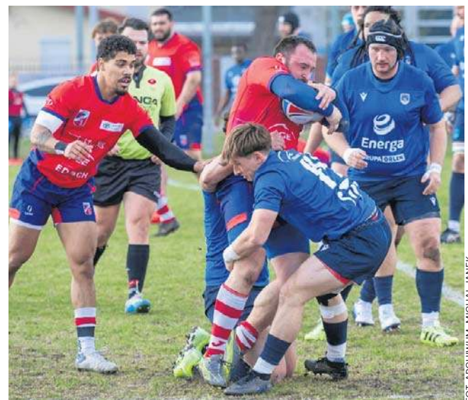
W ciągu tygodnia Budowlani dwa razy ulegli Ogniu