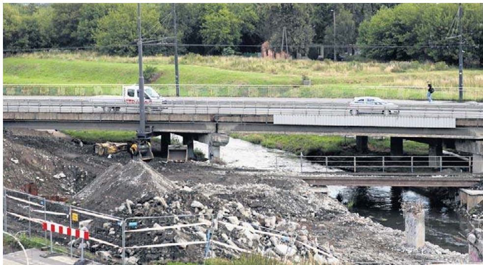
Lada dzień pojawią się tu wielkogabarytowe elementy nowego mostu

Zmiany w organizacji ruchu są bezpośrednio związane z realizacją jednego z najważniejszych etapów inwestycji mostowej. - Dostawa wielkogabarytowych elementów prefabryko-