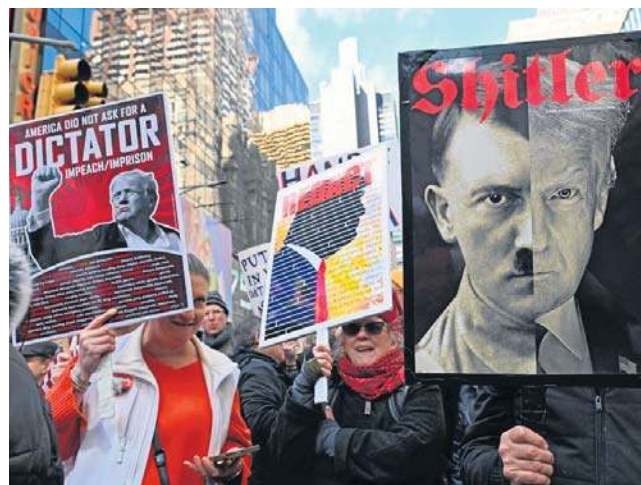
Przeciwnicy Trumpa wyszli na ulice m.in. Nowego Jorku (na zdjęciu), Chicago i Houston. Ale demonstracje odbywały się także w wielu mniejszych miejscowościach

Główna sobotnia demonstracja odbyła się w Minneapolis, miejscu kontrowersyjnej operacji służb imigracyjnych, gdzie z rąk funkcjonariuszy zginęło dwoje demonstrantów. Na scenie przed gmachem stanowego parlamentu przemawiali m.in. gubernator stanu Tim Walz, senator Bernie Sanders. Wystąpili też Bruce Springsteen, który napisał piosenkę o wydarzeniach z Minneapolis, oraz Joan Baez. - Kiedy aspirujący dyktator w Białym Domu wysłał swoich niewykształconych, agresywnych bandytów, by wyrządzili szkody w Minnesocie, to ty, Minnesota, stanęłaś w obronie swoich sąsiadów, stanęłaś w obronie przyzwoitości, stanęłaś w obronie życzliwości - mówił Walz, nazywając