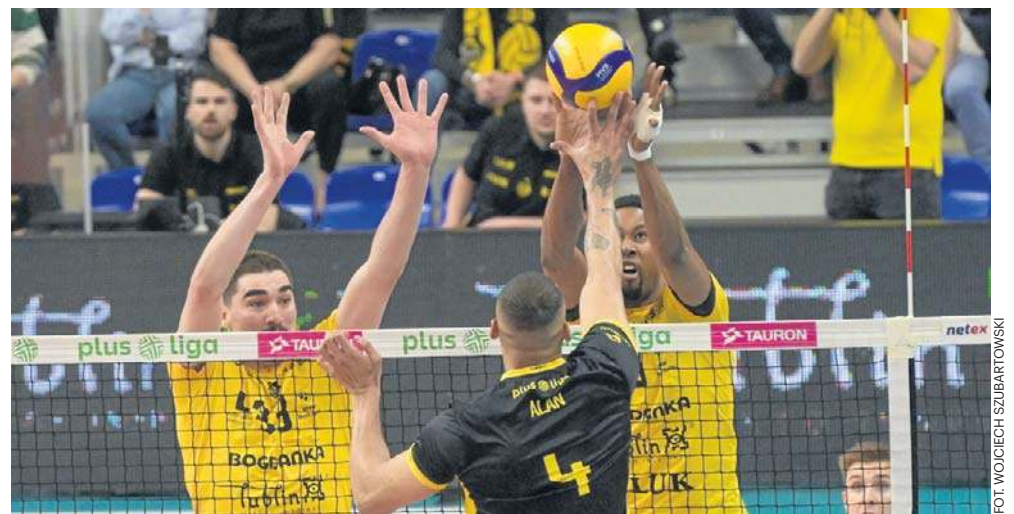
Lubelscy siatkarze wykonali pierwszy z dwóch kroków, aby znaleźć się w strefie medalowej. Zanim rewanż w PlusLidze, to czeka ich rewanż w 1/4 finału Ligi Mistrzów

- Bardzo dobrze w ataku grałimy i ten atak na pewno w końcówkach poszczególnych setów przeważał na naszą stronę. Potrafiliśmy atakować po dobrym przyjęciu, w kontrze, kiedy mieliśmy okazję, żeby przełamać przeciwnika -