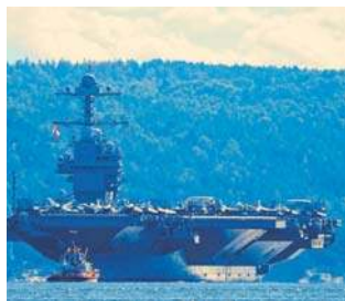
Lotniskowiec USS Gerald R. Ford to największy okręt wojenny, jaki kiedykolwiek zbudowano