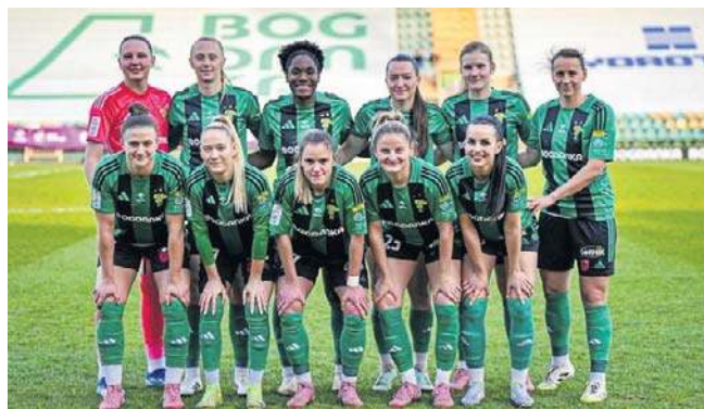
Do końca sezonu sześć kolejek. Górnik ma 11 pkt. więcej niż czwarty GKS Katowice, który rozegrał dwa mecze mniej