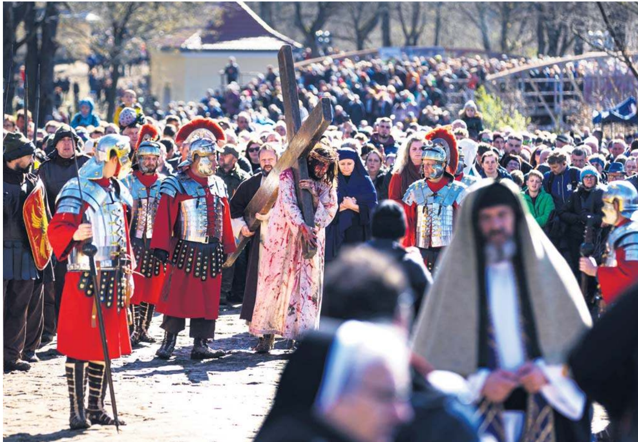
W Kalwarii Zebrzydowskiej w Wielkim Tygodniu odbywa się Misterium Męki Pańskiej z licznym udziałem wiernych

Sanktuarium pasyjno-maryjne w Kalwarii Zebrzydow-