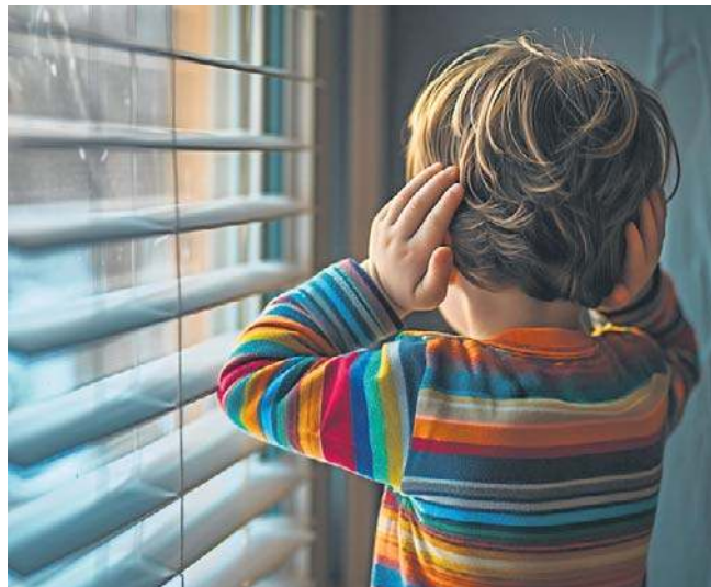
Hałas występujący w naszym środowisku działa niczym smog. Otacza nas z każdej strony

To, że śpimy, nie oznacza, że mózg przestaje odbierać bodźce. Hałas może zaburzać fazy snu - skracać je albo powodować mikroprzebudzenia. Człowiek może się rano czuć zmęczony, choć nie wie dlaczego. A brak dobrej jakości snu jest z kolei powiązany z wieloma problemami zdrowotnymi: od zaburzeń koncentracji po depresję.