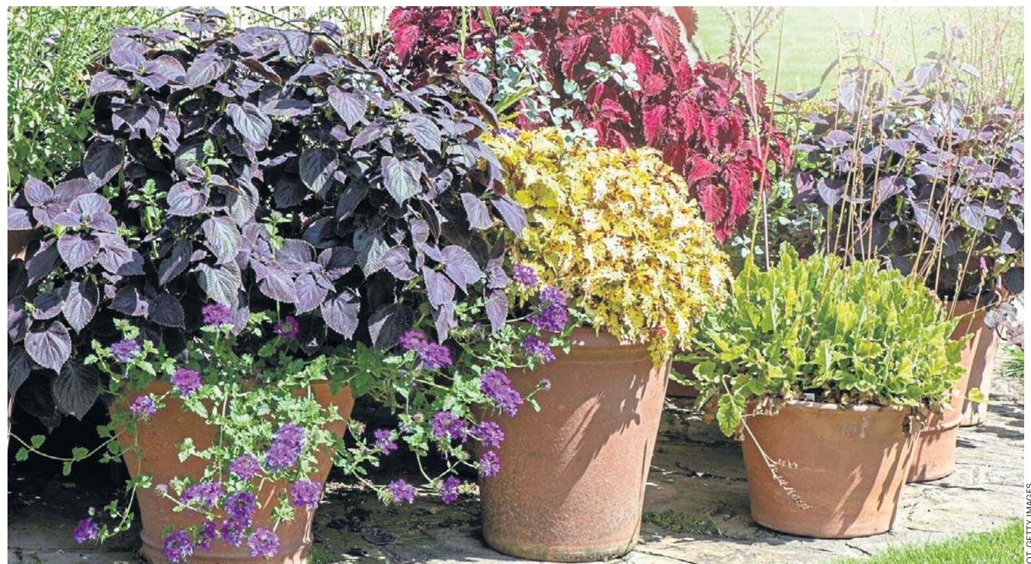
Liście żurawki są zielone, purpurowe, pomarańczowo-czerwone lub srebrzyście nabiegłe. Różnią się wielkością, kształtem i typem blaszki