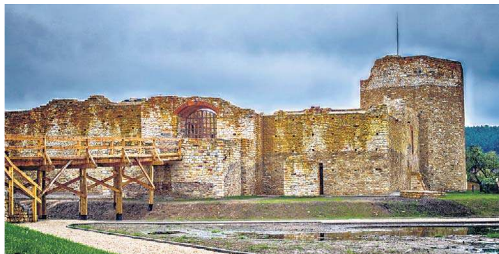
Obronny zamek w Inowłodzu był jedną z blisko pięćdziesięciu murowanych warowni zbudowanych za życia i panowania króla Kazimierza Wielkiego