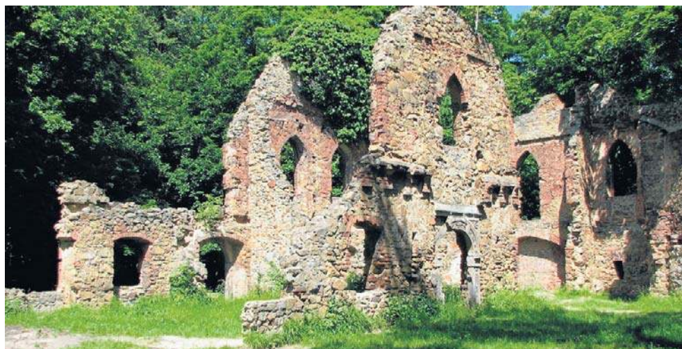
Zamek Stary Książ położony jest w Książańskim Parku Krajobrazowym na wzniesieniu nad rzeką Pełcznica. Od sławnego Zamku Książ dzieli go zaledwie kilkaset metrów