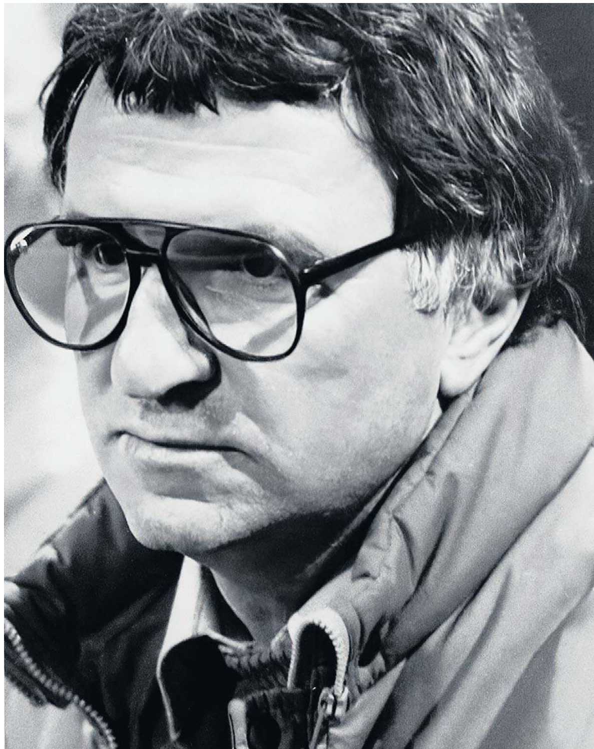
Przed 44 laty trener Piechniczek doprowadził polską drużynę do 3. miejsca na mistrzostwach świata w Hiszpanii