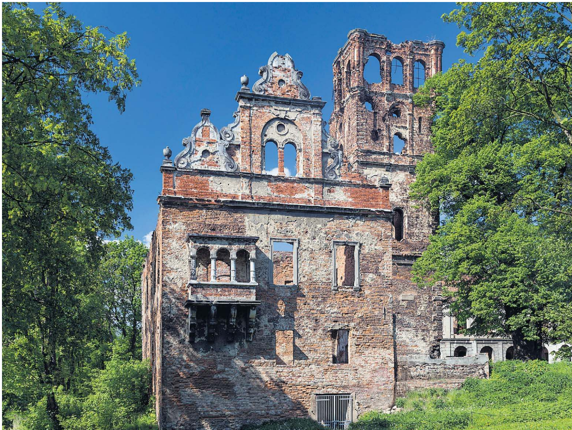
Zamek w Tworkowie powstał w XVI wieku – prawdopodobnie na fundamentach średniowiecznego zamku warownego

● Stary Książ – w cieniu dolnośląskiego giganta ● Żmigród – ruiny z wieżą widokową ● Korzkiew – zamek na Szlaku Orlich Gniazd ● Radziki Duże – zapomniane ruiny rycerskiej siedziby ● Goszcz – dolnośląski Wersal ● Tworków – śląska ruina z nowym życiem ● Inowłódz – królewska ruina z duszą