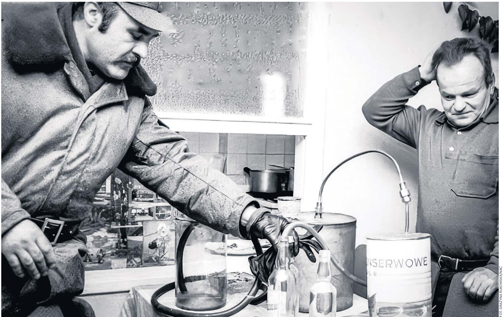
Milicjant z Nadarzynia przy skonfiskowanej aparaturze do produkcji bimbrowa. 1974 rok

● Bimber bardzo mocno wrósł w polską kulturę ● W czasie zaborów – ale też w latach PRL – jego pędzenie było przejawem buntu wobec władz ● Produkcja bimbrowa jest tak popularna, że wykształciły się silne regionalizmy w tej dziedzinie