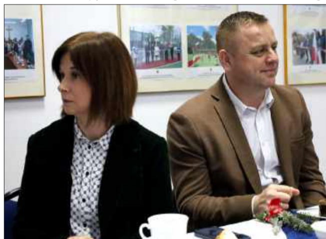
Nie zabrakło życzeń i serdeczności.