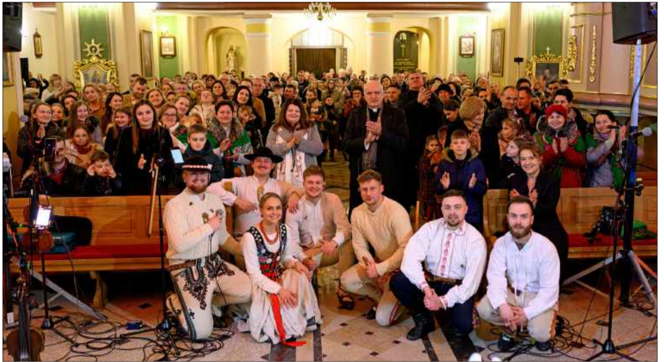
Również w kościele w Dzikowcu nie zabrakło licznej widowni.