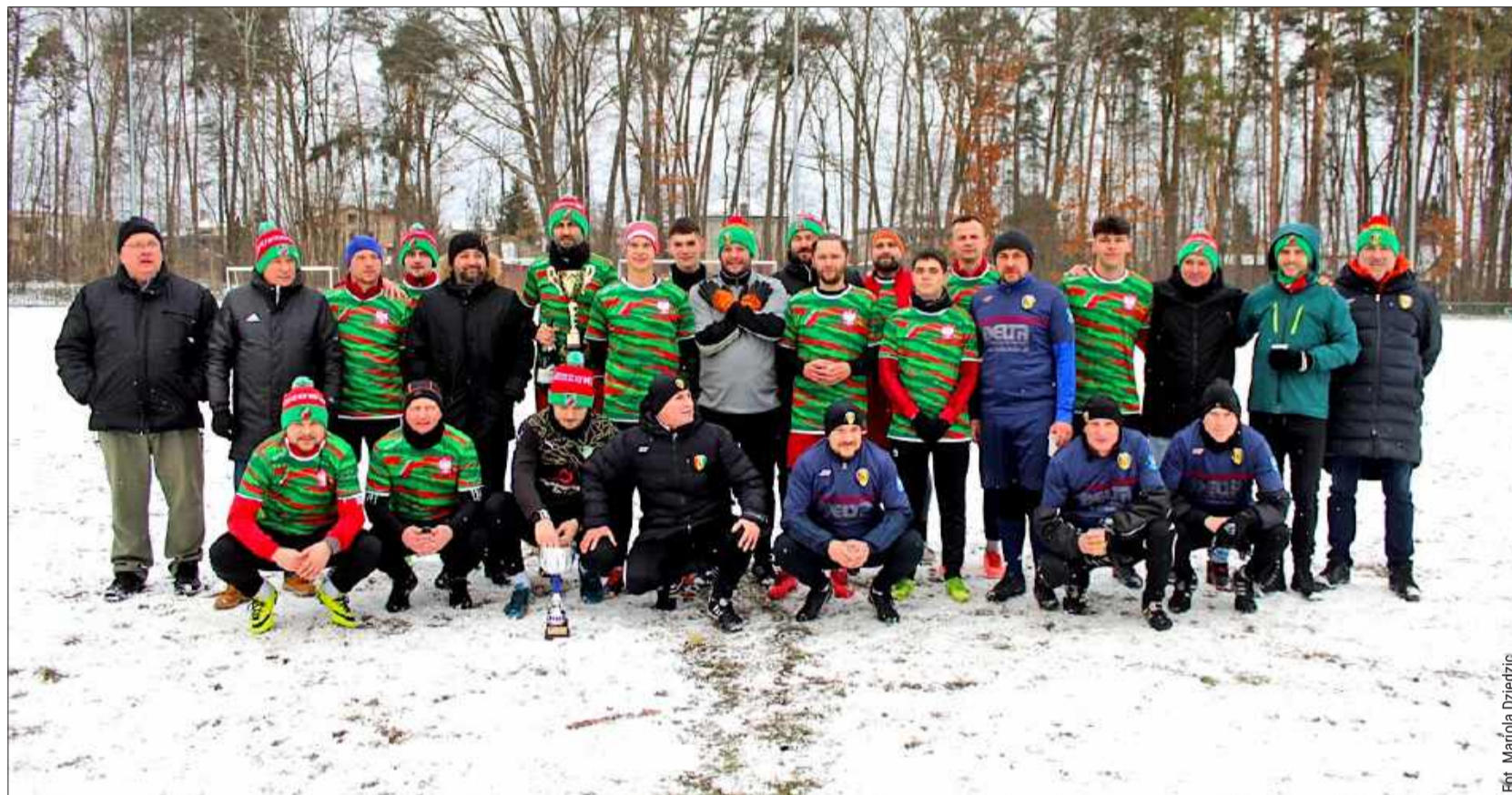
Mecz Noworoczny rozegrano już po raz trzydziesty.