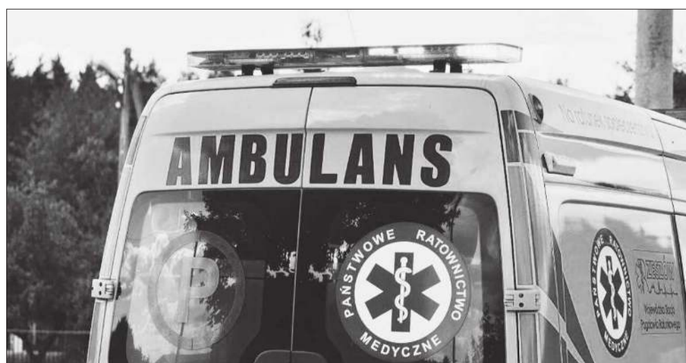
Ciało napotkał klient sklepu.

To kolejny sygnał, jak nieprzewidywalne mogą być sytuacje, do których dochodzi w przestrzeni publicznej. Policja apeluje, by w przypadku zauważenia osób wymagających pomocy niezwłocznie reagować i wzywać służby ratunkowe. red.