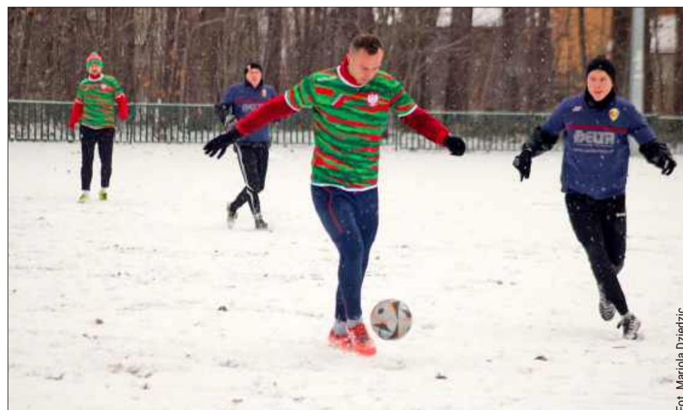
Zimowa aura nie odstraszyła zawodników