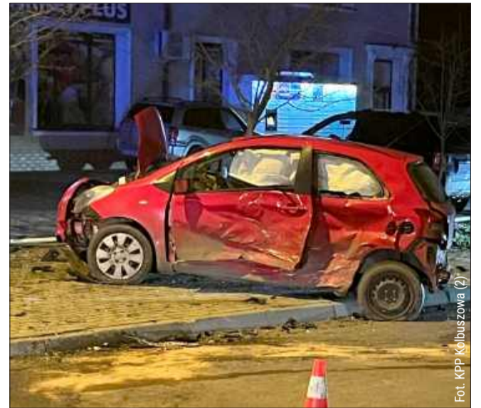
ZARĘBKI. Kierująca toyotą wymusiła pierwszeństwo.

Z kolei w poniedziałek, 29 grudnia, strażacy zostali powiadomieni o zdarzeniu w Kłapówce, które zostało zgłoszone przez system e-call. Zgłoszenie okazało się fałszywe – w samochodzie, który znajdował się na poboczu drogi, załączył się system SOS. Funkcjonariusze nie znaleźli żadnego wypadku, a pojazd znajdował się na lawecie.