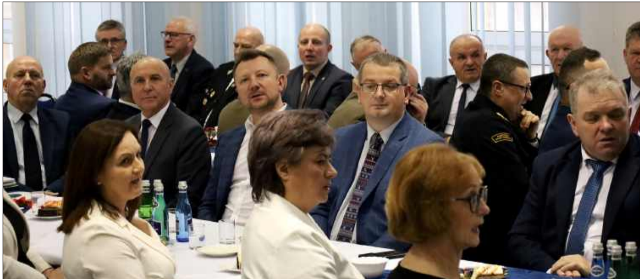
Radni i zaproszeni goście zasiedli do wspólnego stołu.