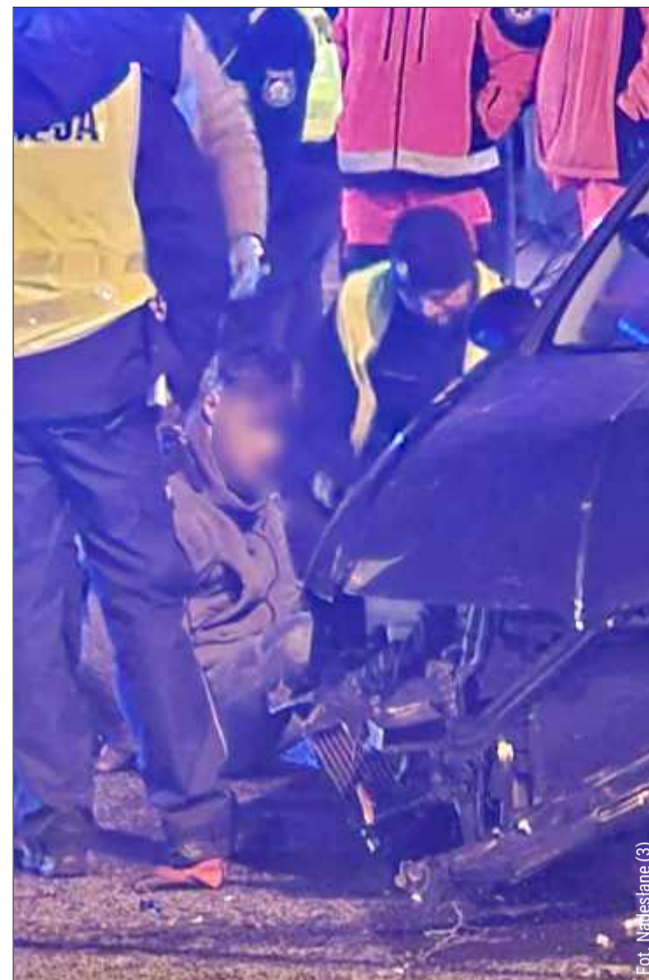
27-latek był pod wpływem alkoholu.