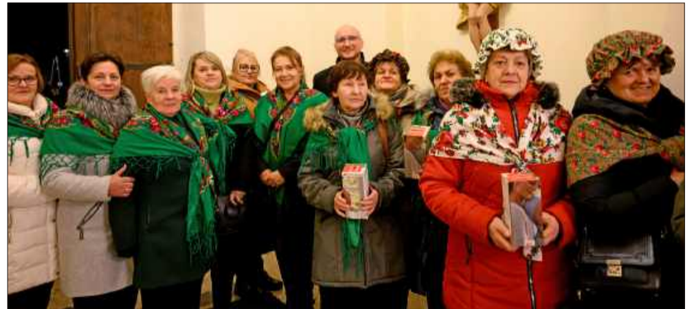
Niezawodne gospodynie zajęły się zbiórką do puszek.