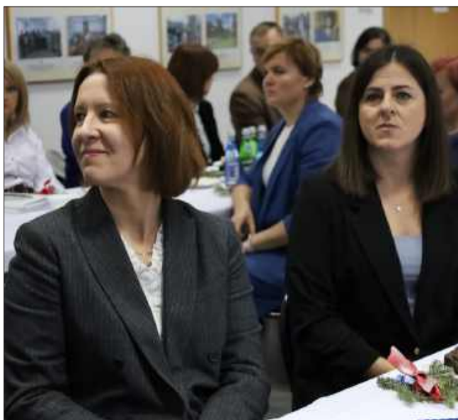
Humory tego dnia dopisywały.