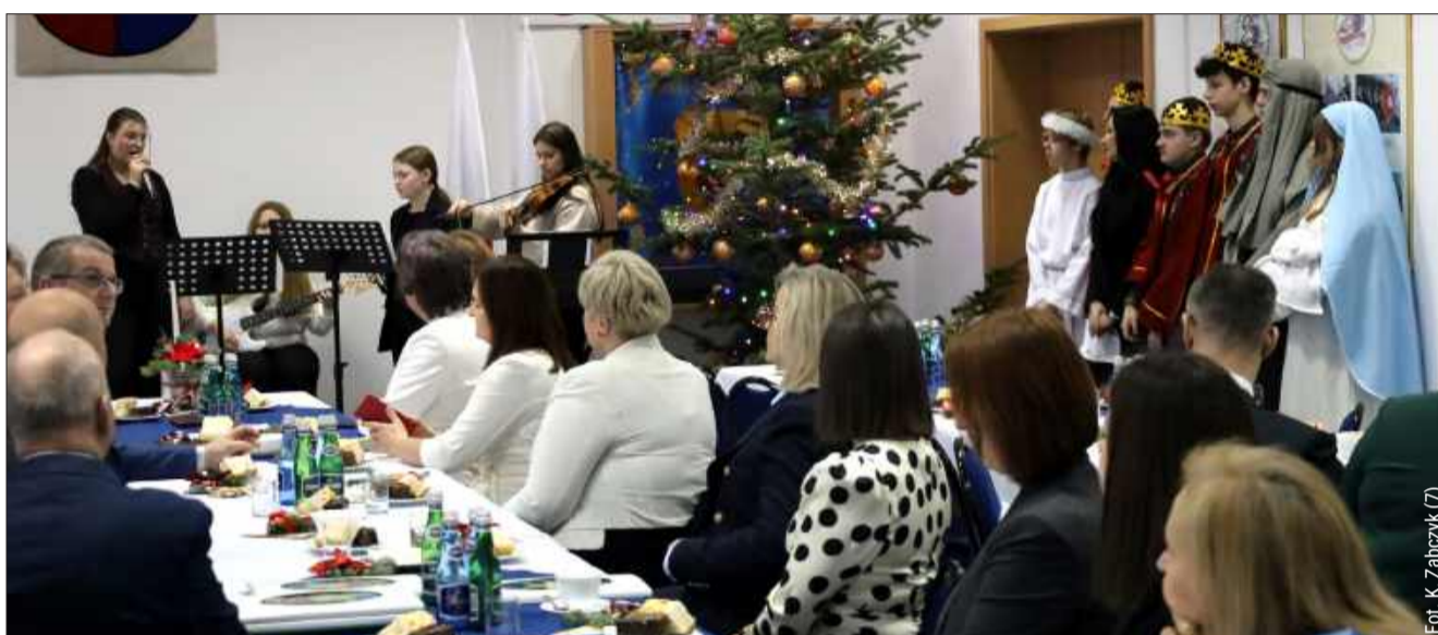
Uczniowie przygotowali na tę okazję jasełka.