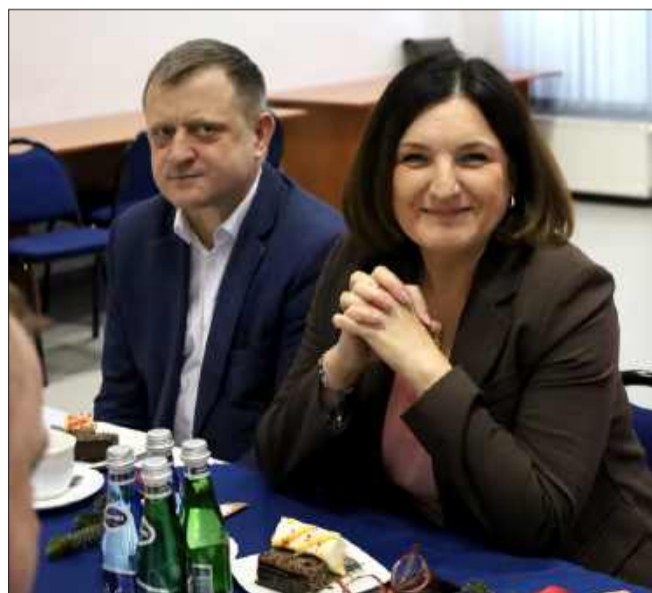
Zebrany towarzyszyła świąteczna atmosfera.