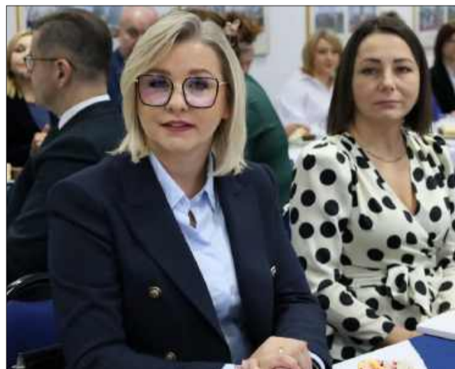
Sesja opłatkowa to podniosłe wydarzenie.