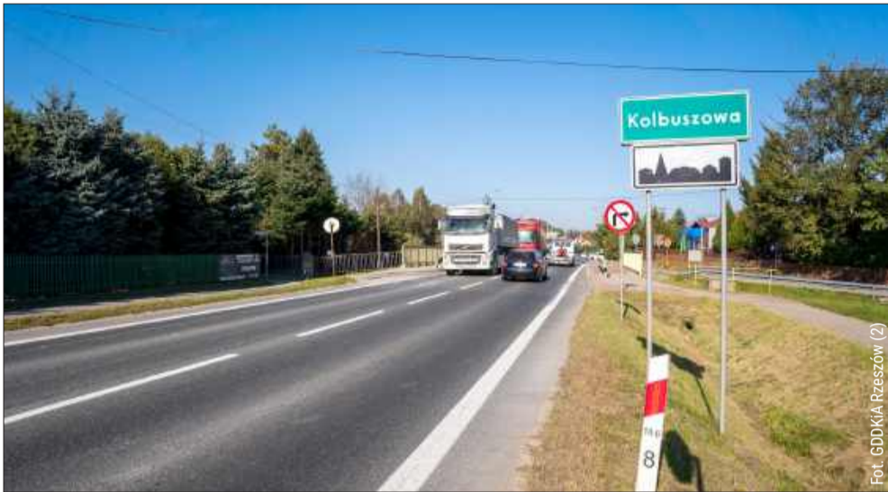
Zatwierdzono kluczową decyzję środowiskową.