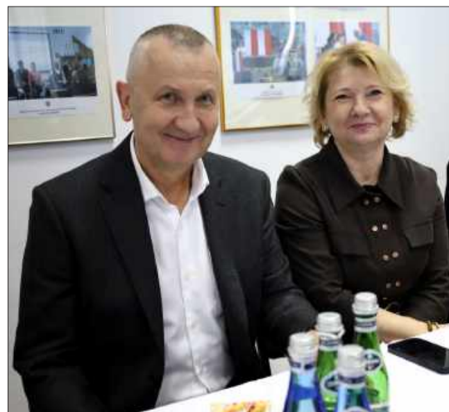
Obecni byli także przedstawiciele różnych instytucji.

Więcej zdjęć na stronie www.korsokolbuszowskie.pl