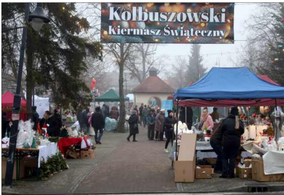
Jarmark w Kolbuszowej odbył się po raz pierwszy. Być może stanie się on tradycją w mieście nad Nilem.

Podczas jarmarku odbył się także Kolbuszowski Bieg Przebierańców. To wyjątkowe wydarzenie po raz kolejny połączyło pasję do biegania z atmosferą nadchodzących Świąt Bożego Narodzenia.