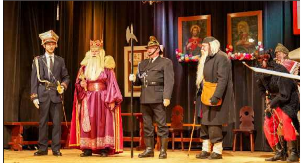
Barwne stroje i wyśmienita gra aktorska - tak było na tegorocznym przeglądzie.