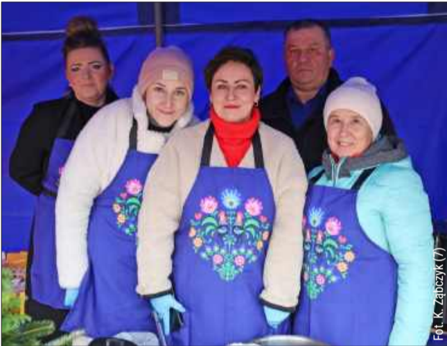
Fot. K. Ząbczyk (7)