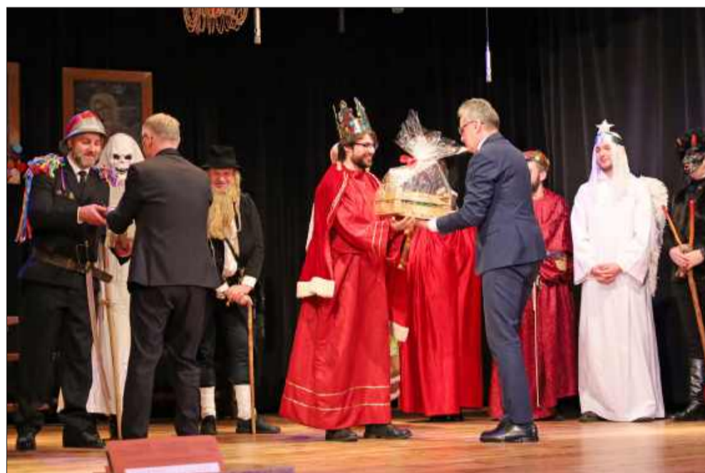
Podczas uroczystej sesji mogliśmy także podziwiać występ Zespołu Ludowego „Górnicy” z Kolbuszowej Górnej.

owaniu historii Kolbuszowej oraz całej Polski.