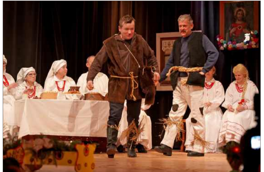
Tradycyjne kolędowanie i wyjątkowe występy można było podziwiać na scenie.