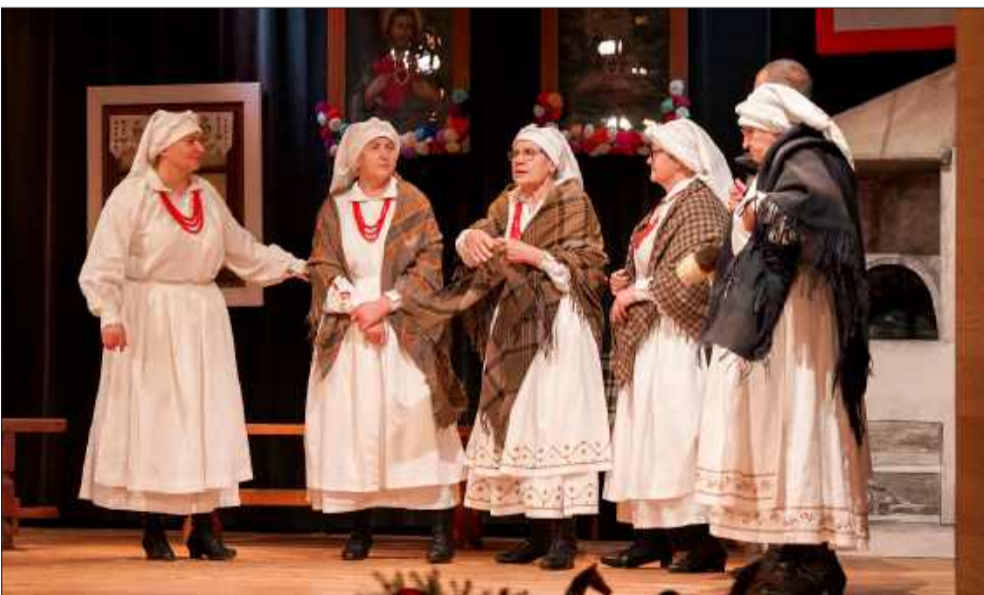
Na scenie zaprezentowały się także nasze rodzime zespoły.