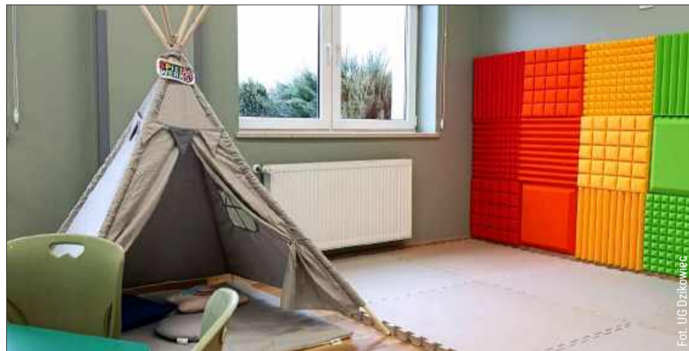
Tak prezentuje się nowa świetlica.