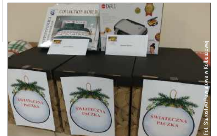
Paczki trafiły do potrzebujących rodzin.

- Serdecznie dziękujemy wszystkim pracownikom i radnym za zaangażowanie w tę piękną, świąteczną inicjatywę. Wierzymy, że ten gest dobroci pozwoli obdarowanym rodzinom choć na chwilę poczuć radość i odetchnąć od codziennych trosk - przekazali przedstawiciele starostwa. bp