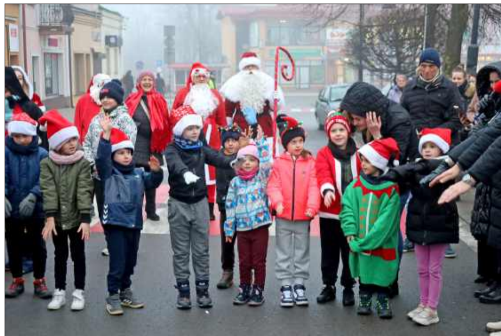
W biegu przebierańców wzięli udział zarówno najmłodszy, jak i starsi uczestnicy.