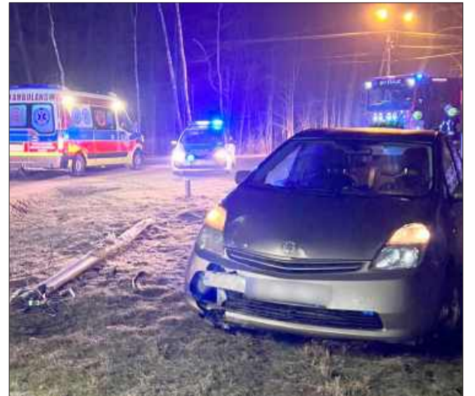
KŁAPÓWKA. Autem podróżowali amerykańscy żołnierze.