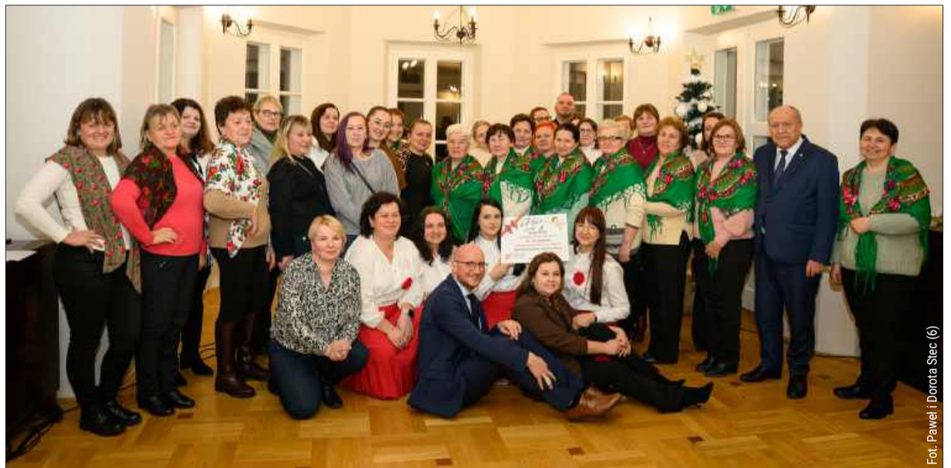
W dworcu Błotnickich wszyscy zaangażowani w akcję stanęli do wspólnego zdjęcia.