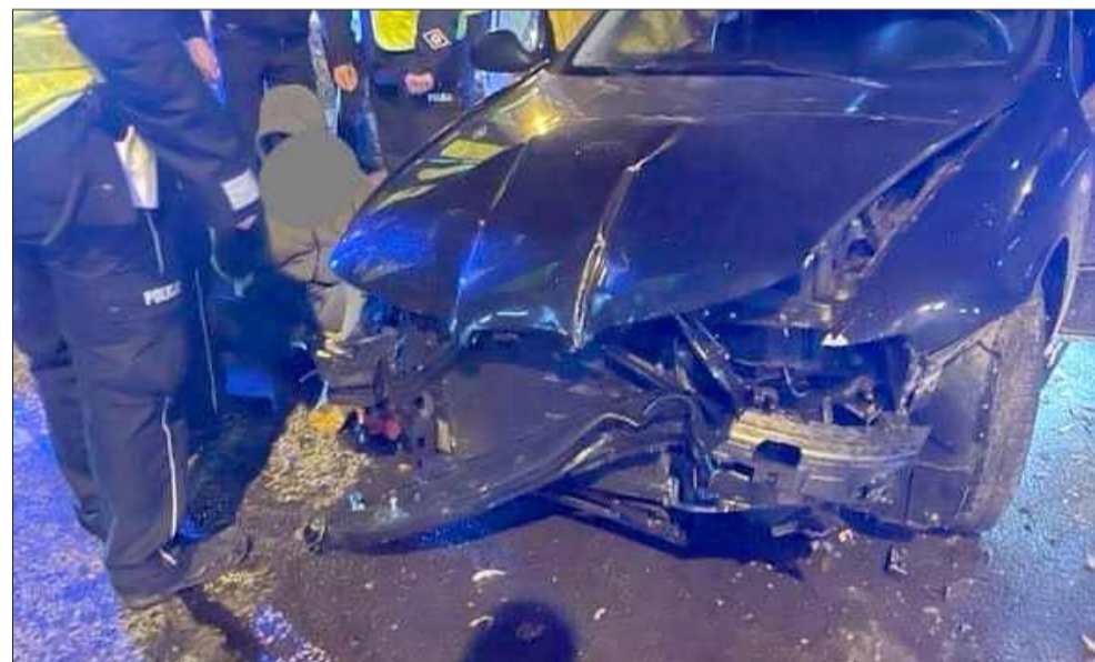
Tak wyglądał jego samochód po zatrzymaniu.