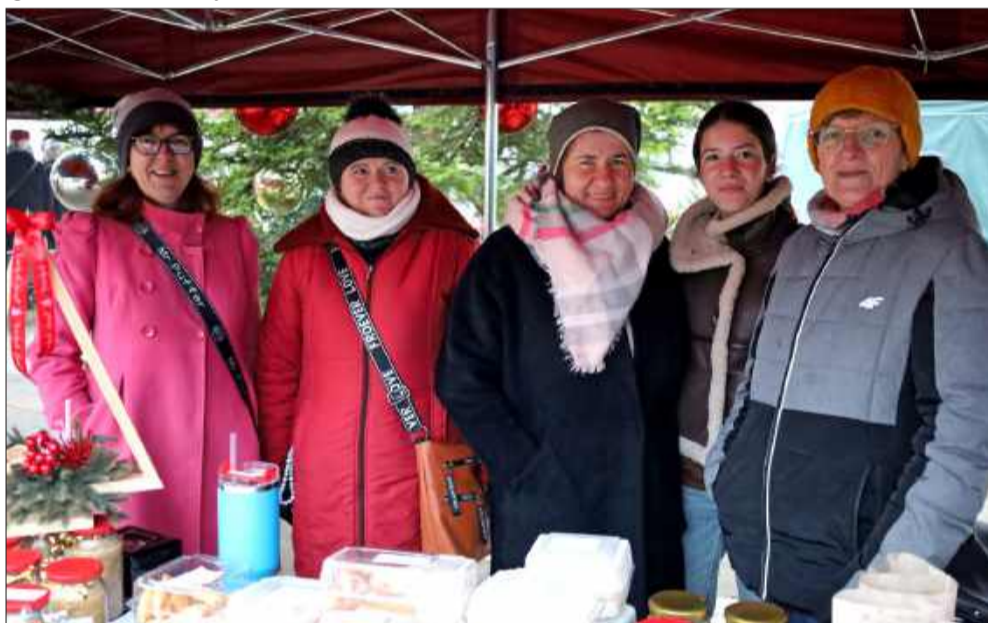
Nie zabrakło także mieszkańców z całego powiatu kolbuszowskiego.