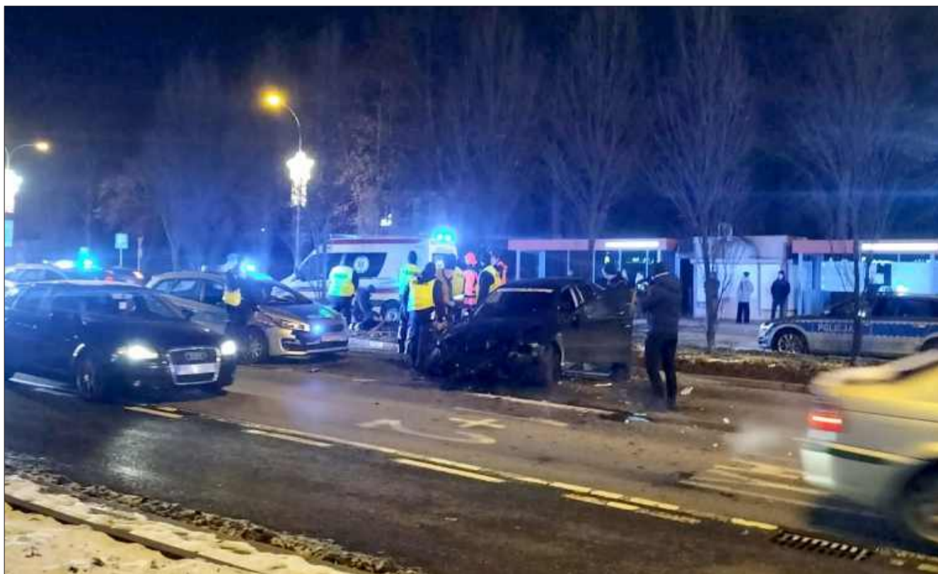
Pościg zaczął się w Kolbuszowej, a swój finał miał w Rzeszowie.

Pościg za pijanym kierowcą rozpoczął się w niedzielę (4 stycznia) w Kolbuszowej i zakończył na Marszałkowskiej w Rzeszowie. 27-latek, który najpierw stwarzał zagrożenie na drodze, a później wykazał się agresywnym zachowaniem podczas zatrzymania, trafił w ręce policji po szaleńczej ucieczce.