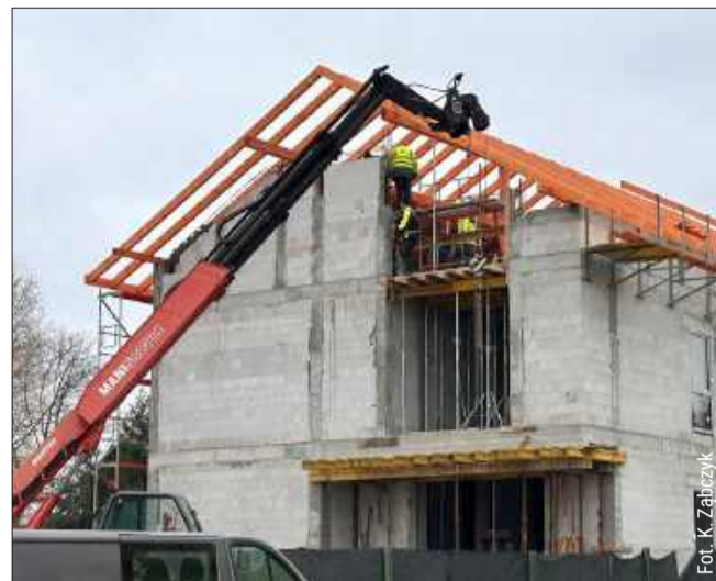
Końcem grudnia odwiedziliśmy plac budowy.