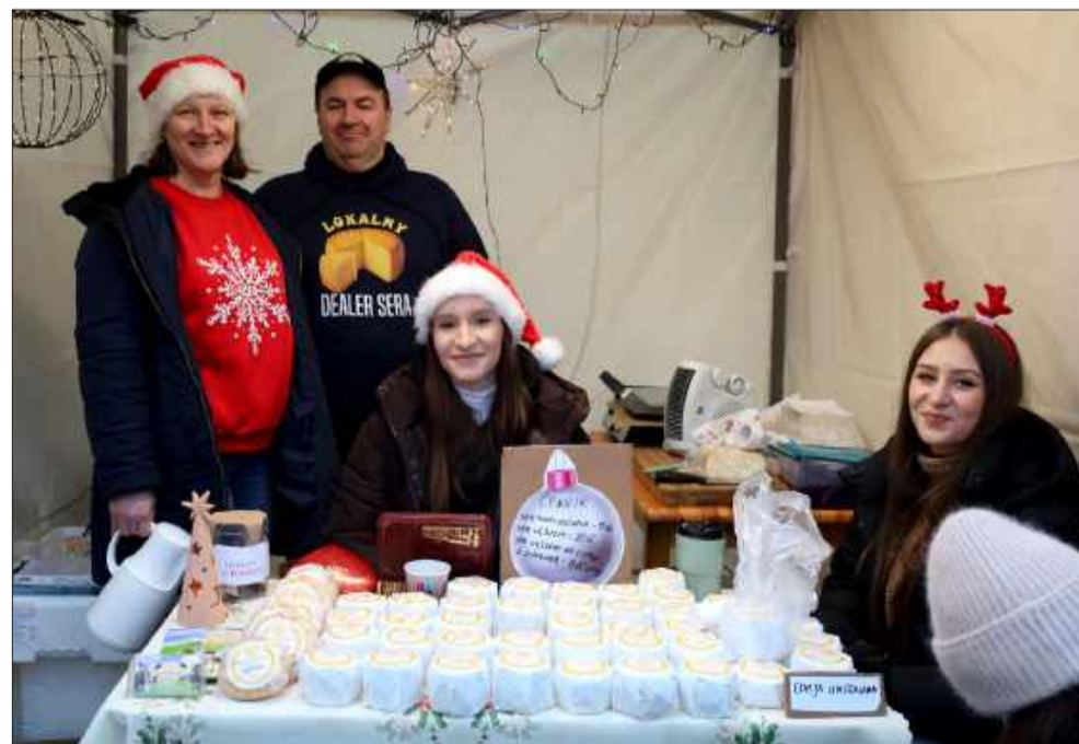
Wydarzenie było idealną okazją do zaprezentowania się lokalnych przedsiębiorców.