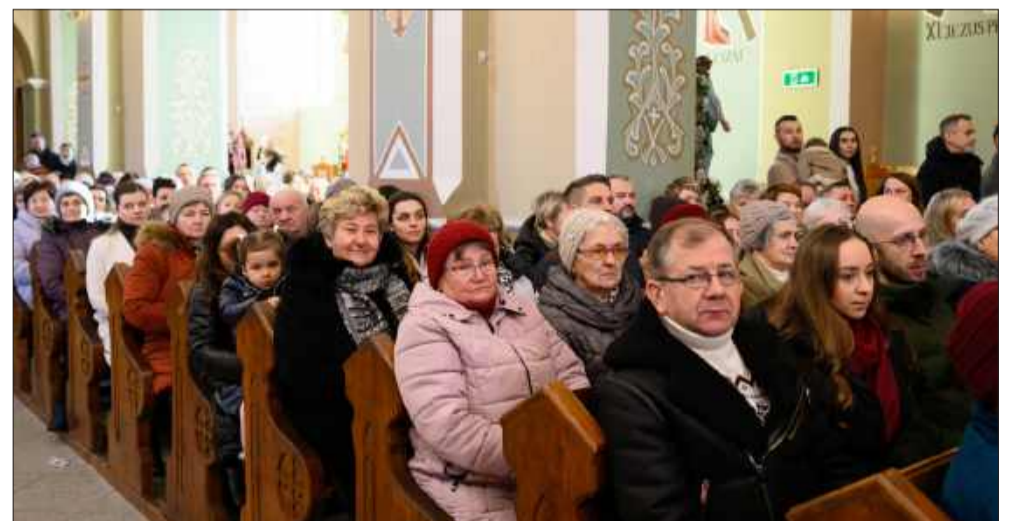
Mieszkańcy licznie przybyli posłuchać kolęd.