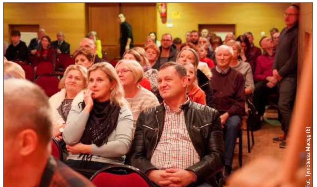
Co roku publiczność licznie gromadzi się w MDK, by podziwiać występy.