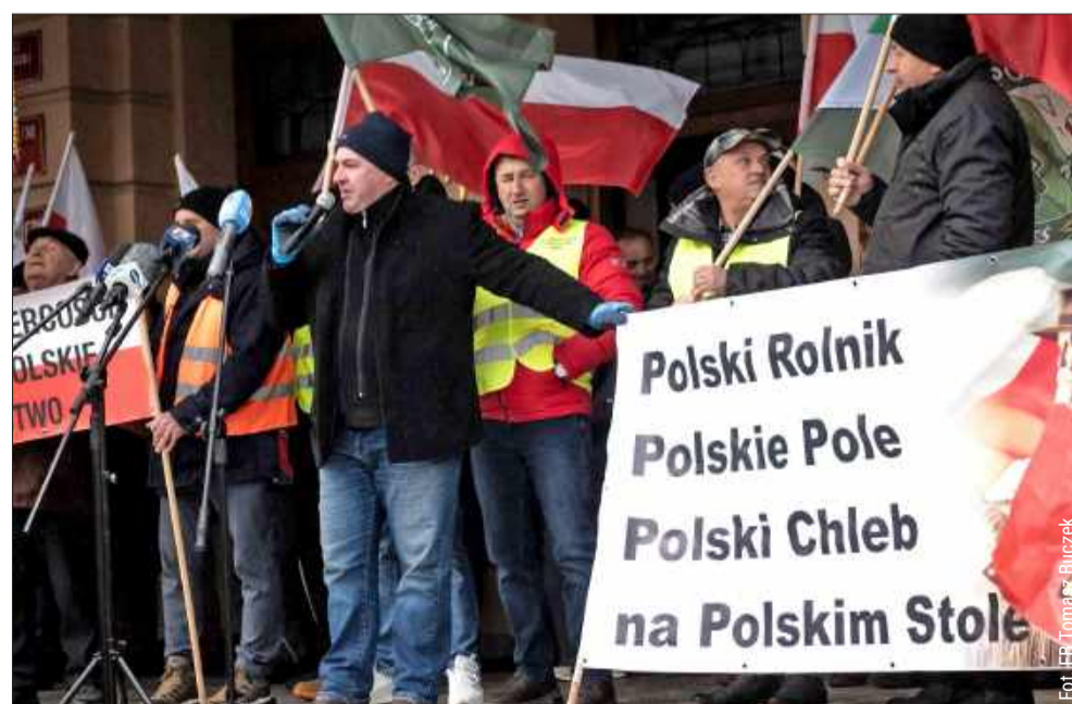
W proteście wzięli udział także rolnicy z powiatu kolbuszowskiego.