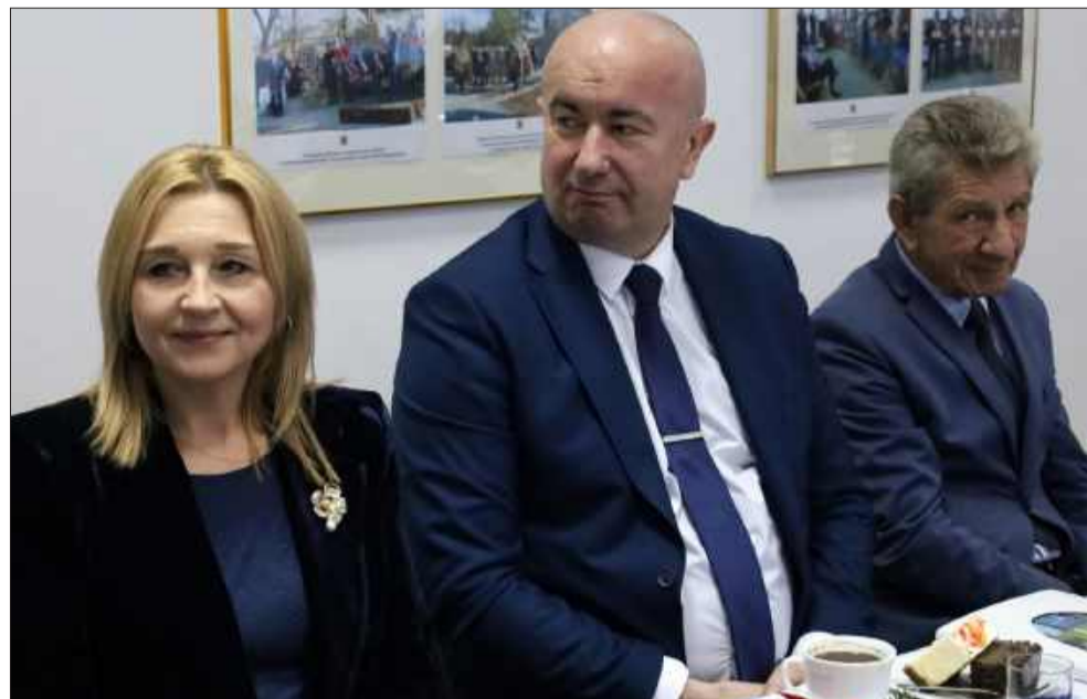
Zebrani połamali się tego dnia opłatkiem.

Po zakończeniu części formalnej, około godziny 11, obrady przeszły w część uroczystą. Radni, wóldarze gmin, przedstawiciele powiatu, kierownicy jednostek organizacyjnych oraz zaproszeni goście wysłuchali jasełek przygotowanych przez młodzież z kolbuszowskich szkół. Następnie wspólnie kolędowano, a tradycyjnym zwieńczeniem spotkania było łamanie się opłatkiem i składanie życzeń noworocznych. Kamil Ząbczyk