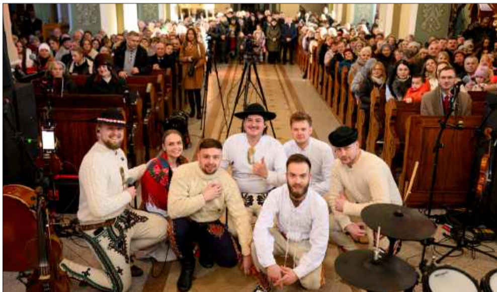
Kościół w Spiach pękał w szwach.