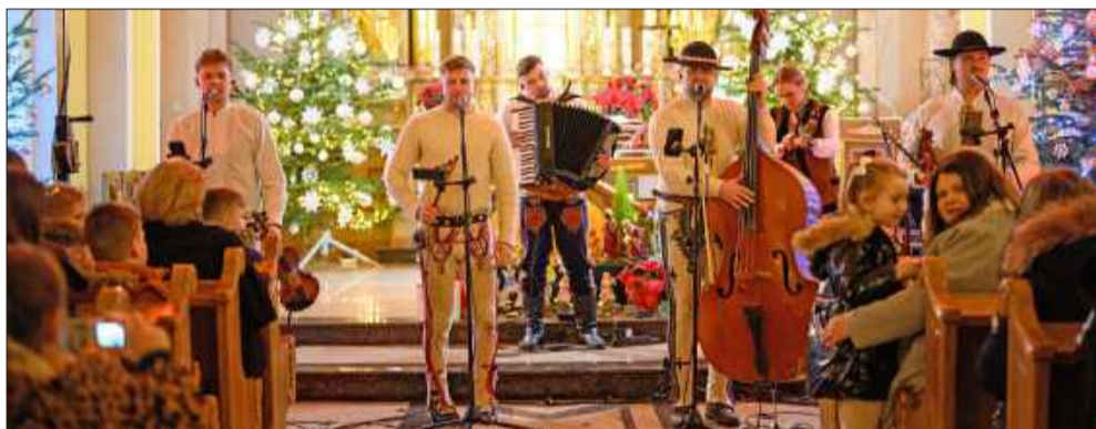
„Pogwizdani” zachwycili góralską energią.