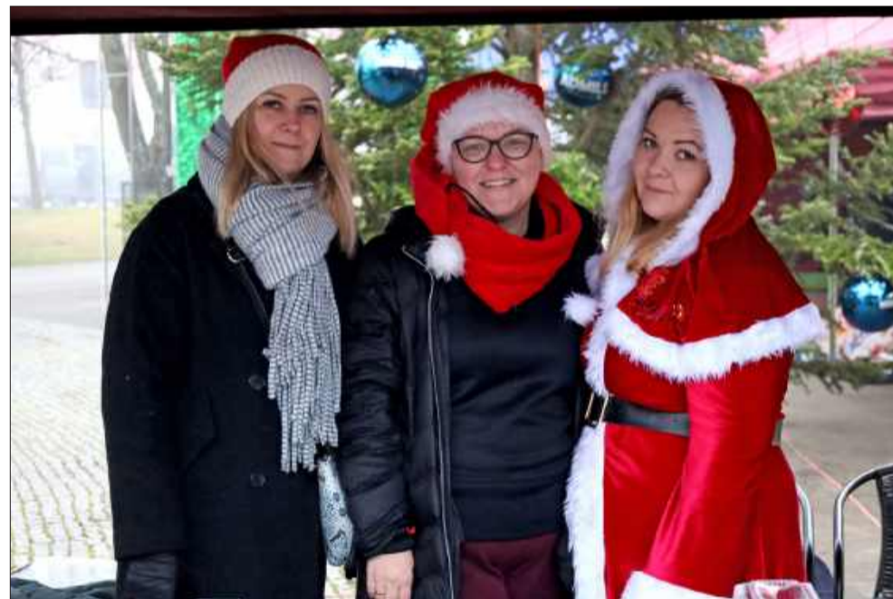
Świąteczny klimat udzielił się wszystkim.