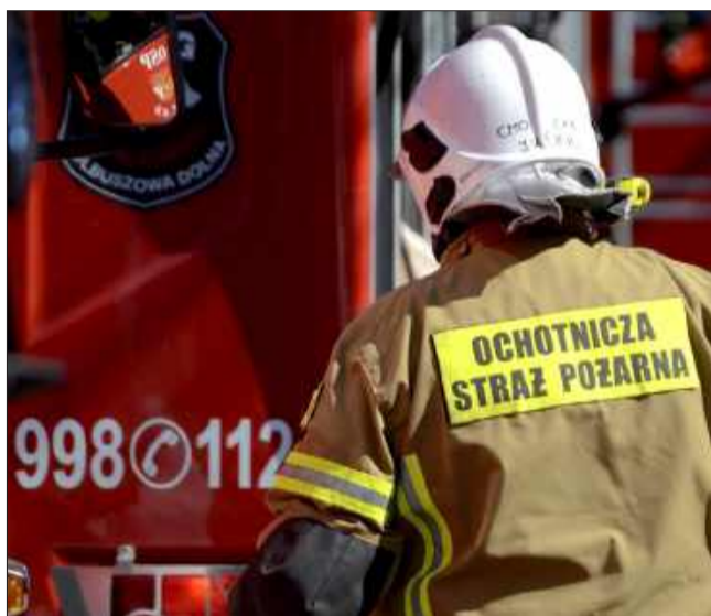
Ekspert mówi o drogim utrzymaniu małych jednostek OSP.

Druhowie są ważnym elementem życia społecznego. Oprócz zadań ratowniczych i przeciwpożarowych pełnią funkcje edukacyjne, integracyjne i kulturalne. Współpracują z parafiami, szkołami i organizacjami społecznymi, organizują wydarzenia i akcje charytatywne. Jak zauważają autorzy badań przywoływanych przez portalsamorządowy.pl, to właśnie ta wszechstronna działalność sprawa