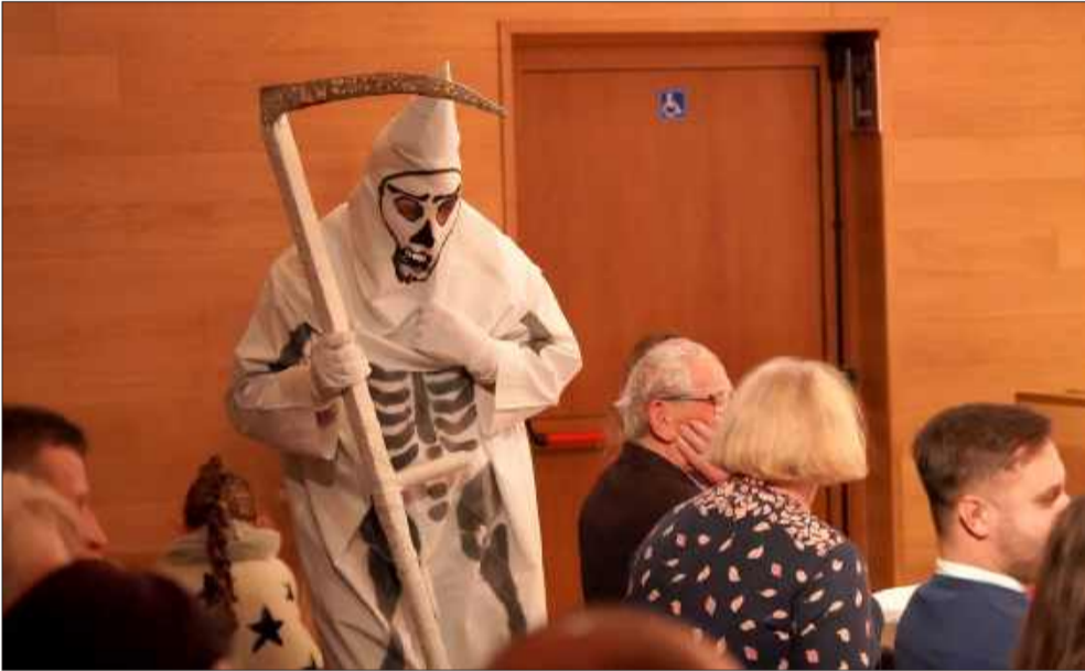
Przeegląd widowisk to tradycyjne przedstawienia związane ze świętami.