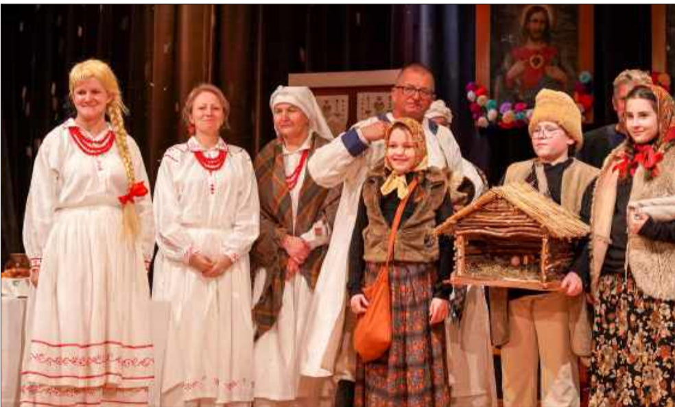
Przeegląd to wyjątkowe wydarzenie.