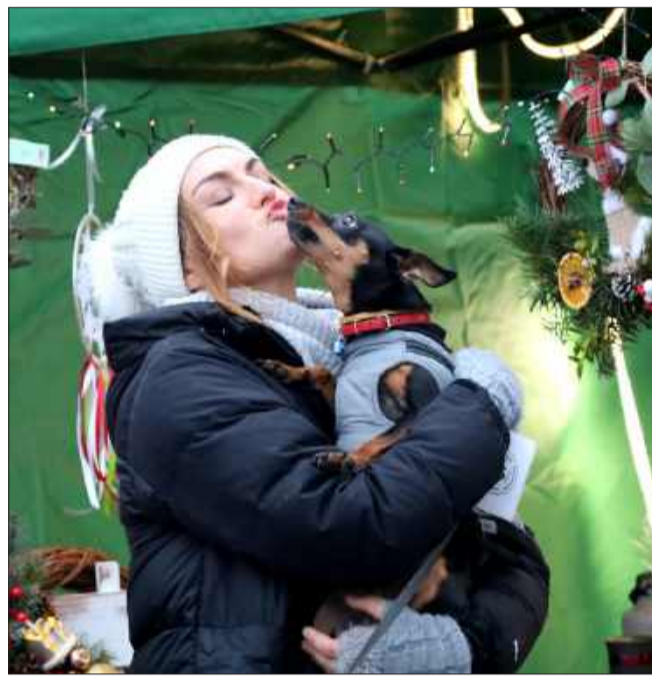
Podczas jarmarku swoje stoisko miało także stowarzyszenie Łapka w Łapkę, działające na rzecz kolbuszowskiego schroniska.

Wielką atrakcją były także występy artystyczne, które odbywały się na scenie. Lokalni artyści i zespoły muzyczne zadbali o świąteczny nastrój, prezentując świąteczne piosenki i kolędy, które zbliżyły wszystkich do wyjątkowego czasu Bożego Narodzenia.