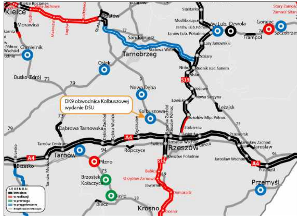
Jest zielone światło dla obwodnicy Kolbuszowej. Co oznacza nowa decyzja?