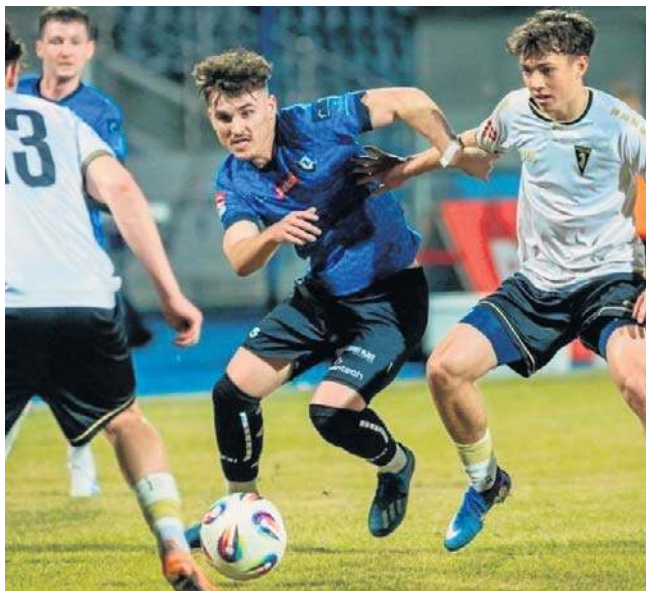
Zawisza rozegra aż siedem spotkań w trzy tygodnie

Już w środę (25 marca) Zawisza w 1/8 finału Pucharu Polski Kujawsko-Pomorskiego Związku Piłki Nożnej zagra w Gębicach z Notecią, wiceliderem V ligi (grupa II). Trzy dni później drużyna w lidze podejmować będzie Unię Swarzędz. 1 kwietnia niebiesko-czarnych czeka zaległy mecz z rundy jesiennej w Tuchowie z Tuchowią, a po kolejnych trzech dniach pojedają do Nowych Skalmierzyc na spotkanie z Pogonią. 8 kwietnia na mecz 1/2 finału STS Pucharu Polski do Bydgoszczy przyjedzie Górnik Zabrze, a w weekend 11/12 - na zakończenie maratonu - Zawisza zmierzy się w delegacji z Wybrzeżem Rewalskim Rewal. Aż 5 z 7 spotkań drużyna rozegra na wyjazdach.