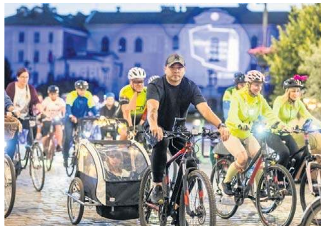
Projekt Rowerowa Stolica Polski z każdym rokiem zyskuje na popularności. W tym roku padnie kolejny rekord?