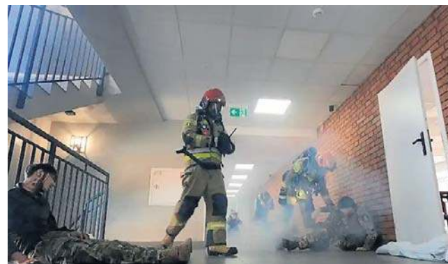
Szkolenia prowadzone były ze specjalistami i oficerami oddziału kontrterrorystycznego policji i ABW

Ćwiczenie, które zostało przeprowadzone w połowie ubiegłego tygodnia (18 marca), nosi długą nazwę: „Bezpieczeństwo placówek oświatowych w obliczu współczes-