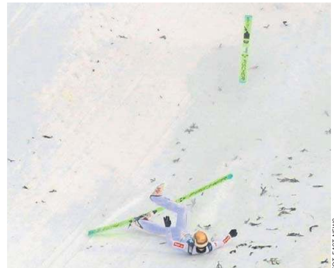
Kacper Tomasiak w kwalifikacjach przy lądowaniu zaliczył upadek. Na szczęście jest już w Polsce

Ostatnie konkursy Pucharu Świata w sezonie 2025/2026 zostaną rozegrane podczas najbliższego weekendu na mamucie skoczni w Planicy. Skład kadry na zawody w Słowenii - jak informuje nas PZN - zostanie ogłoszony prawdopodobnie we wtorek po południu. W Planicy w piątek odbędzie się konkurs indywidualny, na sobotę zaplanowano konkurs drużynowy, a w niedzielę rozegrany zostanie finałowy konkurs indywidualny.