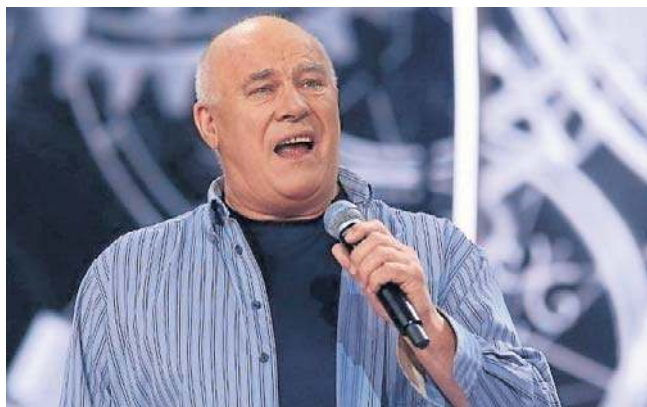
Ryszard Rynkowski w październiku tego roku obchodzić będzie 75 urodziny. Na scenach obecny był przez dekady

Powodem rezygnacji z koncertów podawany przez menagera Ryszarda Rynkowskiego jest stan zdrowia artysty. Czy zatem będzie miał on siły stać w kwietniu przed Sądem Rejonowym w Brodnicy? Wtedy właśnie ruszyć ma tam jego proces za pijaną jazdę samochodem do Opola.