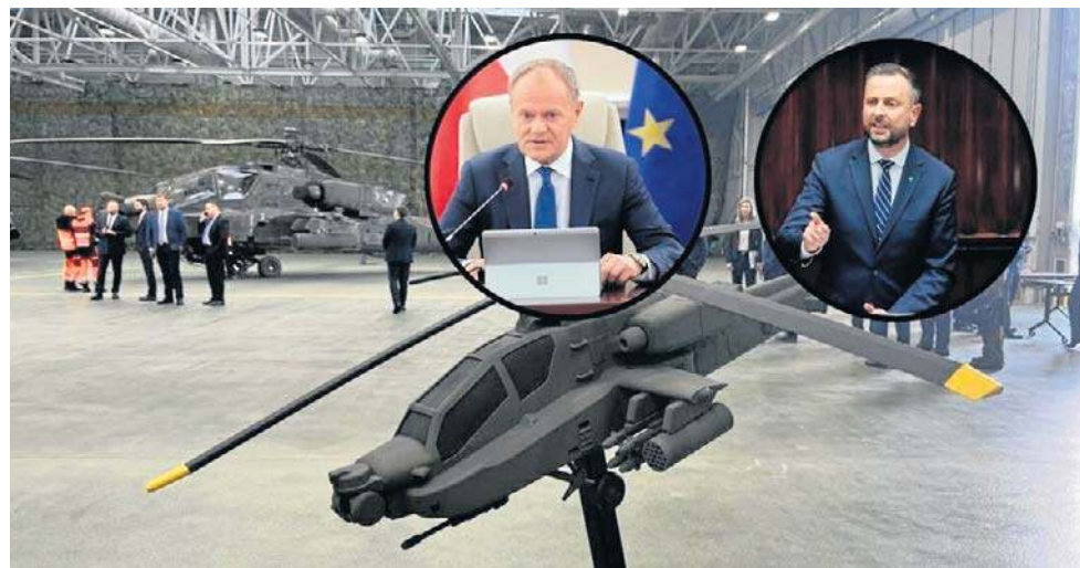
Władysław Kosiniak-Kamysz: Silna polska armia, dobrze wyposażony żołnierz Wojska Polskiego to gwarancja bezpieczeństwa

Jak mówił, silna polska armia, dobrze wyposażony żołnierz Wojska Polskiego to gwarancja bezpieczeństwa. - 96 Apache'ów to druga na świecie armia śmigłowców bojowych produkcji amerykańskiej, zaraz po Stanach