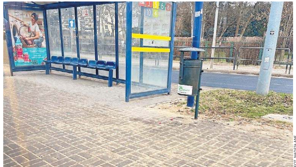
Jeszcze kilka tygodni temu piasek, którym posypywano chodniki w mieście, zapobiegał ślizganiu się po oblodzonej powierzchni

O to, kiedy rozpocznie się pozimowe sprzątnięcie, dopytywaliśmy w bydgoskim ratuszu już w połowie marca. Dowiedzieliśmy się, że to zadanie nie dla Zarządu Dróg Miejskich