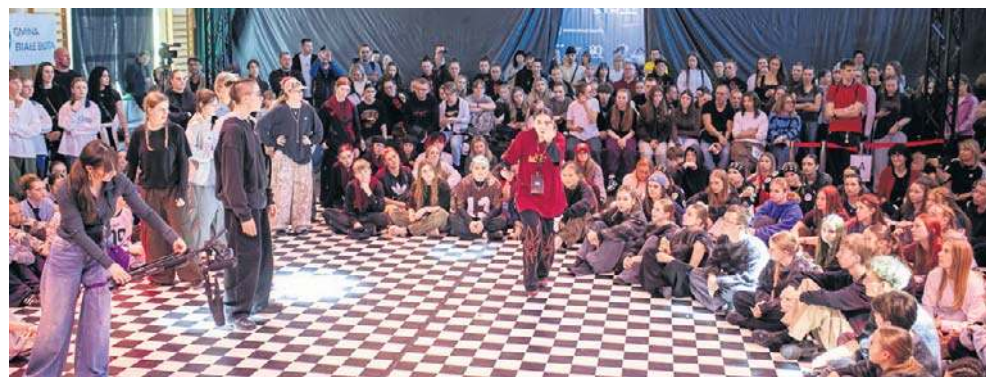
Turniej przyciąga coraz więcej uczestników, ale też publiczność

Rywalizacja przebiegała w trzech formach: hip-hop solo (1vs1), hip-hop 2vs2 oraz formacje. W każdej z nich obowiązuje podział na kategorie wiekowe.