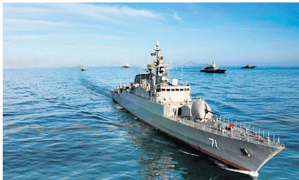
Stany Zjednoczone starają się ponownie otworzyć Cieśninę Ormuz dla dostaw surowców energetycznych

W sobotę Trump zapowiedział, że irańskie elektrownie staną się celem ataków, jeśli Teheran nie otworzy całkowicie Cieśniny Ormuz dla ruchu statków w ciągu 48 godzin. Termin ten upłynął po północy z niedzieli na poniedziałek czasu polskiego.