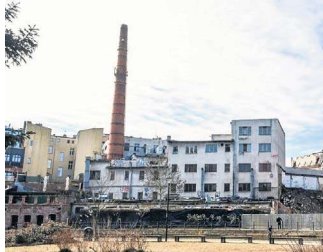
Trwają starania o wpisanie komina do rejestru zabytków województwa kujawsko-pomorskiego

- 1 sierpnia 2025 r. Minister Kultury i Dziedzictwa Narodowego uchylił decyzję o wpisaniu do rejestru zabytków województwa kujawsko-pomorskiego komina znajdującego się na poprzemysłowym terenie przy skrzyżowaniu ul. Świętej Trójcy i Poznańskiej w Bydgoszczy. Sprawa została przekazana do ponownego rozpatrzenia przez Kujawsko-Pomorskiego Wojewódzkiego Konserwatora Zabytków - informuje nas w odpowiedzi Piotr Jędrzejowski, rzecznik prasowy Ministerstwa Kultury i Dziedzictwa Narodowego.