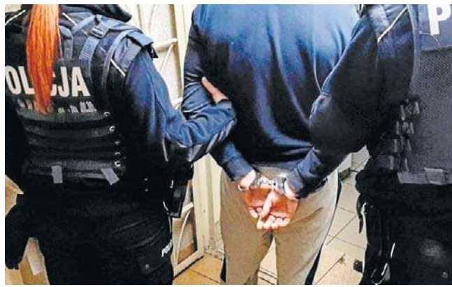
Sąd Okręgowy w Toruniu wymierzył głównemu sprawcy karę łączną pięciu lat bezwzględного więzienia. Wyrok nie jest prawomocny