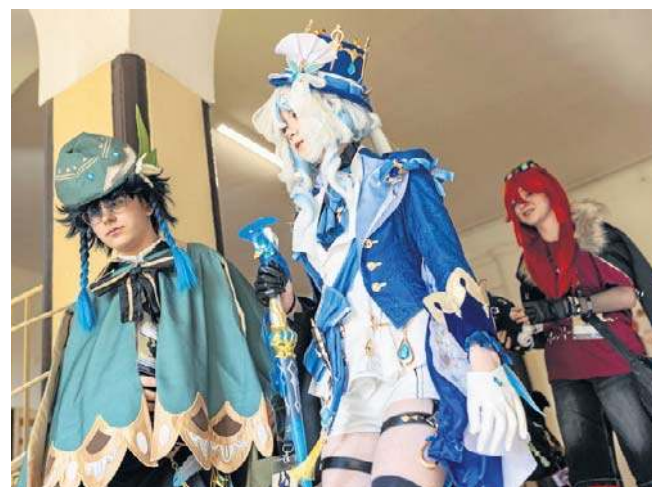
Konkurs cosplay, podczas którego uczestnicy prezentują kostiumy inspirowane postaciami z filmów, gier i komiksów