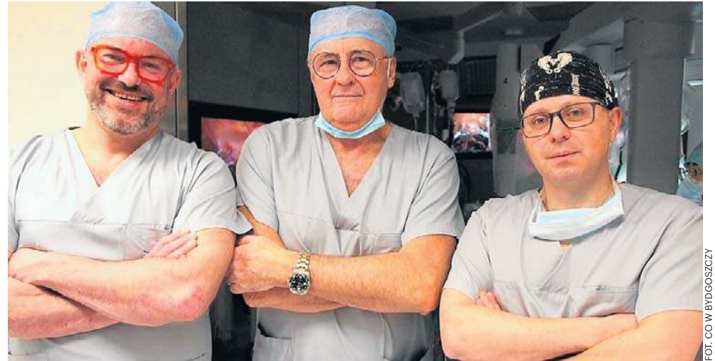
Lekarze z bydgoskiego Centrum Onkologii podczas jednej operacji usunęli pacjentce dwa nowotwory

- Pacjentka ma podczas jednego zabiegu robotycznego zoperowane dwa nowotwory w dwóch narządach i nie musi przeżywać podwójnego stresu. Nie musi mieć zastosowanego