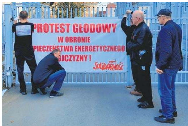
Uczestnicy zdecydowali się na zaostrzenie protestu, rezygnując nawet z przyjmowania płynów

- Jest dość ciężko. To już dziesiąta doba, każdy dzień jest