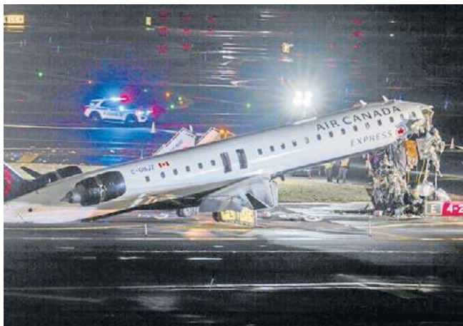
Samolot zderzył się z wozem strażackim w trakcie lądowania na lotnisku LaGuardia w Nowym Jorku