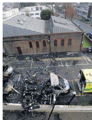
Podpalone zostały cztery karetki

Wcześniej policja przekazała informację o wszczęciu śledztwa w sprawie podpalenia czterech