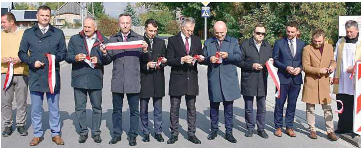
Po zakończeniu kompleksowej przebudowy, oddano do użytku kluczowy odcinek drogi powiatowej nr 2961L Krzeszów – Dąbrówka