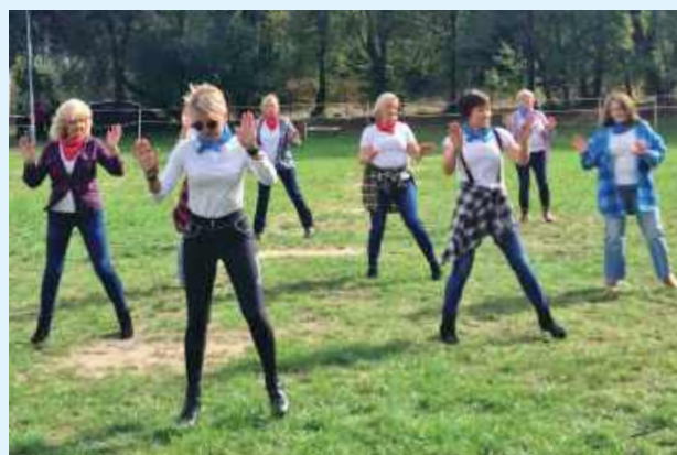
W zdrowym ciele zdrowy duch