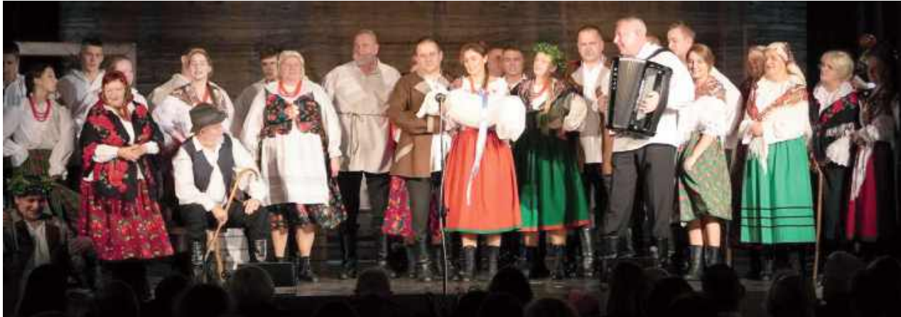
Święto teatru w Tarnogrodzie

Tarnogród na trzy dni – od 10 do 12 października – stał się stolicą polskiego teatru ludowego. Do miasta zjechały zespoły z różnych regionów kraju, by zaprezentować się podczas 42. Ogólnopolskiego Sejmiku Teatrów Wsi Polskiej – jednego z najważniejszych wydarzeń kulturalnych dedykowanych artystom-amatorom kultywującym tradycje sceniczne wsi.