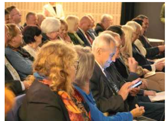
Sejmik w Tarnogrodzie to jedno z najważniejszych wydarzeń prezentujących dorobek teatrów ludowych z całego kraju