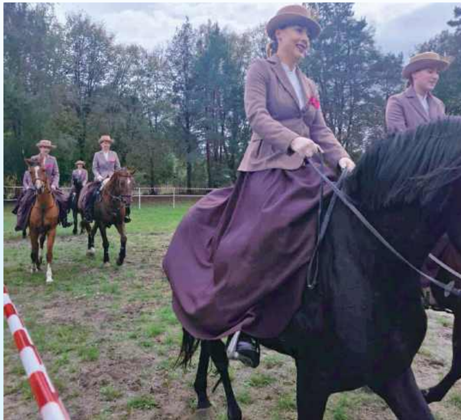
W programie nie brakowało tradycyjnych atrakcji, takich jak rajd konny