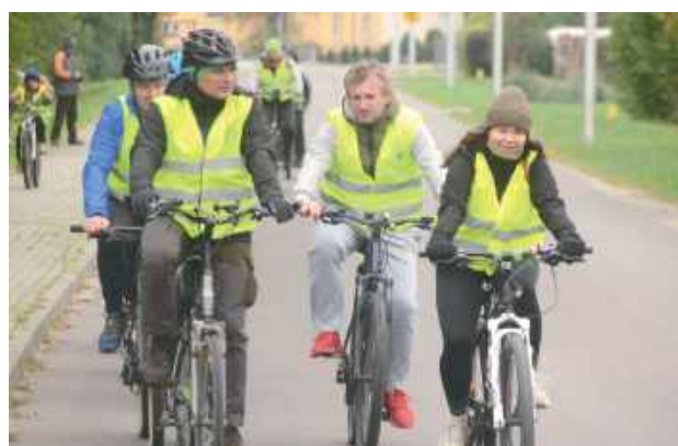
Pomimo pochmurnego nieba i chłodnej temperatury rajd można zaliczyć do udanych akcji