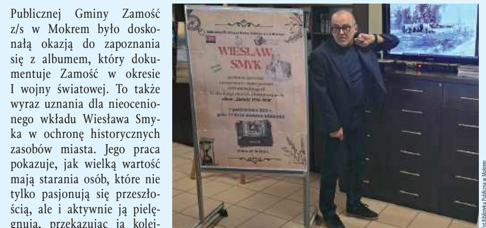
W trakcie spotkania zaprezentowano album fotograficzny dokumentujący miasto w latach 1914-1918