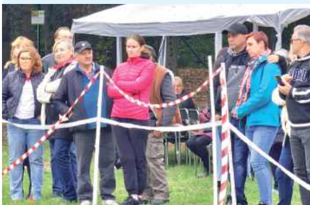
Hubertus 2025 za nami