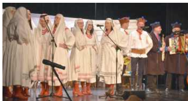
Publiczność porwał Wieczór Folkloru – wspólne muzykowanie i taniec z sejmikowymi kapelami