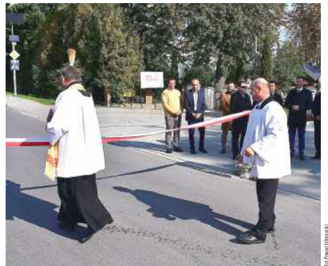
Droga poświęcona, wstęga przecięta, można bezpiecznie śmigać

Oficjalnie oddano do użytku przebudowany odcinek drogi powiatowej nr 2961L Krzeszów – Dąbrówka w Potoku Górnym. Inwestycja, która znacząco poprawiła komfort podróży i bezpieczeństwo mieszkańców, została zakończona po kilku miesiącach intensywnych prac.