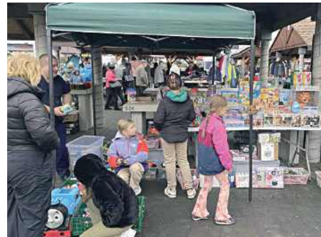
Od lat druga niedziela miesiąca to dzień garażówki