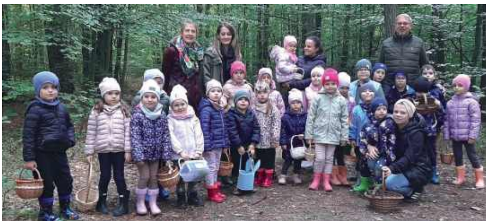
Po spotkaniu z leśniczym maluchy wyruszyły na spacer po lesie

Przedszkolaki z Różańca Drugiego miały okazję wziąć udział w wyjątkowej wycieczce do pobliskiego lasu, gdzie spotkały się z leśniczym. W trakcie wizyty dzieci miały szansę poznać fascynujący świat przyrody i dowiedzieć się, jak wygląda praca leśniczego.