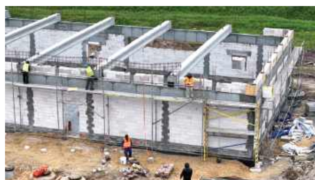
Na zdjęciach wykonanych z lotu ptaka przez Piotra Kowalczyka widać, że McDonald nabiera kształtów

Największe zapotrzebowanie dotyczy stanowiska managera (kierownika zmiany)