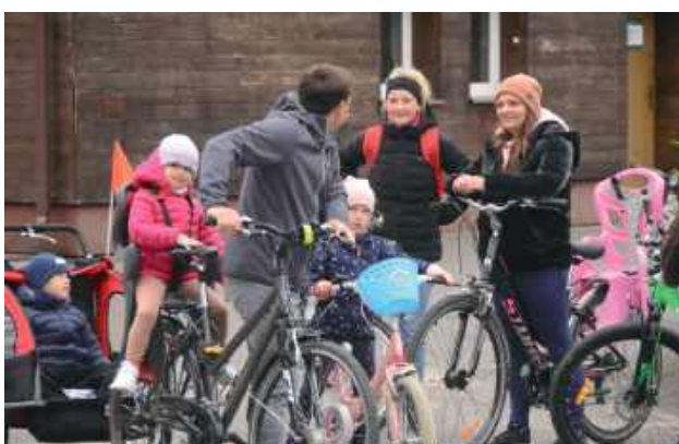
W rajdzie brały udział całe rodziny - od najmłodszych po najstarszych