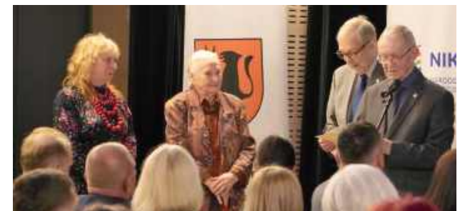
Uroczyste otwarcie Sejmiku