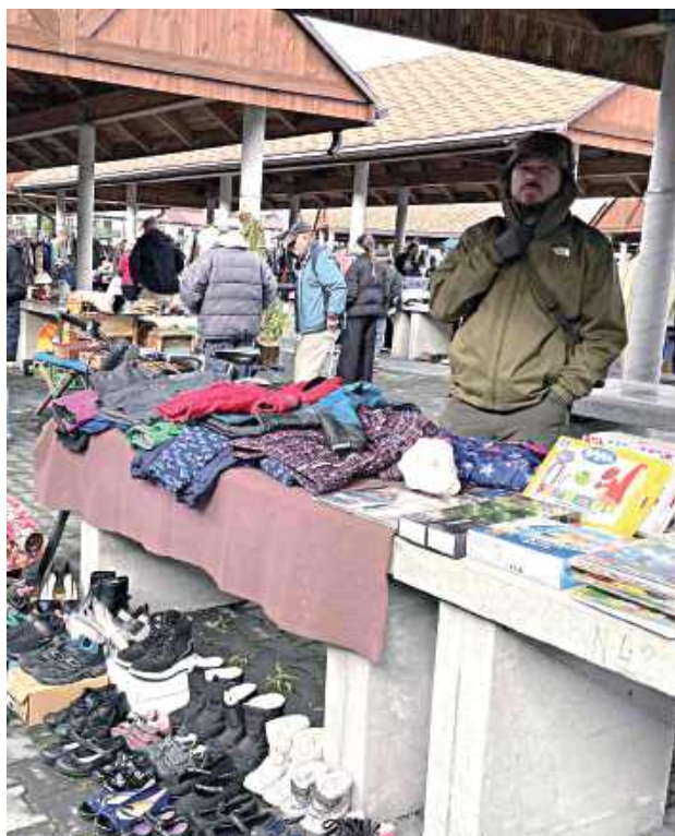
Ubrania, książki i zabawki to najpopularniejsze fanty na garażówce