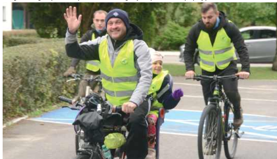
Takich wydarzeń jak to, Biłgoraj potrzebuje o wiele więcej