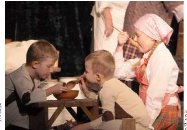
Na scenie młode pokolenie aktorów