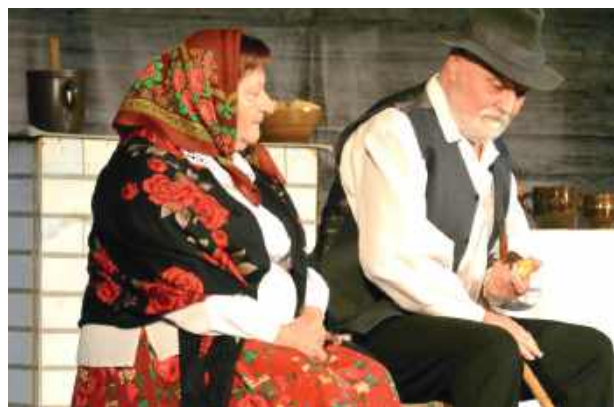
Do Tarnogrodu zjechali artyści z całej Polski