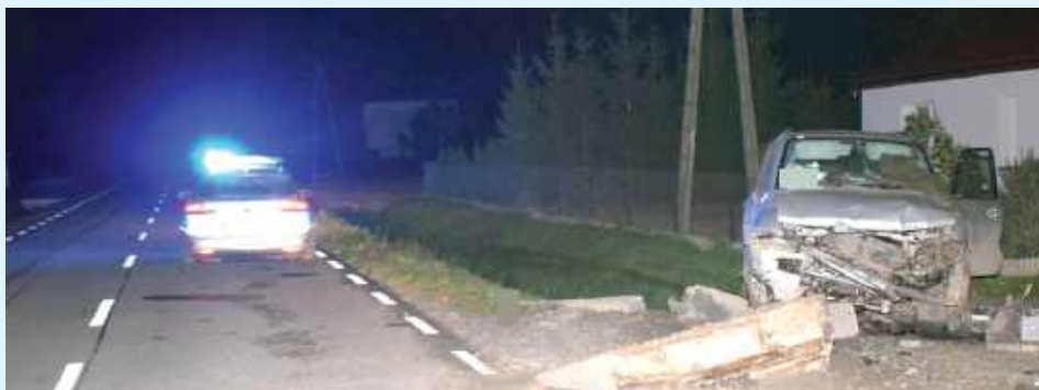
Na miejscu zdarzenia pracowała grupa dochodzeniowo-śledcza, która przeprowadziła czynności procesowe w celu ustalenia dokładnych okoliczności wypadku

Do wypadku doszło w nocy w Horyszowie Polskim (gm. Sitno), kiedy kierowca samochodu marki Mitsubishi, próbując uniknąć zderzenia ze zwierzęciem, wjechał do przydrożnego rowu, uderzając w betonowy przepust.