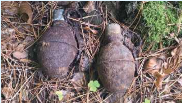
Po przybyciu na miejsce policjanci potwierdzili, że rzeczywiście chodzi o dwa skorodowane granaty, prawdopodobnie pochodzące z czasów II Wojny Światowej

Po przybyciu na miejsce policjanci potwierdzili, że rzeczywiście chodzi o dwa skorodowane granaty, prawdopodobnie pochodzące z czasów II Wojny Światowej. Funkcjonariusze zabezpieczyli teren, aby uniemożliwić dostęp osobom postronnym, a następnie wezwano patrol saperski.