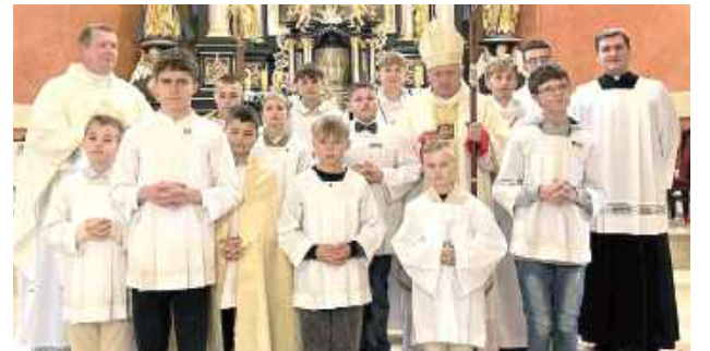
Wprowadzenie relikwii bł. Kardynała Stefana Wyszyńskiego stanowi dla parafii w Goraju wydarzenie o wyjątkowym znaczeniu duchowym – moment wdzięczności, refleksji i umocnienia w wierze