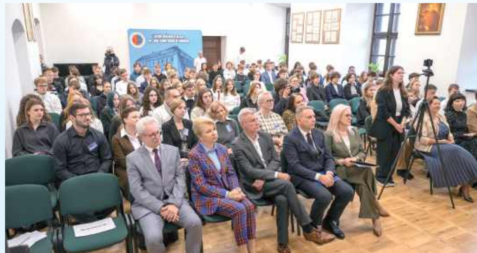
III Ogólnopolski Zlot Szkół im. Jana Zamoyskiego okazał się doskonałą okazją do spotkania, wymiany doświadczeń oraz integracji młodzieży i kadry pedagogicznej

W I Liceum Ogólnokształcącym im. Jana Zamoyskiego w Zamościu odbył się III Ogólnopolski Zlot Szkół noszących imię Jana Zamoyskiego. Wydarzenie zgromadziło przedstawicieli szkół z Lublina, Warszawy i Zwierzyńca, które miały okazję wymienić doświadczenia i wspólnie uczcić swojego patrona. Zlot był okazją do integracji, prezentacji szkół oraz uczestnictwa w licznych atrakcjach kulturalnych.