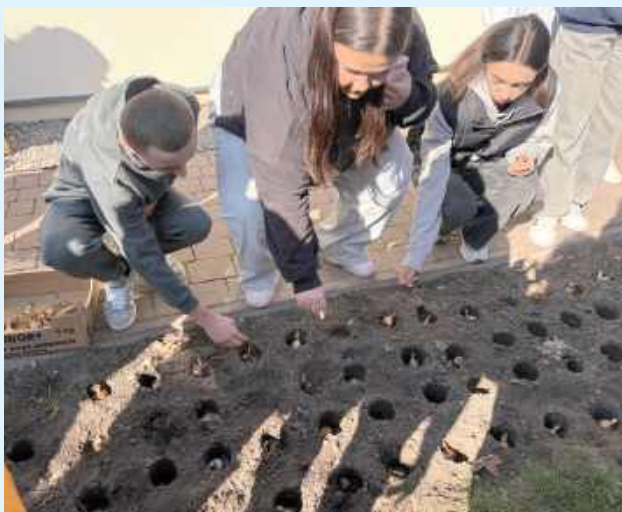
Podczas tego dnia młodzież zaangażowała się w sadzenie żonkili – kwiatów, które są powszechnie uznawane za symbol nadziei i solidarności