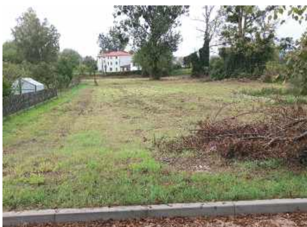
Na zakupionej nieruchomości powstanie budynek wielorodzinny, w którym zaplanowano 10 mieszkań

Władze gminy poinformowały, że dotychczas planowana inwestycja w miejscowości Żabno nie mogła zostać zrealizowana ze względu na uwarunkowania urbanistyczne oraz istniejącą zabudowę. Po dokładnych konsultacjach i przeglądzie dostępnych terenów ustalono, że Turobin jest jedyną lokalizacją, która pozwala na budowę budynku wielorodzinnego. Na nowo zakupionej działce