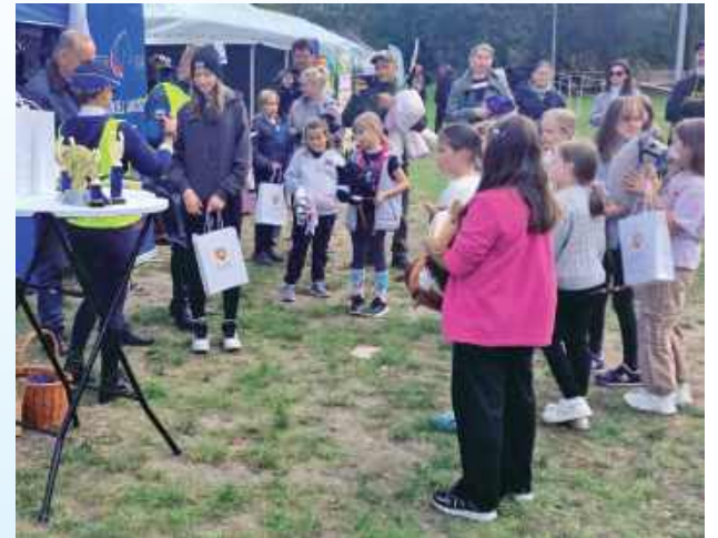
W programie nie brakowało atrakcji