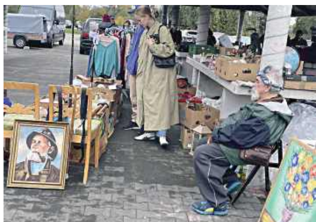
Na garażówce można znaleźć prawdziwe perełki

W niedzielę, 12 października odbyła się 44. Biłgorajska Wyprzedaż Garażowa, ostatnia w tym roku edycja popularnego wydarzenia. Jesienna odsłona przyciąga tłumy mieszkańców Biłgoraja i okolic, spragnionych zakupów w duchu recyklingu, spotkań z przyjaciółmi i dobrej zabawy.