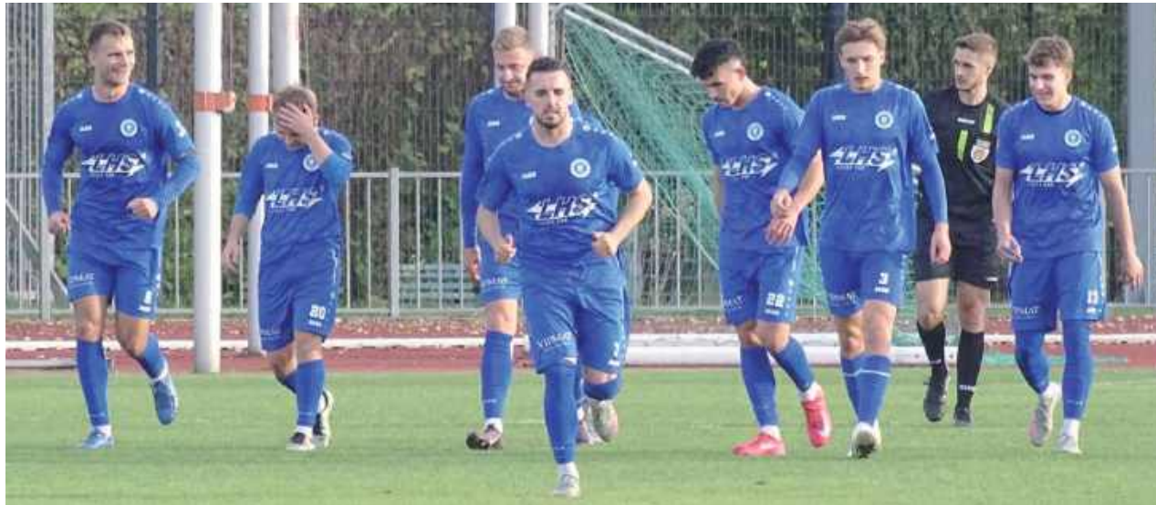
Piłkarze Łady 1945 Biłgoraj wygrali czwarty mecz z rzędu. Bilans bramek to 21:2!

- Granit to nie jest taki słaby zespół, bo potrafią się postawić. Obserwowałem ich mecz z Lublinianką i jeszcze inne spotkania i wyglądali nieźle. Dwie szybko strzelone bramki praktycznie ustawiły nam ten mecz. Granit nie miał, zdaje się, czterech czy nawet pięciu zawodników z podstawowej jedenastki. Kartki, kontuzje i wyszli osłabieni. Z naszej strony wszystko było pod kontrolą i trudno cokolwiek więcej powiedzieć o tym spotkaniu. Panowaliśmy od początku do końca na boisku w Bychawie. Plan na