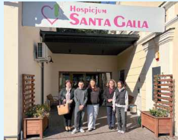
Akcja ta miała na celu nie tylko przekazanie wsparcia emocjonalnego, ale także podkreślenie znaczenia pomocy osobom w trudnych momentach ich życia