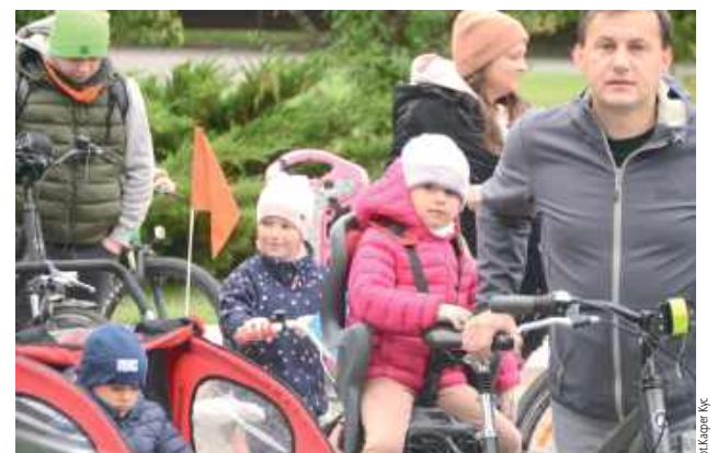
Ekscytacja na twarzach najmłodszych mówiła jedno - to będą niezapomniane chwile