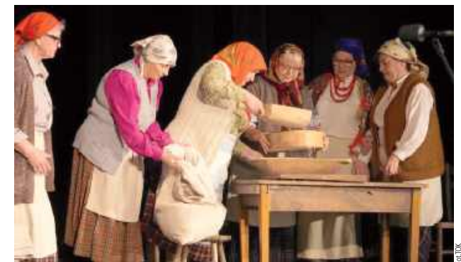
Organizatorzy wydarzenia podkreślają, że Sejmik to nie tylko konkursowy przegląd, lecz przede wszystkim święto autentycznej kultury ludowej, spotkanie pokoleń i ludzi, dla których teatr jest żywą częścią tradycji