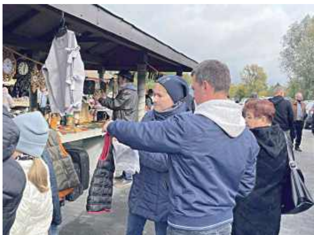
Hmm... kupić, nie kupić...