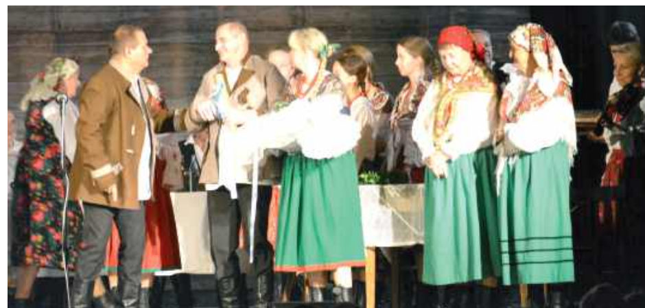
Pomędzy występami odbywały się warsztaty artystyczne prowadzone przez Radę Artystyczną Sejmiku sprzyjające wymianie doświadczeń i doskonaleniu umiejętności aktorskich

a także Zespół Pieśni i Tańca PRZEMYŚL w widowisku „Kolejność z przemyskiego”. Po południu odbyło się uroczyste zakończenie i podsumowanie tegorocznej edycji, połączone z podziękowaniami dla zespołów i instruktorów.