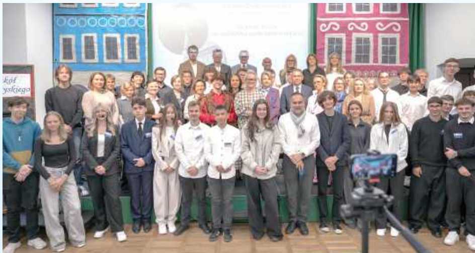
Do uczestnictwa w wydarzeniu zaproszone zostały szkoły ponadpodstawowe z Lublina, Warszawy i Zwierzyńca, które również są patronowane przez postać Jana Zamoyskiego