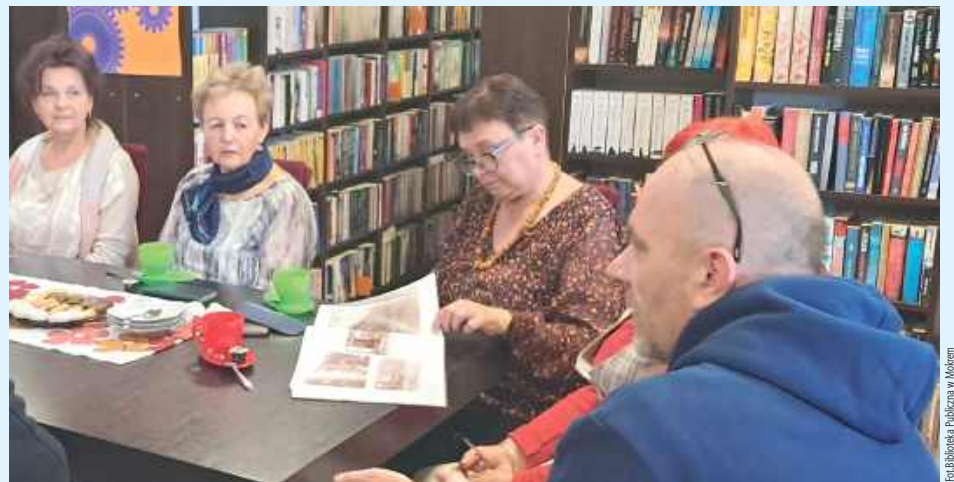
W trakcie spotkania zaprezentowano album fotograficzny dokumentujący miasto w latach 1914-1918