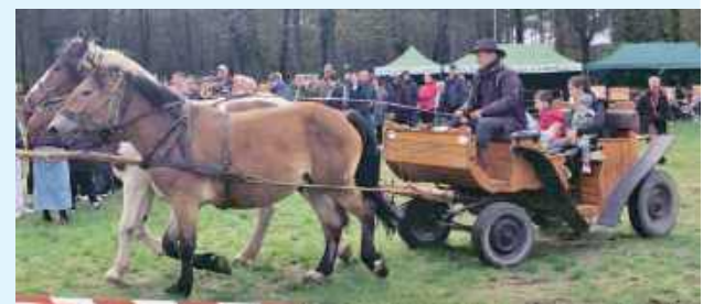
Były przejażdżki bryczką