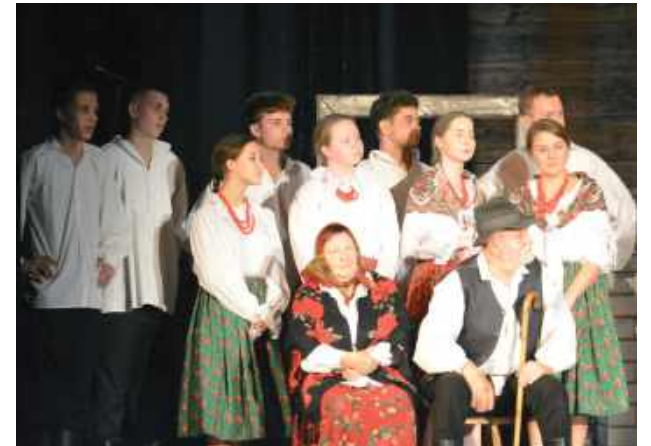
Ogólnopolski Sejmik Teatrów Wsi Polskiej w Tarnogrodzie