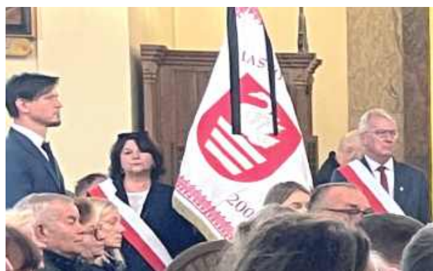
W poczcie sztandarowym Miasta Biłgoraja stanęli przedstawiciele wszystkich opcji biłgorajskiego samorządu

to, że pokazałeś mi, co znaczy miłość przez duże M.