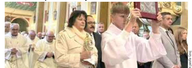
Wprowadzenie relikwii błogosławionego Kardynała Stefana Wyszyńskiego, Prymasa Tysiąclecia, do kościoła parafialnego w Goraju