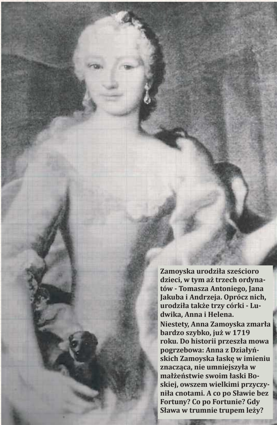
Anna z Działyńskich Zamoyska, matka trzech ordynatów

Drugą żoną Michała Zdzisława Zamoyskiego była urodzona w 1701 roku Elżbieta z Wiśniowieckich, córka księcia Michała Serwacego Wiśniowieckiego. Miała ogromny talent do języków obcych oraz była obdarzona ponadprzeciętną inteligencją. Nic dziwnego, że sama wyraziła chęć poślubienia o wiele starszego wdowca,