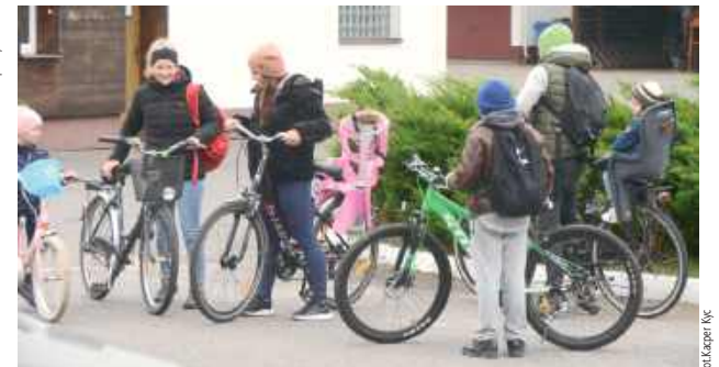
Uczestnicy zebrali się przed siedzibą Nadleśnictwa Biłgoraj