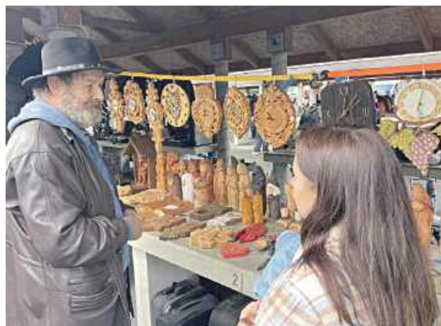
Lokalni artyści wystawili swoje arcydzieła