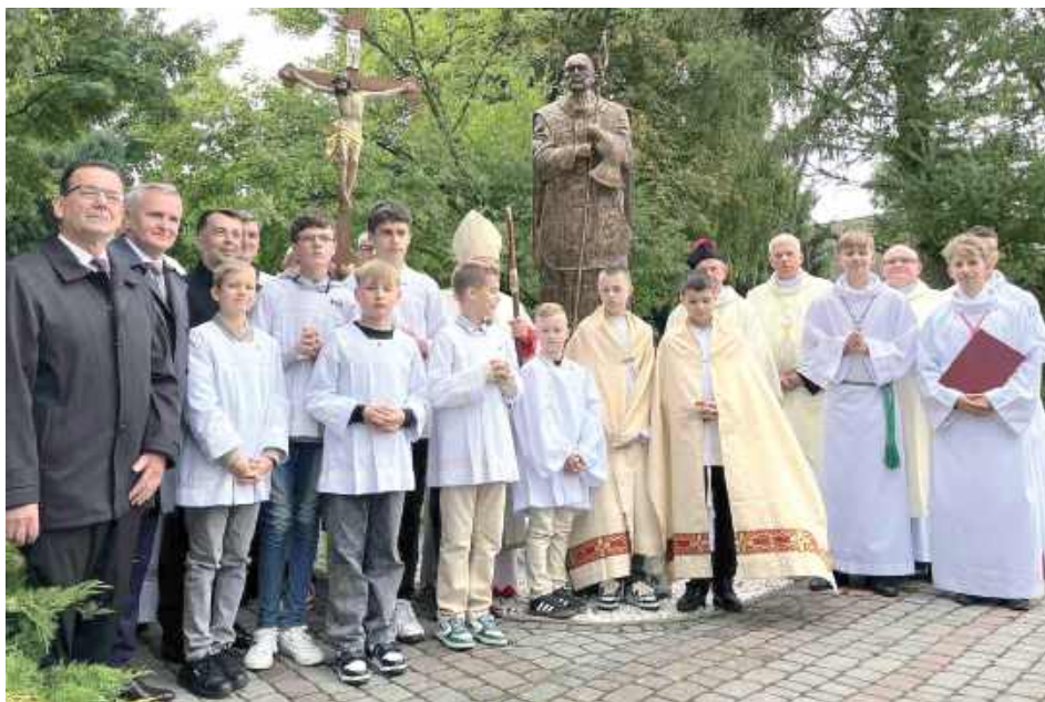
Pamiątkowe zdjęcie z uroczystości