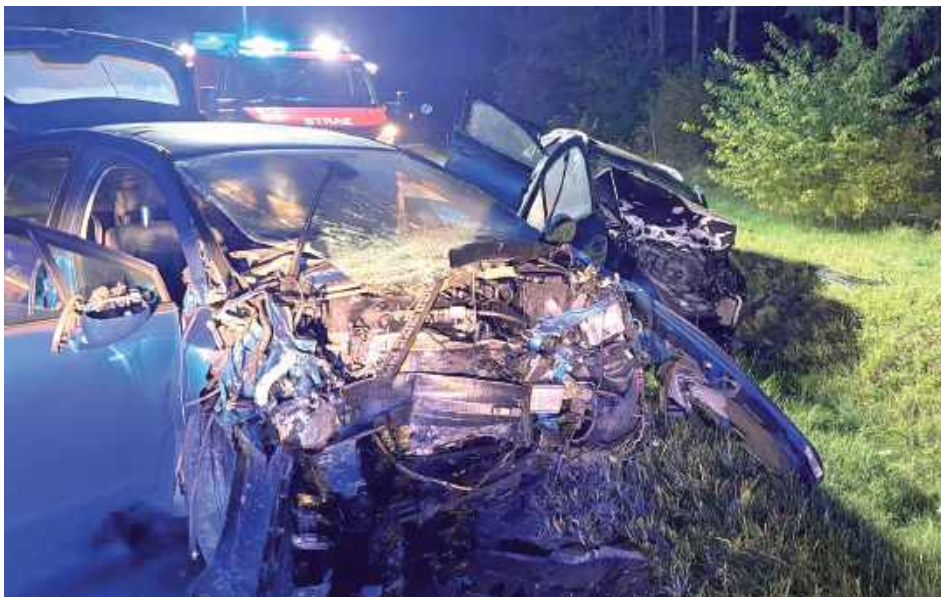
Do zderzenia czołowego dwóch pojazdów doszło 8 października w miejscowości Wola Duża (gm. Biłgoraj) na drodze wojewódzkiej 858. Poszkodowane zostały cztery osoby, w tym dwoje dzieci

- Możemy potwierdzić, że doszło do zderzenia czołowego dwóch pojazdów. Dwie osoby zostały uwięzione w pojazdach, w sumie poszkodowanych jest cztery osoby, w tym dwoje dzieci - przekazali nam biłgorajscy strażacy w dniu zdarzenia.