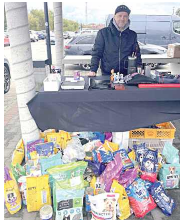
Organizatorzy garażówki zadowoleni. Piękne dary udało się zebrać dla potrzebujących zwierząt