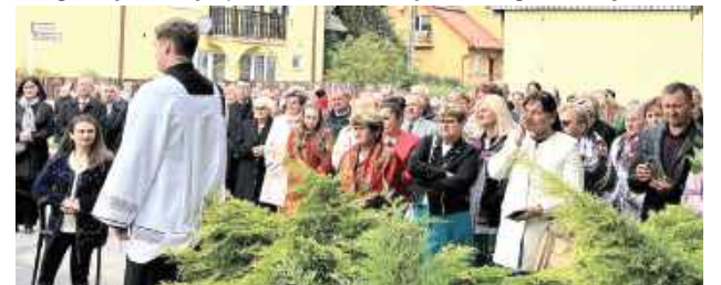
Po zakończeniu Eucharystii uczestnicy uroczystości w procesji udali się pod pomnik błogosławionego Kardynała Stefana Wyszyńskiego w parku miejskim