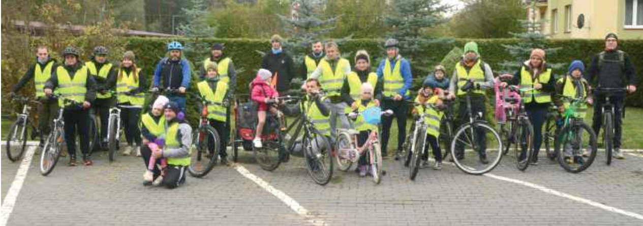
Wydarzenie przyciągnęło wielu sympatyków lasu

nej i pochmurnej pogody na starcie rajdu rodzinnego po Nadleśnictwie Biłgoraj pojawiło się wielu miłośników rowerowych wypraw. Uczestnicy wyruszyli spod siedziby Nadleśnictwa, by pokonać trasę liczącą około 25 kilometrów przez malownicze leśnictwa Wola i Bojary.