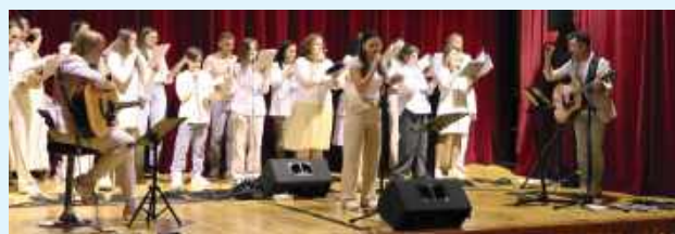
Warsztaty wokalne „W-NIEBO-GŁOSY” odbyły się w Krasnobrodzkim Domu Kultury