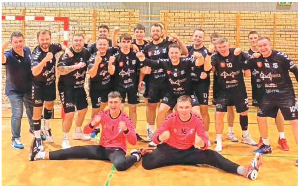
Piłkarze ręczni MKS Biłgoraj rozpoczęli sezon od cennego wyjazdowego zwycięstwa

- Z dalekiej podróży wieziemy do Biłgoraja 3 punkty. Za nami ciężki mecz, mimo że większość spotkania prowadzimy nieznanie, nie możemy odskoczyć przeciwnikowi. Popelniamy błędy, zawodzi skuteczność, jednak z tych trudnych momentów wychodzimy zwycięsko. W ostatnich 10 minutach podkręcamy tempo, odskakujemy i nie wypuszczamy zwycięstwa z rąk. Wielkie brawa dla naszych chłopaków - podsumowuje MKS.