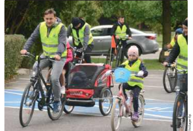
Do przejechania mieli około 25 kilometrów, a trasa wiodła przez leśnictwa Wola i Bojary