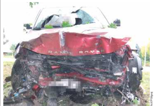
Pijana 40-latką kierująca range roverem na łuku drogi straciła panowanie nad pojazdem i uderzyła w drzewo rosnące u podnóża skarpy

Ponad 1 promil alkoholu miała kobieta kierująca Range Roverem w Radzięcinie.