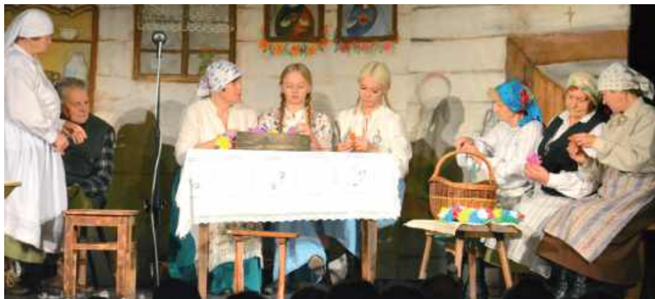
Pierwszego dnia publiczność mogła obejrzeć spektakl „Szykowanie do wesela” w wykonaniu zespołu ZORZA z Dereżni

W niedzielę, ostatniego dnia Sejmiku, wystąpił Teatr Ludowy TRADYCJA z Alwerni i Okleśnej, prezentując „Ostatnią drogę świętego Wojny”,