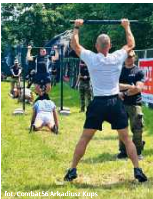
cy, analizując relacje z poprzednich edycji i budując zarówno formę fizyczną, jak i odporność psychiczną.

Zdaniem instruktorów współczesna młodzież często trenuje świadomie i systematycznie. Wielu kandydatów przygotowywało się do tego wydarzenia przez wiele miesięcy.