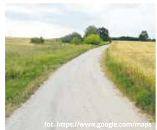
O gruntowną poprawę stanu technicznego drogi, a przede wszystkim utwardzoną nawierzchnię mieszkańcy gminy Siedliszcze apelują od lat.

- Obecnie niuregulowany pozostaje stan prawny działek, na których zlokalizowana jest droga powiatowa. W takiej sytuacji nie ma możliwości ogłoszenia przetargu na opracowanie dokumentacji technicznej niezbędnej do realizacji inwestycji drogowej. Po uregulowaniu stanu prawnego działek oraz zapewnieniu odpowiednich środków finansowych