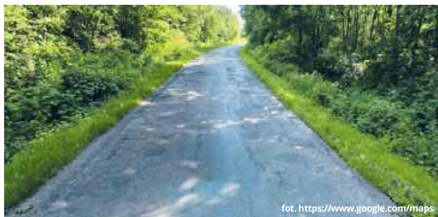
Prace na drodze prowadzącej do Popław mają rozpocząć się na ul. Grabowieckiej w Wojsławicach

Mieszkańcy gminy Wojsławice oraz kierowcy korzystający z drogi powiatowej nr 1839L mogą w najbliższych latach doczekać się jednej z ważniejszych inwestycji drogowych w tej części powiatu chełmskiego. Starostwo Powiatowe w Chełmie prowadzi obecnie intensywne działania związane z przygotowaniem przebudowy ponad dwukilometrowego odcinka trasy prowadzącej od Wojsławic do granicy powiatu.