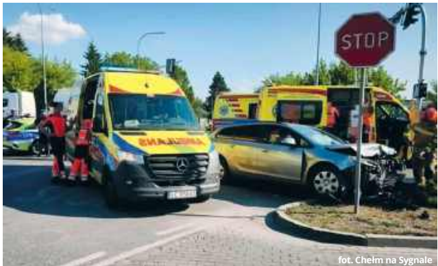
fol. Chelmski na Sygnale

● CHEŁM W piątkowe popołudnie na jednym z chelmskich skrzyżowań doszło do zderzenia dwóch pojazdów. Nieoznakowany policyjny radiowóz na sygnałach uderzył w prawidłowo jadącego Nissana, którym podróżowała kobieta z dwiema osobami w wieku 19 i 7 lat. Winę za zdarzenie ponosi funkcjonariusz, który wjechał na skrzyżowanie na czerwonym świetle, nie zachowując ostrożności.