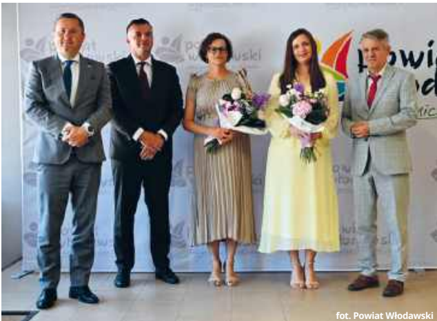
fol. Powiat Włodawski

Przed głosowaniem przedstawiono projekt uchwały absolutoryjnej, opinie komisji oraz wnioski Komisji Rewizyjnej. Radni zapoznali się również z uchwałą Składu Orzekającego Regionalnej Izby Obrachunkowej w Lublinie z 20 maja