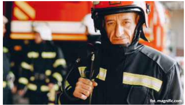
Rada Gminy Leśniowice uchwaliła nowe, wyższe stawki ekwiwalentu pieniężnego, jakie przysługują ochotnikom za ich służbę i różne rodzaje prac.

- To oni często jako pierwsi docierają na miejsce pożaru czy