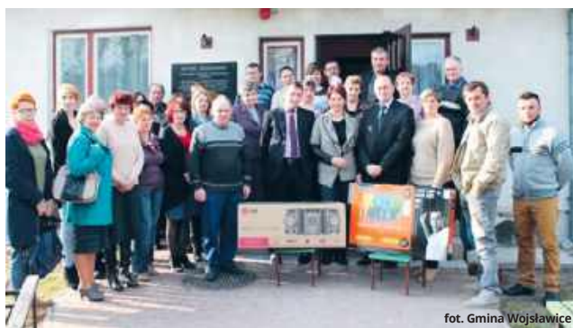
Uroczyste otwarcie świetlicy wiejskiej w Hucie miało miejsce w 2015 roku.

Zakres inwestycji obejmuje termomodernizację budynku, w tym ocieplenie ścian zewnętrznych oraz stropu sali świetlicowej, wykonanie nowego sufitu spełniającego wymagania przeciwpożarowe, odświeżenie wnętrza poprzez malowanie po-