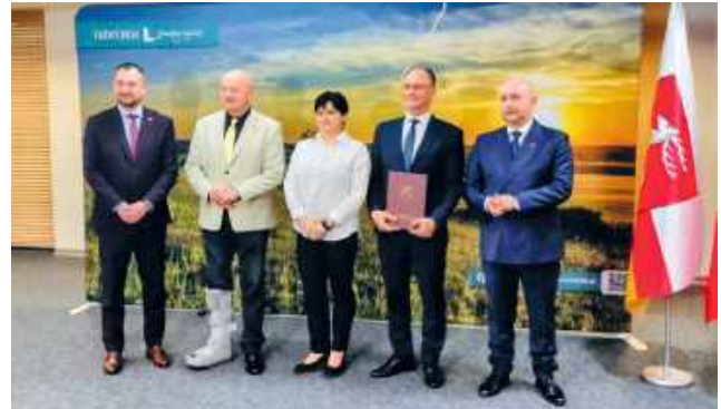
Gmina Ruda-Huta otrzymała od samorządu województwa wsparcie na poprawę stanu technicznego drogi w Rudce. To także dojazd do pól, z którego korzystają okoliczni producenci rolni.

Jak poinformował wójt gminy, po przeprowadzeniu postępowania przetargowego całkowita wartość inwestycji wyniosła niespełna 490 tys. zł. Oznacza to, że dofinansowanie z budżetu