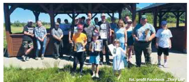
fol. profil Facebook „Złoty Lin”

- Trudno wyobrazić sobie bardziej symboliczne zakończenie zawodów. Ryba, która znajduje się w nazwie naszego koła, przesądziła o zwycięstwie w najważniejszej kategorii - podkreślił