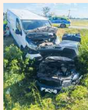
fol. KPP we Włodawie

● GM. URSZULIN Na drodze krajowej nr 82 w Michałowie doszło do groźnej kolizji z udziałem czterech pojazdów. Zaczęło się od ryzykownego wyprzedzania, a skończyło w przydrożnym rowie. Mimo że sytuacja wyglądała dramatycznie, uczestnicy zdarzenia mogą mówić o ogromnym szczęściu - nikt nie odniósł obrażeń. Sprawa jednak znajdzie swój finał w sądzie.