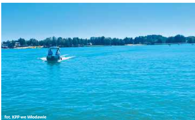
fol. KPP we Włodawie