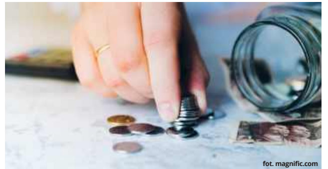
Radni wyrazili swoje poparcie dla realizacji założeń budżetowych w 2025 roku.

Wójt podzielił się również swoją opinią dotyczącą obecnego systemu finansowania edukacji.