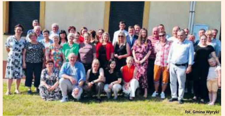
fol. Gmina Wyryki

– Dziękuję Radzie Gminy Wyryki za udzielenie mi wo-