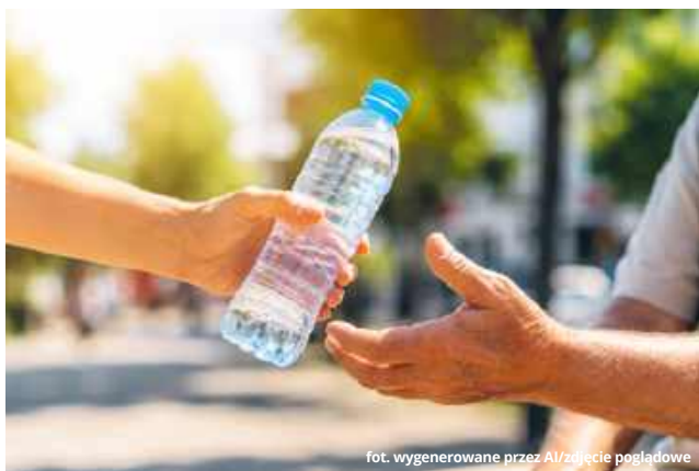
fol. wygenerowane przez AI/zdjęcie poglądowe

● GM. IZBICA W związku z trwającą falą intensywnych upałów mieszkańcy miasta i gminy Izbica mogą skorzystać z bezpłatnej wody pitnej. Samorząd uruchomił punkty dystrybucji i apeluje o zachowanie szczególnej ostrożności podczas gorących dni.