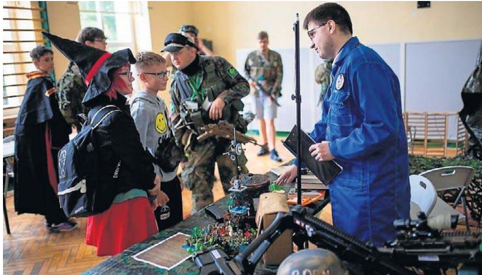
Organizatorzy przypominają, że udział w wydarzeniu jest wolny

Tegoroczna edycja odbędzie się w dniach 11-12 lipca w Słupskim Ośrodku Kultury przy ul. Banacha 17. Organizatorzy przygotowali bogaty program atrakcji. Uczestnicy będą mogli wziąć udział w turniejach gier planszowych i karcianych, sesjach