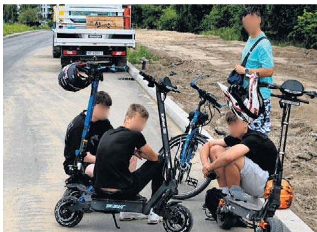
Jest budowa? Jest zabawa - wydają się sądzić niektórzy

Budowa III etapu Trasy Północnej obejmuje budowę nowej, dwujezdniowej ulicy od ul. Łącznej do ul. Szosa Polska w Szczecinie.