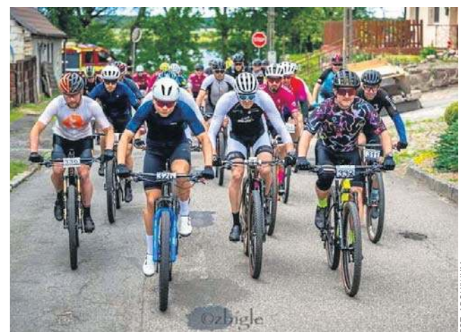
Organizatorzy zapraszają na rowerowe święto

Głównym punktem sportowym imprezy będzie V edycja Zachodniopomorskiego Pucharu MTB, którego trasy wyznaczono na terenie Cedynskiego Parku Krajobrazowego. Z kolei miłośnicy jazdy po szutrach będą mogli