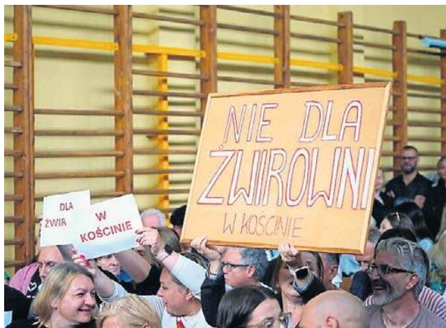
Mieszkańcy twierdzą, że nie po to wyprowadzali się na wieś, by pod ich oknami jeździły ciężarówki

- Na wcześniejszej sesji rady gminy mówił, że gmina może zyskać pięć milionów złotych. Na spotkaniu padła już kwota sześciu milionów, a wraz z możliwym dofinansowaniem nawet osmiu i pół miliona. Trudno traktować takie wyliczenia poważnie, skoro zmieniają się z tygodnia na tydzień - mówi.