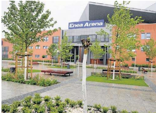
Na zdjęciu jeden z platanów, który choruje, ale pogłoski o jego bliskim końcu są mocno przesadzone

Tzw. odbetonowanie placu przed Enea Areną to jeden z najbardziej znanych pomysłów Szczecińskiego Budżetu Obywatelskiego. Jesienią 2025 r. betonowy plac zamienił się w zieloną przestrzeń. Posadzono 34 dorodne drzewa: 24 platany hiszpańskie oraz 10 klonów. Przestrzeń uzupełniono krzewami, bylinami oraz trawami ozdobnymi. Nasadzenia wykonano w uzgodnieniu z Biurem Ogrodnika Miasta. Ca-