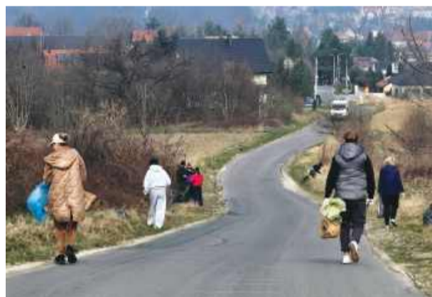
Ulica Sosnowa w Gęsińcu to jedna z najbardziej uczęszczanych dróg we wsi. Niestety, brudasy co roku bardzo ją zaśmiecają. W sobotę kilkunastu mieszkańców spotkało się, aby ją posprzątać.