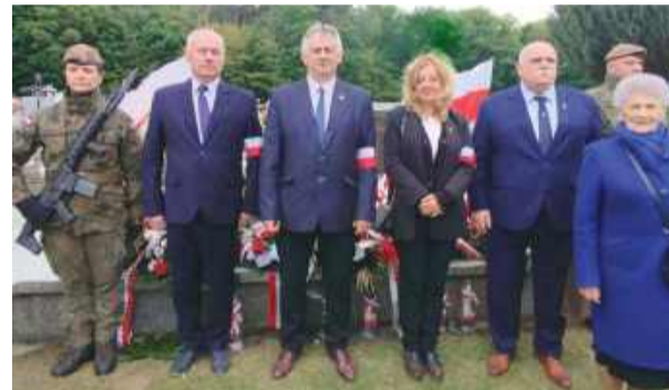
Maj 2025 r. Obchody 79. rocznicy zamordowania Żołnierzy Konspiracyjnego Wojska Polskiego (KWP) w Procesie Siedemnastu. Pani Honorata (czwarta z lewej) z członkami Ogólnokrajowego Związku Byłych Żołnierzy KWP.

młodości. Był zmarnowany, wyniszczony. To było straszne więzienie, gdzie codziennie umierali młodzi ludzie zakatowani podczas śledztwa, z fatalnych warunków bytowych, z chorób.