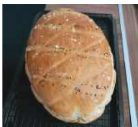
Chleb wielkanocny można przed upieczeniem posmarować białkiem i posypać makiem lub innymi ziarenkami.

Drożdże rozkruszyć w miseczce, posypać łyżką cukru i zalać połową szklanki ciepłej wody. Odstawić na ok. 10 minut. Mąkę przesiać,