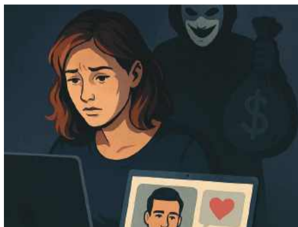
30-latka poznała mężczyznę na portalu społecznościowym

nie uzgadniając tej pożyczki z nimi. Mimo że padały kolejne prośby o wsparcie finansowe, 30-latka wciąż była skłonna nieść pomoc. Dopiero interwencja rodziny przerwała ten proceder – informuje Aleksandra Bezrąk, oficer prasowy komendy policji w Strzelinie.