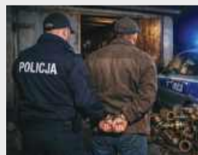
O dalszym losie złodzieja zdecyduje sąd. Fot. ilustracyjne

Do kradzieży doszło na początku lutego w Świnobrodzie niedaleko Borowa. Policjanci otrzymali