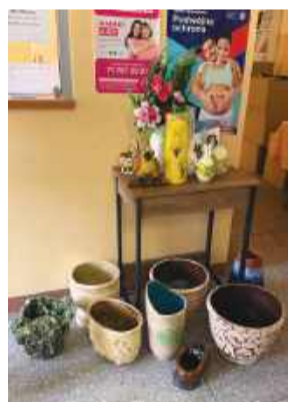
Wyroby cieszyły się dużym zainteresowaniem.