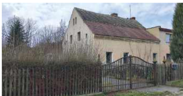
Tak dziś wygląda budynek, w którym kiedyś znajdowała się „Bohmische Baude”

Przed wojną była to klimatyczna restauracja z ogrodem tarasowym i widokiem na niezalesione wtedy stoki wznoszące się w kierunku Gromnika. Nazywała się „Bohmische Baude”, co (wybaczenie nieprecyzyjne tłumaczenie) można odczytać jako czeska buda - czeskie schronisko. Dziś, choć po samej restauracji nie ma już śladu, pozostał po