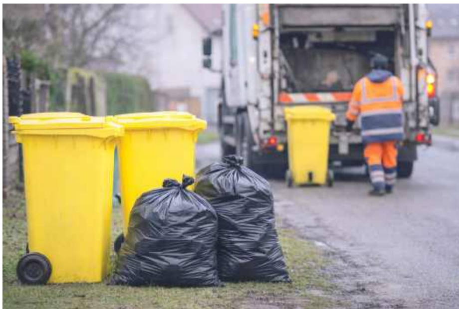
Dodatkowe worki nie zostały zabrane, a wielu mieszkańców podkreśla, że nikt wcześniej nie informował ich o obowiązku ich opisywania.