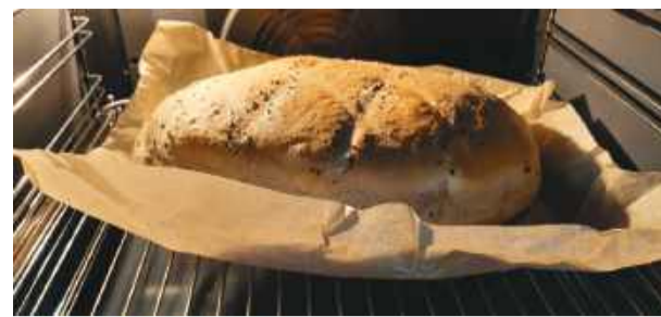
W drugiej części pieczenia chlebek pieczemy na samym papierze, żeby miał chrupiącą skórkę.

dodać sól, olej, resztę wody i rozczyn z drożdży. Wymieszać drewnianą łyżką do połączenia produktów. Przełożyć do żeliwnego garnka lub naczynia żaroodpornego, przykryć pokrywką i włożyć do lodówki na ok. 3-4 godziny. Po tym czasie wyjąć, odkryć pokrywkę i odstawić na ok. 0,5 godziny w ciepłe miejsce. Następnie przykryć pokrywką i wstawić do piekarnika. Piec w 200°C przez 30 minut. Po tym czasie wyjąć na papier do pieczenia i ponownie włożyć do piekarnika. Piec jeszcze w takiej samej temperaturze ok. 25-30 minut, żeby chleb miał chrupiącą skórkę.