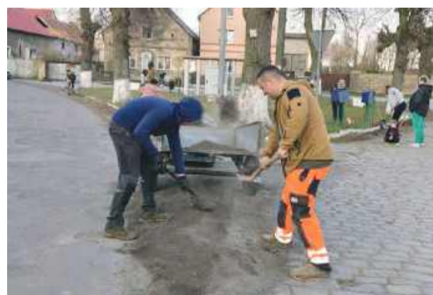
Wspólne sprzątnięcie centrum wsi w Jaworowie.