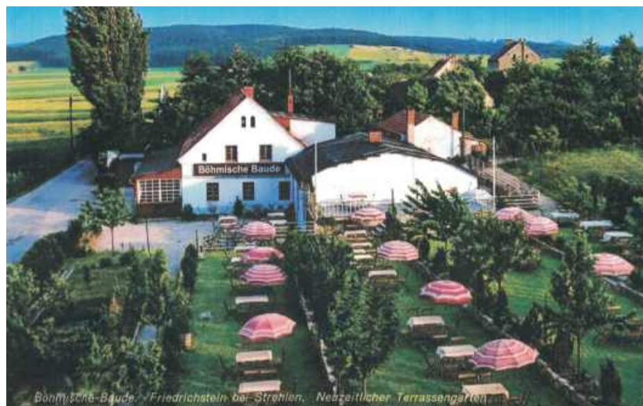
„Bohmische Baude” z nieistniejącym dziś parkowym tarasem. W oddali widać niezalesione pola w drodze na Gromnik (powyżej leśniczówki)

niej budynek i to w dobrym stanie. Dom mieszkalny znajduje się przy ul. Gajowej w Gęsińcu (po prawej stronie jadąc w kierunku leśniczówki w Gościęcicach). Przy jego bocznej ścianie, od strony Strzelina, gdzie kiedyś było wyjście do części ogrodowej ze stolikami, jest obecnie dobudowana