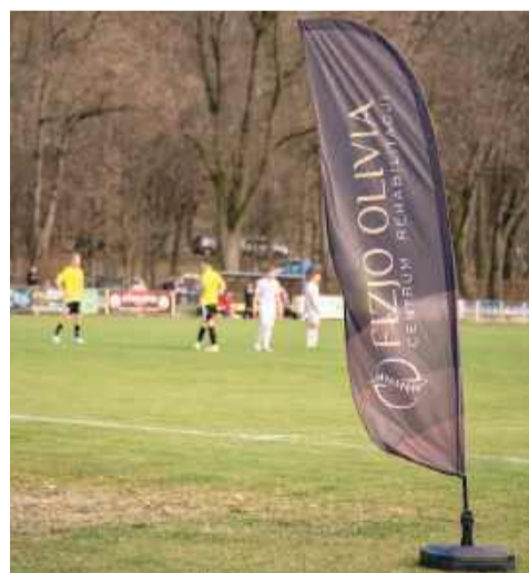
Centrum rehabilitacji Fizjo Olivia jest oficjalnym partnerem medycznym Strzelinianki.