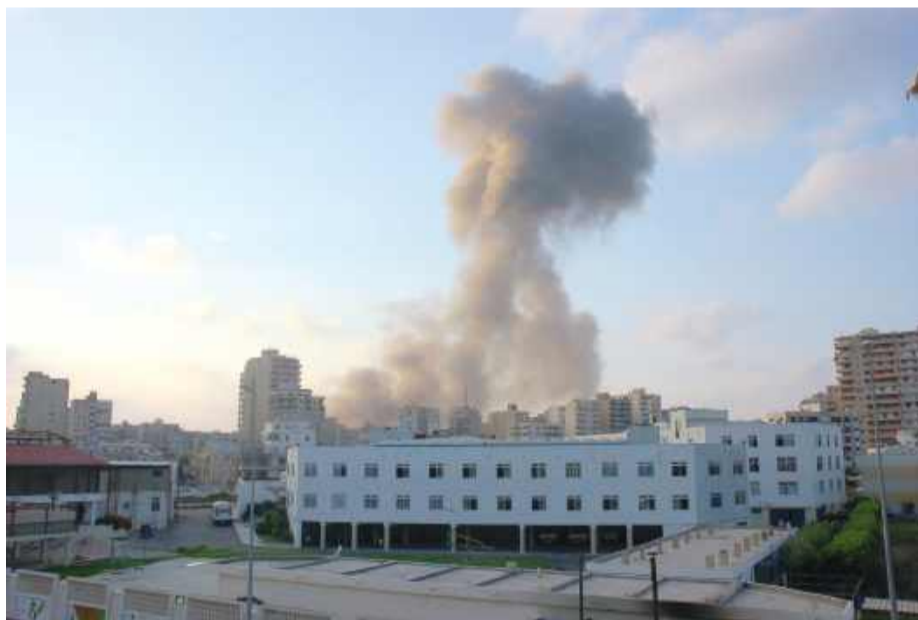
Czy konflikt USA – Iran wpłynie na nasze życie?