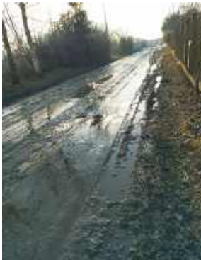
Podczas ulew i śniegów droga prowadząca do firmy zamienia się błoto

Mieszkańcy od lat wysyłają pisma do Urzędu Gminy w Wiązowie i strzelińskiego starostwa. Uzasadniają, że od dziesięciu lat są narażeni