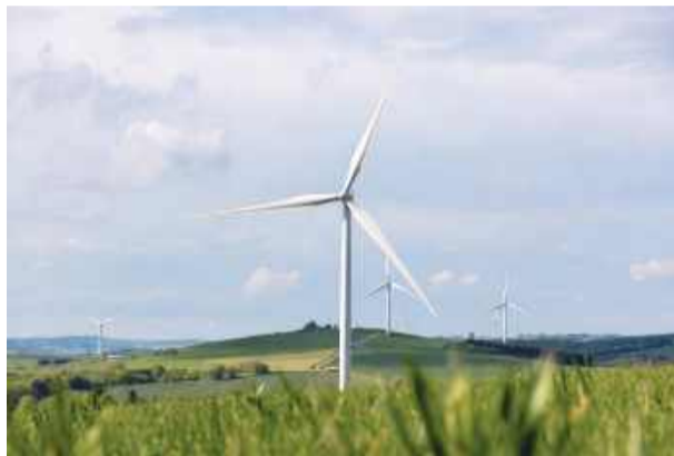
Mieszkańcy Pławnej i Trześni nie chcą farmy wiatrowej w swojej okolicy. Fot. ilustracyjne

oraz nastrojach społecznych docierają do urzędu m.in. poprzez mieszkańców i sołtysów. Żeby uspokoić mieszkańców, należy podkreślić, że ani miejscowy plan zagospodarowania przestrzennego, ani studium uwarunkowań i kierunków zagospodarowania przestrzennego nie dopuszcza lokalizacji