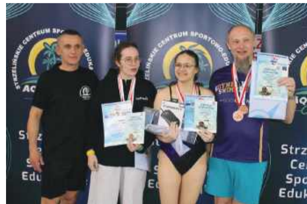
Najlepsi pływacy strzelińskiej Otyliady

Nocny maraton pływacki po raz kolejny pokazał, że w Strzelinie nie brakuje pasjonatów sportu i osób gotowych na prawdziwe wyzwania. Tegoroczna