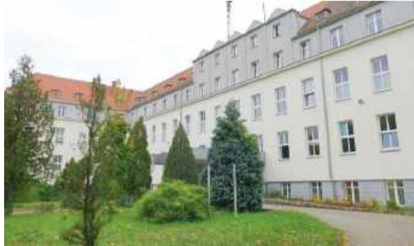
Dyrekcja Uniwersyteckiego Szpitala Klinicznego we Wrocławiu stara się o dotację z Ministerstwa Zdrowia na gruntowny remont strzelińskiego szpitala