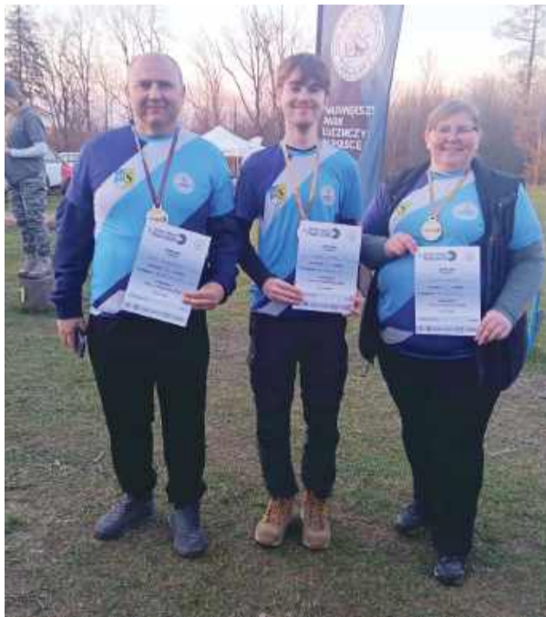
Reprezentanci Granitu z medalami