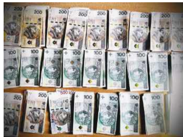
Zatrzymani to mieszkańcy Wrocławia. Odebrali od kobiety ponad 71 tysięcy złotych. Cała kwota została odzyskana.