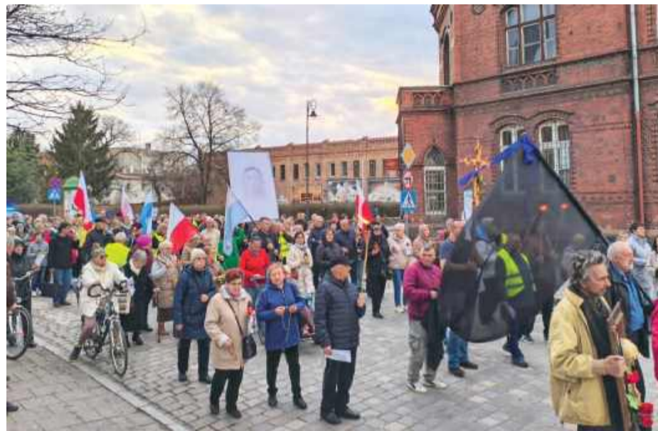
Różaniec pokutno-przebłagalny przyciągnął wielu wiernych