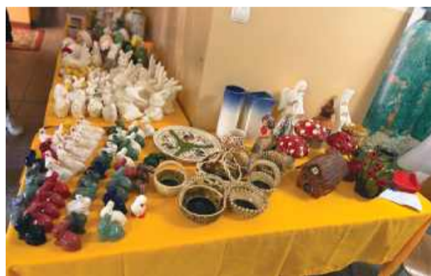
W ofercie znalazły się m.in. ozdoby świąteczne i prace wykonane różnymi technikami.