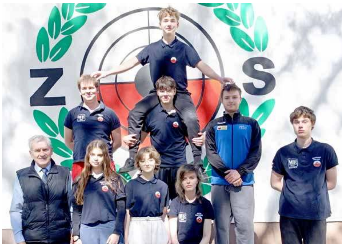
Zawodnicy LOK KSS TARCZA Goleniów z trenerem na Międzynarodowych Mistrzostwach Wybrzeża 2026 w Ustce 30.04-03.05.2026 r.